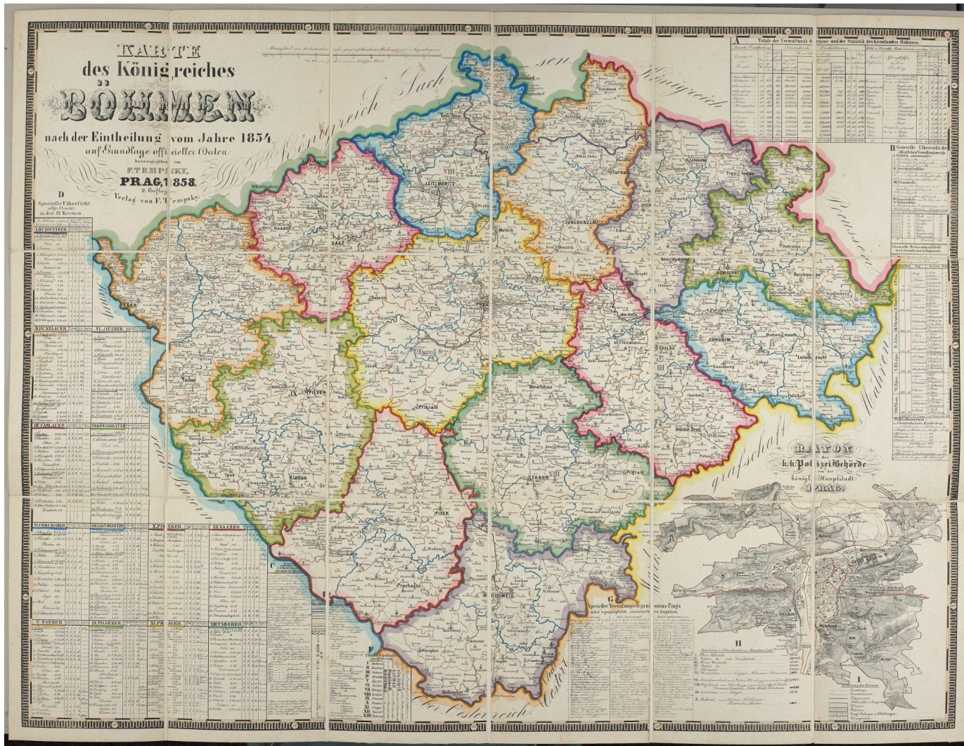
Obr. 2 – Mapa Království českého z roku 1858, která zachycuje stav členění krajů z roku 1854.