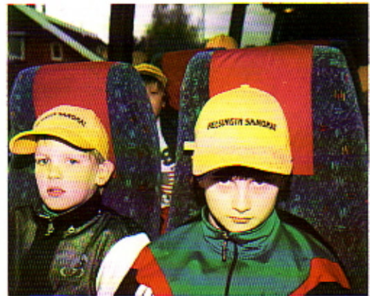
ja tänne on päästy. Jääkiekon MM-kisat Norjassa toukokuussa 99.