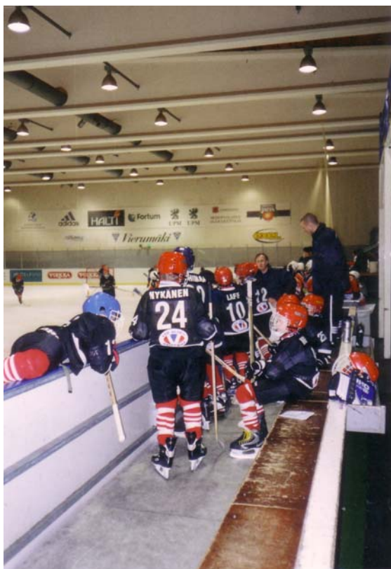
Obrázek č. 5 – The Icehearts ve Vierumäki