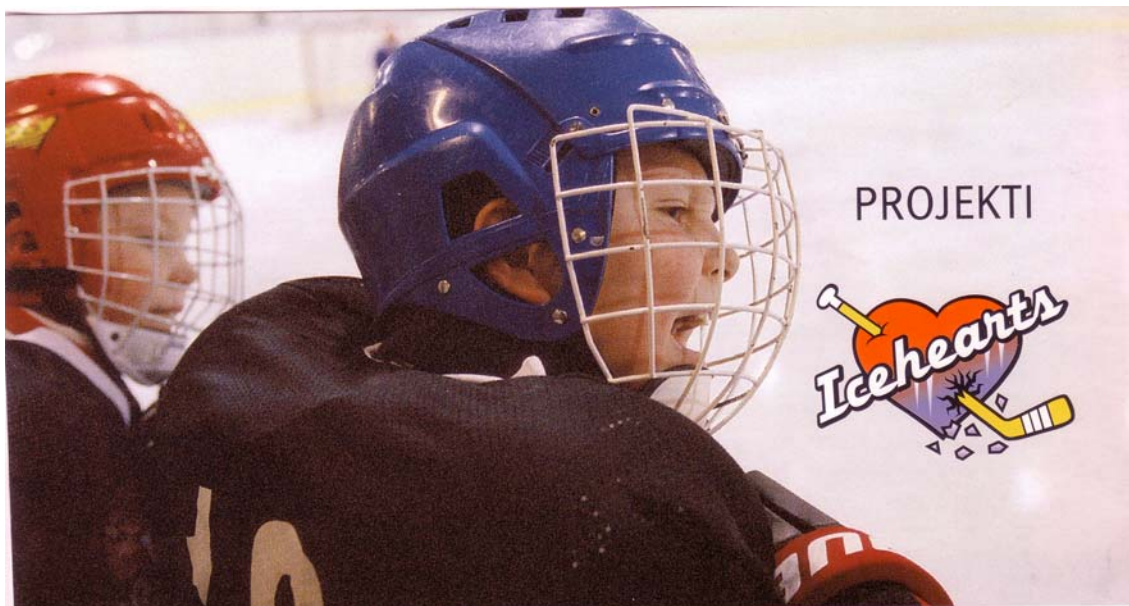
Obrázek č. 1.