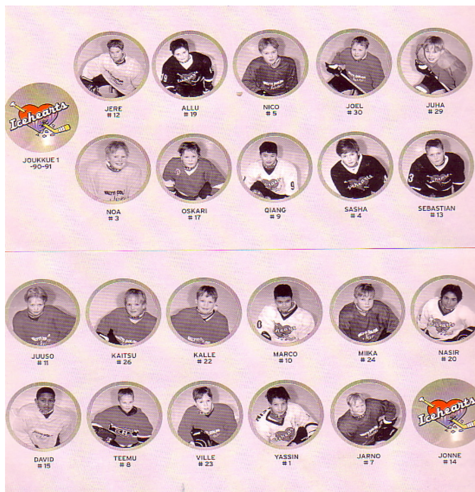
Obrázek č. 2.