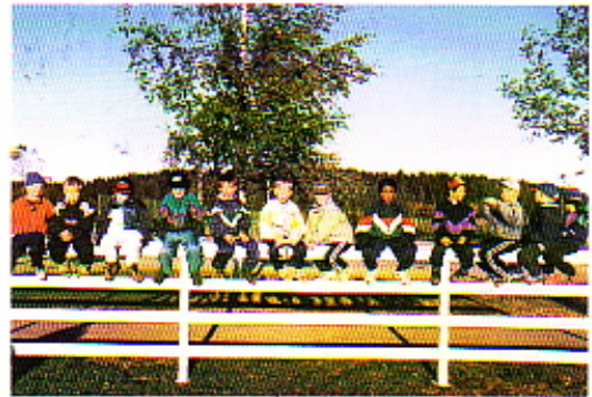
Tästä aloitettiin elokuussa 96