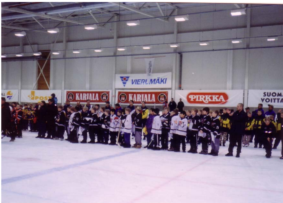
Obrázek č. 6 – The Icehearts ve Vierumäki