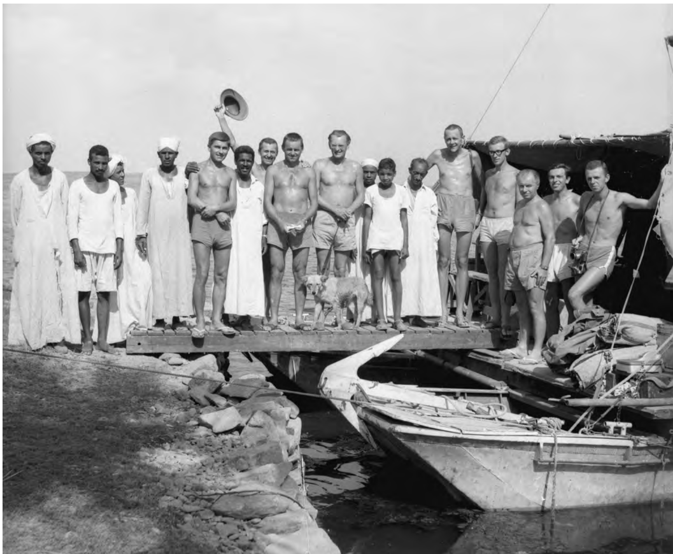
Obr. 1 Skupinové foto členů expedice Československého egyptologického ústavu do Nubie v roce 1964 pod vedením profesora Zbyňka Žáby (uprostřed s „expedičním“ psem) / Fig. 1 Group photo of the members of the expedition of the Czechoslovak Institute of Egyptology in Nubia in 1964, under the direction of professor Zbyněk Žába (in the middle, with the “expedition” dog)