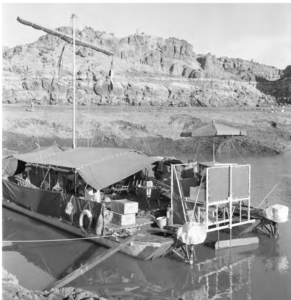
Obr. 4 Katamarán Sadiq en-Núba, „Přítel Núbie“, na expedici v roce 1961 / Fig. 4 Catamaran Sadiq en-Nuba, „Friend of Nubia“, during the 1961 expedition