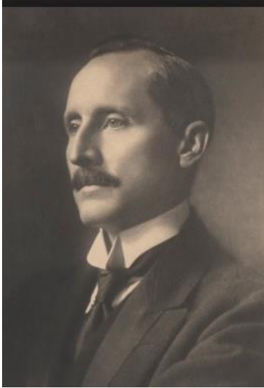
Rudolf Lodgman von Auen