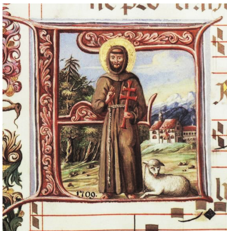
4. Sv. František z Assisi v iniciále F rukopisu Antiphonarium františkánské knihovny v Zásrukách (nyní deponováno v oddělení rukopisů a starých tisků Národní knihovny v Praze pod sign. MS. 2.).