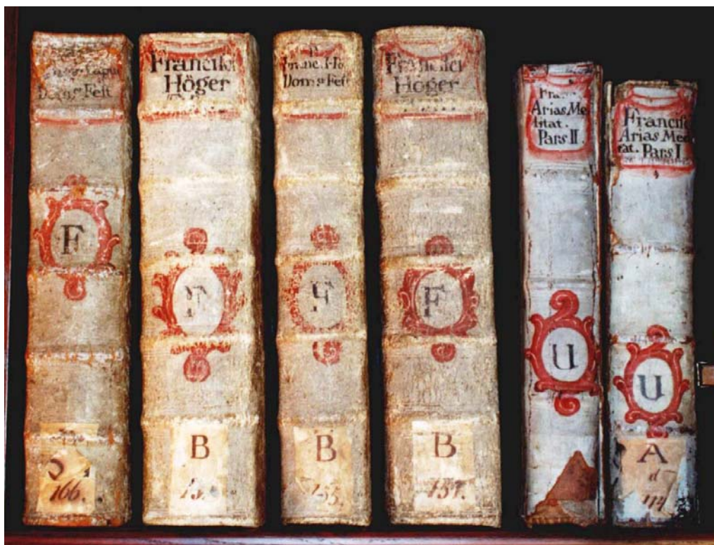
2. Hřbety knih z kolínské knihovny kapucínů s malovanými kartušemi (nyní deponováno v knihovně kapucínského kláštera Praha Hradčany).