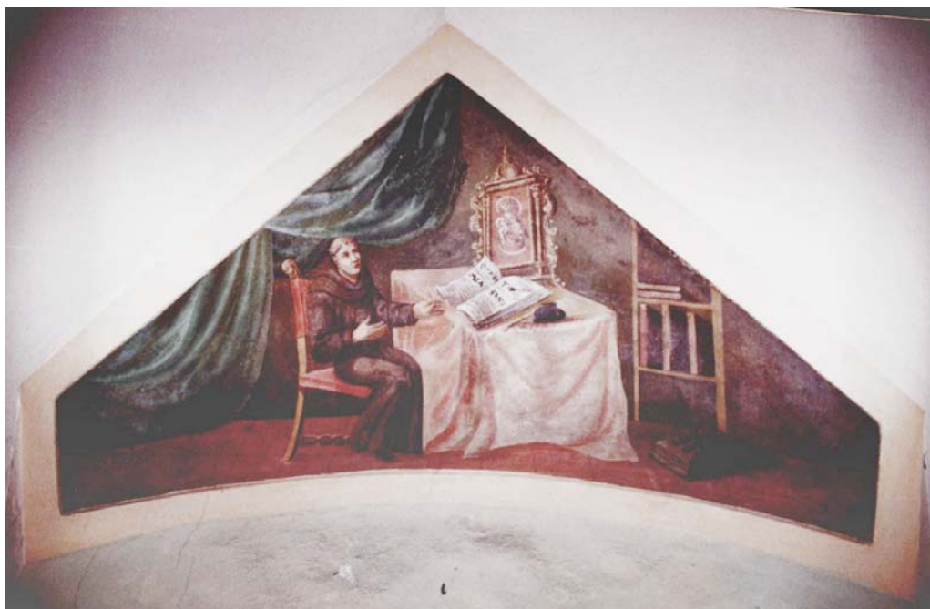
3. Jedna z lunet, které zdobí stěny františkánské knihovny v Zásrukách.