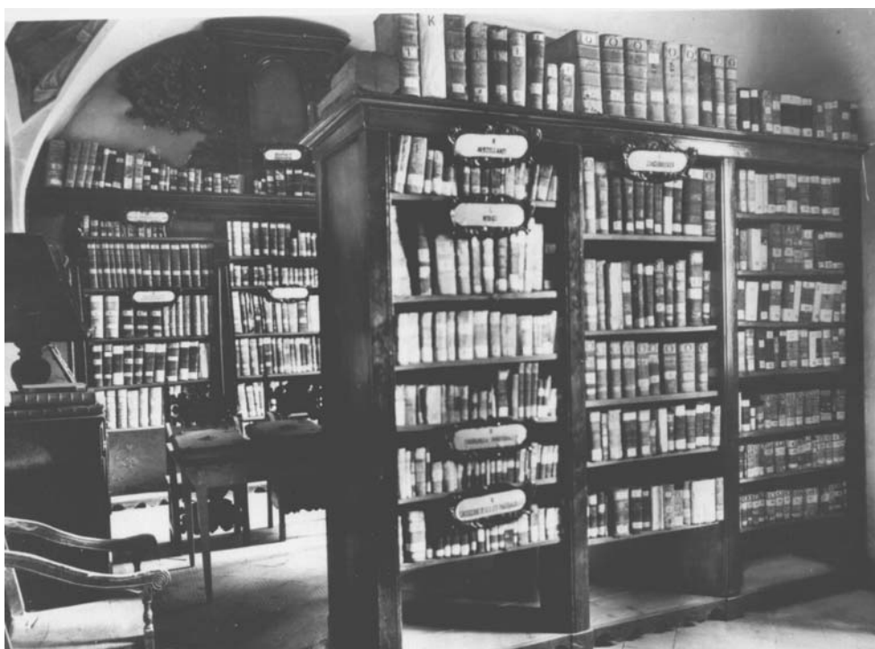
1. Pohled na starší část fondu františkánské knihovny v Zásmukách ve 30. letech 20. století.