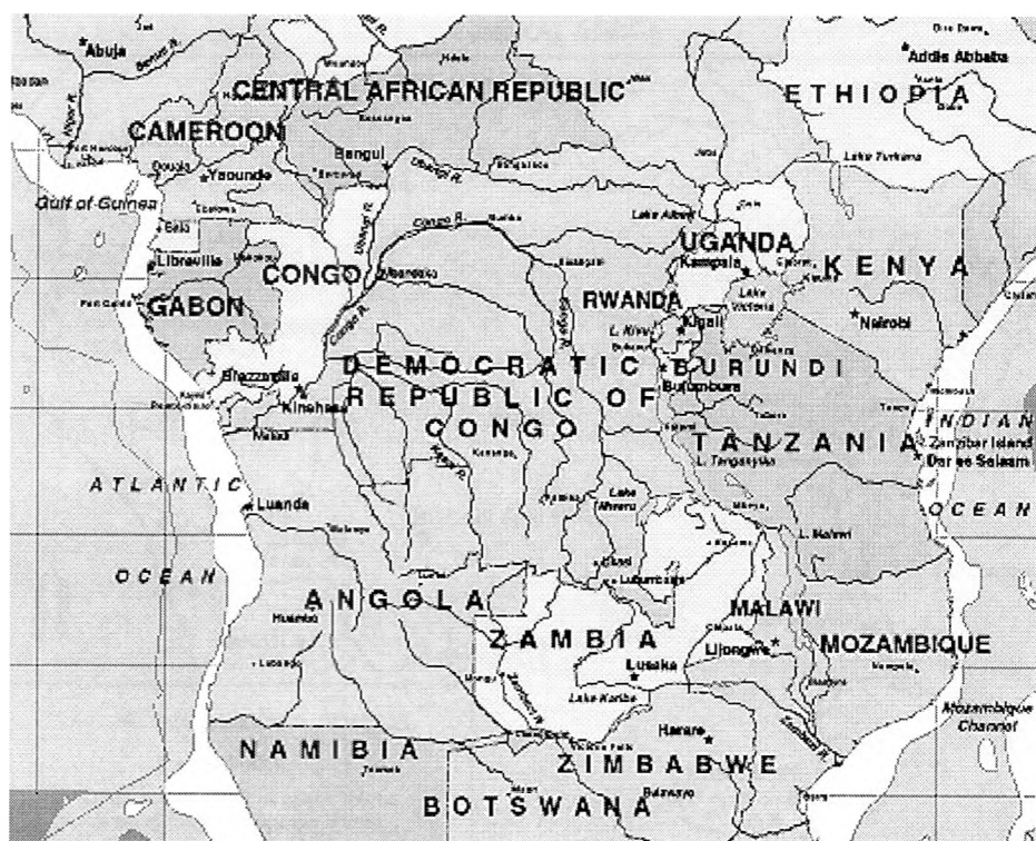
Mapa č. 2: Stredná Afrika