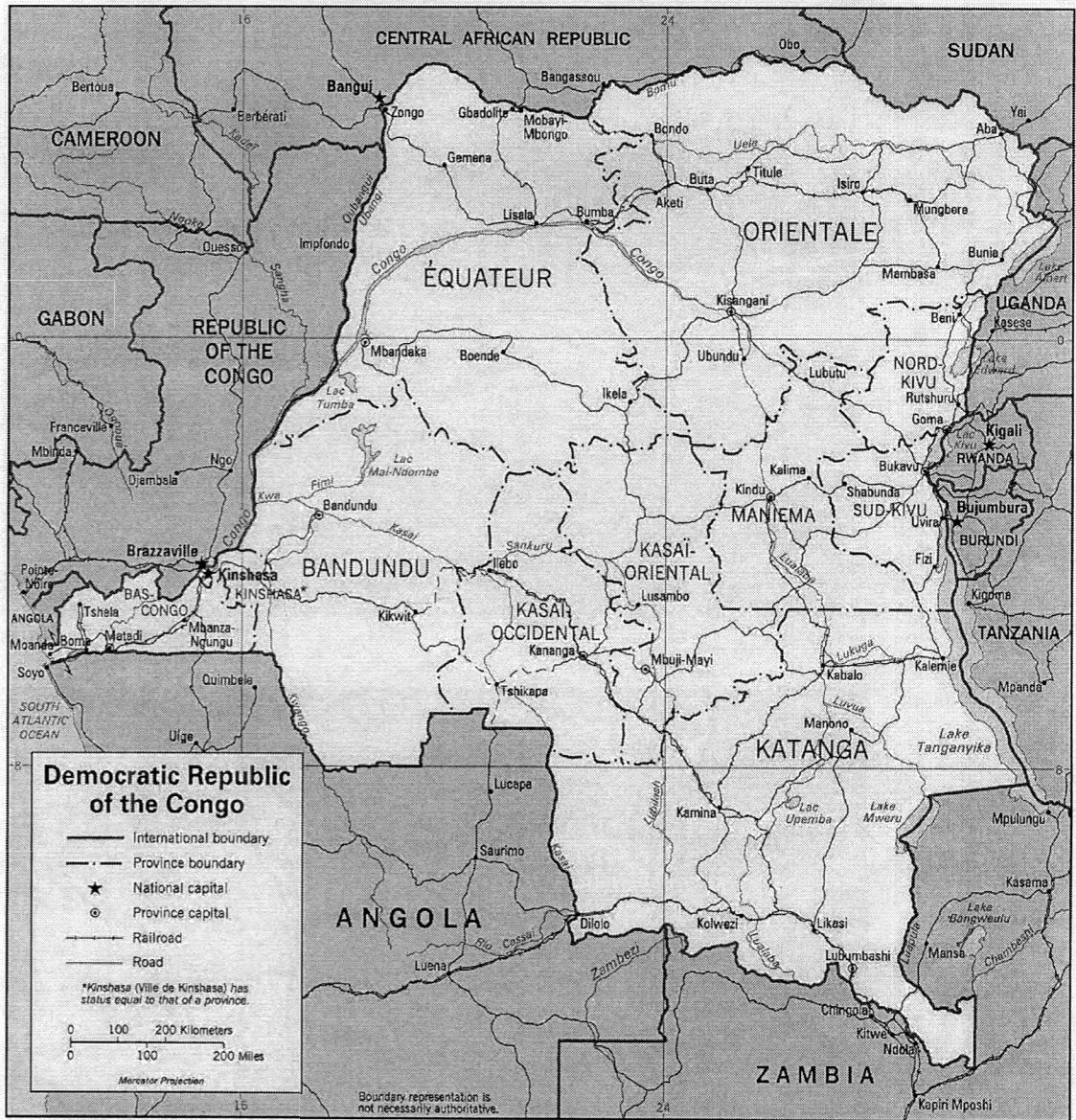
Mapa č.1: Konžská demokratická republika (Kongo–Kinshasa)