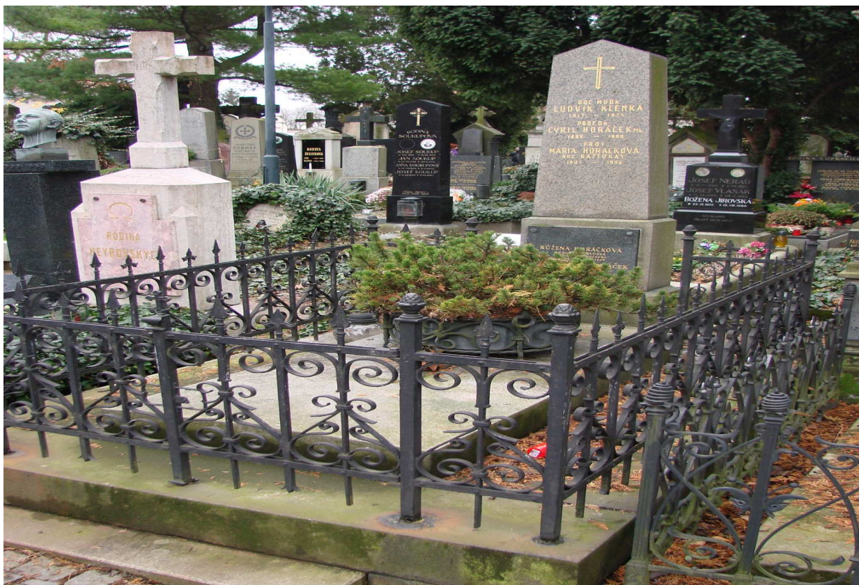
Obrázek č. 9