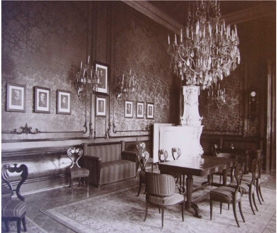
Obrázek č. 7