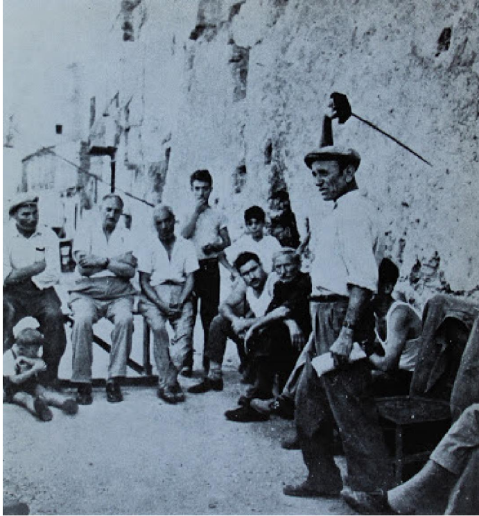
Contastorie, z: Pasqualino Antonio, L'opera dei pupi, Palermo, Sellerio, 1977