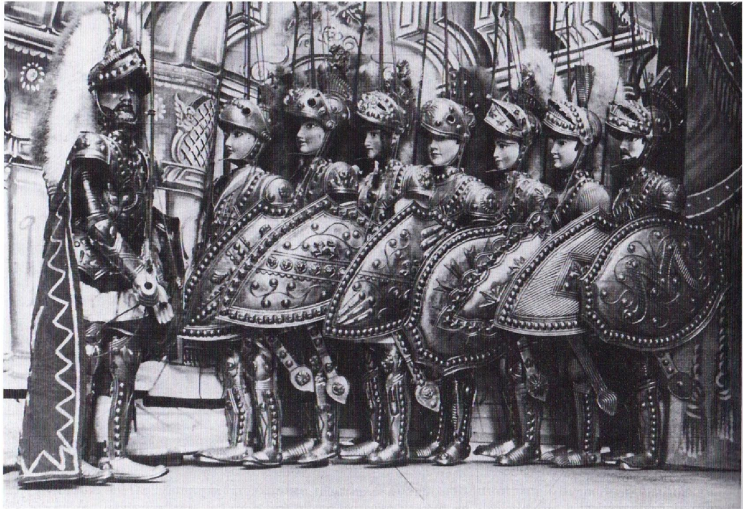
88 Consiglio cristiano. Pupi palermitani del teatro di Mimmo Cuticchio. Da sinistra verso destra: Carlomagno (di solito il sovrano sta invece a destra), Orlando, Rinaldo, Bradamante, Oliviero, Danese Uggieri, Astolfo, Gano di Maganza.

Slavnostní porada krále s jeho křesťanskými rytíři, z: Pasqualino Antonio, L'opera dei pupi , Palermo, Sellerio, 1977