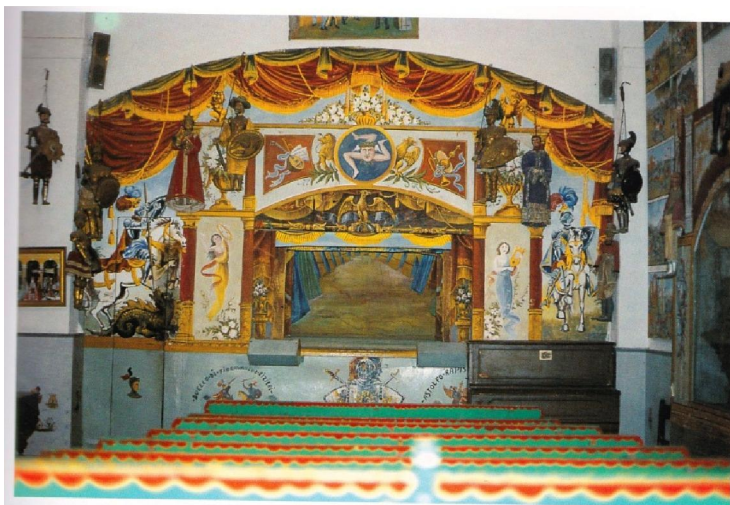
Tav. 2. - Un teatrino palermitano (Museo Etnografico Giuseppe Pittè - Palermo).

Klavírek používaný během představení, tzv. pianino a cilindro (obrázek nalevo, z: Giuliano Selima Gorgia, Sorgi Orietta, Vibaek Janne: Sul filo del racconto: Gaspare Canino e Natale Meli nelle collezioni del Museo internazionale delle marionette Antonio Pasqualino, Palermo, CRICD, 2011 ; obrázek napravo, z: Pasqualino Antonio, L'opera dei pupi, Palermo, Sellerio, 1977 )