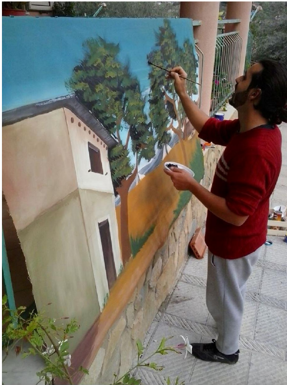
Tvorba scény