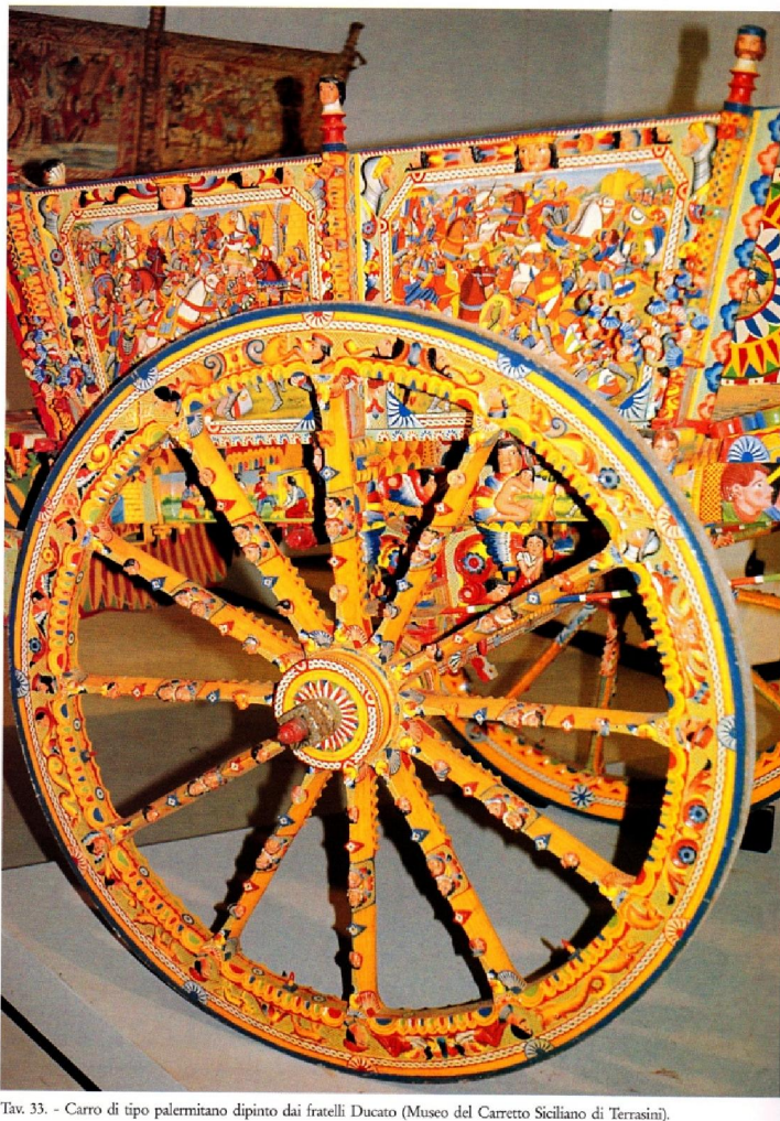
Tav. 33. - Carro di tipo palermitano dipinto dai fratelli Ducato (Museo del Carretto Siciliano di Terrasini).

http://www1.nital.it/uploads/ori/200905/gallery_4a171ae2c236f_CAR27341.JPG