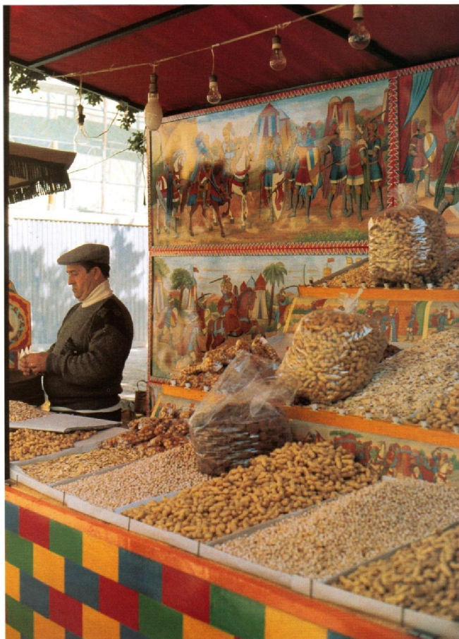
Tav. 37. - Banco di sezzarzo decorato con motivi cavallereschi (Terrasini).