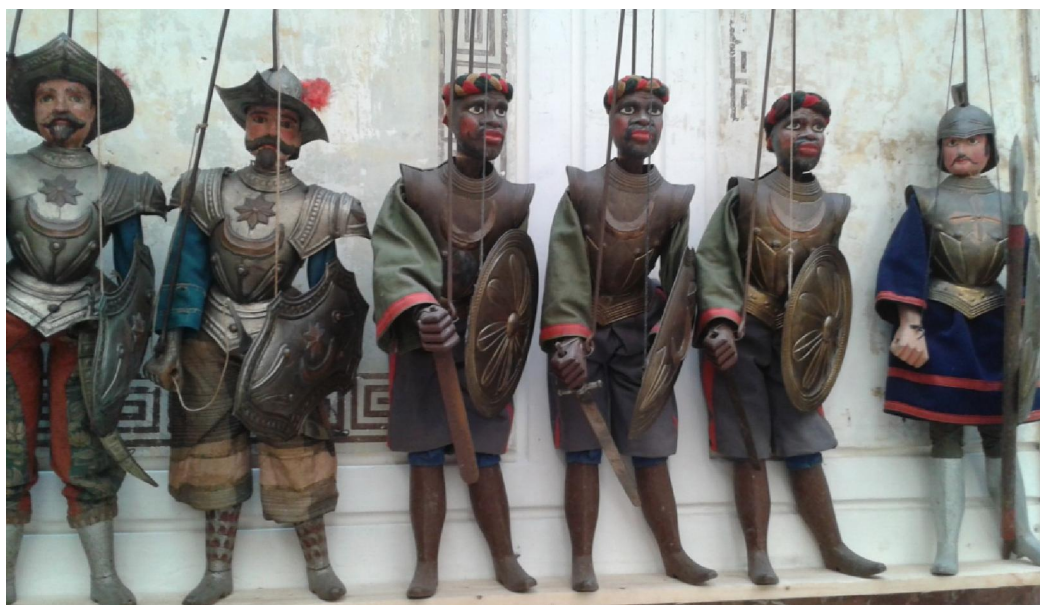
Loutky saracénských rytířů v palermském muzeu loutek