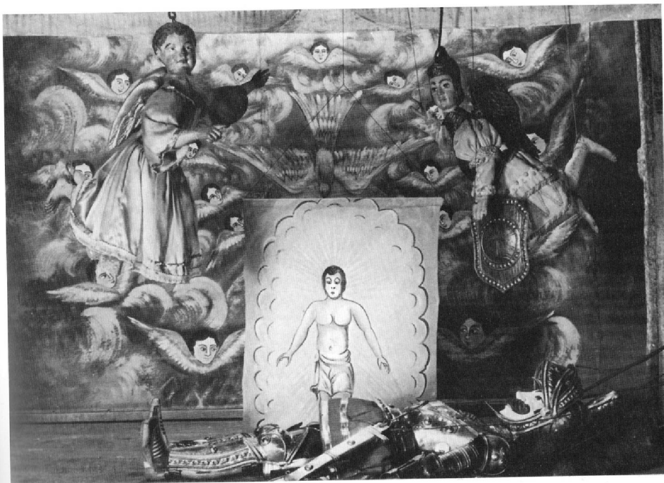
97 Gli angeli portano in paradiso l'anima di un cavaliere, rappresentata in forma di piccolo uomo nudo in un cartelluzzo . Pupi palermitani. Scena e cartelluzzo dipinti da Salerno.

Slavnostní porada krále s jeho křesťanskými rytíři, z: Pasqualino Antonio, L'opera dei pupi , Palermo, Sellerio, 1977