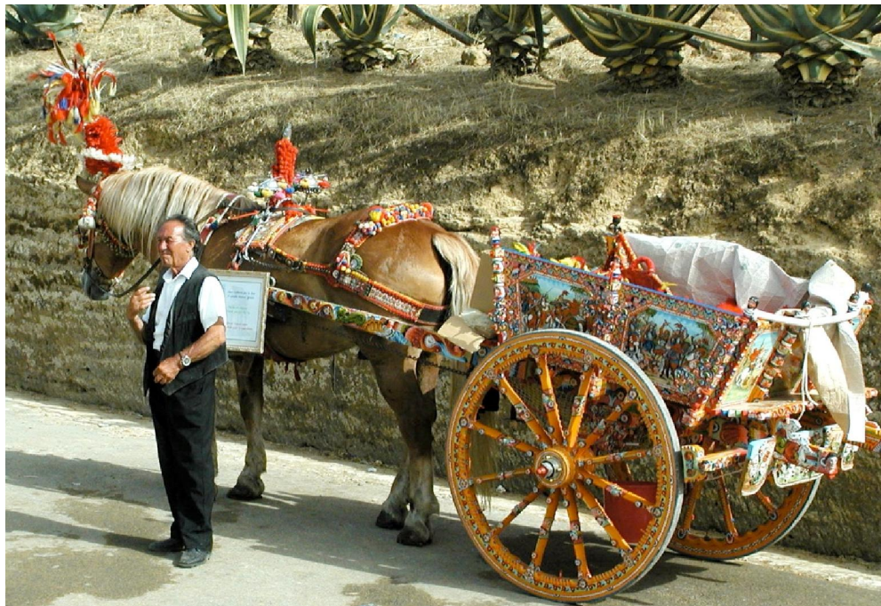
Carretto siciliano s koněm, z:

https://upload.wikimedia.org/wikipedia/it/c/c3/Carretto_siciliano_particol.jpg