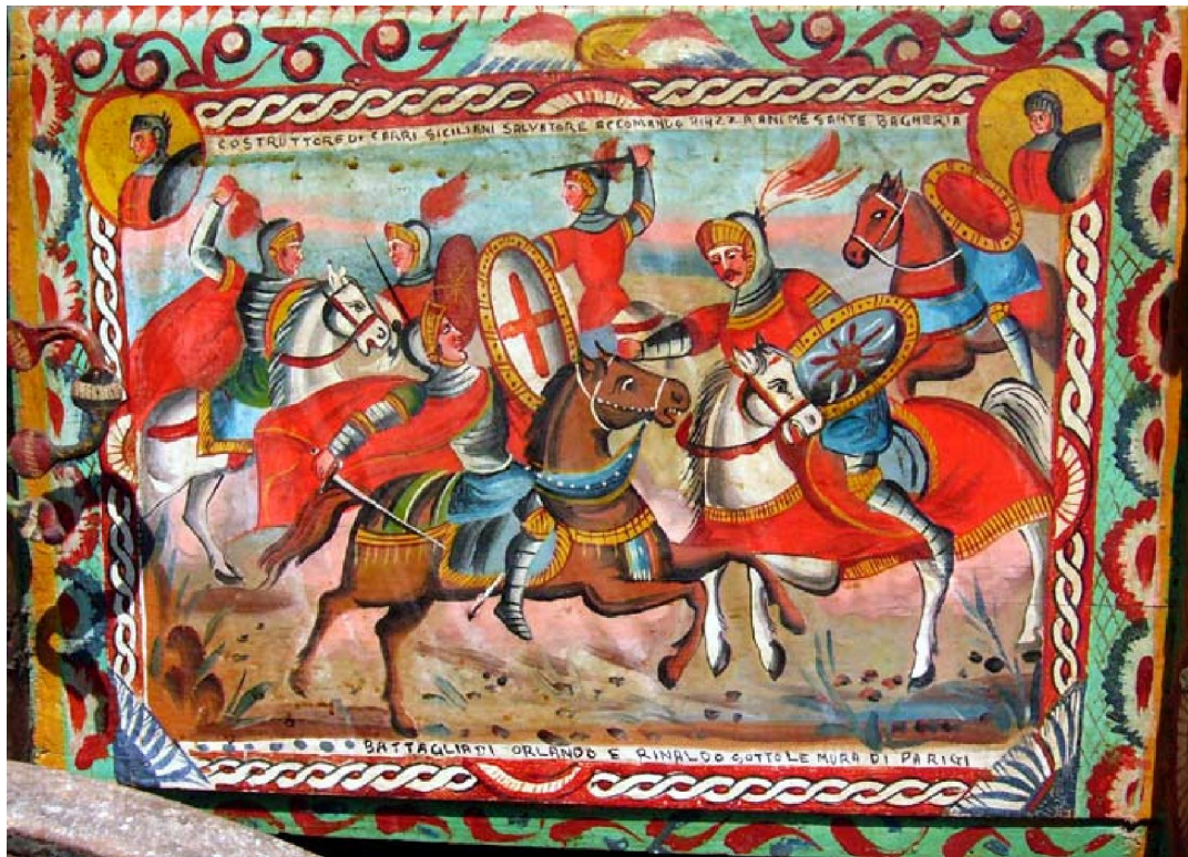
Carretto siciliano , detail