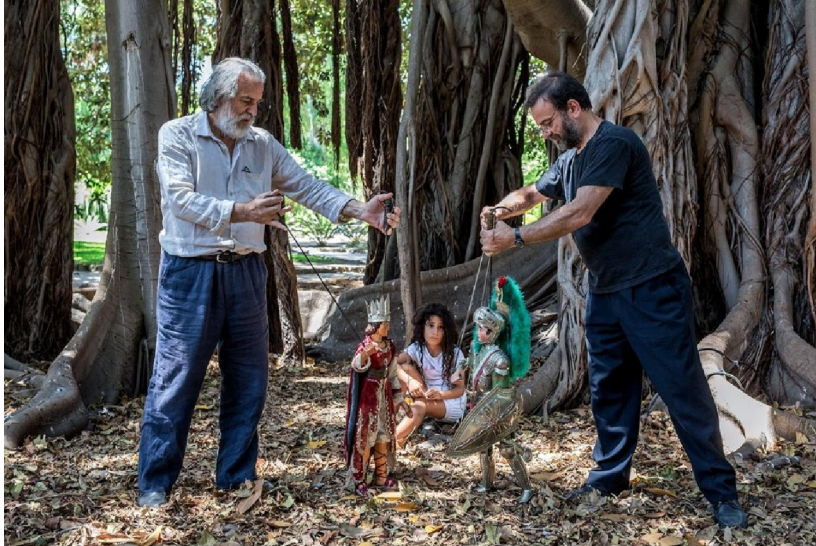
Mimmo Cuticchio – ovládání loutek, z:

http://www.sicilymag.it/images/9cf11a6d6a617f38f4f6c7a8b9b7a4fd885.jpg