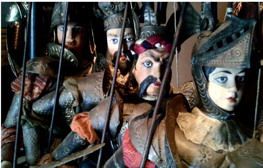
Loutky rytířů v palermském muzeu loutek