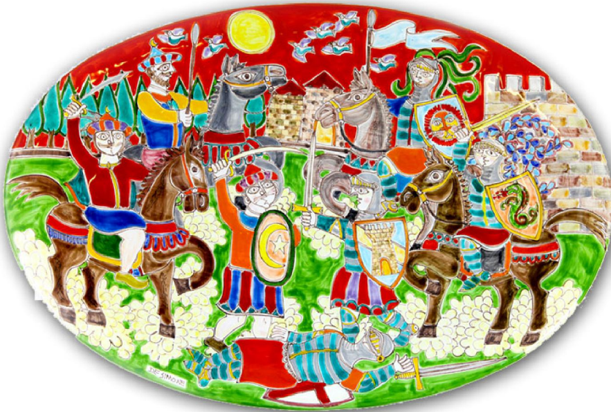
Keramika „De Simone“