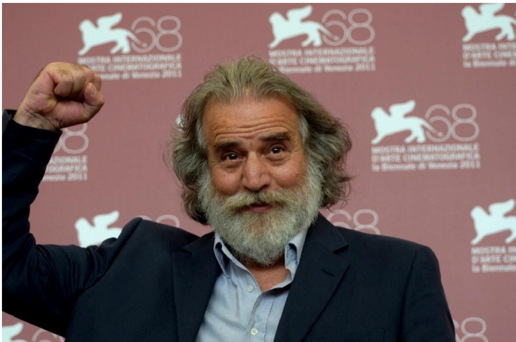
Mimmo Cuticchio, z: http://www.restoalsud.it/wp-content/uploads/2013/07/cuticchio.jpg

http://www.pmocard.it/img/work/circuito/15/Teatro dei Pupi Cuticchio 258779903.jpg