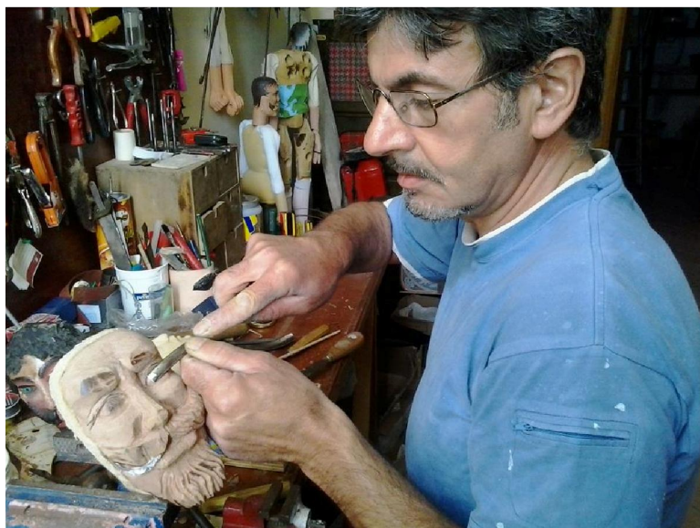
Tvorba loutky