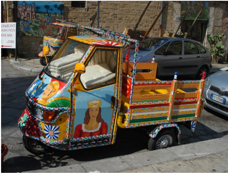
Dekorovaná dodávka, tzv. ape