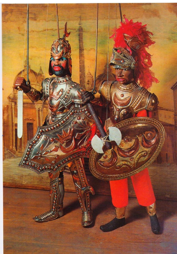
Loutky saracénských rytířů (obrázek nalevo: vlastní fotoarchiv, obrázek napravo z: Pasqualino Antonio, L'opera dei pupi, Palermo, Sellerio, 1977)