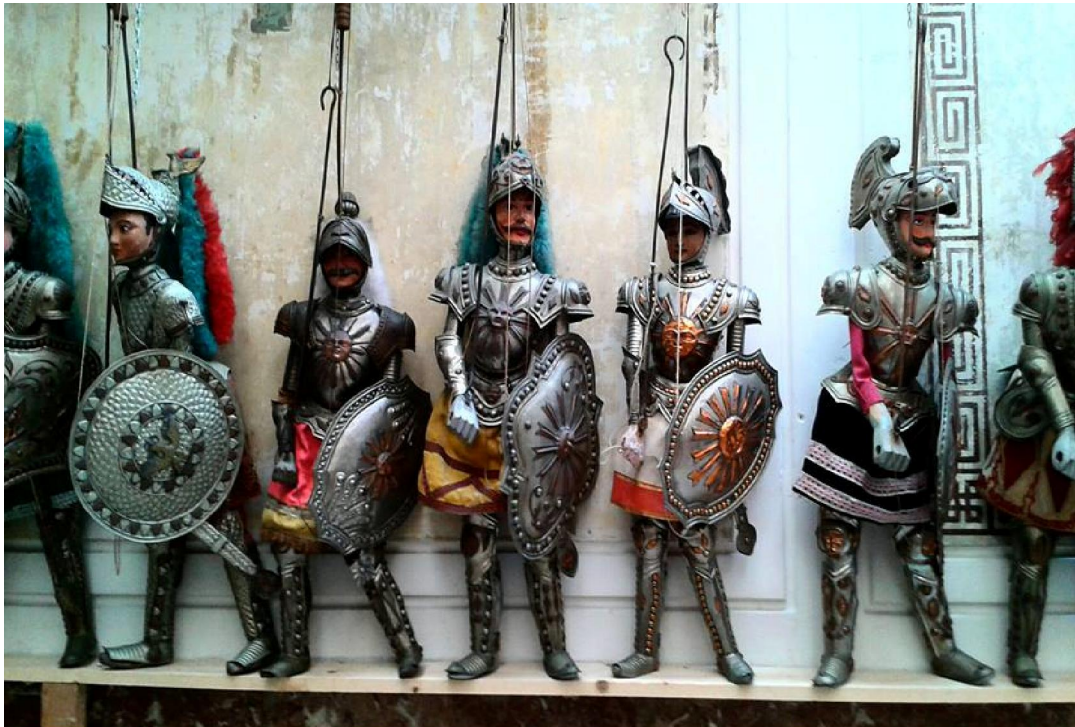
Loutky křesťanských rytířů v palermském muzeu loutek