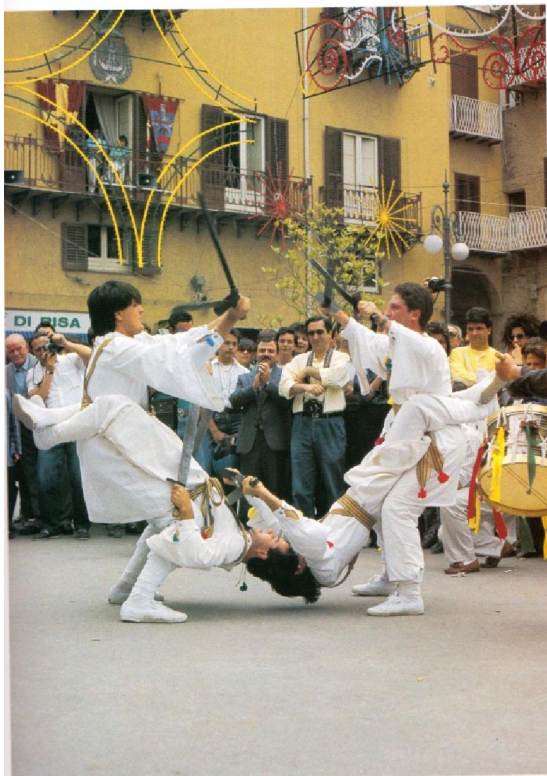
Tav. 3. - Una danza armata: la festa del Tarantà a Castelermi (AG).