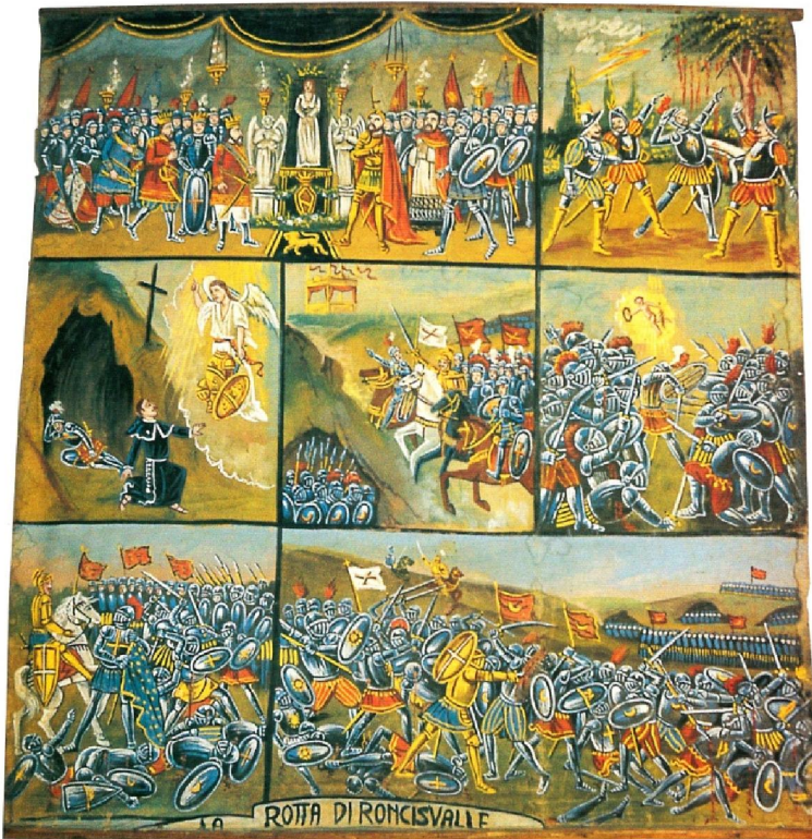
Tav. 12. - Cartellone palermitano C (D1255 Museo Internazionale delle Marionette "Antonio Pasqualino", Palermo).