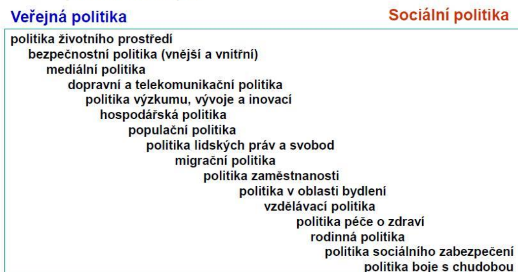
Tabulka: Diapazony zájmových polí veřejné politiky a sociální politiky jako vědních disciplín

Základní příjem je svým způsobem součástí kategorie grantů a podpor, to ale neplatí naprosto, jelikož zavedením základního příjmu by se rušilo mnoho jiných dosavadních podpor. Krom toho by měl být základní příjem trvalý a univerzální, čímž by tuto kategorii značně překročil. Stáva-