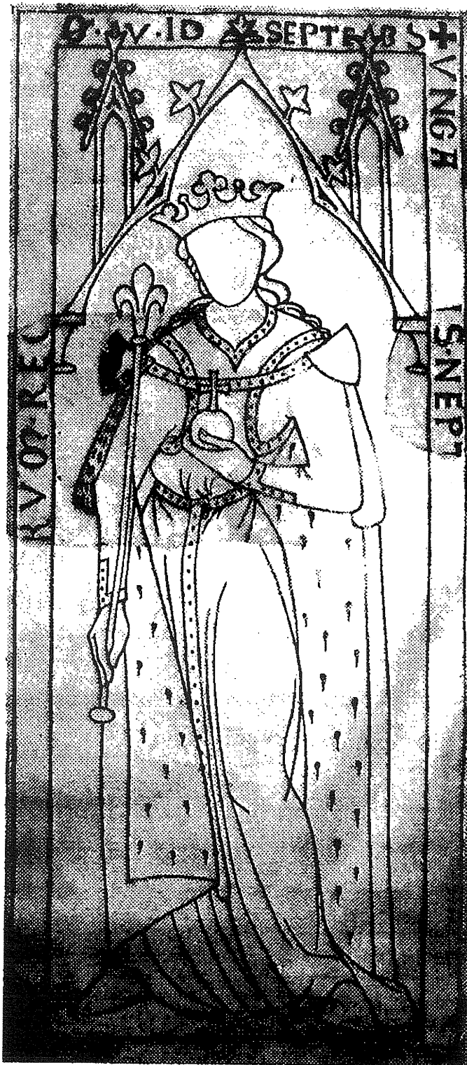
obr. č. 5