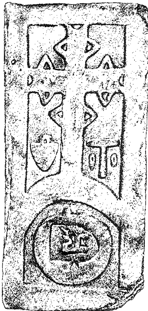
obr. č. 14