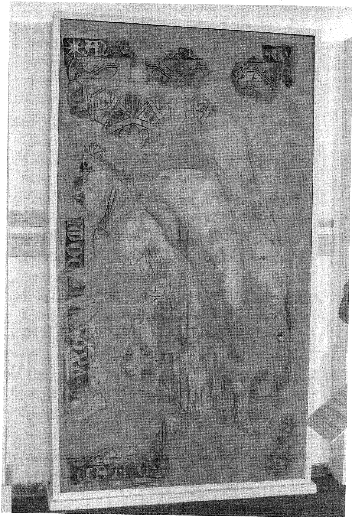
obr. č. 10