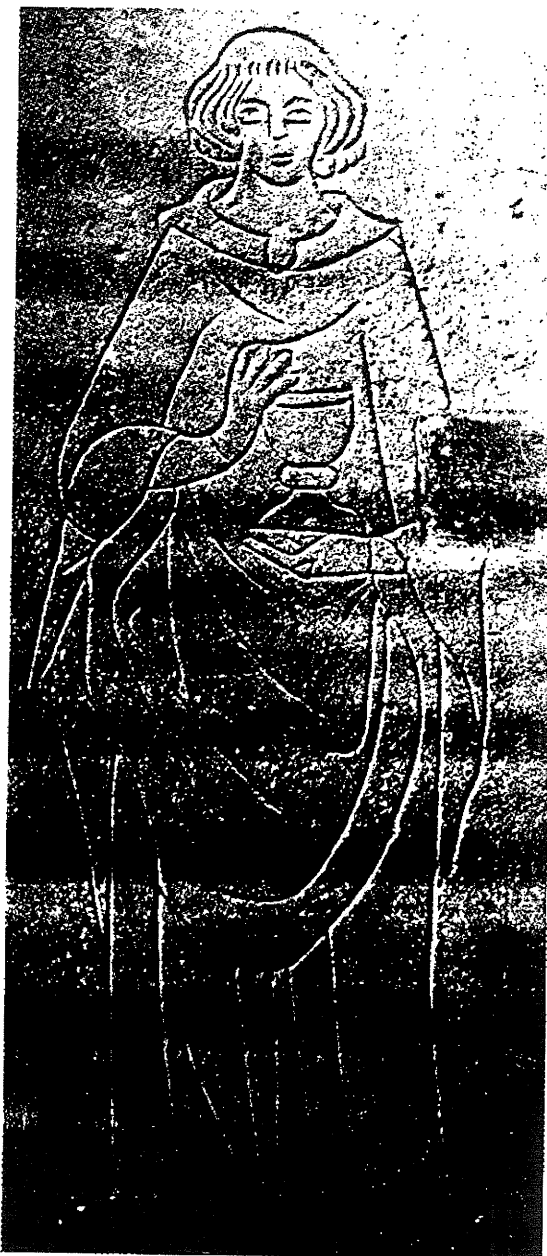
obr. č. 9