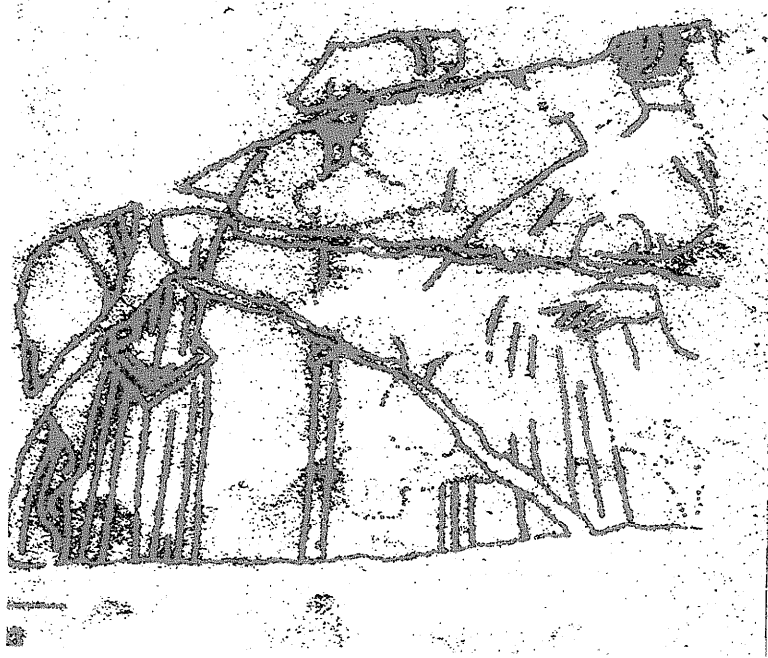
obr. č. 12