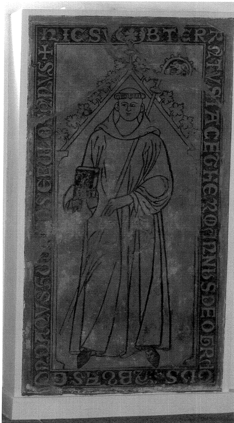
obr. č. 6