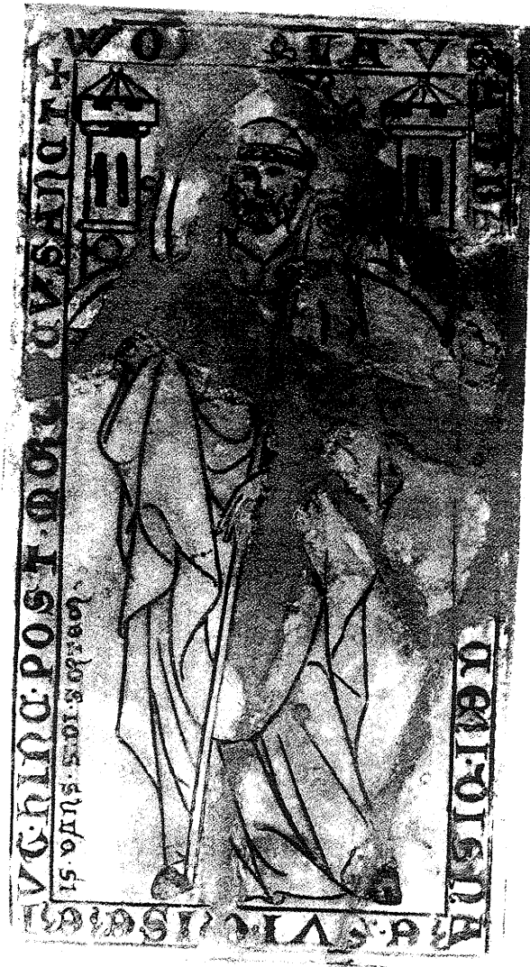
obr. č. 7