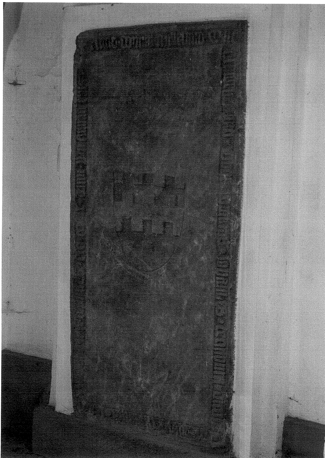
obr. č. 2