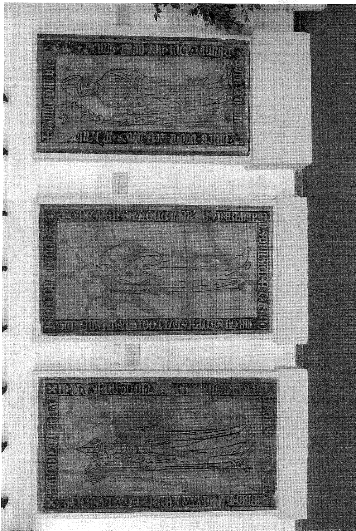
obr. č. 8

zleva n. opata Bohuslav, opata Diviš, opata Jana Podnavce