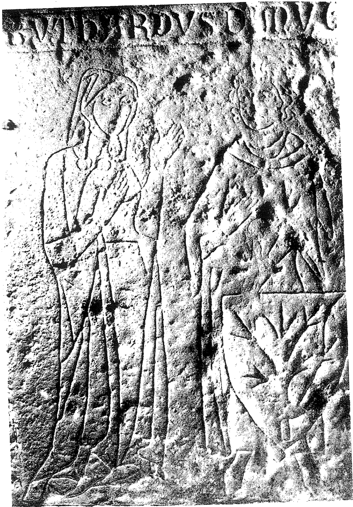
obr. č. 11