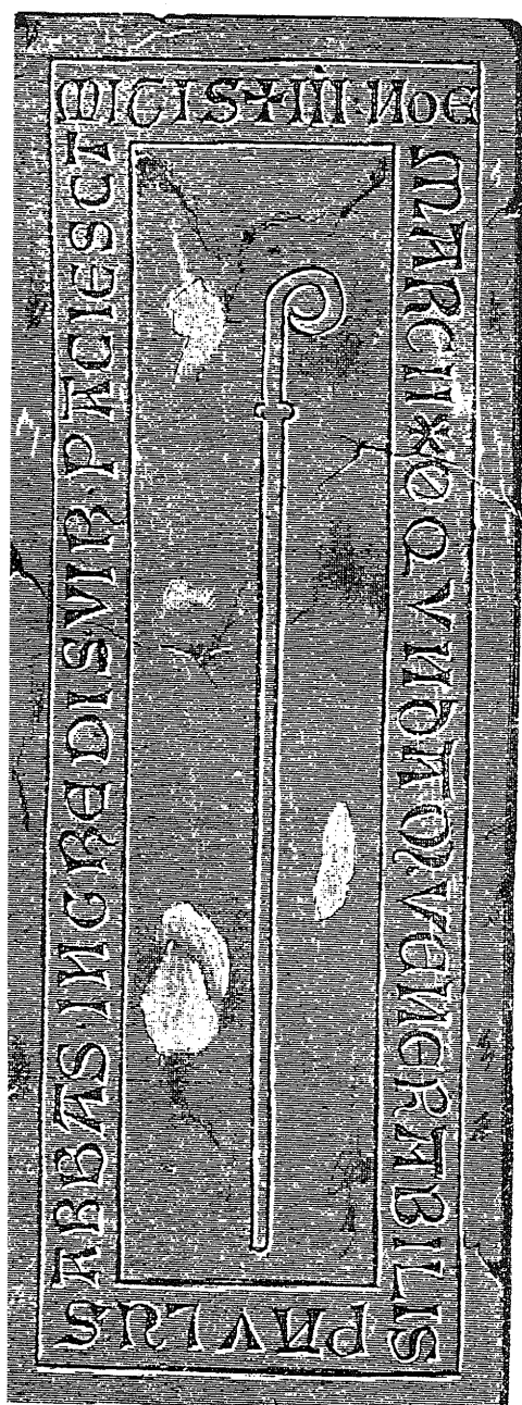
obr. č. 3