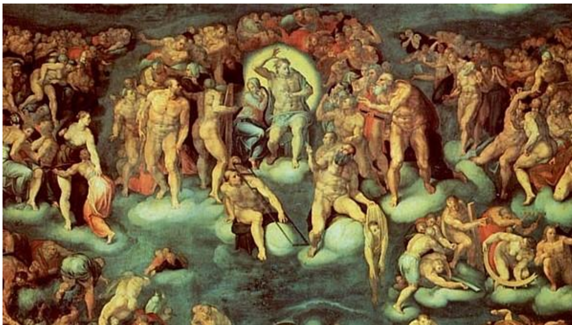
Obrázek 1 Poslední soud