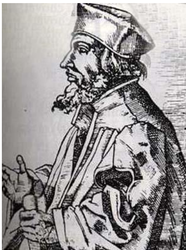
Obrázek 6 Mistr Jan Hus (zdroj 187 )

Nejslavnější dílo De ecclesia (O církvi) napsal roku 1413 dva roky před tím, než jeho život skončil na kostnické hranici.