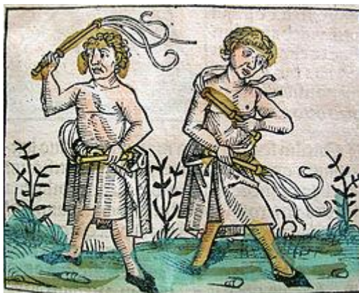
Obrázek 5 Flagelanti (zdroj 100 )

šlechtě, tím širší a hlasitější byla odezva na reformní podněty v kruzích laických.“ 99