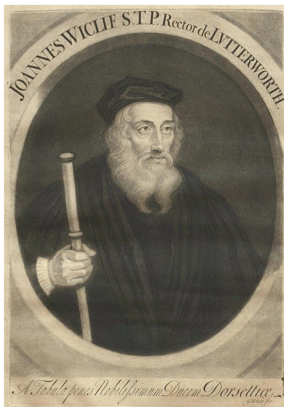
Obrázek 4 Jan Viklef (zdroj 85 )

Stanislavovi ze Znojma a to především prostřednictvím spisu De Antichristo . 84