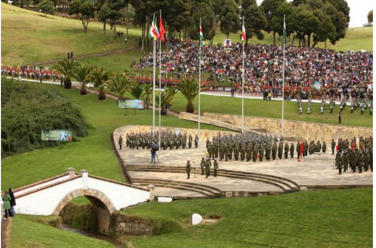
Obrázok . 1

Puente de Boyacá a Plaza de las banderas, národný pamätník nachádzajúci sa v Tunje, hlavnom meste departamentu Boyacá. Pripomína 7. august 1819, keď bolo španielske vojsko porazené jednotkami Simóna Bolívara. 1