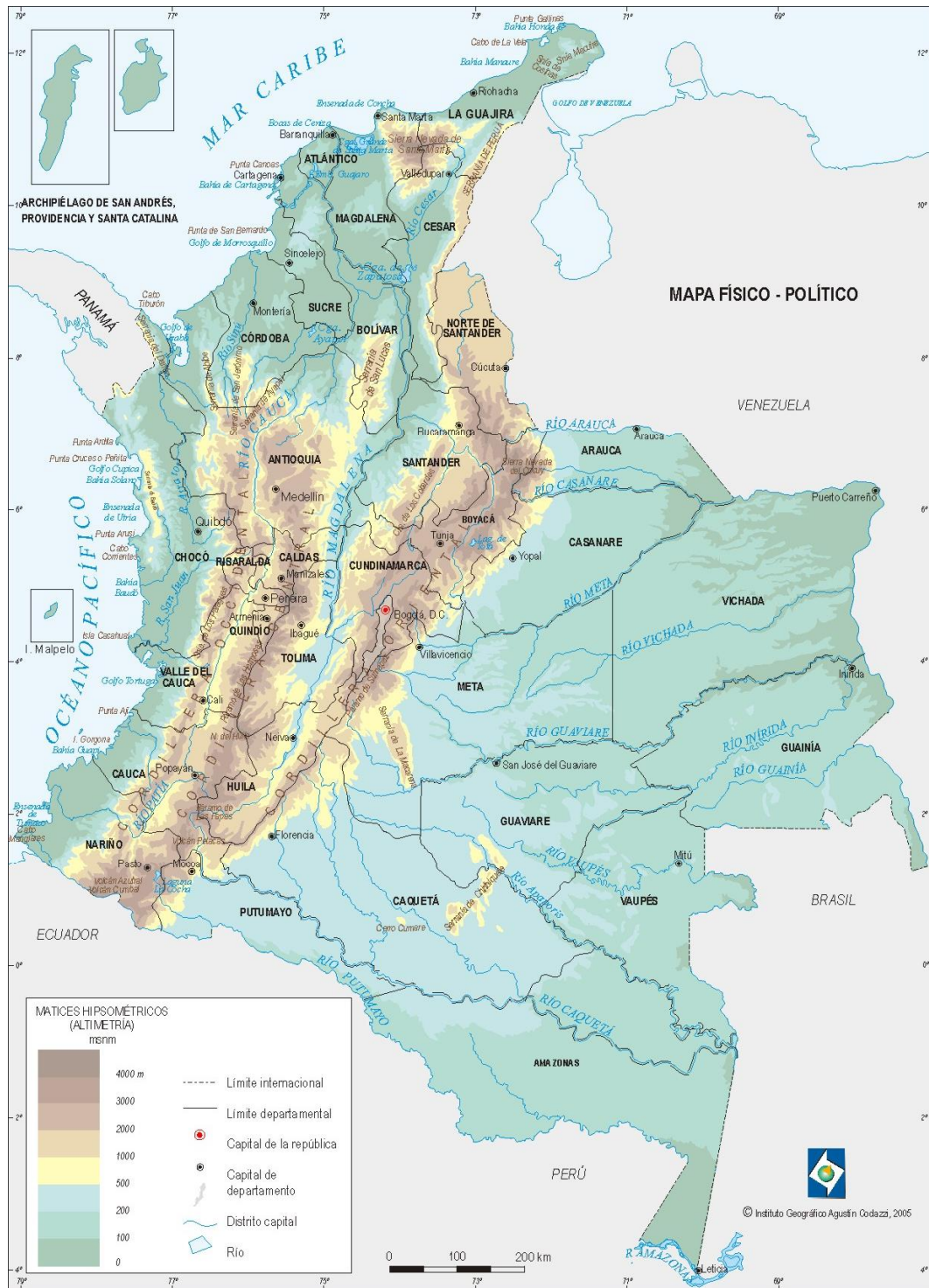
Fyzická mapa tridsiatich dvoch kolumbijských departamentov 2