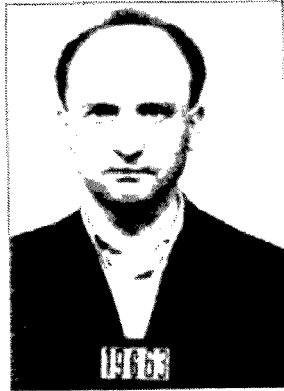
Josef Beran (29.12. 1888 – 17.5. 1969)