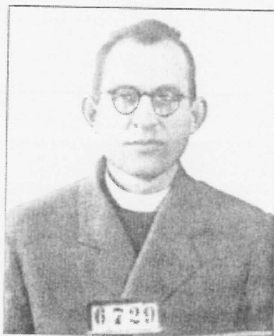
František Tomášek (30.6. 1899 – 4.8. 1992)