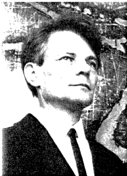
Josef Hlouch (26.3. 1902 – 10.6. 1972)