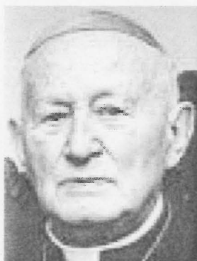
Štěpán Trochta (26.3. 1905 – 6.4. 1974)