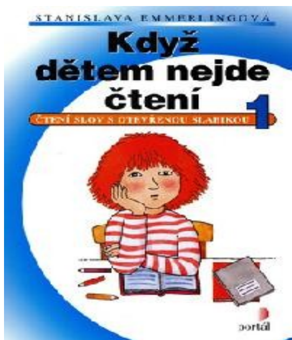
Speciální reedukační učebnice a pracovní sešity.