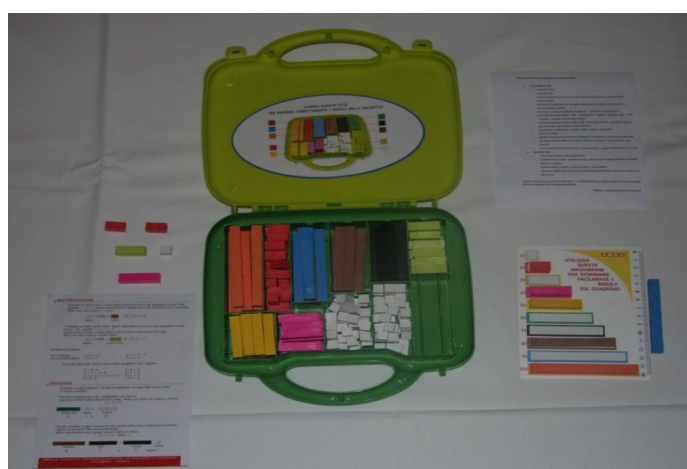
Hranoly pro reedukaci dyskalkulie. 1