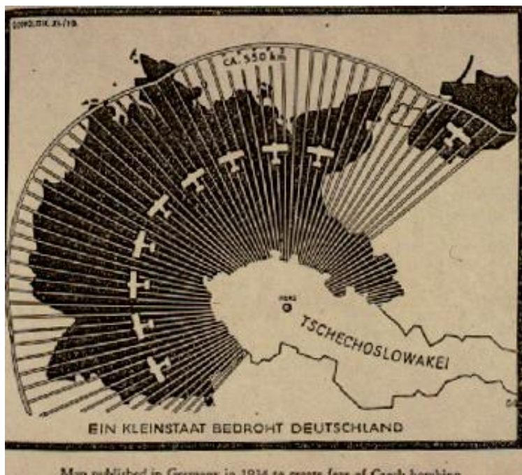
Obrázek 2 - Nacistická propaganda vůči Československu