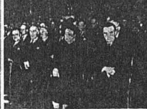
Průběh na čestném pohřbu dr. Edvarda Beneše