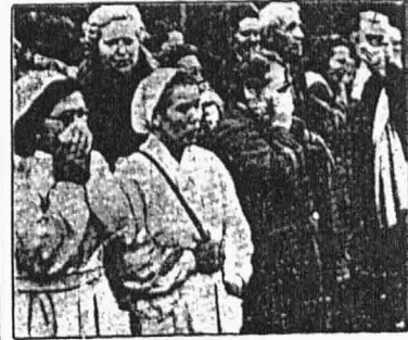
Lid na ulicích se neubránil dojatí