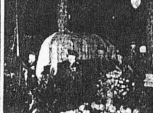
Průběh na čestném pohřbu dr. Edvarda Beneše