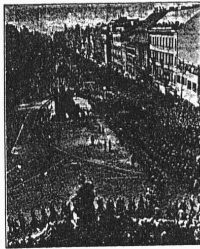
Pohřební průvod na Václavském náměstí