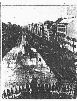
Průběh na čestném pohřbu dr. Edvarda Beneše