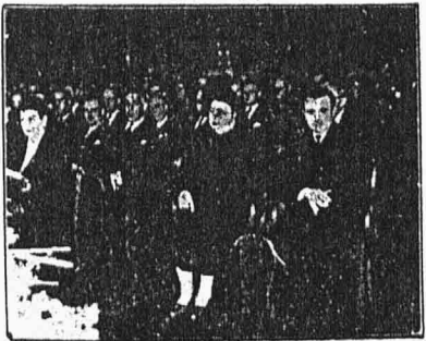
President republiky Kl. Gottwald a chotí

schodiště Pantheonu tonulo v moři věnců, z nichž v prvním patře upojal obrovský věnec velvyslancev SSSR v Praze. V síni Pantheonu, posvěcené ve smuteční tiché, shromážděval se dlouho před začátkem pohřebního obřadu smuteční hosté. Od černého pozadí arkády v čele síně se odrážely jasné barvy státní vlajky, do níž byla zabíjena rakve, spočívající mezi dvěma mramorovými sloupy na vysokém černém katafalku. Pod ní svítilo moře květů, věnců, mezi nimi uprostřed velkého věnce presidenta republiky Klementa Gottwaldka. Nad rakvi vysokou až ke kupoli se vinula obrovská státní vlajka na černém podkladě a od světla skleněné kupole splyval černý koronový útvar. Po stranách katafalku stáli pedelové v historických krojích s insigniemi.