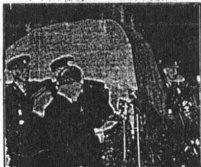
Předseda vlády mluví u katafalku