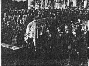
Průběh na čestném pohřbu dr. Edvarda Beneše