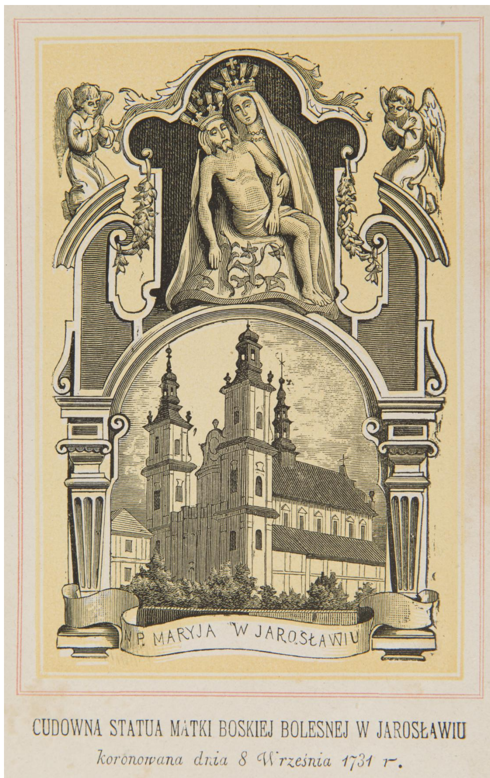
32. Matka Boży Bolestná Jaroslawská , sbírka devoční grafiky Fundacji XX. Czartoryskich Krakow, sign. XV-R. 8330