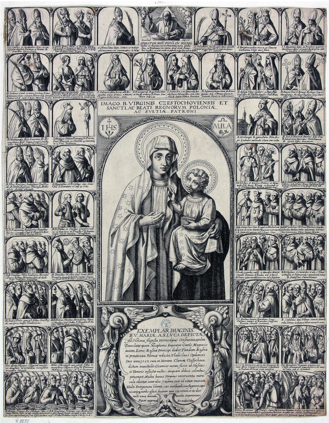
13. Matka Boží Czestochowska se světci, sbírka devoční grafiky Fundacej XX. Czartoryskich Krakow, sign. XV-R. 3777