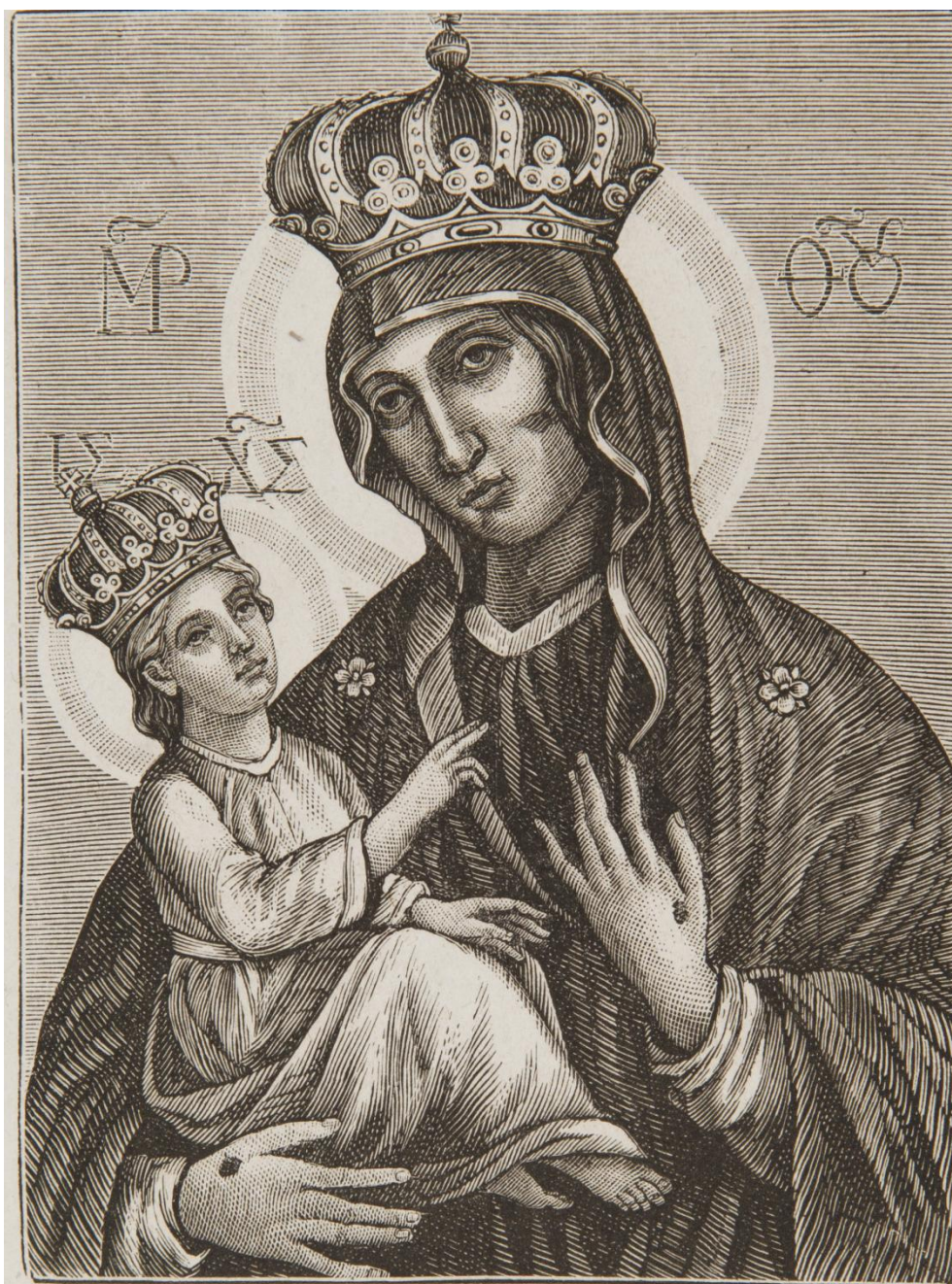
Cudowny Obraz Matki Boskiej Chełmskiej.

29. Matka Boża Chelmská , sbírka devoční grafiky Fundacji XX. Czartoryskich Krakow, sign. XV-R. 3990