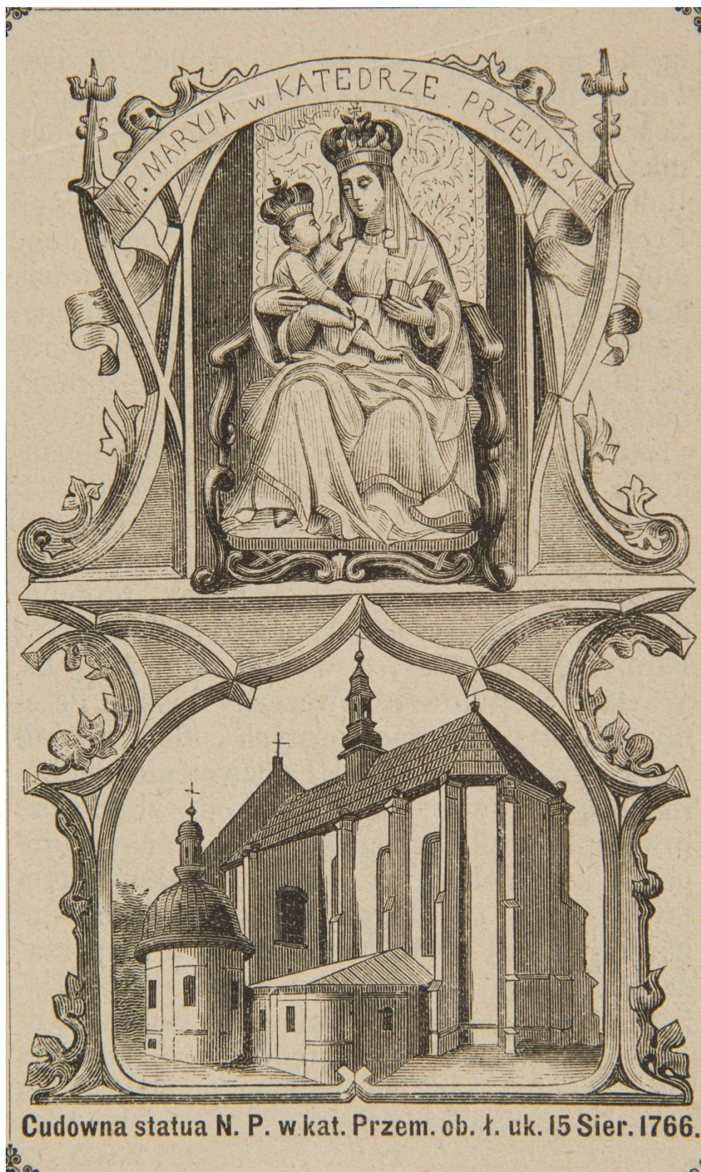
34. Zázračná soška Matky Boží Jackové z Przemysle, sbírka devoční grafiky Fundacji XX. Czartoryskich Krakow, sign. XV-R. 8439