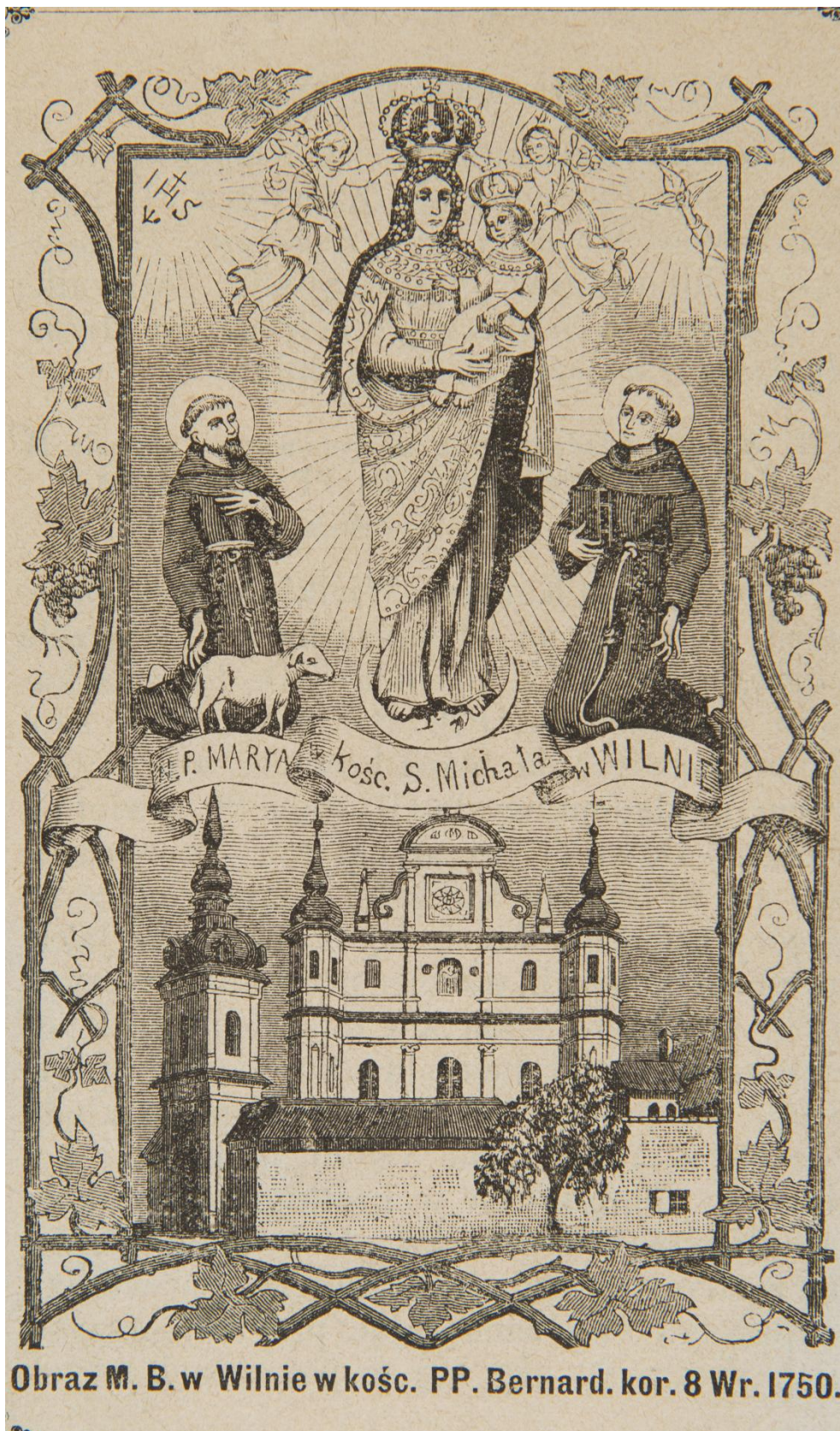
Obraz M. B. w Wilnie w kośc. PP. Bernard. kor. 8 Wr. 1750.