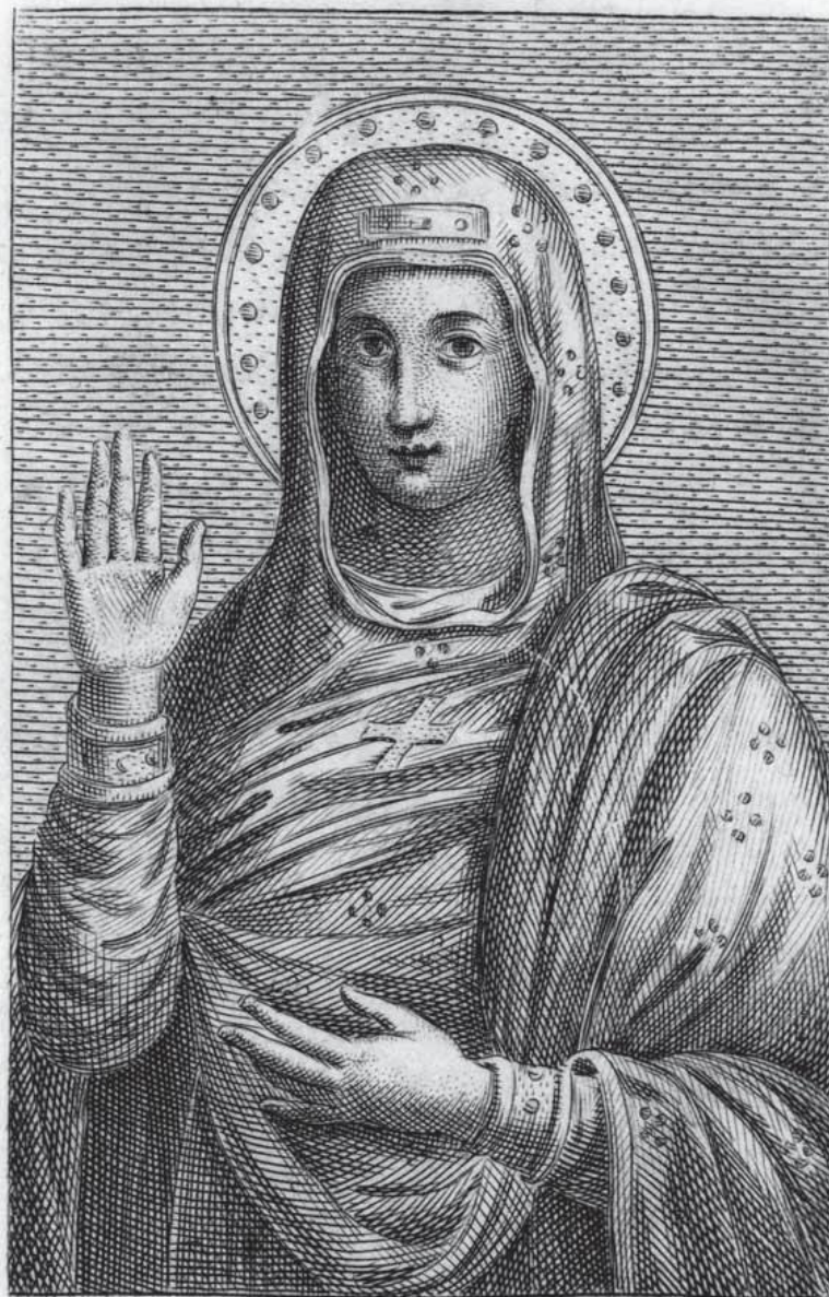
Bombelli inc. Roma 1792. La Madonna del Araceli in Tavola Alta Pal. 5. Lar. 4. Coronata dal Primo Capitolo di S. Pietro in Vaticano nel 1686.

5. Madonna del Aracoeli , Pietro Bombelli 1792, mědiryt na papěře, Biblioteca Apostolica Vaticana, Stamp Arch. Cap. S. Pietro. 435, II. f. 75.