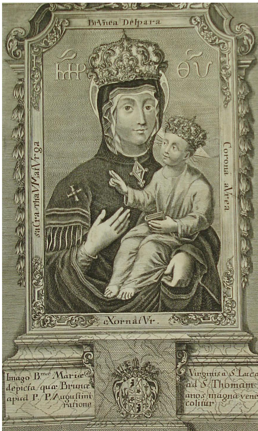
16. Madona Svatotomášská , mědiryt na papíře 150 x 100 mm, I. Zeidler 1736, sbírka devoční grafiky, Strahovský klášter Praha, sign. GS 8.