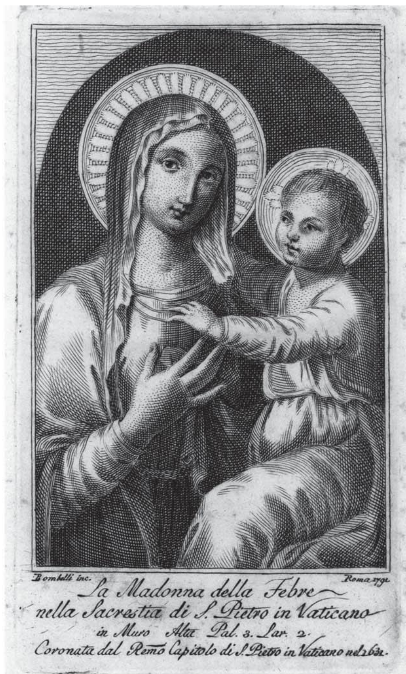
1. Madonna della Febbre , Pietro Bombelli 1792, mědiryt na papíře, Biblioteca Apostolica Vaticana, Stamp Arch. Cap. S. Pietro. 435, I. f. 1.