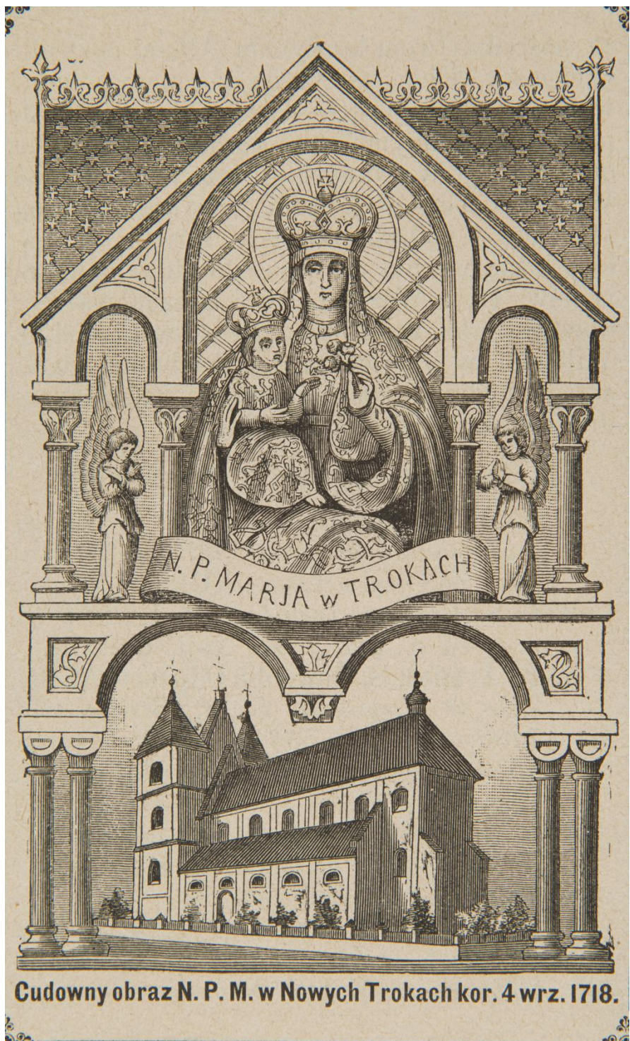
28. Matka Boży Trocká , sbírka devoční grafiky Fundacji XX. Czartoryskich Krakow, sign. XV-R. 8473