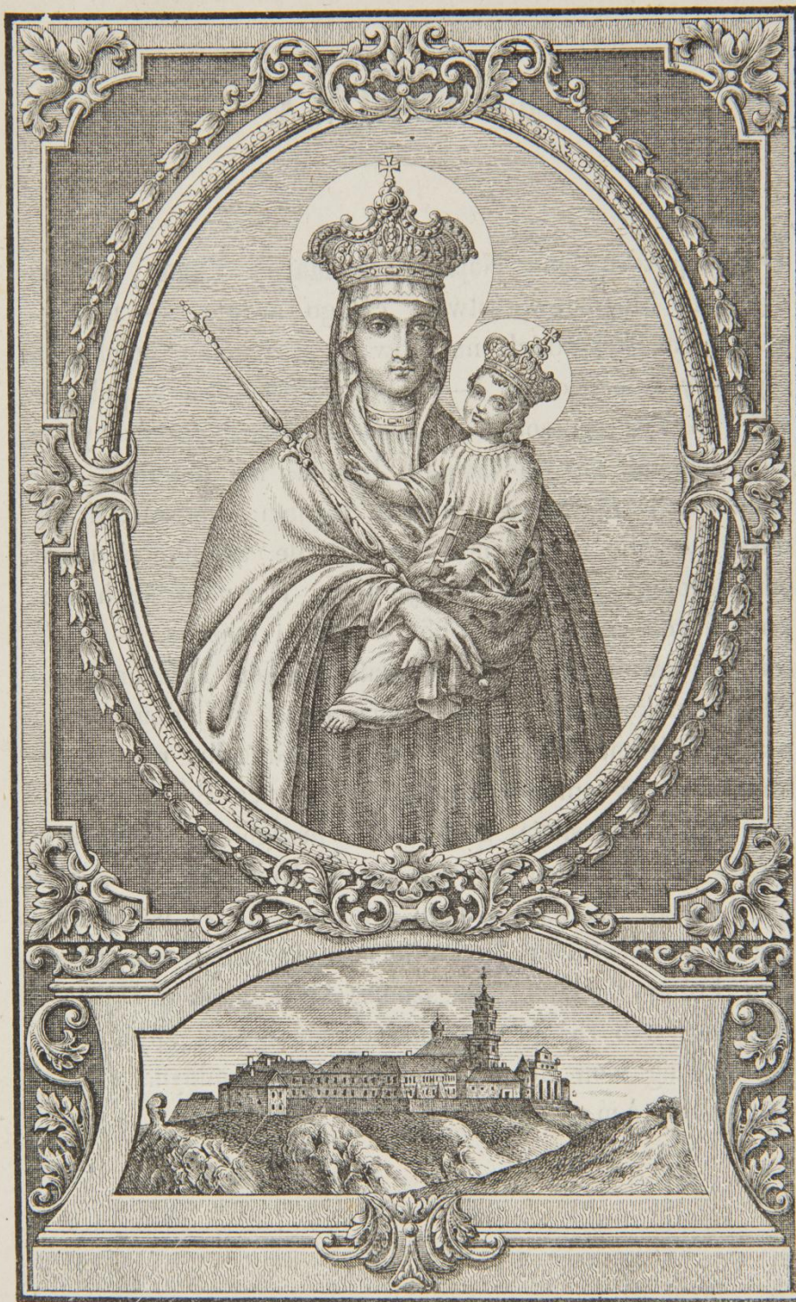
Prawdziwe wyobrażenie cudownego Obrazu Najświętszej MARYI PANNY, dnia 15 go sierpnia 1727r. ukoronowanego, w ko- ściele W.W.O. Dominikanów w Podkamieniu.