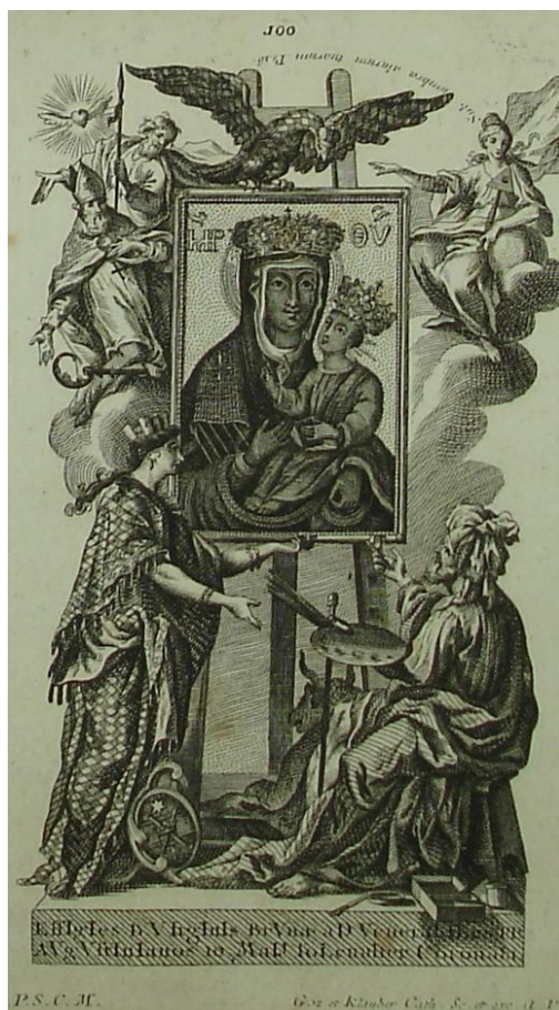
17. Sv. Lukáš kreslí Madonu, mědiryt na papíře 100 x 100 mm, zn.: Göz et Klauber Cath. Sc., sbírka devoční grafiky, Strahovský klášter Praha, sign. GS 11