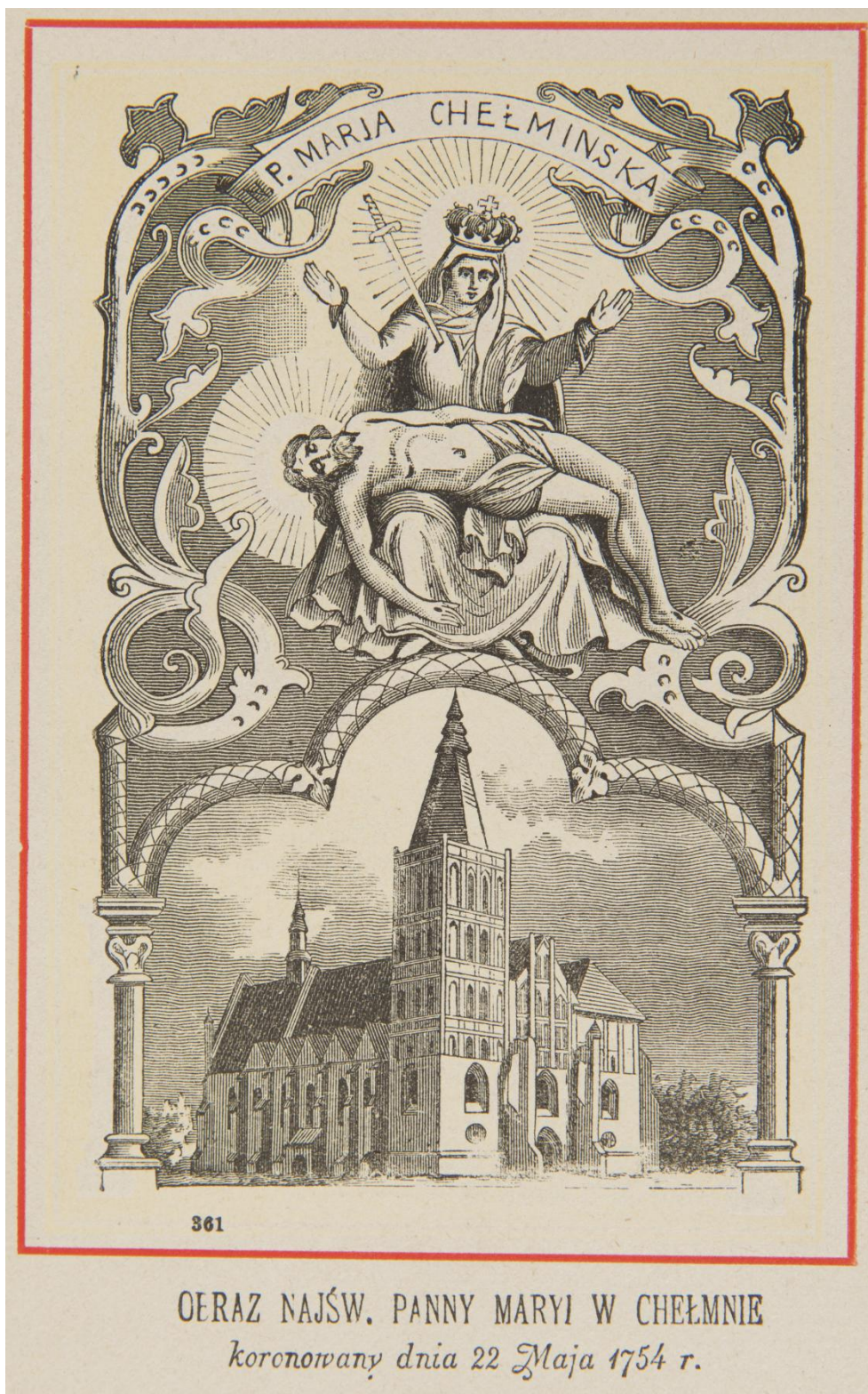
41. Matka Boží Bolestná z Chelma sbírka devoční grafiky Fundacji XX. Czartoryskich Krakow, sign. XV-R. 8302