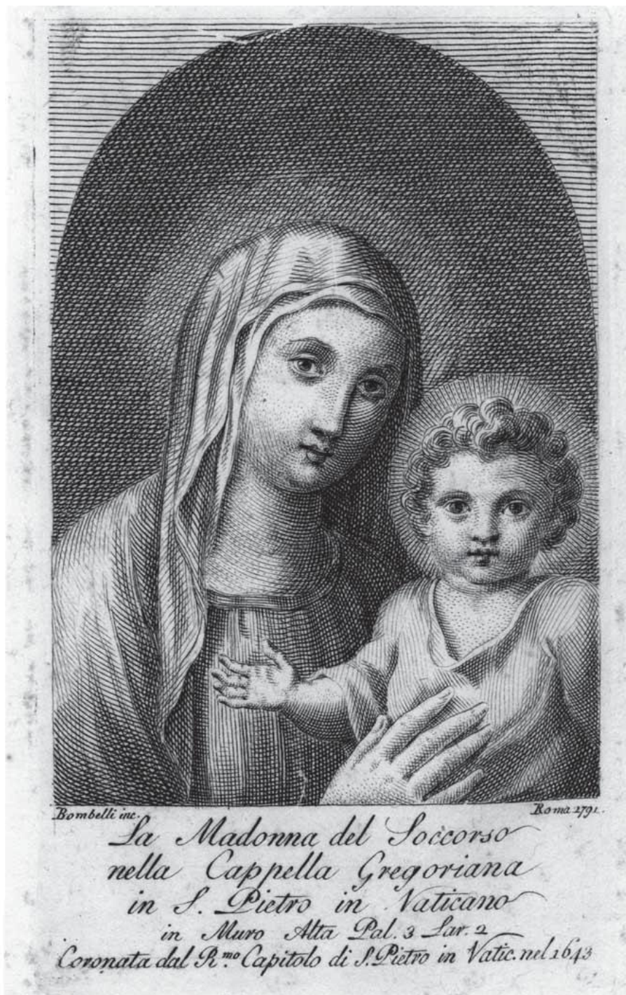
8. Madonna del Soccorso , Pietro Bombelli 1792, mědiryt na papíře, Biblioteca Apostolica Vaticana, Stamp Arch. Cap. S. Pietro. 435, II. f. 1.