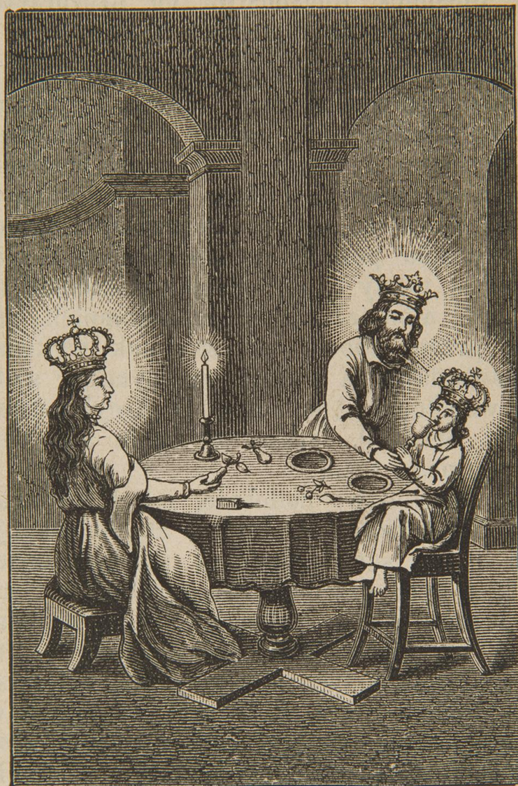
Cudowny obraz Najśw. Rodziny w Miedniewicach.

12. Svatá rodina z Miedniewic, sbírka devoční grafiky Fundacji XX. Czartoryskich Krakow, sign. XV-R. 8422