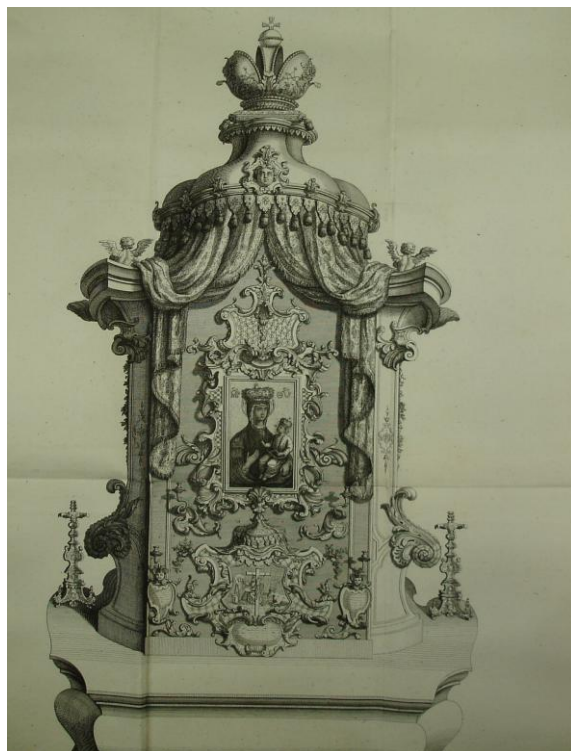
20. Zadní pohled na oltář Madony Svatotomášské, mědiryt IcobaGottlieba Thelota