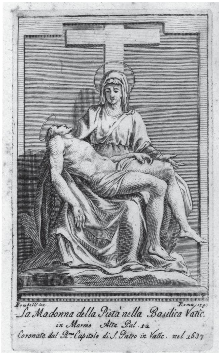
6. Madonna della Pietà , Pietro Bombelli 1792, mědiryt na papíře, Biblioteca Apostolica Vaticana, Stamp Arch. Cap. S. Pietro. 435, IV. f. 1.