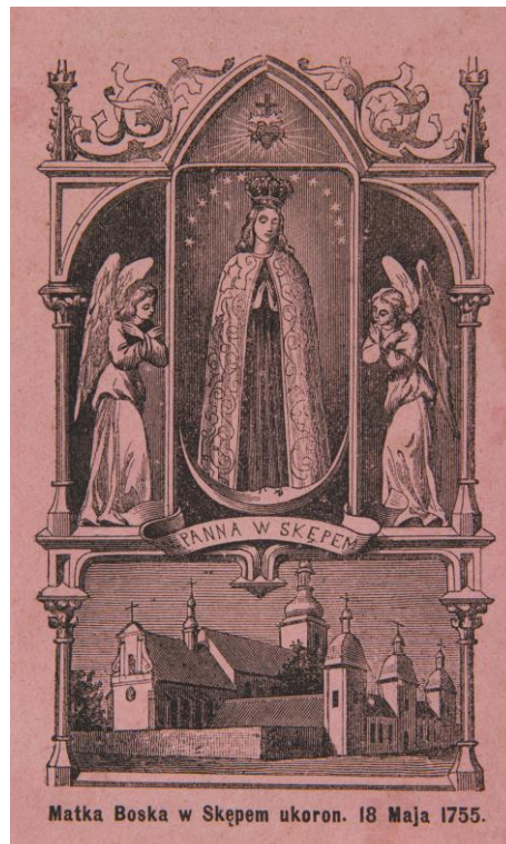
36. Matky Boží Skepská , sbrírka devoční grafiky Fundacji XX. Czartoryskich Krakow, sign. XV-R. 8450