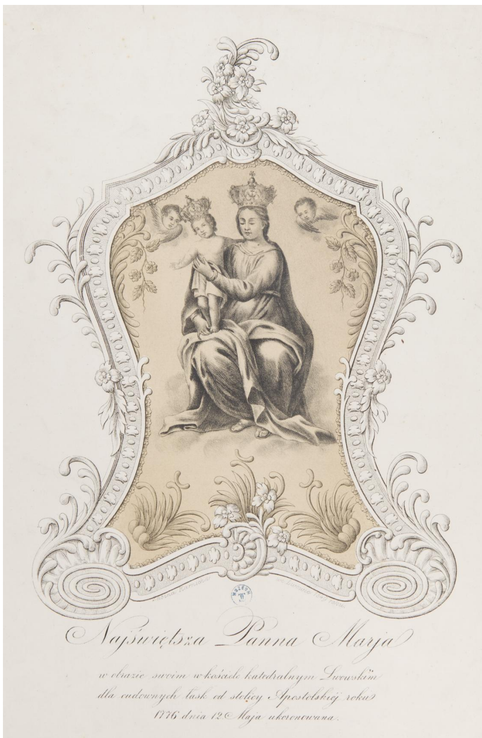
39. Obraz Matky Boží Laskavé z Lvovské katedrály , sbírka devoční grafiky Fundacji XX. Czartoryskich Krakow, sign. XV-R. 3805