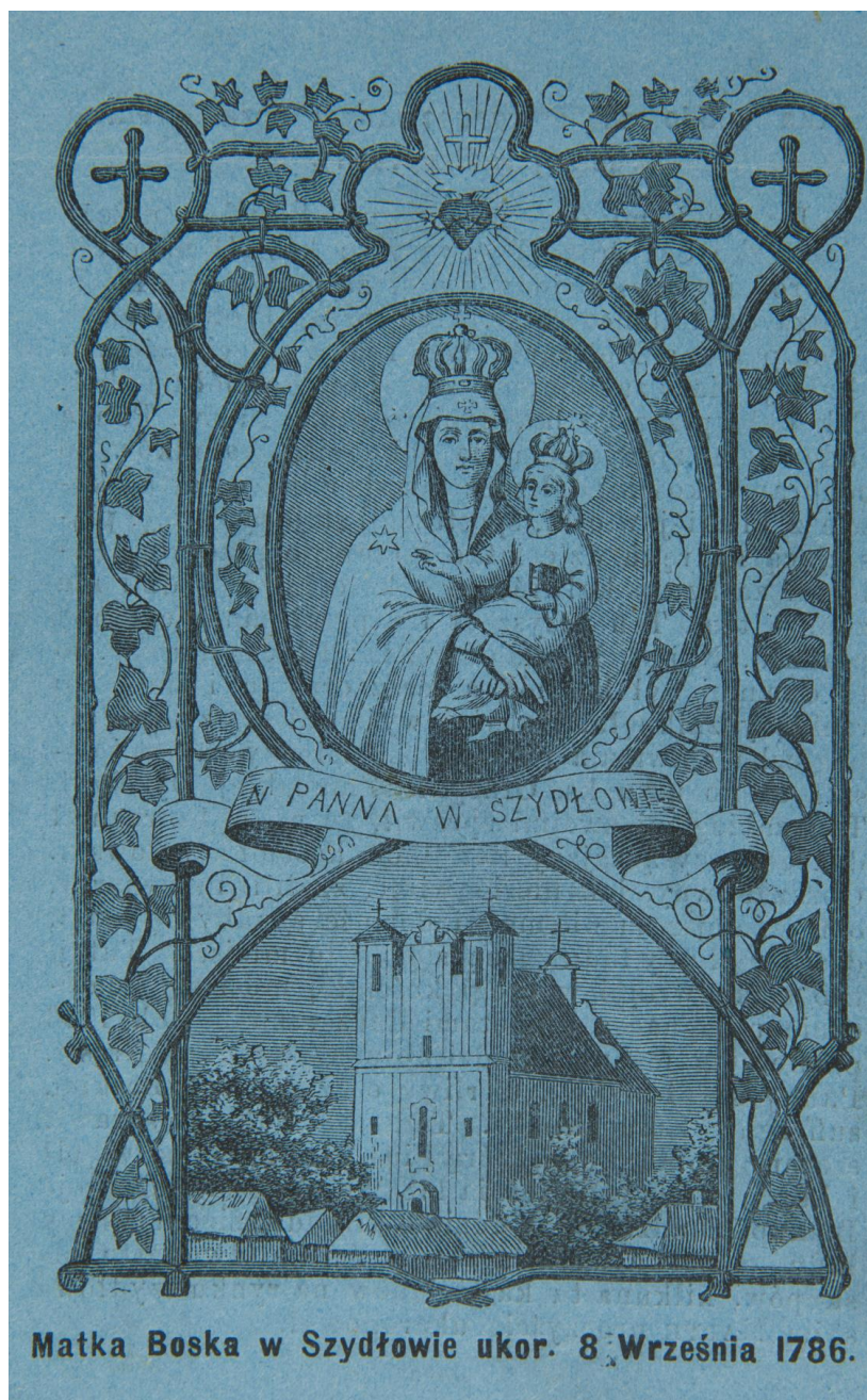
27. Matka Boża Szydłowicka , sbrka devočni grafiky Fundacji XX. Czartoryskich Krakow, sign. XV-R. 8468