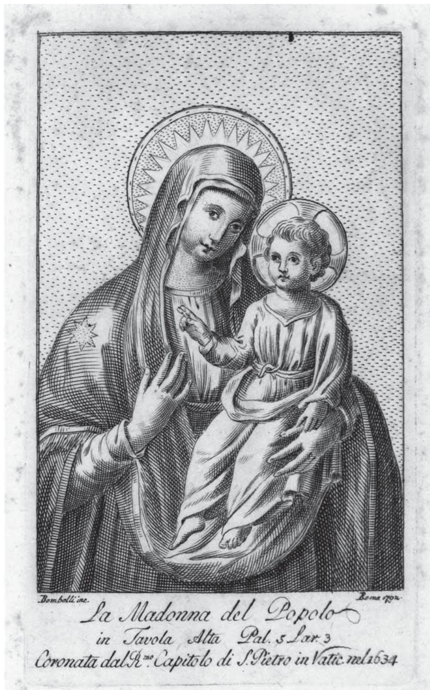
4. Madonna del Popolo , Pietro Bombelli 1792, mědiryt na papíře, Biblioteca Apostolica Vaticana, Stamp Arch. Cap. S. Pietro. 435, II. f. 53.