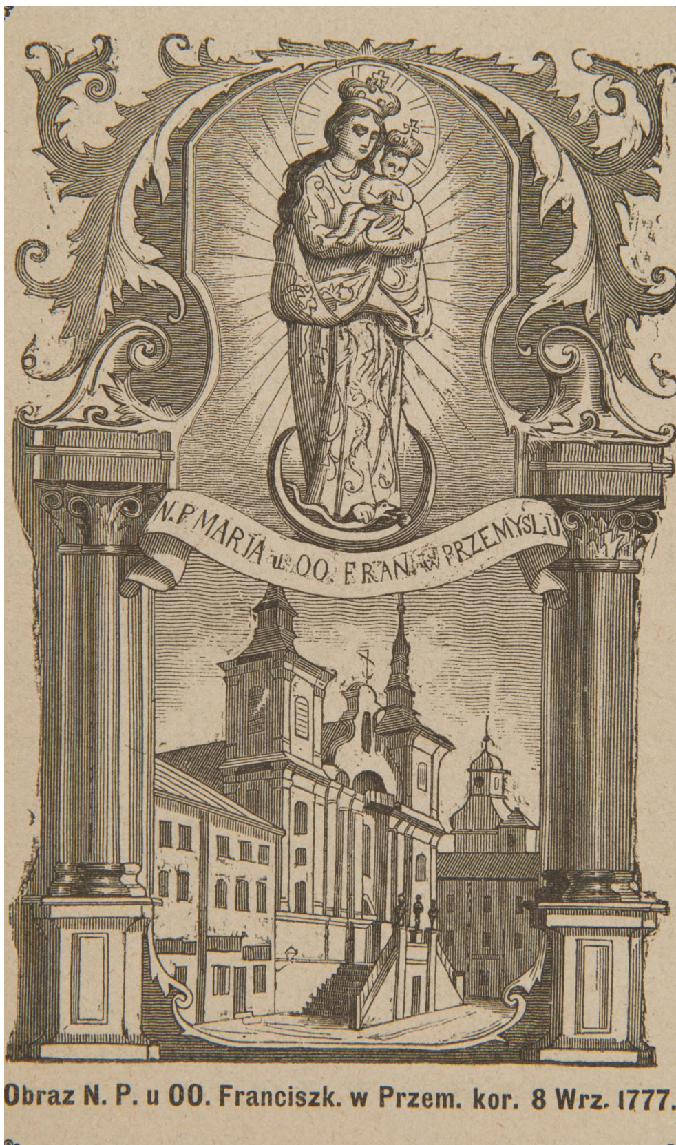
Obraz N. P. u OO. Franciszk. w Przem. kor. 8 Wrz. 1777.

38. Obraz Matky Boží z kláštera františkánů v Przemysli , sbírka devoční grafiky Fundacji XX. Czartoryskich Krakow, sign. XV-R. 8440