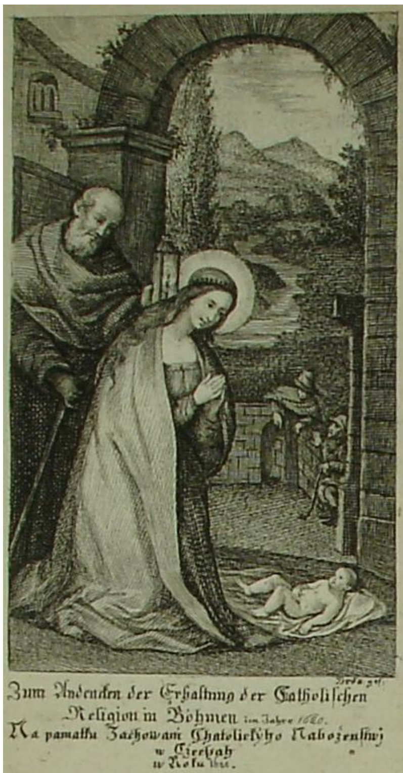
2. Panna Maria Vítězná , mědiryt na papíře, zn.:Drda del., sbírka devoční grafiky, Strahovský klášter Praha, sign. GS 91.