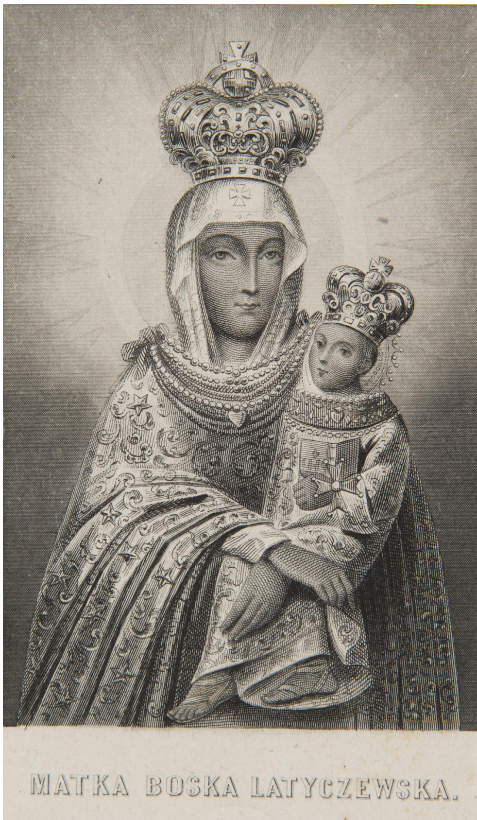
22. Matka Boží Latyczowska , sbírka devoční grafiky Fundacji XX. Czartoryskich Krakow, sign. XV-R. 3784