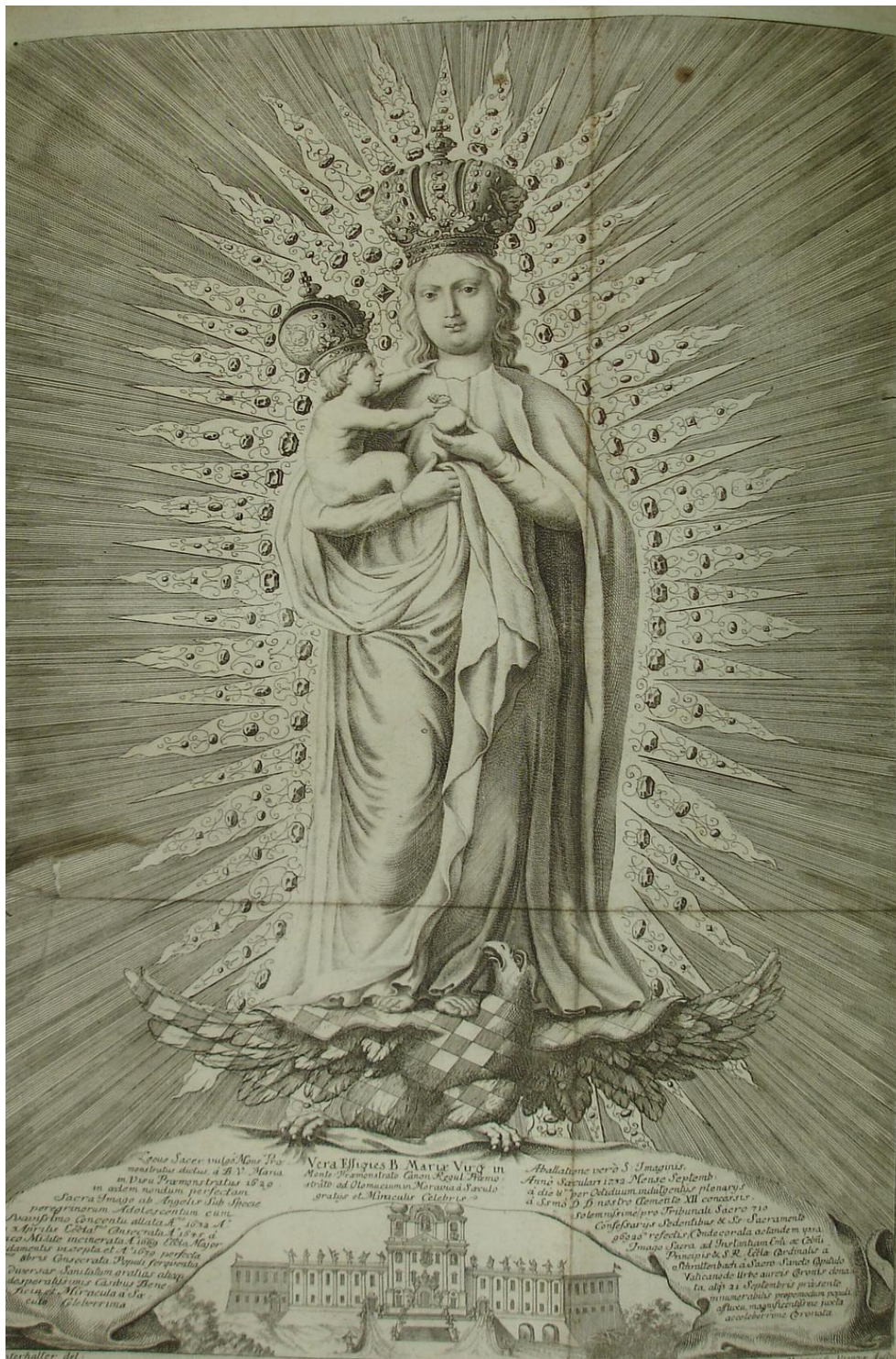
33. Milostný reliéf Panny Marie Svatokopecké, mědiryt bratří J. a. A. Schmuzerů, dle předlohy J. Winterhaltera, z knihy Enthronisticum Parthenium z roku 1733, Strahovská knihovna, sign. SK AL III 2