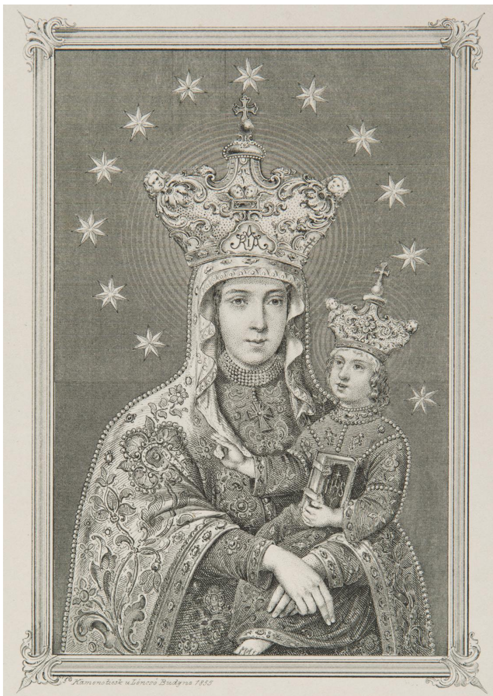
26. Matka Boží Ležajská , sbírka devoční grafiky Fundacji XX. Czartoryskich Krakow, sign. XV-R. 3796