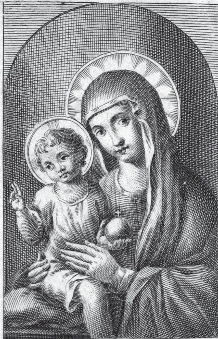
Bombelli inc. Roma 1792 La Madonna della Colonna in S. Pietro in Vatic. in Marmo Alta Pal. 4 Sar. 3 Coronata dal R mo Capitolo di S. Pietro in Vatic nel 1645.