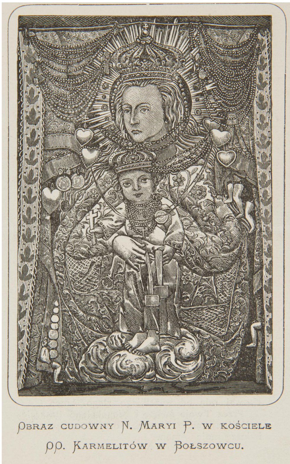
OBRAZ CUDOWNY N. MARYI P. W KOŚCIELE PP. KARMELITÓW W BOLSZOWCU.

40. Matka Boží Bolszowická sbírka devoční grafiky Fundacji XX. Czartoryskich Krakow, sign. XV-R. 8294