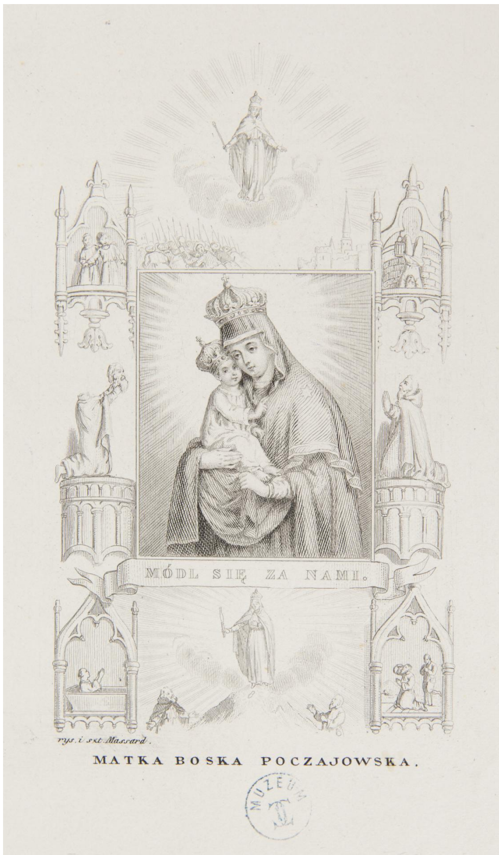
30. Matka Boży Poczajowska , sbírka devoční grafiky Fundacji XX. Czartoryskich Krakow, sign. XV-R. 3800