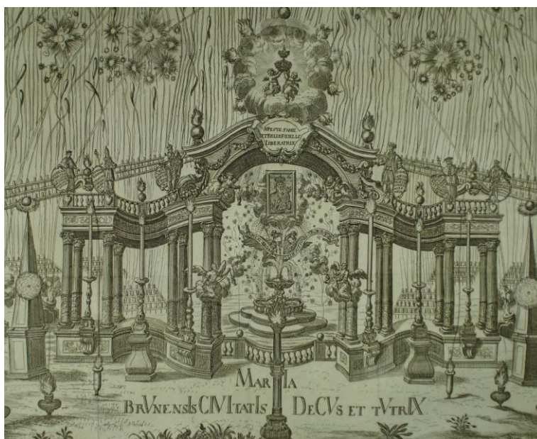
18. Slavnostní brána s ohňostrojem, rytina F. A. Mayera, vevázaná v Conchylium Marianum... 1736, Strahovský klášter Praha, sign. SK AN IV 12