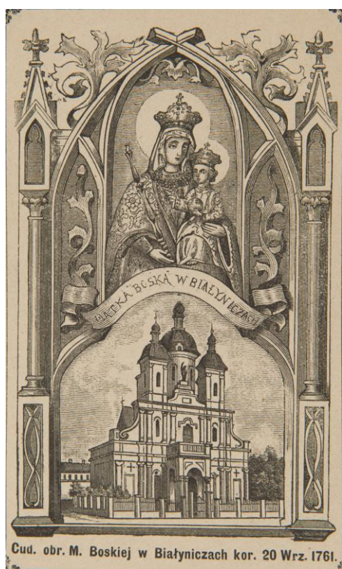
25. Matka Boży Białyniczka , sbrka devoční grafiky Fundacji XX. Czartoryskich Krakow, sign. XV-R. 8291