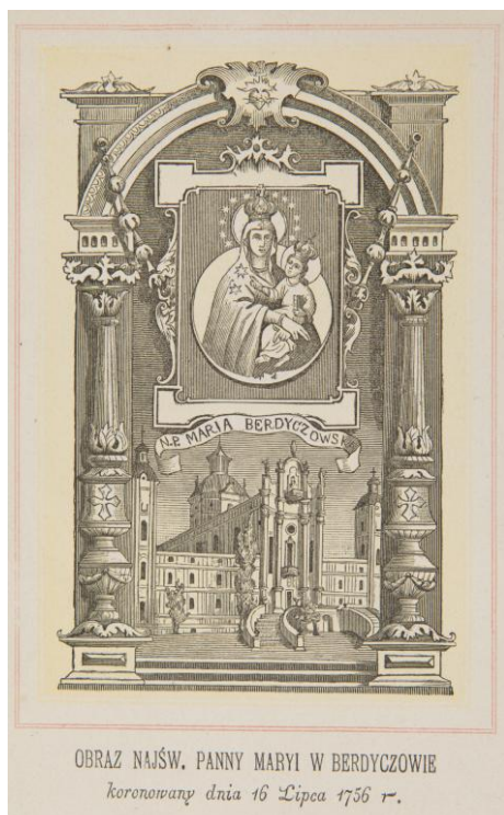
24. Matka Boży Berdyczowska , sbrka devoční grafiky Fundacji XX. Czartoryskich Krakow, sign. XV-R. 8288