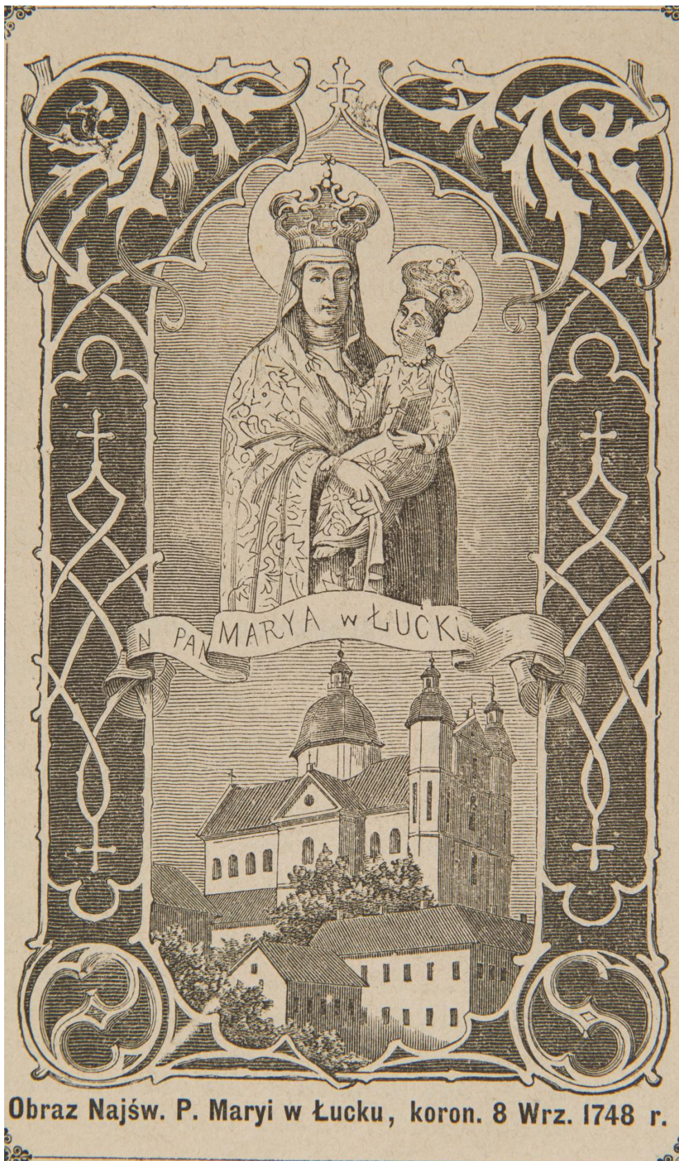
21. Matka Boží Růžencová z Lucku, sbírka devoční grafiky Fundacji XX. Czartoryskich Krakow, sign. XV-R. 8421