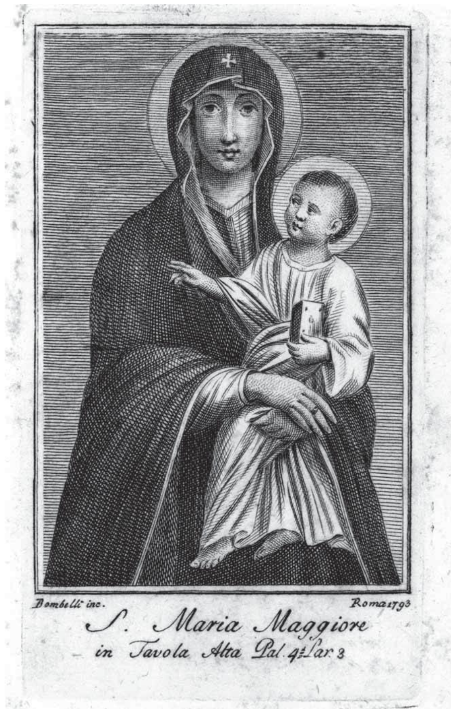
11. Panna Marie Sněžná z basiliky Santa Maria Maggiore, Pietro Bombelli 1793, mědiryt na papíře, Biblioteca Apostolica Vaticana, Stamp Arch. Cap. S. Pietro. 435, IV. f. 81.