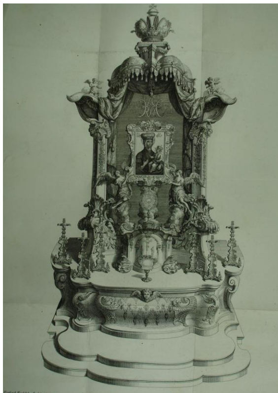
19. Čelní pohled na oltář Madony Svatotomášské, mědiryt IcobaGottlieba Thelota, vevázán v korunovačním spise Gemma Moraviae...1736, Strahovský klášter, sign. SK BV II 159.