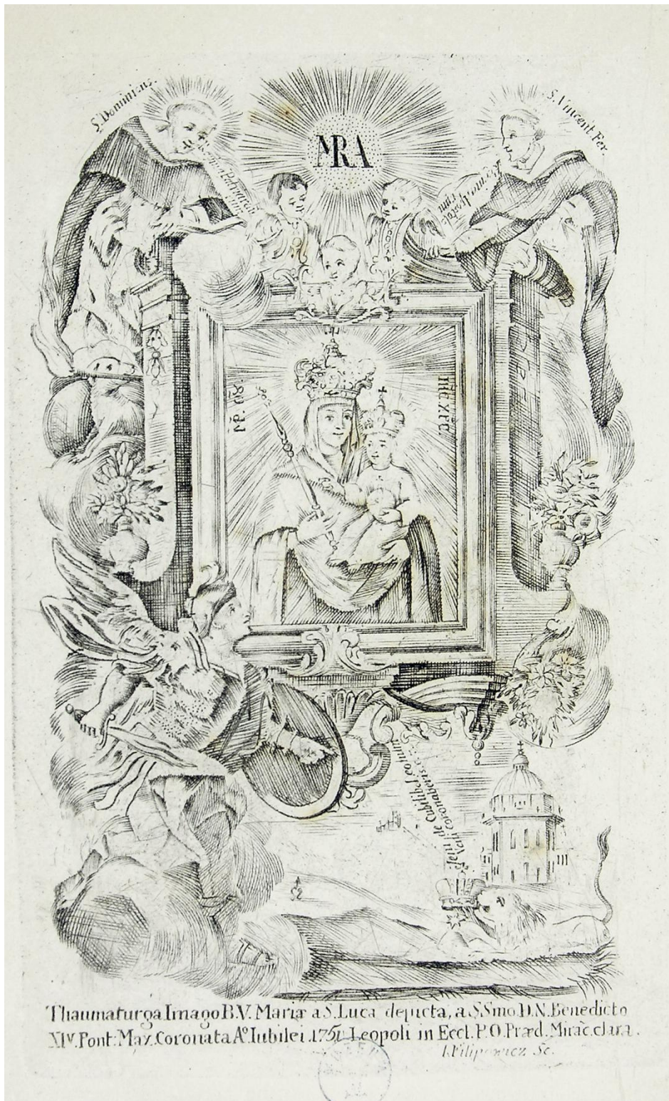
15. Vítězná Matka Boží Růžencová ze Lvova, sbírka devoční grafiky Fundacji XX. Czartoryskich Krakow, sign. XV-R. 8451