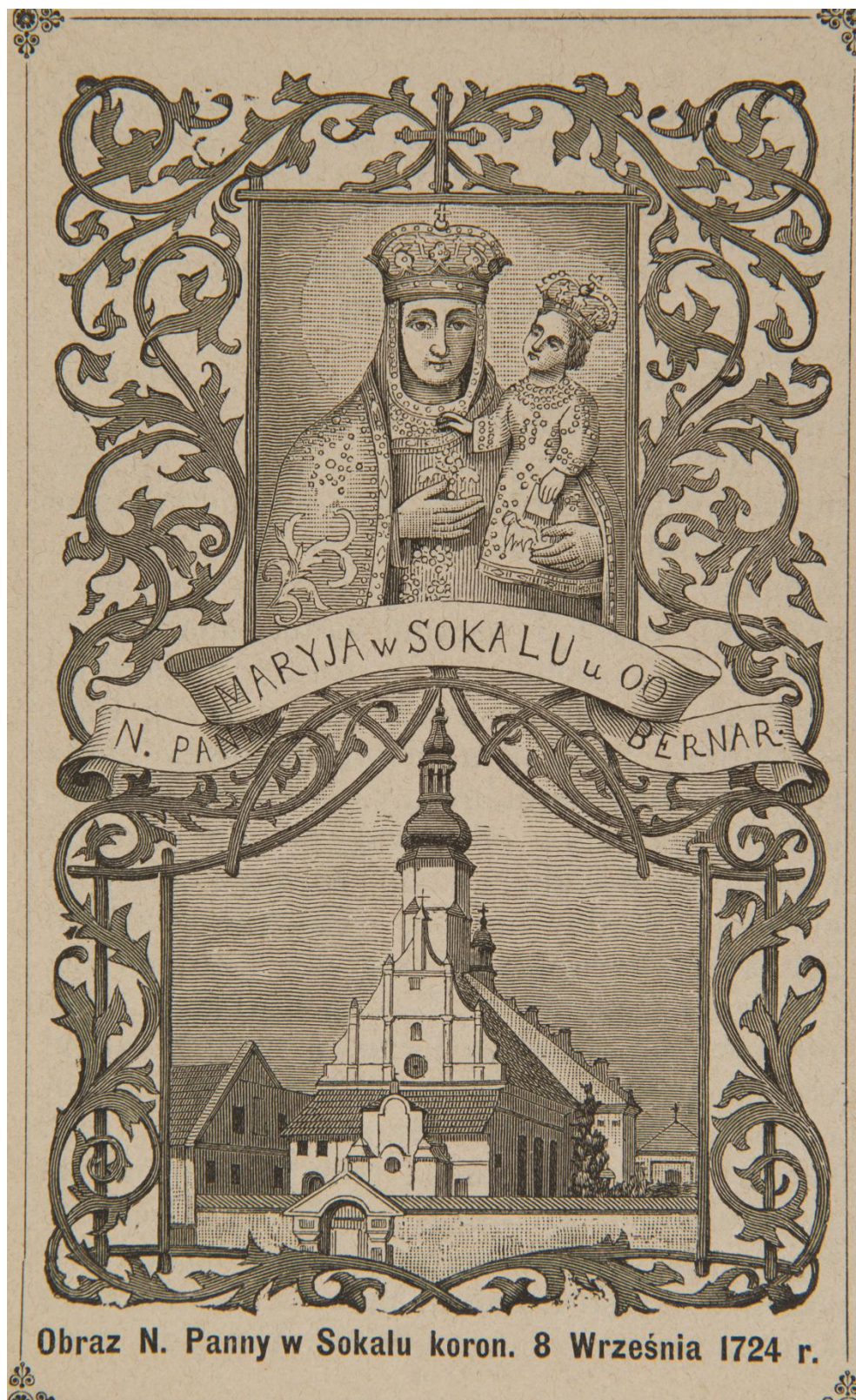
14. Matka Boża Sokalská , sbírka devoční grafiky Fundacji XX. Czartoryskich Krakow, sign. XV-R. 8451