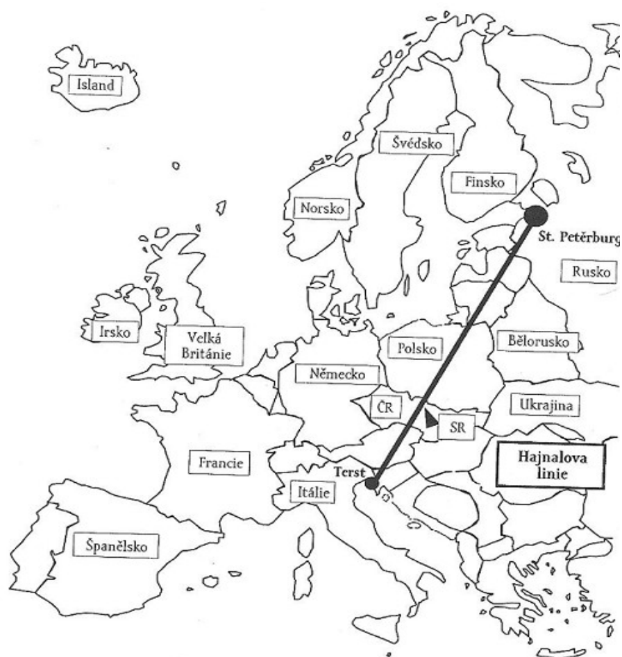
Obrázek č. 1: Hajnalova linie rozdělující Evropu na západoevropský a východoevropský model rodiny (Rabušic, 2001, s.72)

trvale svobodných žen a mužů. Tento vysoký sňatkový věk byl důsledkem ekonomických důvodů, a také faktickým zákazem sňatků před absolvováním vojenské služby. Zvykem bylo, že mladí lidé chodili do služby, kde si měli vydělat na budoucí samostatné bydlení nebo přebírali hospodářství jednoho z rodičů. Ke sňatku docházelo až poté, co se rodina hospodářsky etablovala a byla schopna se sama uživit. Tento rodinný model v sobě skrýval brzdu populačního růstu, protože osoby, které vstupovaly do manželství později, mívaly menší počet dětí. Do tohoto modelu patří germánské, skandinávské, některé středomořské populace a také Češi a Moravané (Chlubný, 2007, s.10).