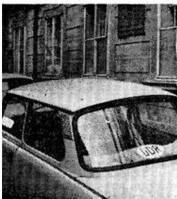
aze na 1600 zaparkovaných vozidel dopravu v úzkých uličkách Malé Strany. Jsou proto postupně odtaženy dalším osudu jednají orgány ČSSR