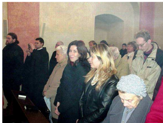
Bohoslužba slovenského gréckokatolíckeho spoločenstva v kostole sv. Kozmy a Damiána