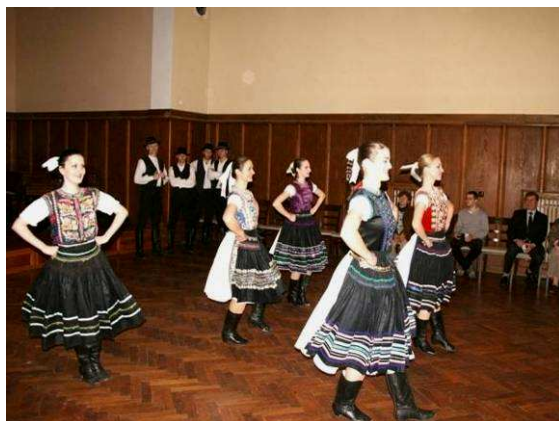
Ekumenická modlitba za domov – predstavitelia slovenských komunít v Prahe a kultúrny program s vystúpením slovenského folklórneho súboru