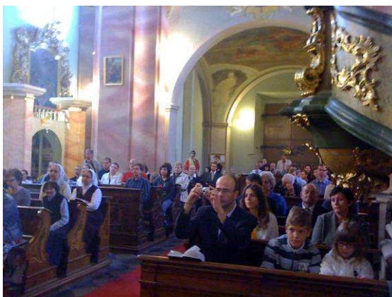
Dni slovenských farností v Prahe 2011 – výlet do prírody a gréckokatolícka bohoslužba