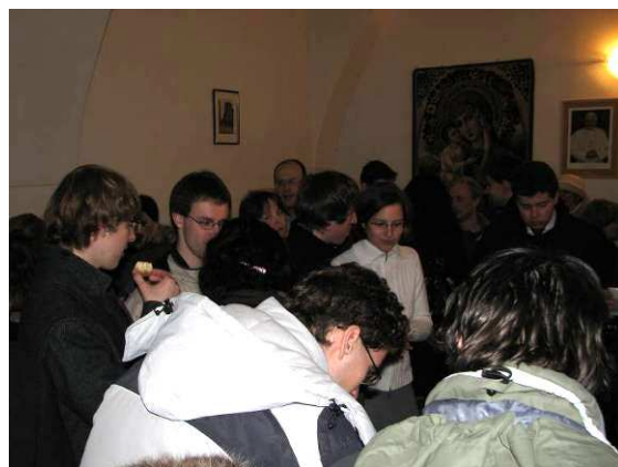
Detský domček Betlehem v zadnej časti lode kostola Najsvätejšej Trojice Pohostenie v pastoračnej miestnosti kostola Najsvätejšej Trojice (nedostatočná kapacita)