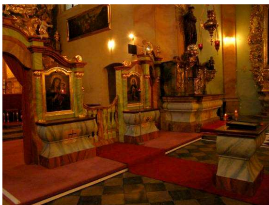
Kostol Najsvätejšej Trojice – priečelie a inštalovaný ikonostas