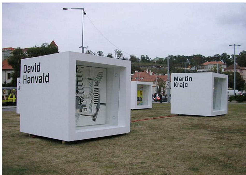
15. Obr: Krychle, pohled na výstavu, Praha.