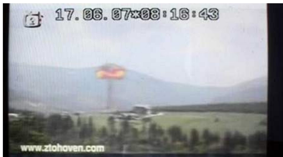
6. Ztohoven: Mediální realita, záznam z televizního přenosu, Beskydy.