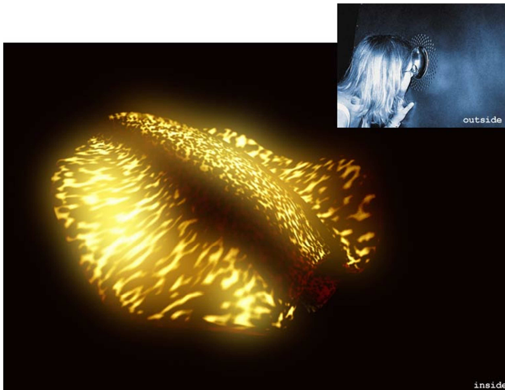
11. Silver: Resident.