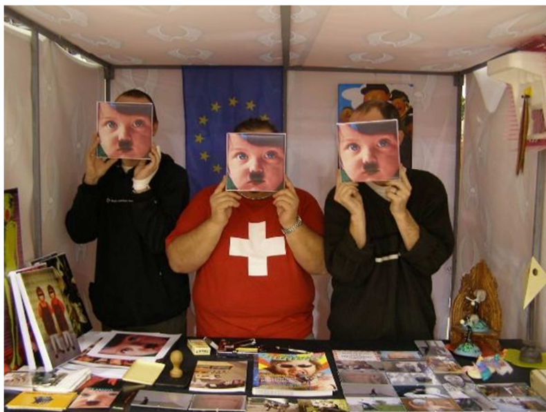
13. František Lozinsky o.p.s: Art and antikrist, Ostrava.