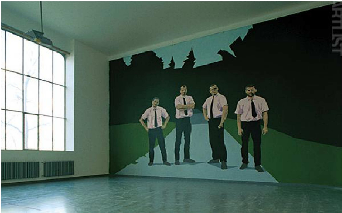
1. Rafani: „Rafani“, galerie AVU, pohled do instalace, Praha.