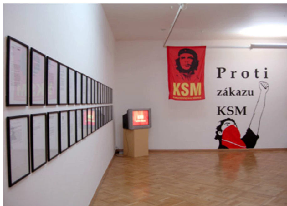
8. Guma Guar: Meze tolerance, Praha.