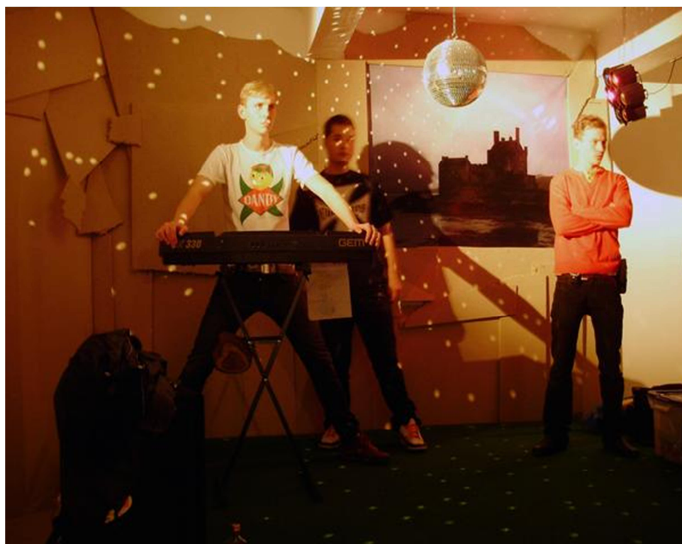
16. I love 69 popgejů: Pohled na performance, Praha.