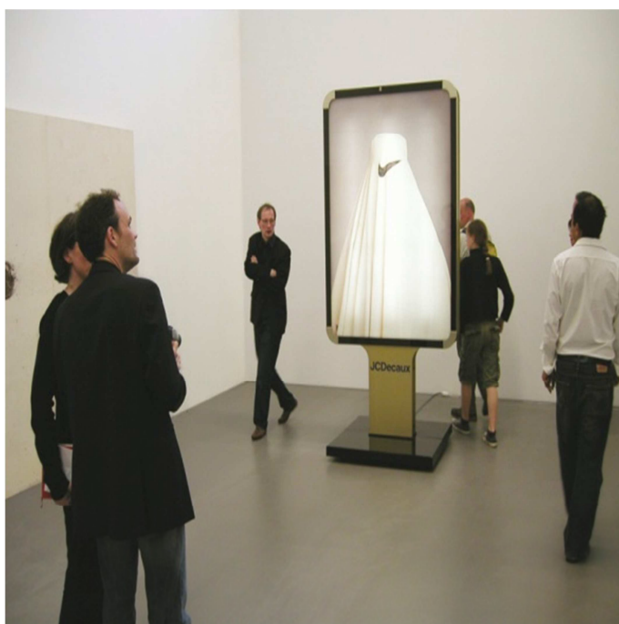
10. Pode Bal: Converse, záznam z instalace, Praha.