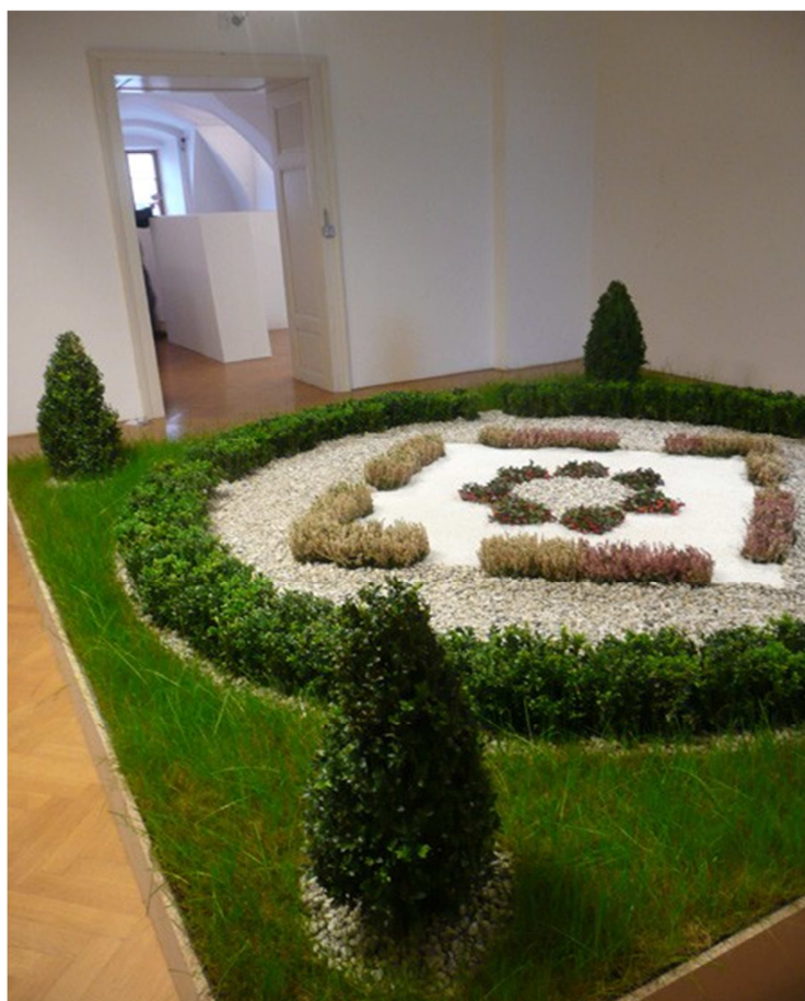
4. Rafani: Retrospektiva, pohled do instalece, Klatovy.