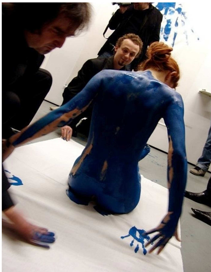
9. Pode Bal: Cover art, záznam z performance, Praha.