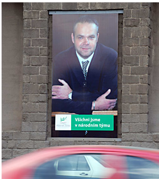
7. Guma Guar: Kolektivní identita, záznam z instalace, Praha.