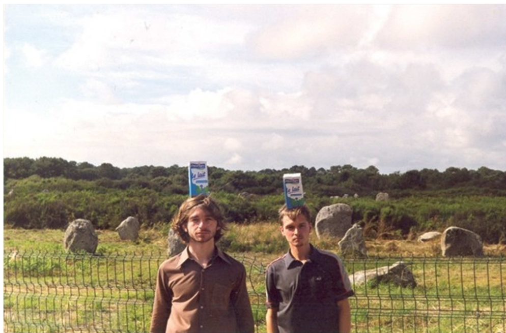
12. MINA: Tradice vertikalit v Bretagni.