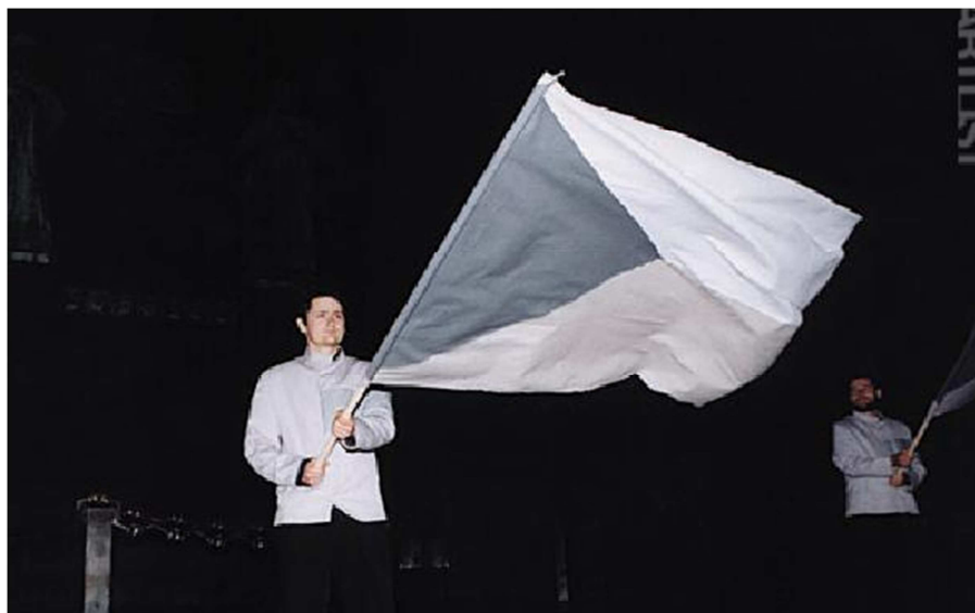
3. Rafani: Demontrace demokracie, záznam z akce, Praha.