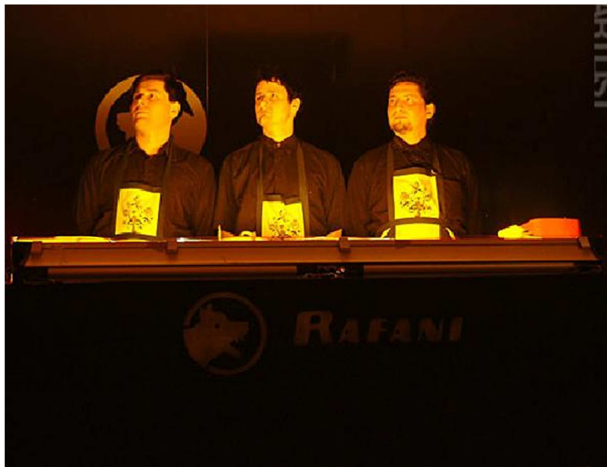
2. Rafani: Goja, divadlo Komedie, záznam performance, Praha.