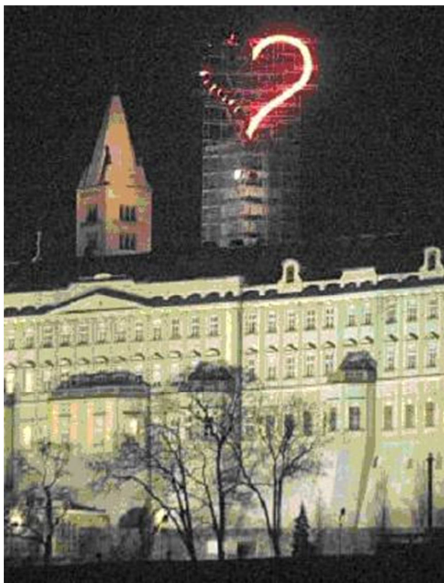
5. Ztohoven: Otazník nad hradem, Praha.