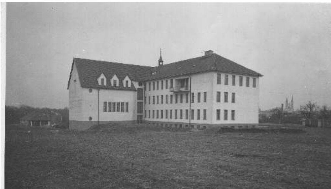
7. Nová studentská kolej svatého Antonína v Kroměříži v roce 1940