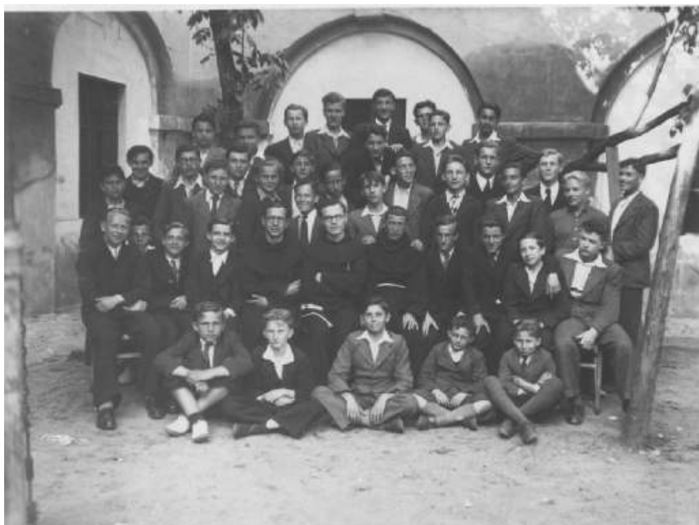
8. Studenti z koleje svatého Antonína ve studijním roce 1941/42