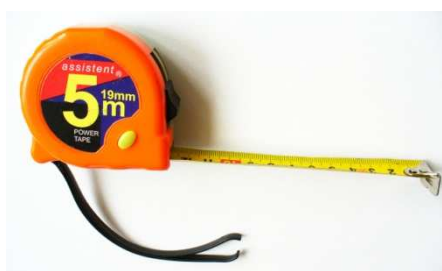
Metr (pro měření odhadu šíře ramen, boků a délky chodidla)