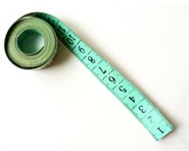
Krejčovský metr (pro měření odhadu v testu dle Petrie)