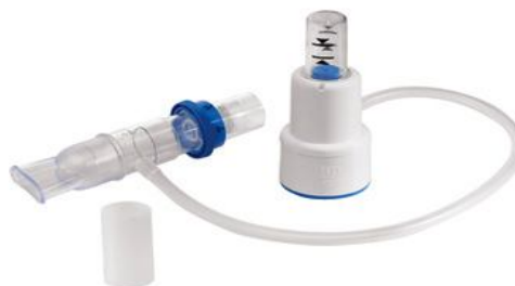
Příloha 2: Výdechový treňač TheraPep

( http://www.smiths-medical.com/catalog/lung-expansion/insentive-spirometer/cliniflo-flow-based-incentive.html )