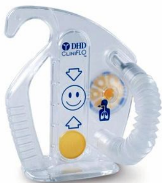
Příloha 1: Nádechový treňač CliniFlo

( http://www.smiths-medical.com/catalog/lung-expansion/insentive-spirometer/cliniflo-flow-based-incentive.html )