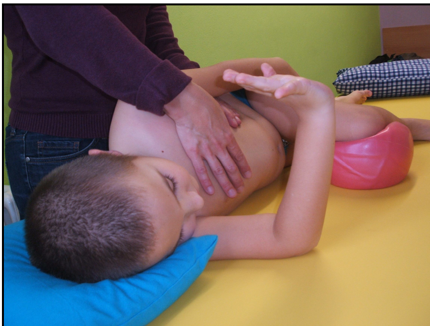
Příloha 8: Návuk posturálně-respirační funkce bránice, poloha ROII, SMA III.typ, 6 let