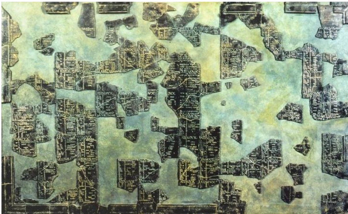
Kalendář z Coligny, © Musée gallo-romain de Lyon – Fourvière Použitá literatura: www.museum-joanneum.at