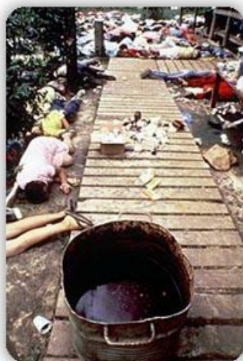
Tragédie v Jonestownu I