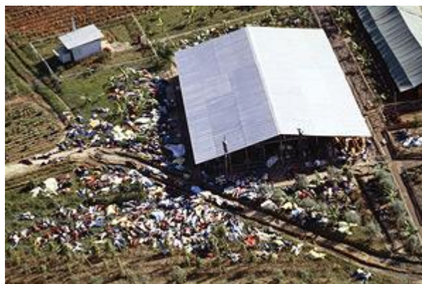
Tragédie v Jonestownu II