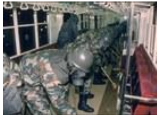
Úklid tokijského metra I