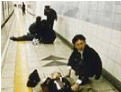
Oběti sarinového útoku I