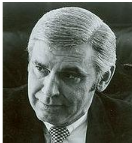
Kongresman Leo Ryan I