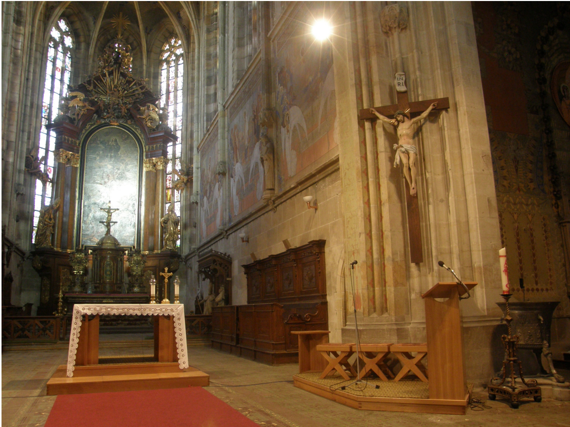
Jan Sokol: Úprava liturgického prostoru, 1976. Kostel sv.Vavřince ve Vysokém Mýtě, rekonstrukce původního stavu (chybí však stolec u křtitelnice), fotografováno v roce 2010.