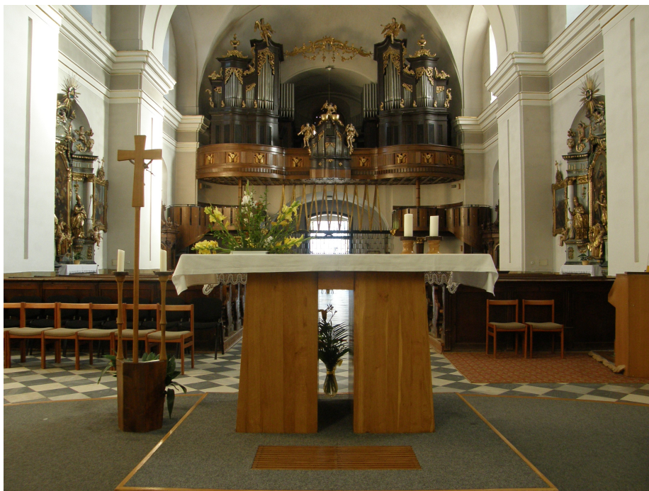
Jan Sokol: Mensa, dřevo, 1980. Kostel Nanebevzetí P.Marie v Ústí nad Orlicí, stav z roku 2010.