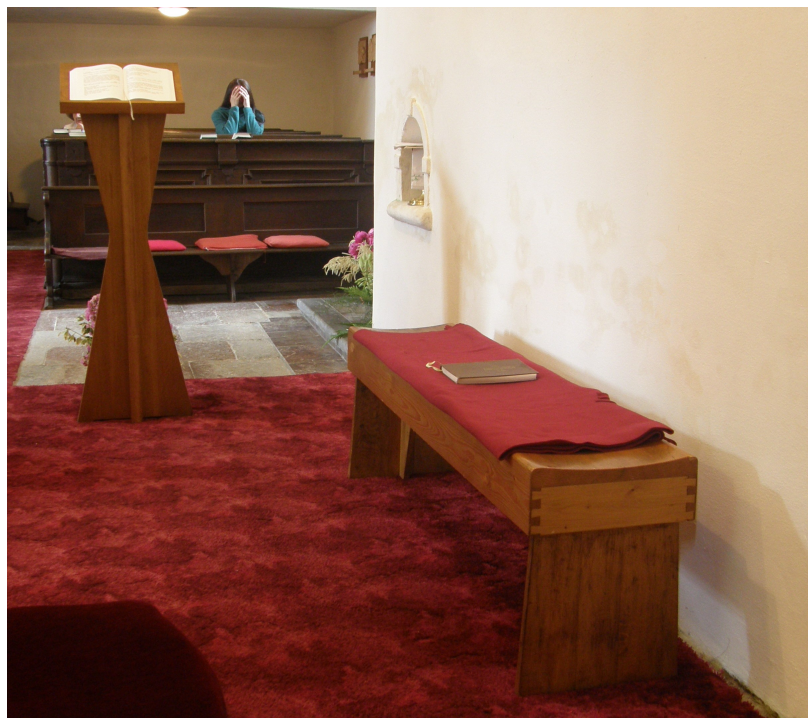
Jan Sokol: Ambon a sedadlo pro přísluhující (původně sedes pro kněze), dřevo, 1966. Kostel sv.Palmácia na Karlštejně, stav z roku 2010.