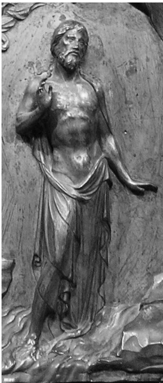
Obrázek 3. Detail zobrazení Syna

„On je obraz Boha neviditelného, prvorozený všeho stvoření.“ (Kol 1,15) Kristus sám je nejrealističtější Boží obraz, protože se v něm odráží podoba neviditelného Boha otce. 77