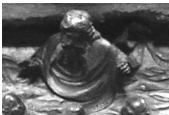
Obrázek 2. Detail zobrazení Boha Otce

Zjevení Boha Otce je zobrazeno nejprve jen paprskem světla, který vychází z nebes, později z nebes vystupuje a jedná Boží pravice. Na našem díle, které pochází z počátku 15. století, vidíme Boha Otce zobrazeného způsobem, který se vyskytoval od 11. století. V této době se na místo ruky Boží začala zobrazovat hlava nebo busta Boha Otce (viz obr. 2). V pozdější době pak můžeme na obrazech Kristova křtu spatřit celou postavu Otce trůnícího na nebesích. 76 Vidíme tedy, že se postupně od symbolického zobrazení docházelo k zobrazení zcela konkrétnímu, které již může přetvářet lidské představy o Bohu Otci.