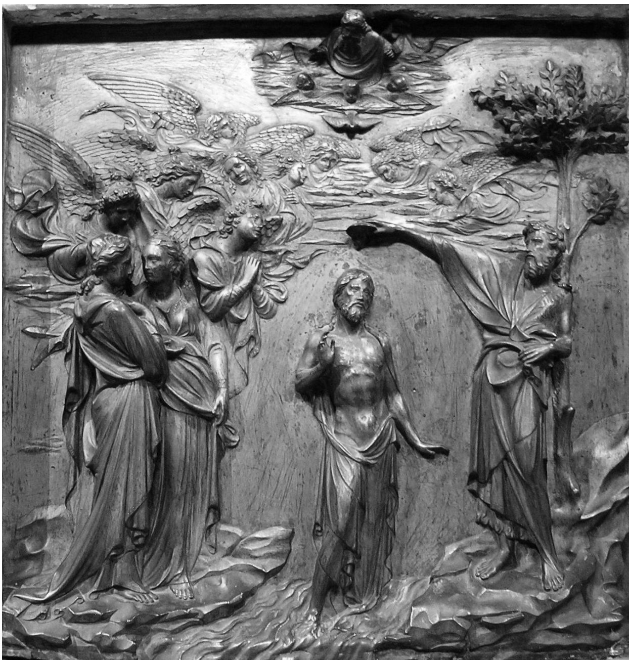
Obrázek 1. Lorenzo Ghiberti, Křest Kristův , Zlacený bronzový reliéf v baptisteriu katedrály v Sieně

Uprostřed stojí Kristus, nad ním se vznáší holubice Ducha svatého a Bůh Otec. Ježíš je obklopen ministrujícími anděly. Vedle stojí Jan Křtitel, kostnatý prorok z pouště. 72 Za ním roste strom. Tento symbol vychází z motivu stromu a zaťaté sekery, který byl zobrazován na východě a je inspirován kázáním Jana Křtitele: „Sekera už je na kořeni stromů; a každý strom, který nenese dobré ovoce, bude vyťat a hozen do ohně.“(L 3,9) 73 Nebudeme se zabývat tím, kolik je zde zobrazených andělů, ani skalnatou krajinou, kterou protéká řeka Jordán, ve které Ježíš stojí. Zaměříme se právě na osoby nejsvětější Trojice.