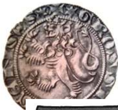
2. Velké brakteáty; 669 – Přemysl Otakar I.; 741,750 – Václav I.; 762, 769, 770 – Přemysl Otakar II.