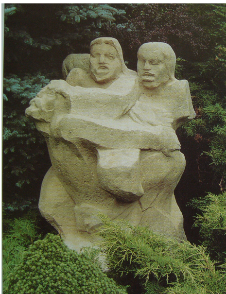
Obr. 13: Plzeň, R. Podrázský, 5. V rukou vojáků, 1991