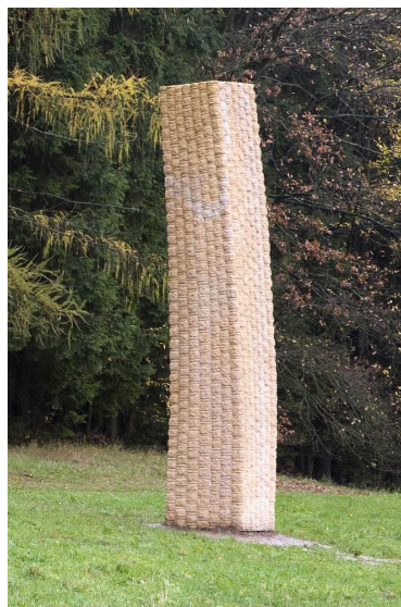
Obr. 36: Kuks, Jiří Kačer, 15. Obelisk