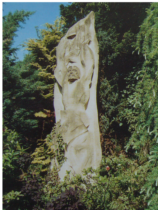
Obr. 16: Plzeň, R. Podrázský, 14. Oslavení, 1991