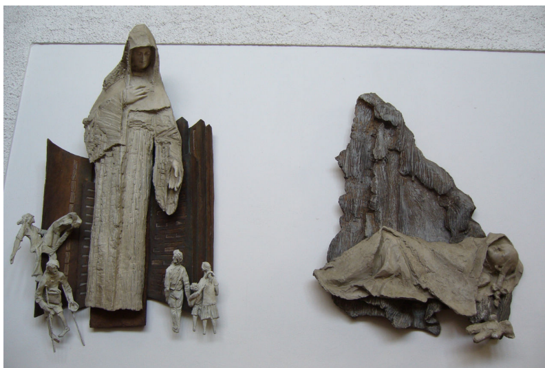
Obr. 5: Lhotka, Karel Stádník, 5. Setkání s matkou, 6. Pád