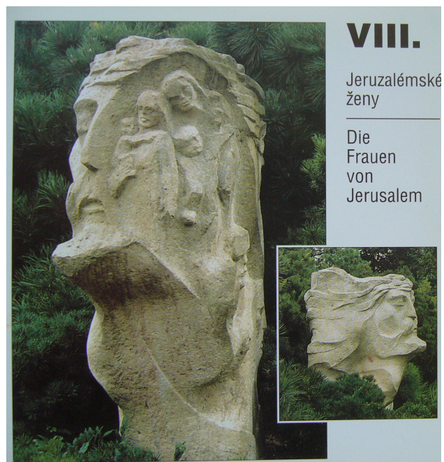
Obr. 14: Plzeň, R. Podrázský, 8. Jeruzalémské ženy, 1991