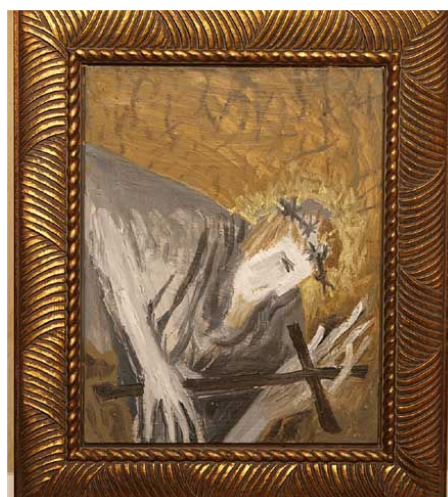
Obr. 37: Brada, Michail Ščigol, 3. První pád, 2010