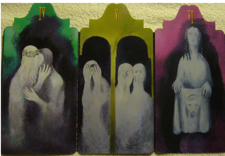
Obr. 18: Konecchlumí, Vladimír Komárek, 4. Ježíš setkává svou matku, 5. Šimon z Cyrény, 6. Veronika, 2002