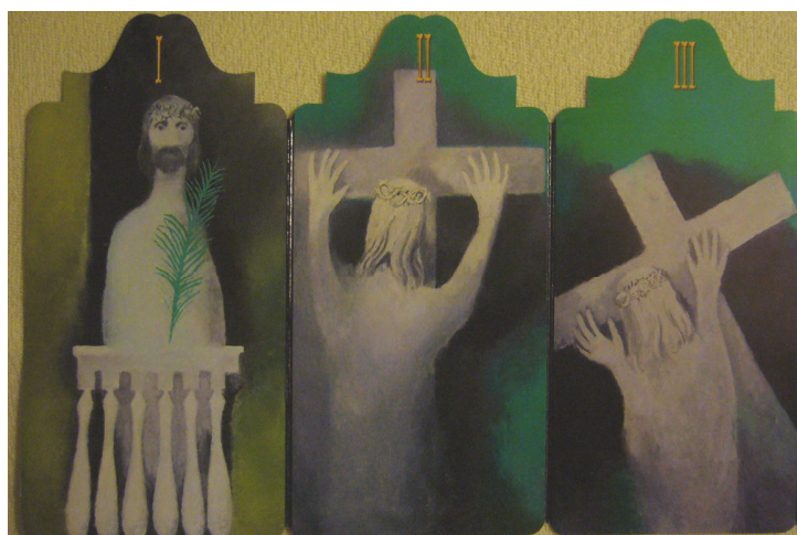
Obr. 17: Konecchlumí, Vladimír Komárek, 1. Ecce Homo, 2. Přijetí kříže, 3. Pád pod křížem, 2002