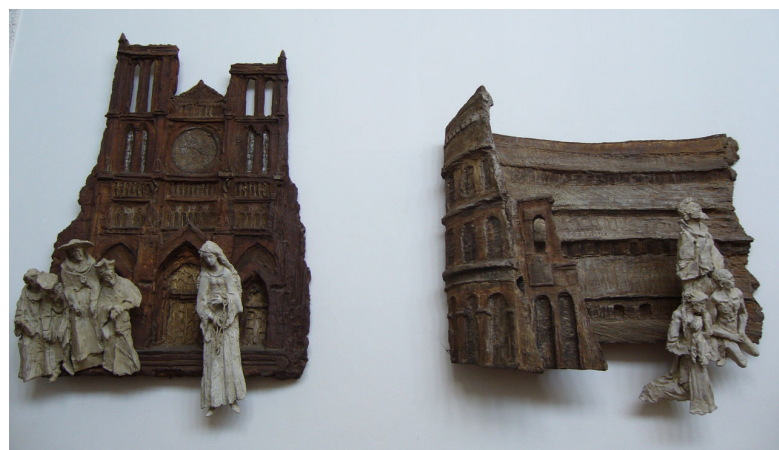
Obr. 4: Lhotka, Karel Stádník, 3. Kristus odsouzen na smrt; 4. Přijetí kříže