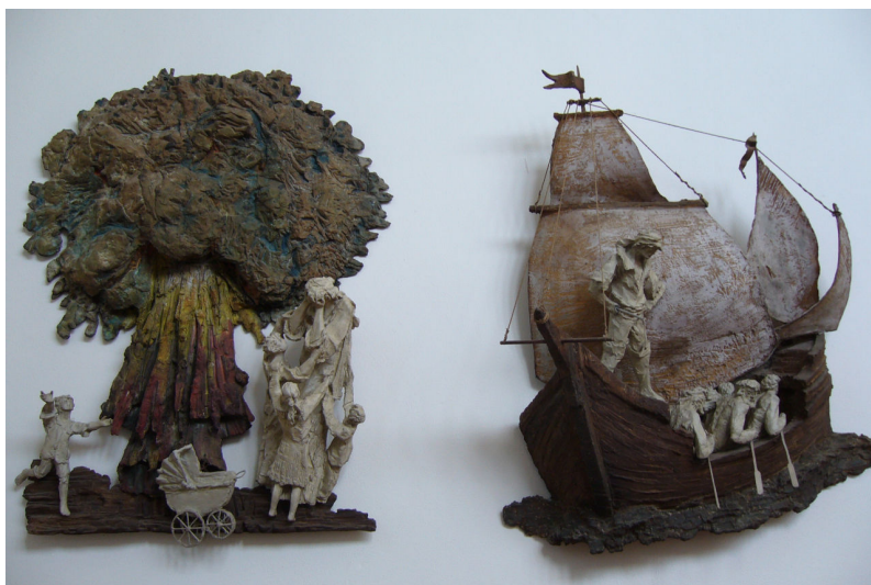
Obr. 3: Lhotka, Karel Stádník, 1. Utrpení v Getsemanech; 2. Kristus bičován, 1973–1975