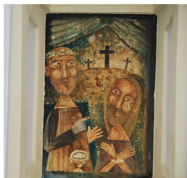
Obr. 39: Dobrá Voda, Renata Štolbová, Odsouzení, 1996