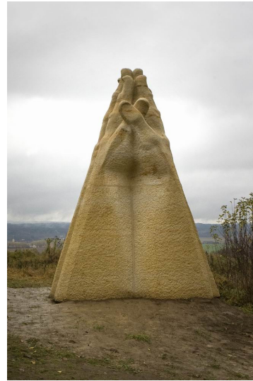
Obr. 26: Kuks, Vladimír Preclík, 5. Katedrála prosby