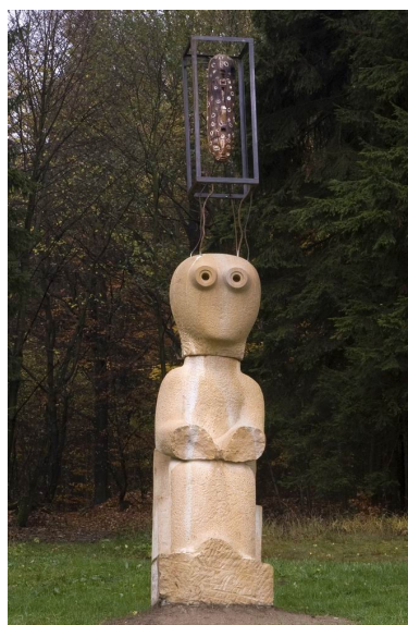
Obr. 33: Kuks, Michal Šarše, 12. Hledač