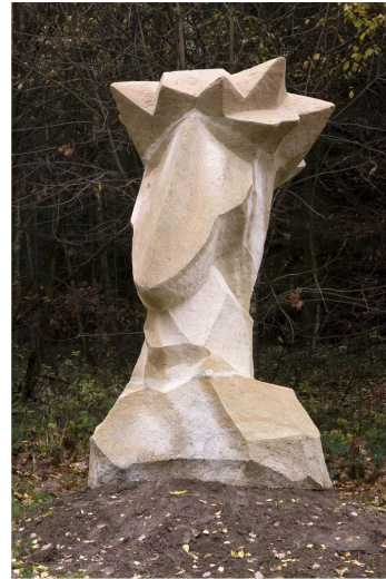
Obr. 25: Kuks, Ellen Jilemnická, 4. Trnová koruna