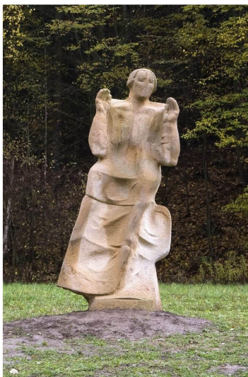
Obr. 24: Kuks, Vojtěch Adamec, 3. Zázrak Nanebevstoupení