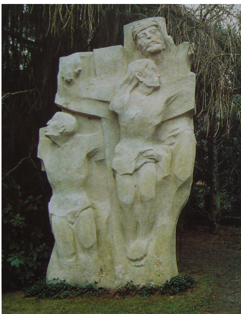
Obr. 15: Plzeň, R. Podrázský, 10. Dva zločinci, 1991