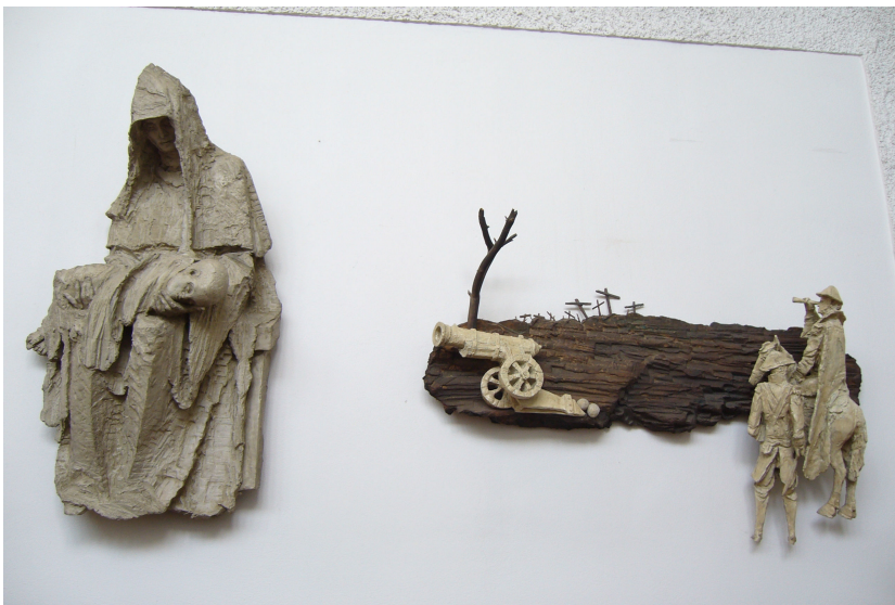
Obr. 9: Lhotka, Karel Stádník, 12. Mrtvé Kristovo tělo vloženo do náruče matky, 13. Kristus pohřben