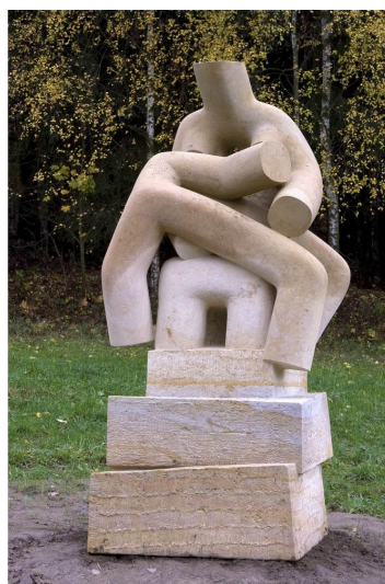
Obr. 31: Kuks, Mario Kotrba, 10. Pieta