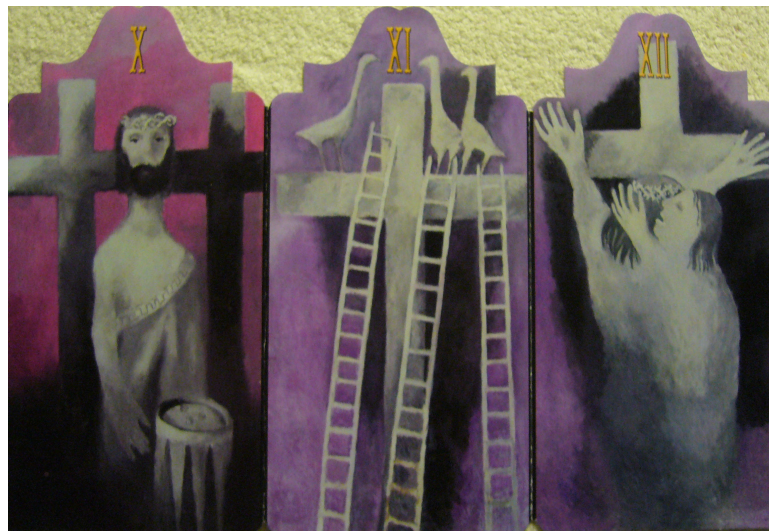
Obr. 20: Konecchlumí, Vladimír Komárek, 10. Ježíš je vysvěcen, 11. Ukřižování, 12. Ježíš umírá, 2002