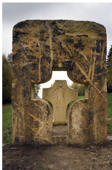
Obr. 32: Kuks, Čestmír Mudruňka, 11. Krajina kříže