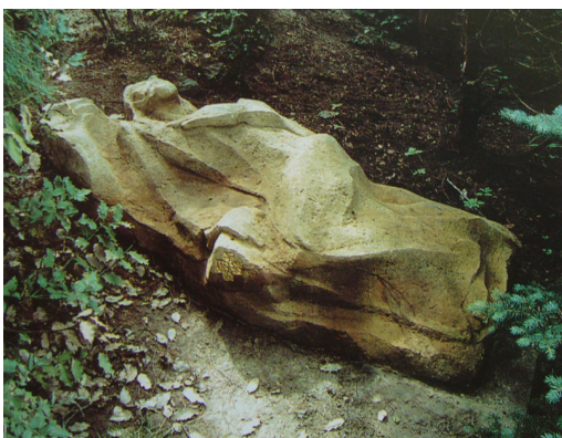
Obr. 12: Plzeň, R. Podrázský, 2. Getsemany, 1991