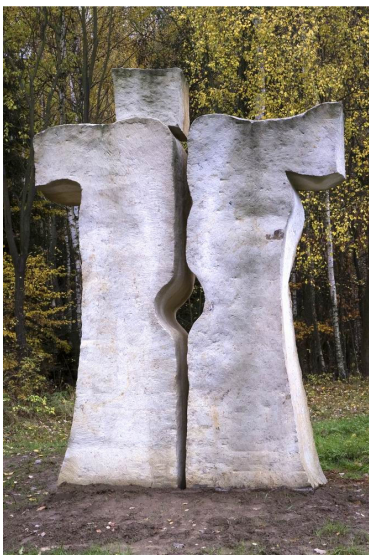
Obr. 28: Kuks, Ivan Jilemnický, 7. Světlo v temnotách