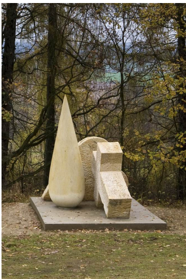
Obr. 30: Kuks, Václav Fiala, 9. Slza