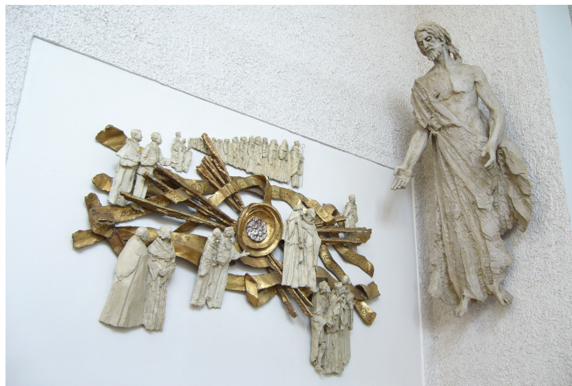
Obr. 10: Lhotka, Karel Stádník, 14. Zmrtvýchvstání Krista