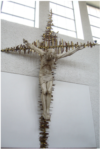
Obr. 8: Lhotka, Karel Stádník, 11. Ukřižování