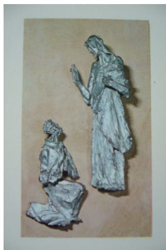
Obr. 2: Olomouc, katedrála sv. Václava, Karel Stádník, 1974