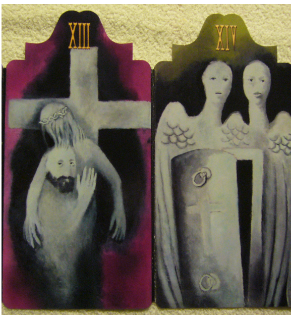
Obr. 21: Konecchlumí, Vladimír Komárek, 13. Snímání, 14. Uložení do hrobu, 2002