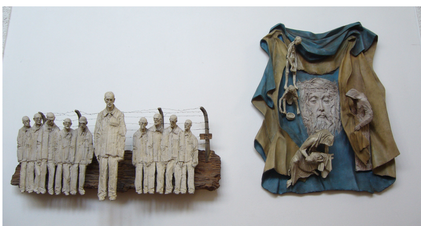
Obr. 6: Lhotka, Karel Stádník, 7. Šimon z Cyrény, 8. Setkání s Veronikou