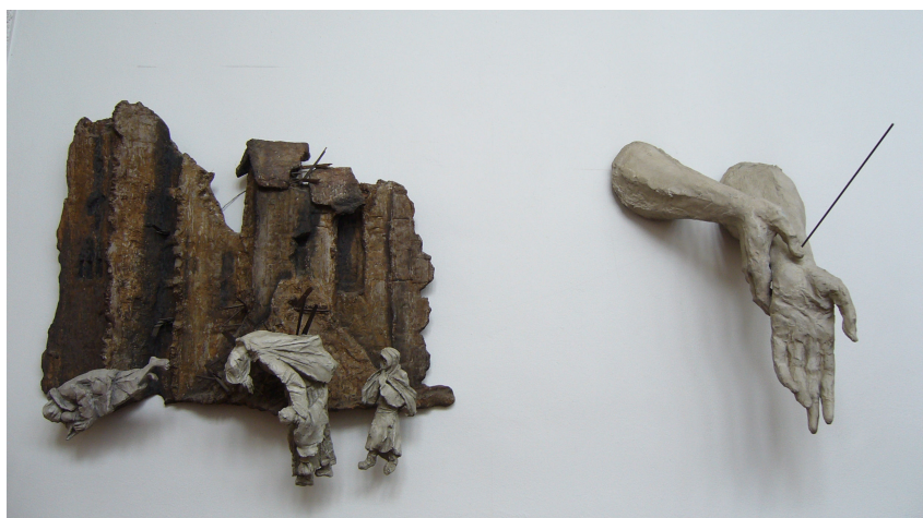
Obr. 7: Lhotka, Karel Stádník, 9. Kristus zbaven roucha, 10. Kristus přibíjen na kříž