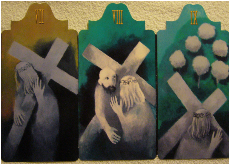
Obr. 19: Konecchlumí, Vladimír Komárek, 7. Ježíš klesá podruhé, 8. Ježíš potkává ženy, 9. Ježíš klesá potřetí, 2002