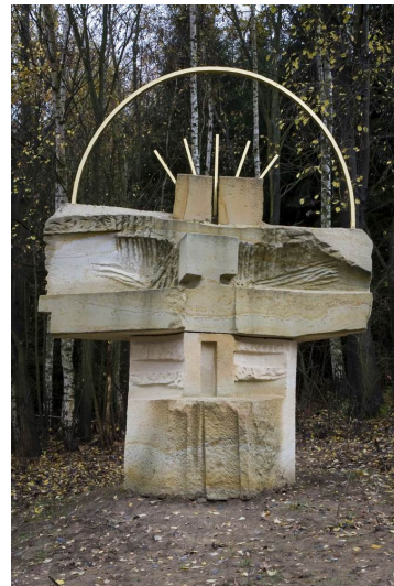
Obr. 27: Kuks, Jan Koblasa, 6. Svatá rodina