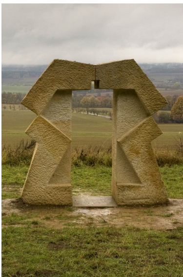
Obr. 35: Kuks, Jaromíra Němcová, 14. Brána naděje