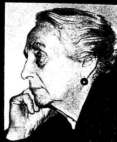
Komunistická poslankyně Dolores Ibárruri