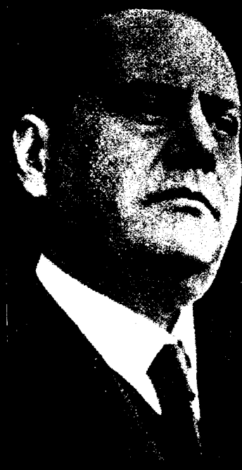
Premiér Juan Negrín (PSOE)