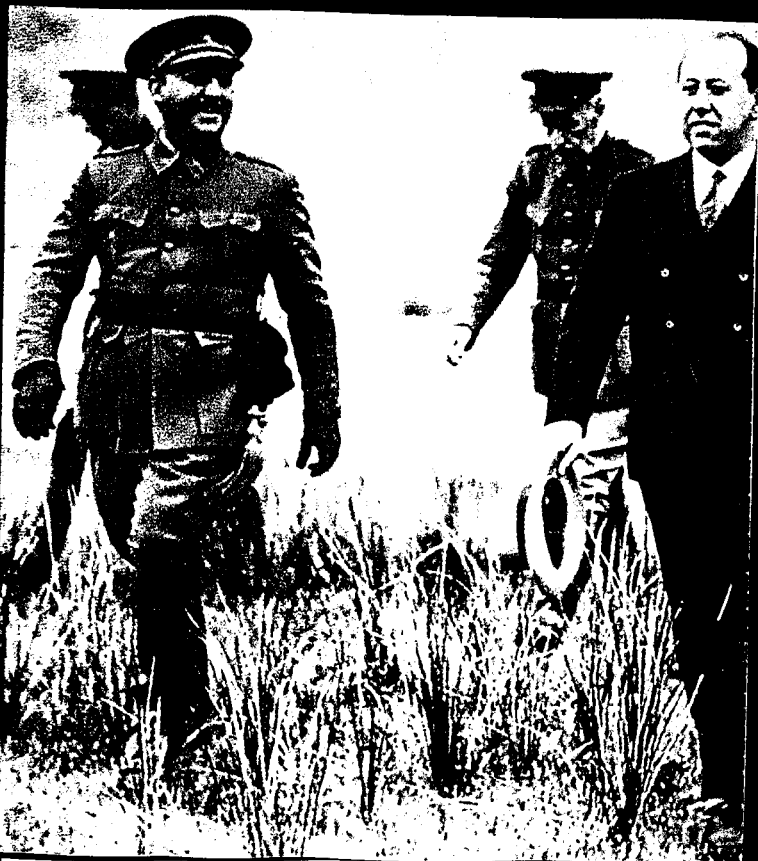
Náčelník generálního štábu Francisco Franco (vl.) a ministr války José María Gil Robles, předák katolické CEDA (1935)