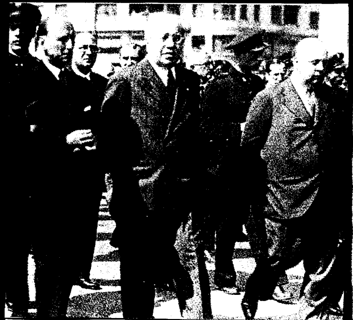
(zl.) Předseda vlády Santiago Casares Quiroga, prezident Manuel Azaña a socialista Indalecio Prieto (1936)