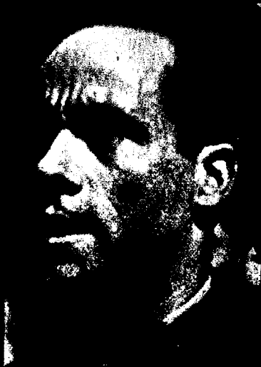
Anarchistický předák Juan García Oliver