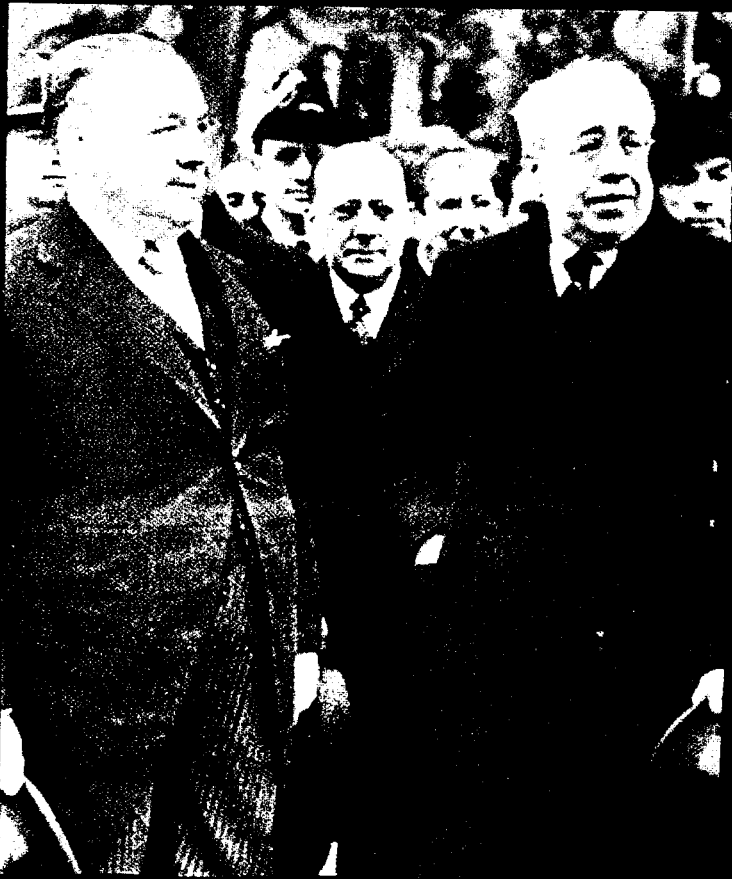
Leader Republikánské unie Diego Martínez Barrio (vl.) a prezident republiky Manuel Azaña (1936)