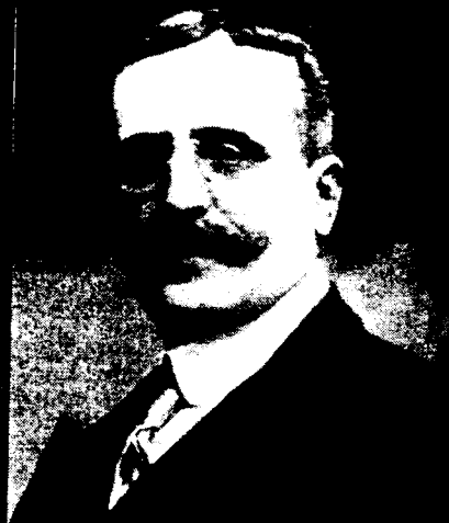
Liberální premiér José Canalejas