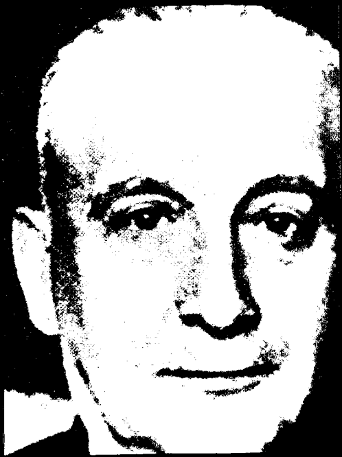
Levicový socialista a generální sekretář UGT Largo Caballero