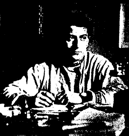
Vůdce POUM Andrés Nin