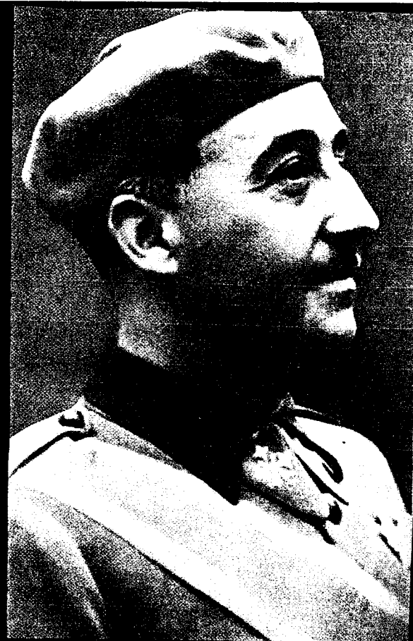
Oficiální portrét generála Franciska Franka jako vládce Španělska (1939)