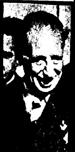
Luis Companys, předák Esquerra