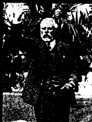
Zakladatel PSOE Pablo Iglesias