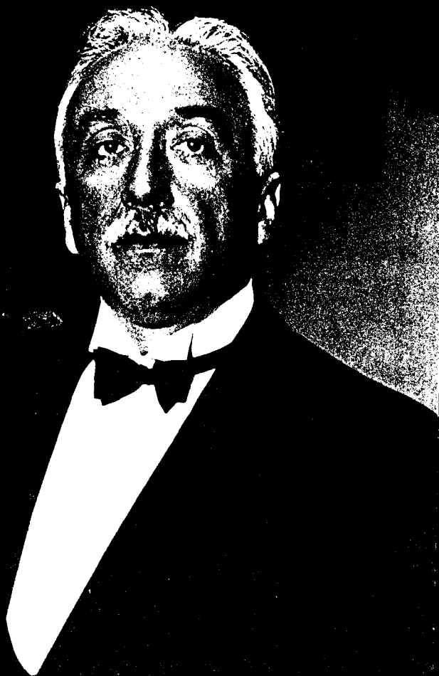
Excmo. Sr. D. Niceto Alcalá Zamora Presidente de la República Española