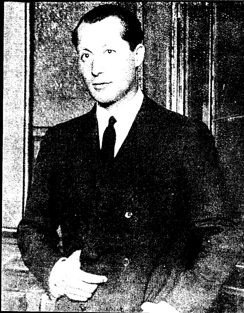
Vůdce fašistické falangy José Antonio Primo de Rivera