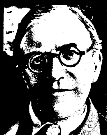
Levicový socialista Julio Alvarez del Vayo