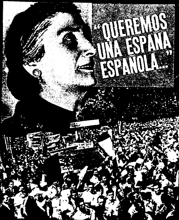
Agitační plakát španělských komunistů – „Chceme španělské Španělsko...“