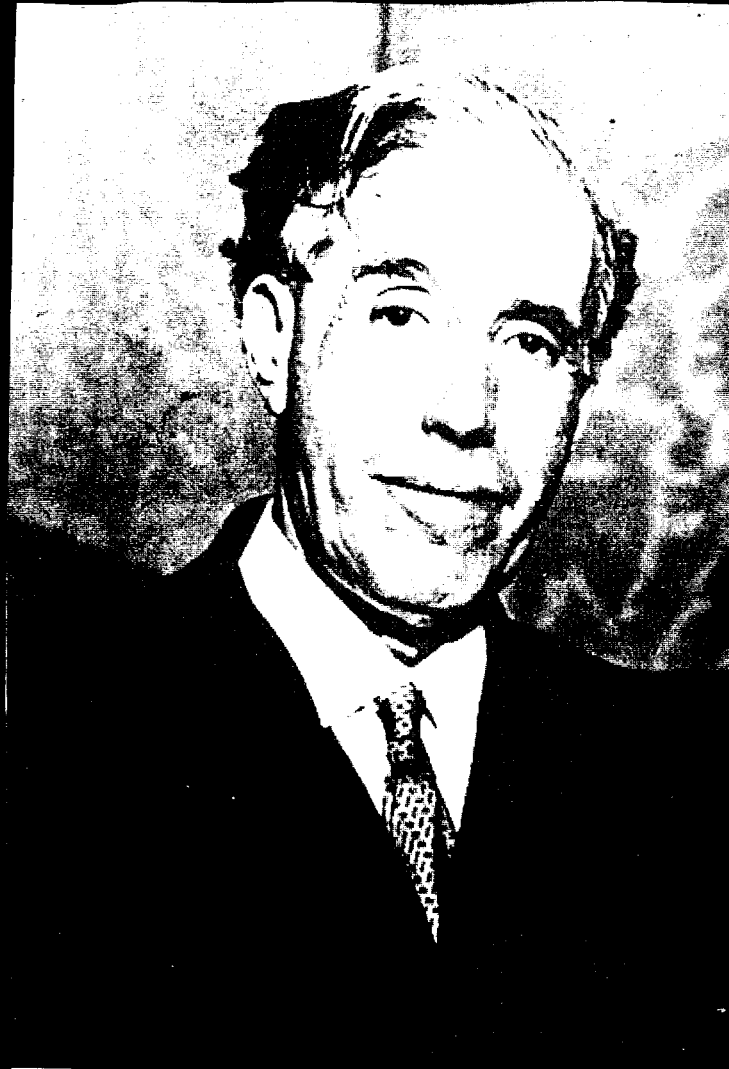
Pravicový socialista a předseda PSOE od roku 1925 Julián Besteiro