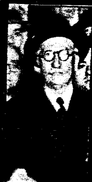
Radikál Alejandro Lerroux