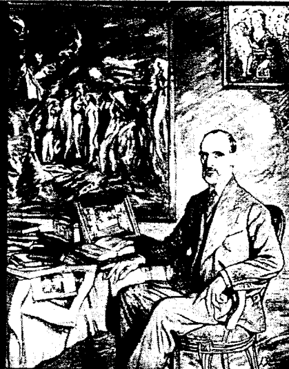
Předák baskické Lligy Francisco Cambó