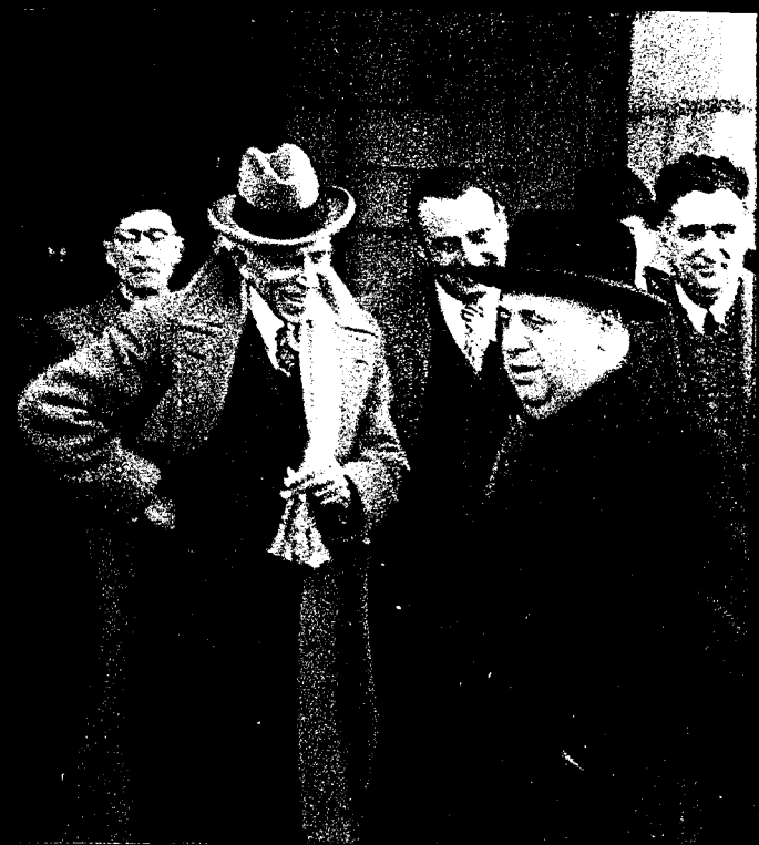
Premiér Manuel Portela Valladares (vl.) v rozhovoru s centristickým socialistou Indaleciem Prietem (1936)