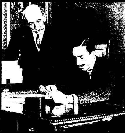
Konzervativní premiér Eduardo Dato s králem Alfonsem XIII. (vpr.)