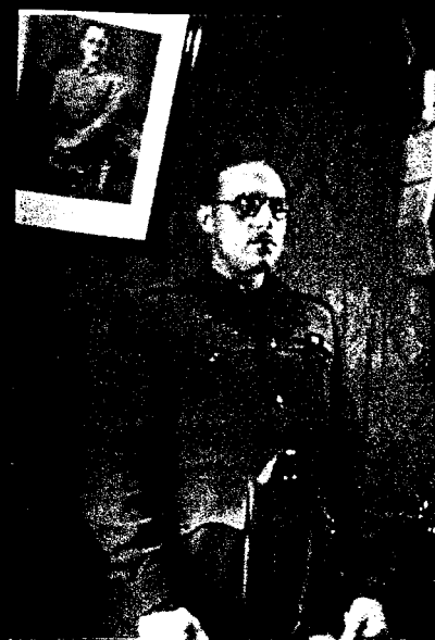
Jeden ze zakladatelů španělského fašismu Ernesto Giménez Caballero