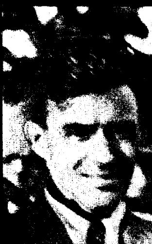
Generální tajemník PCE José Díaz