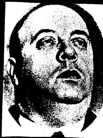
Indalecio Prieto (PSOE)