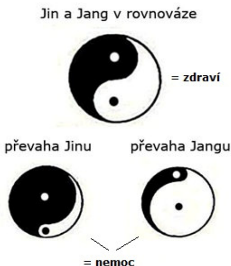
Obr. 2: Jin a Jang (upraveno podle Janča, 1990, str. 61)

Někdy převažuje Jin, jindy Jang, ale žádný z těchto elementů nemůže existovat samostatně. Do sféry principu Jang patří vše kladné, světlo, den, teplo, ale také energie, aktivita, funkce a pohyb. Jedná se o mužský princip. Naproti tomu pod Jin patří vše negativní, tma, noc, chladno, hmota, klid. Jde o ženský princip. Oba principy do sebe vzájemně přecházejí, Jang jako denní princip nastupuje o půlnoci, svého maxima dosahuje ve dne a v poledne pak začíná příchodem Jinu transformace. (Růžička, 1990, str. 12) Porušení rovnováhy mezi zmíněnými principy znamená nemoc a úlohou léčitele je porušenou rovnováhu obnovit a tím obnovit zároveň i optimální funkci organismu jako celku. Podíváme-li se na jednotlivé orgány, tak je z hlediska akupunktury můžeme rozdělit na duté jinové a plné jangové, přičemž mezi duté patří tenké střevo, tlusté střevo, žaludek, žlučník, močový měchýř a obal srdce, mezi plné pak řadíme plíce, srdce, slinivku, ledviny a játra. (Janča, 1990, str. 61)