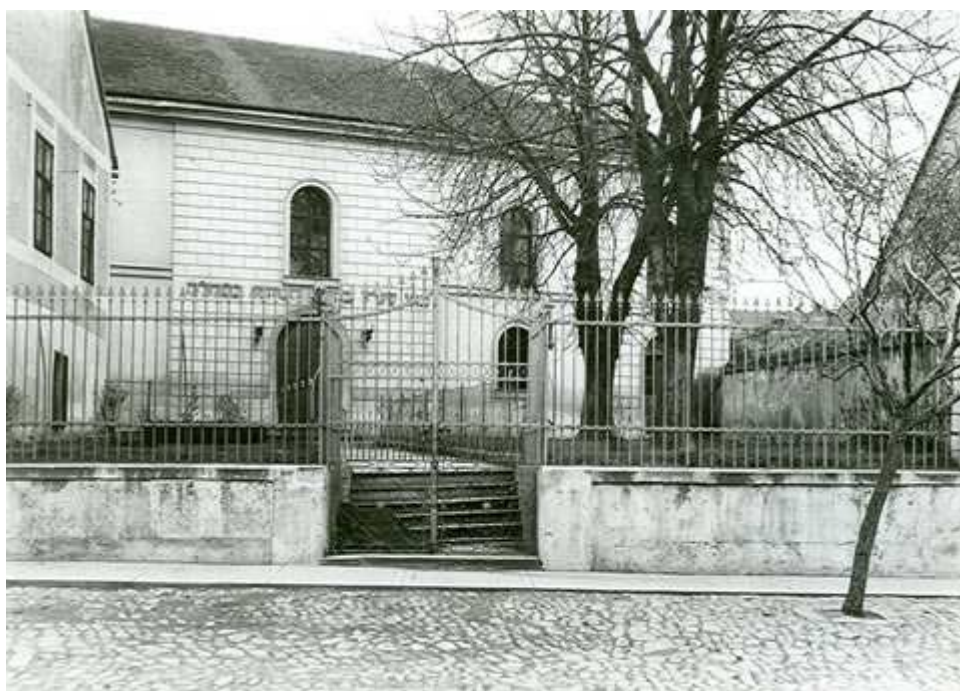
Synagoga postavena r. 1853, vlevo je vidět štít domu rabína