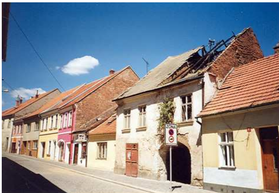
Pohled na severní stranu ulice Jana Schwarze se zchátralou budovou Podivínky