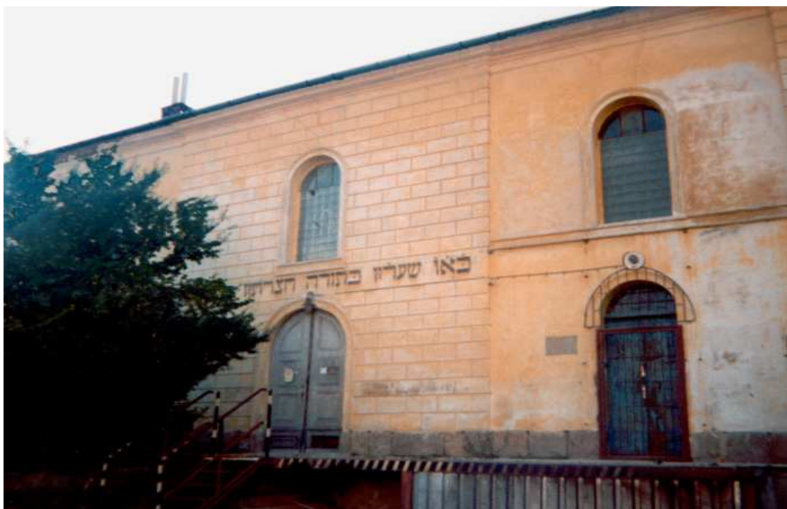
Pohled na Současný stav synagogy