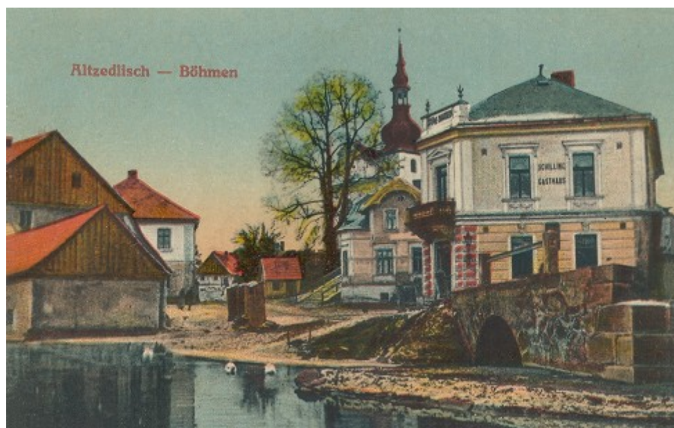
Ilustrace 15: Pohlednice, in: V. BAXA, M. NOVOTNÁ, P. PRÁŠIL, Tachovsko na starých pohlednicích , Hostivice 2008