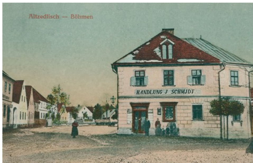
Ilustrace 17: Pohlednice, in: V. BAXA, M. NOVOTNÁ, P. PRÁŠIL, Tachovsko na starých pohlednicích, Hostivice 2008