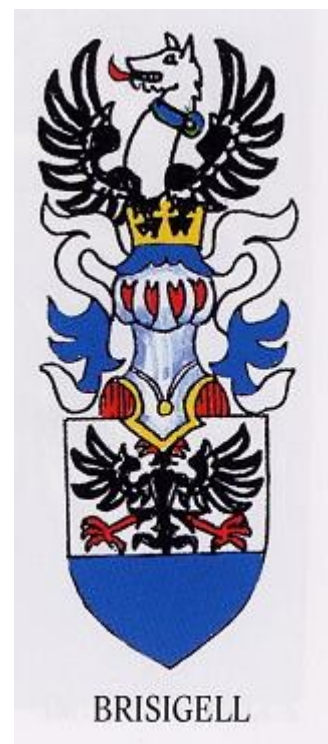
Ilustrace 3: Erb Brisigellů, in: Milan MYSLIVEČEK, Velký erbovník, I.-II., Plzeň 2005