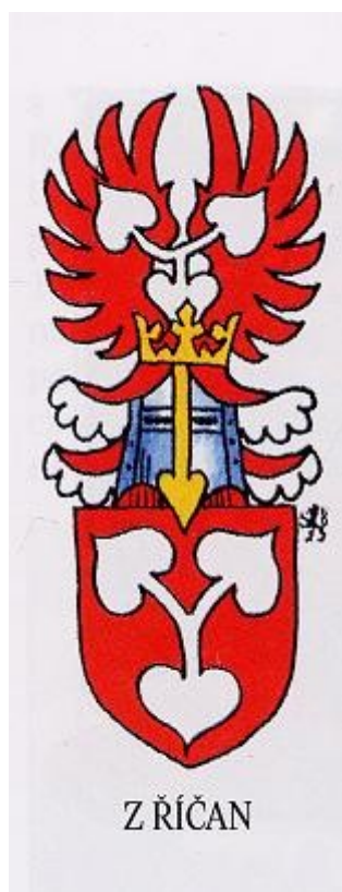
Ilustrace 2: Erb Kavků z Řičan, in: Milan MYSLIVEČEK, Velký erbovník, I.-II., Plzeň 2005