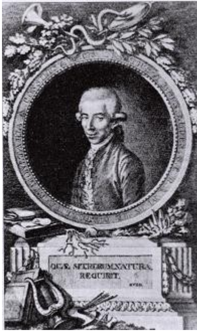
Ilustrace 4: Ignác Born, in: Josef HAUBELT, České osvícenství, Praha 2004