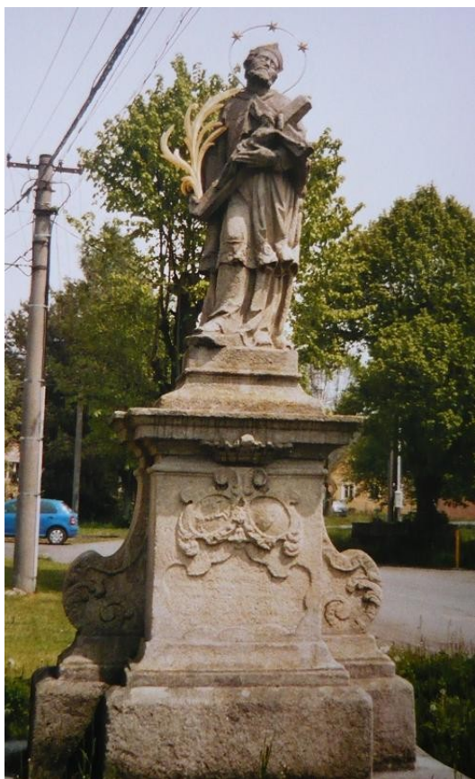
Ilustrace 22: Socha sv. Jana Nepomuckého