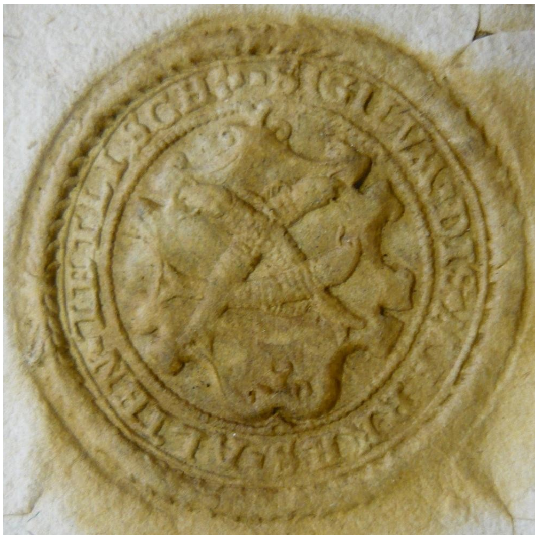
Ilustrace 24: Pečeť Starého Sedliště, rodný list 1697