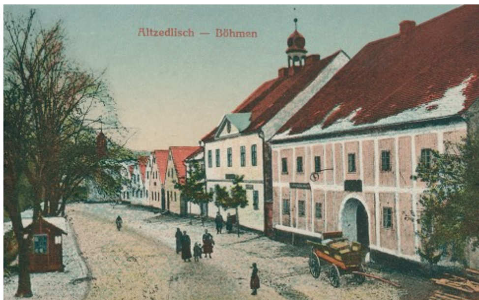
Ilustrace 16: Pohlednice, in: V. BAXA, M. NOVOTNÁ, P. PRÁŠIL, Tachovsko na starých pohlednicích, Hostivice 2008