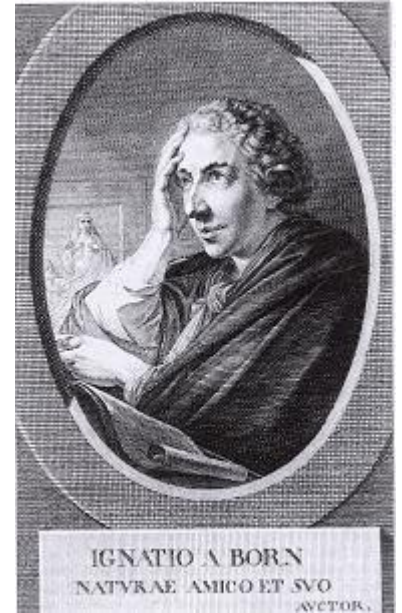
Ilustrace 6: Ignác Born, in: Josef HAUBELT, České osvícenství, Praha 2004