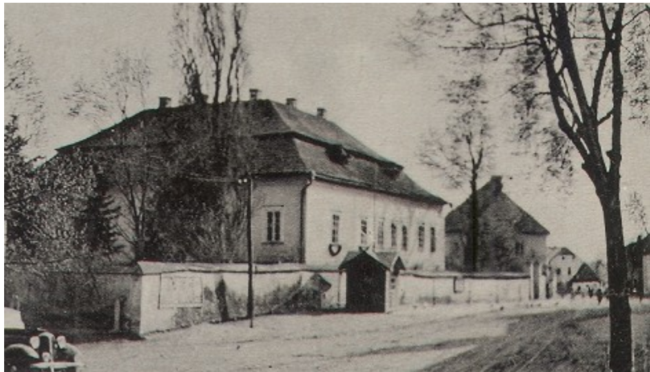
Ilustrace 13: Pohled na zámek, soukromá sbírka