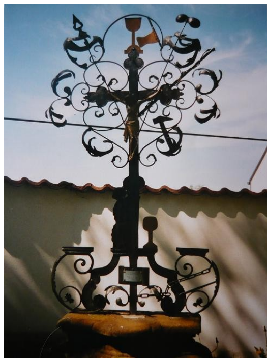
Ilustrace 23: Kříž loupežníka Hanse Tomana