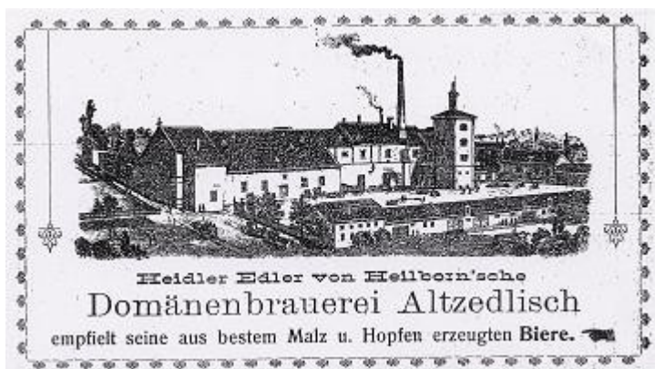
Ilustrace 20: Reklama, panský pivovar, in: Richard MAYER, Adreßbuch für den politischen Bezirk Tachau, Tachov 1925