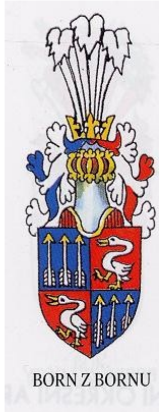
Ilustrace 5: Erb Idnáce Borna, in: Milan MYSLIVEČEK, Velký erbovník, I.-II., Plzeň