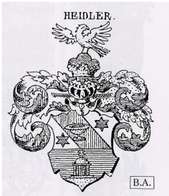
Ilustrace 7: Erb Heidlerů, in: Milan MYSLIVEČEK, Velký erbovník, I.-II., Plzeň 2005