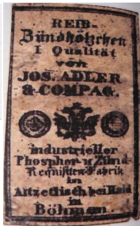
Ilustrace 21: Etiketa sirkárny ze Starého Sedliště, in: Kol. autorů, Český les, Praha 2005