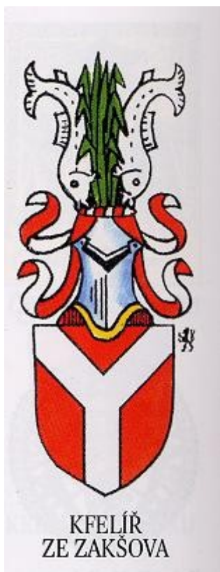
Ilustrace 1: Erb Kfelířů ze Zakšova, in: Milan MYSLIVEČEK, Velký erbovník, I.-II., Plzeň 2005