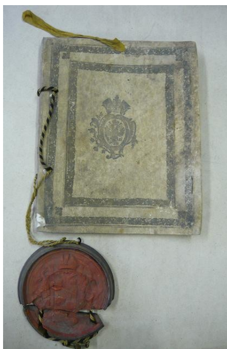
Ilustrace 25: Listina 1784