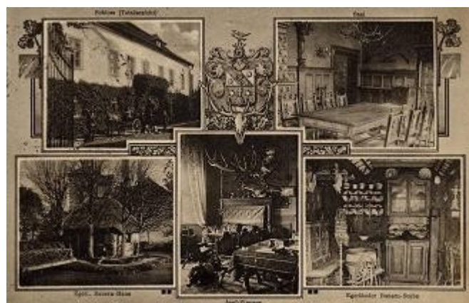
Ilustrace 10: Interiér zámku, soukromá sbírka Vladislav Bartuška