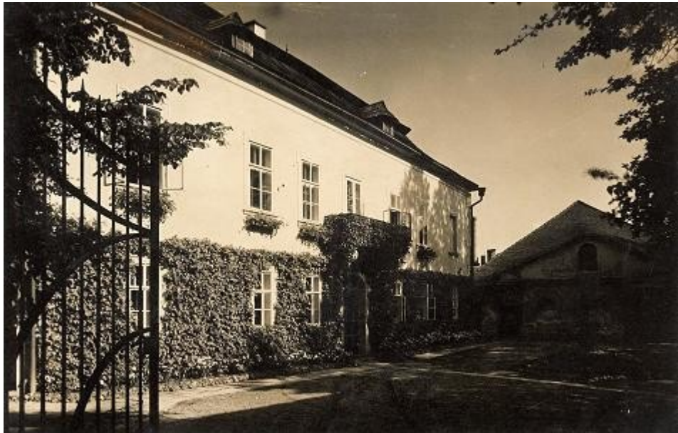
Ilustrace 12: Zámek, in: SOA v Plzni, Rodinný archiv Unterrichterů, F178