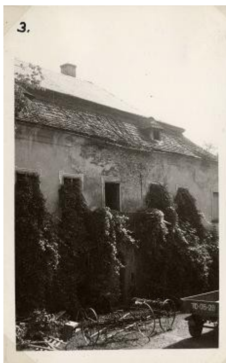
Ilustrace 11: Zámek před demolicí, in: Fotopříloha k obecní kronice Starého Sedliště