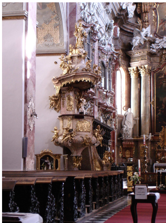
12. Brno, kazatelna v kostele Panny Marie, 1743