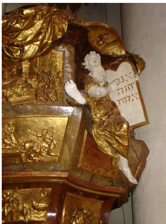
6. Praha, Staré Město, kazatelna v kostele sv. Klimenta, Mojžíš, Matyáš Bernard Braun,