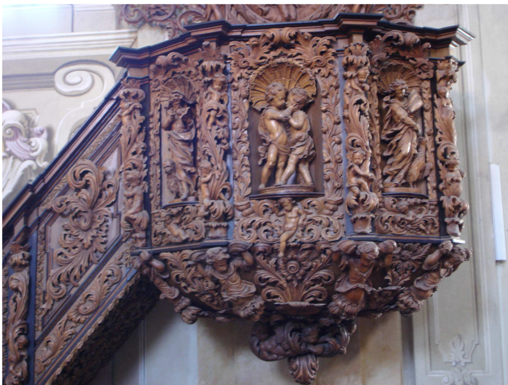
16. Nová Říše, kazatelna v kostele sv. Petra a Pavla, řečniště, kolem 1700