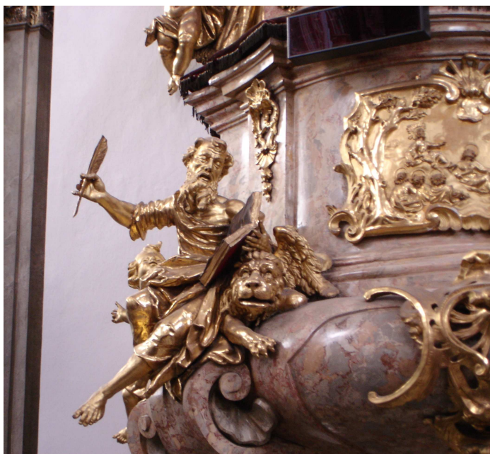
13. Brno, kazatelna v kostele Panny Marie, evangelista Marek, 1743