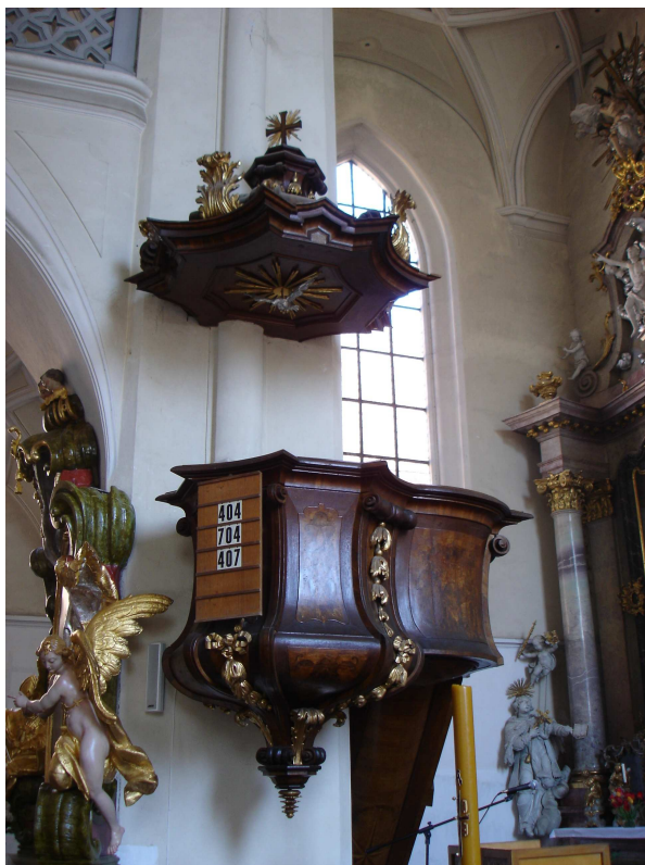
17. Želiv, kazatelna v kostele Narození Panny Marie, F. Neth z Humpolce, před 1725