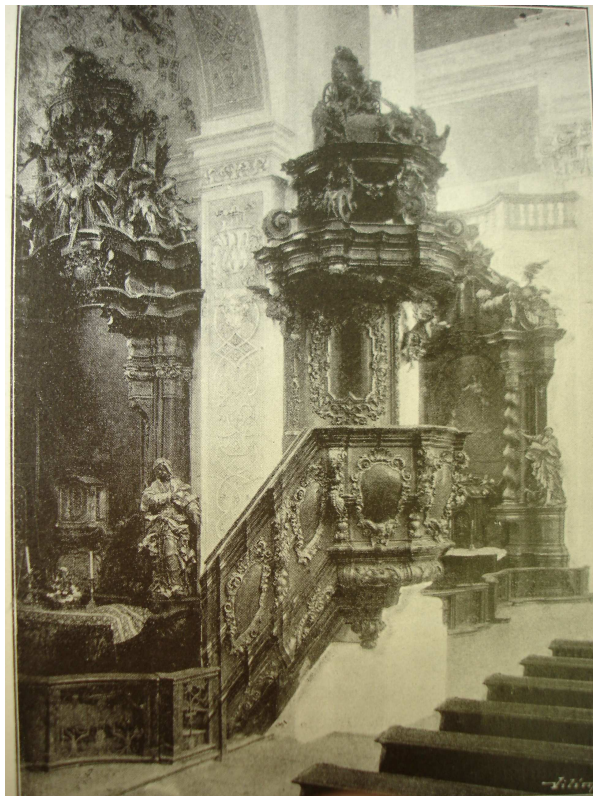
9. Klatovy, kazatelna v kostele Neposkvrněného početí Panny Marie a sv. Ignáce, Michal Koller, 1720