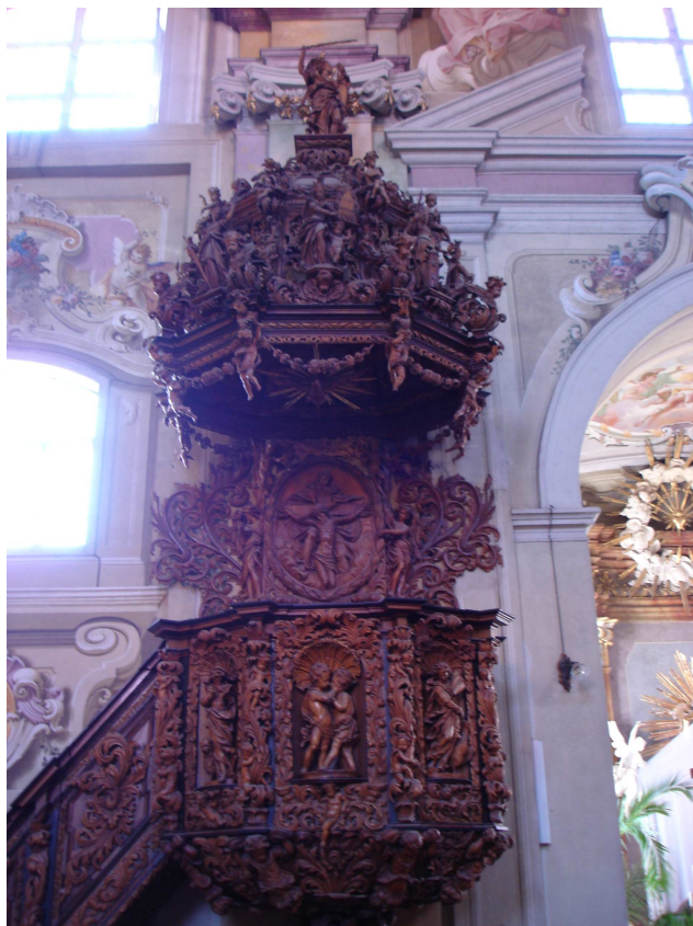
15. Nová Říše, kazatelna v kostele sv. Petra a Pavla, kolem 1700