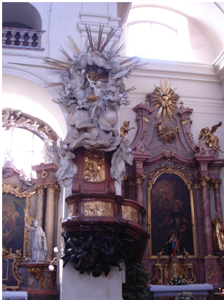
25. Brno, kazatelna v kostele sv. Michala, Josef Winterhalder st., 1745