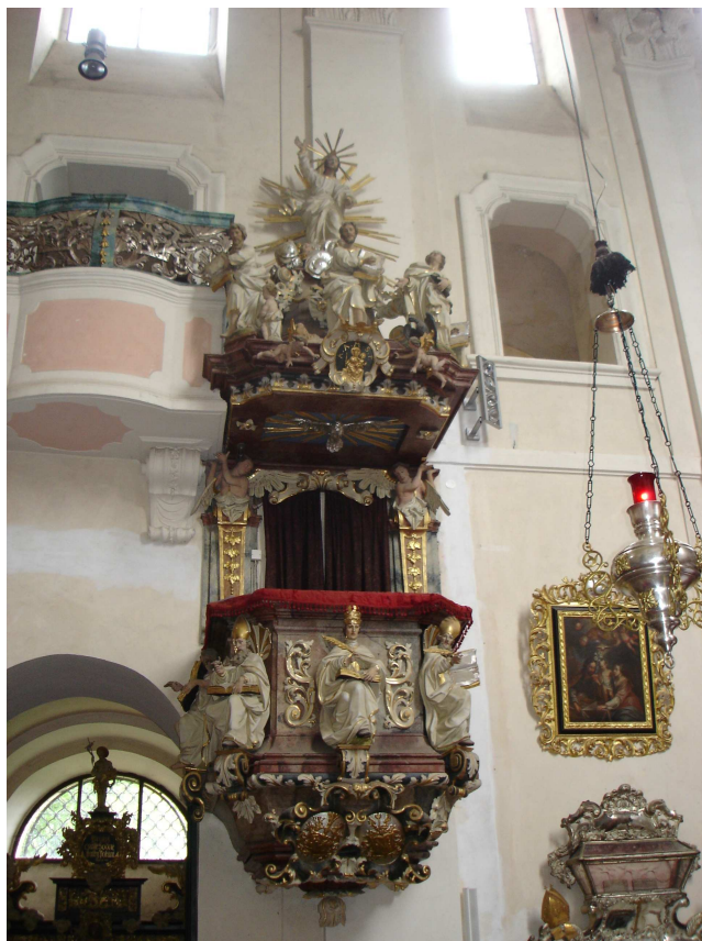
19. Sázava, kazatelna v kostele sv. Prokopa