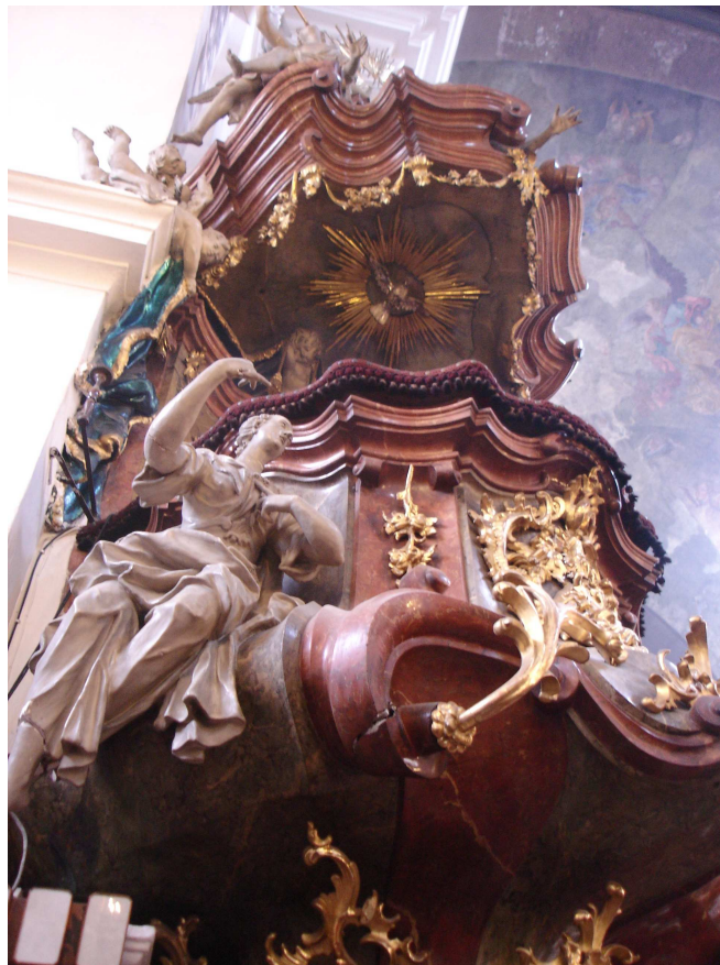
11. Jihlava, kazatelna v kostele sv. Ignáce, T. Süssmayer, 1771