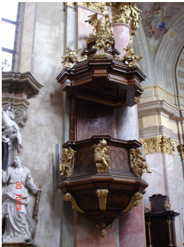
21. Rajhrad, kazatelna v kostele sv. Petra a Pavla