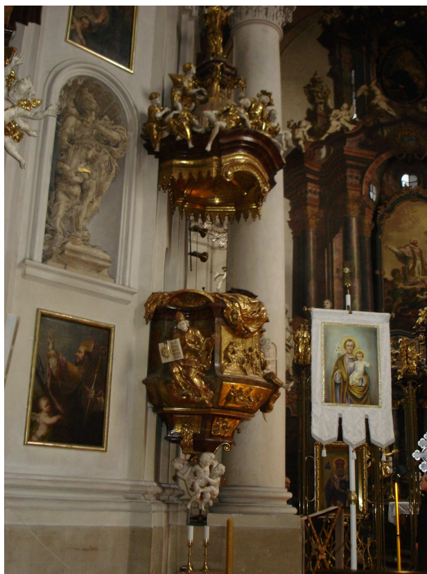
5. Praha, Staré Město, kazatelna v kostele sv. Klimenta, Matyáš Bernard Braun, 1720