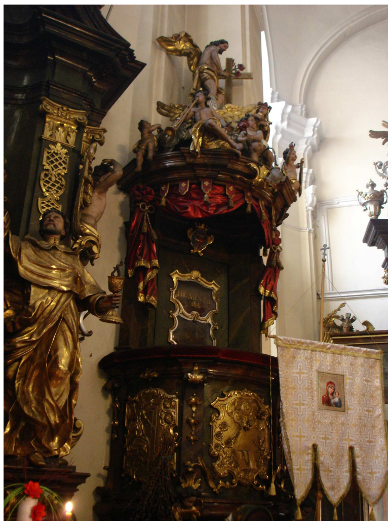
27. Plzeň, kazatelna v kostele sv. Anny , kolem poloviny 18. století