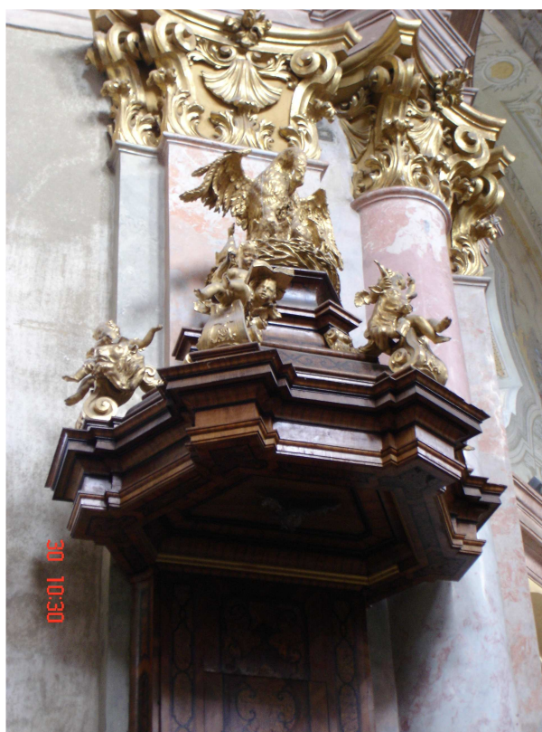
22. Rajhrad, kostel sv. Petra a Pavla, stříška