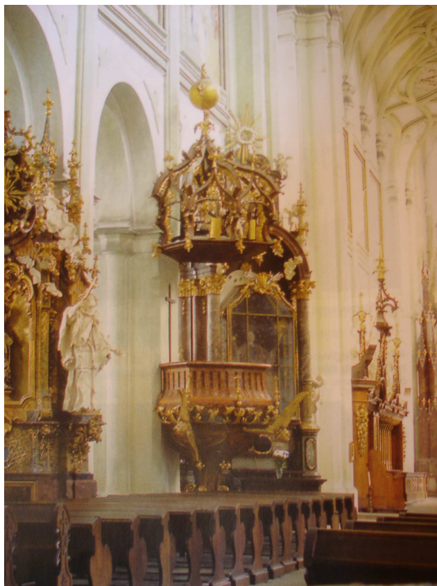
23. Kladruby, kazatelna v kostele Panny Marie, Jan Blažej Santini