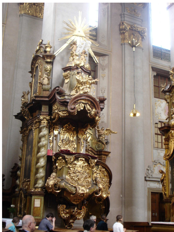
24. Praha, Staré Město, kazatelna v kostele sv. Jiljí, František Ignác Weiss, 1753