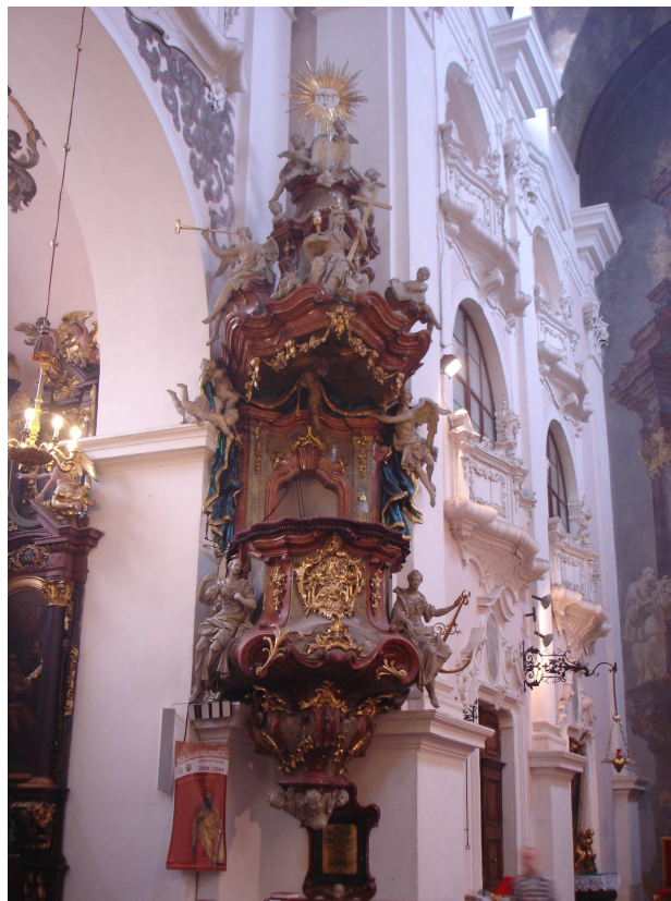
10. Jihlava, kazatelna v kostele sv. Ignáce, T. Süssmayer, 1771