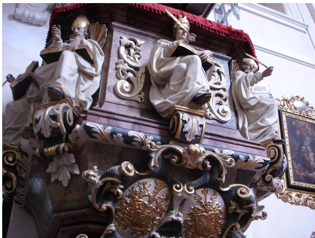
20. Sázava, kazatelna v kostele sv. Prokopa, řečniště