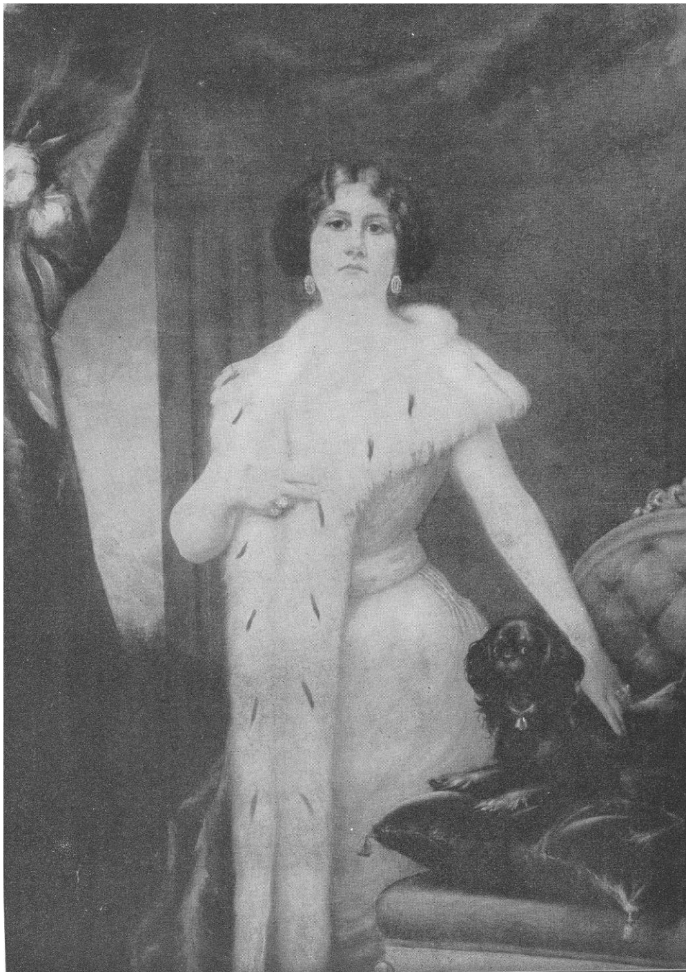
4. Vladimír Šamberk: Portrét Emy Destinové, první polovina 20. Století, olej, plátno, (?), Muzeum hlavního města Prahy.