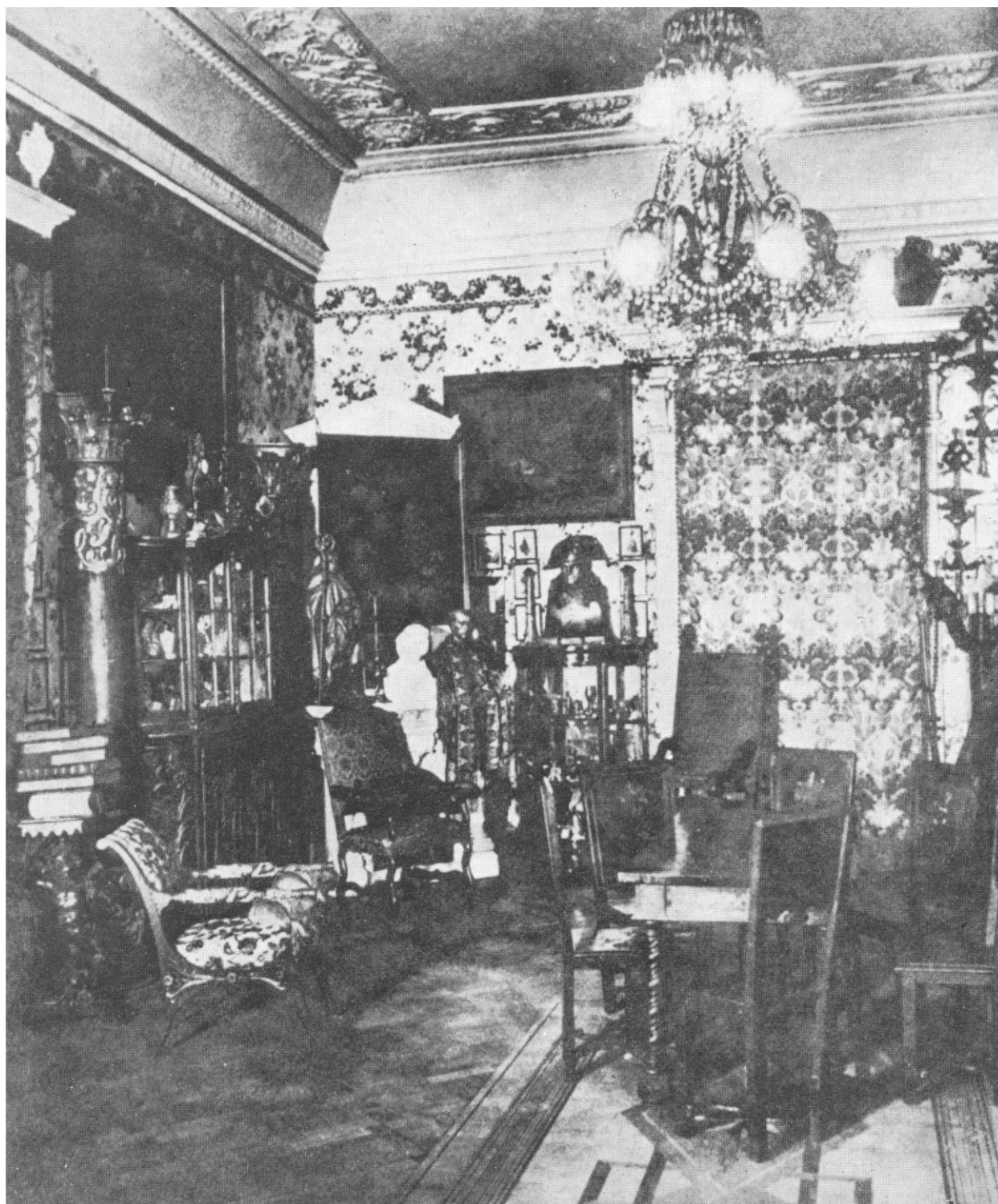
7. Stráž nad Nežárkou, Napoleonský salon, po roce 1914.