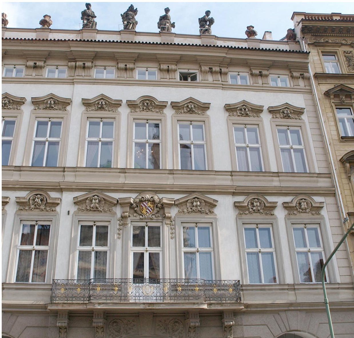
2. Praha, Kaiserštejnský palác, současný stav, frontální pohled.