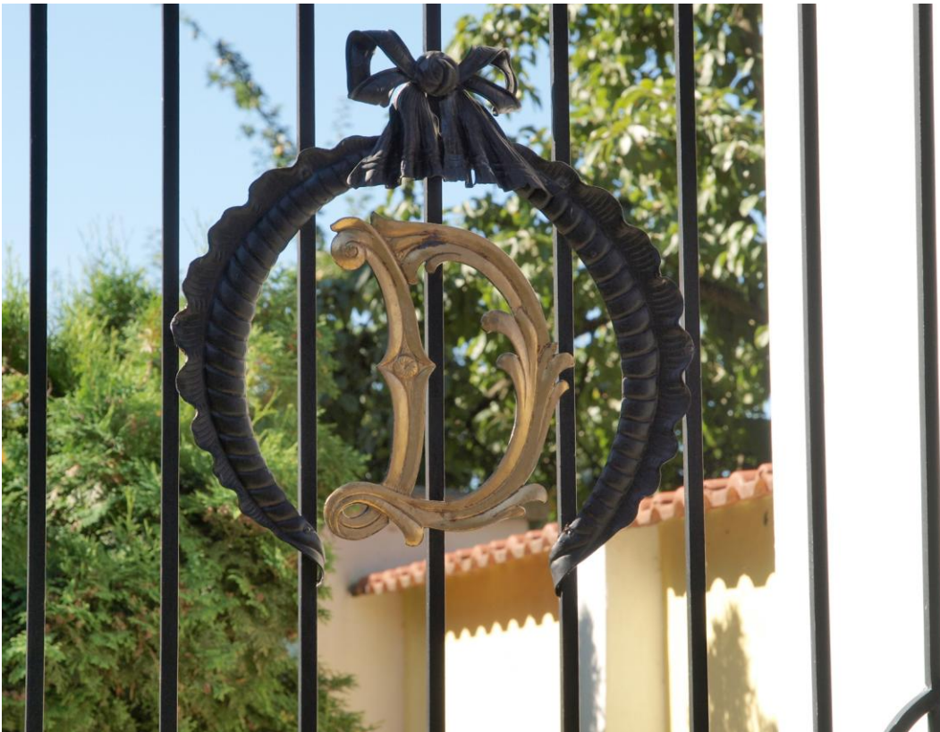
6. Stráž nad Nežárkou, iniciály „ED“ na zámeckých vratech z let 1919, současný stav, frontální pohled.