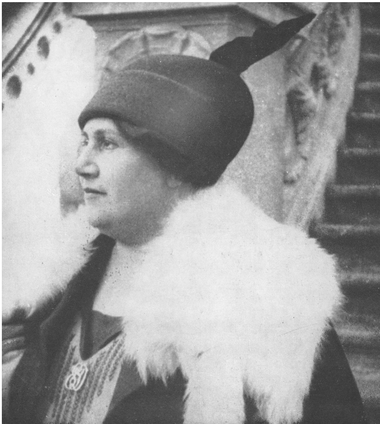
1. Portrét Emy Destinnové na zámeckých schodech ve Stráži nad Nežárkou, po roce 1920.