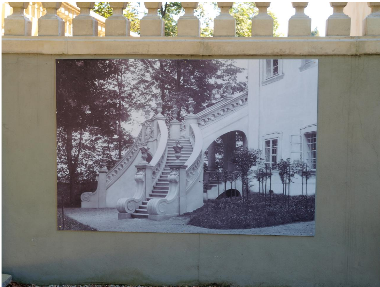
5. Stráž nad Nežárkou, fotografie znázorňující původní zámecké schodiště dle projektu Emy Destinnové, současný stav, frontální pohled.