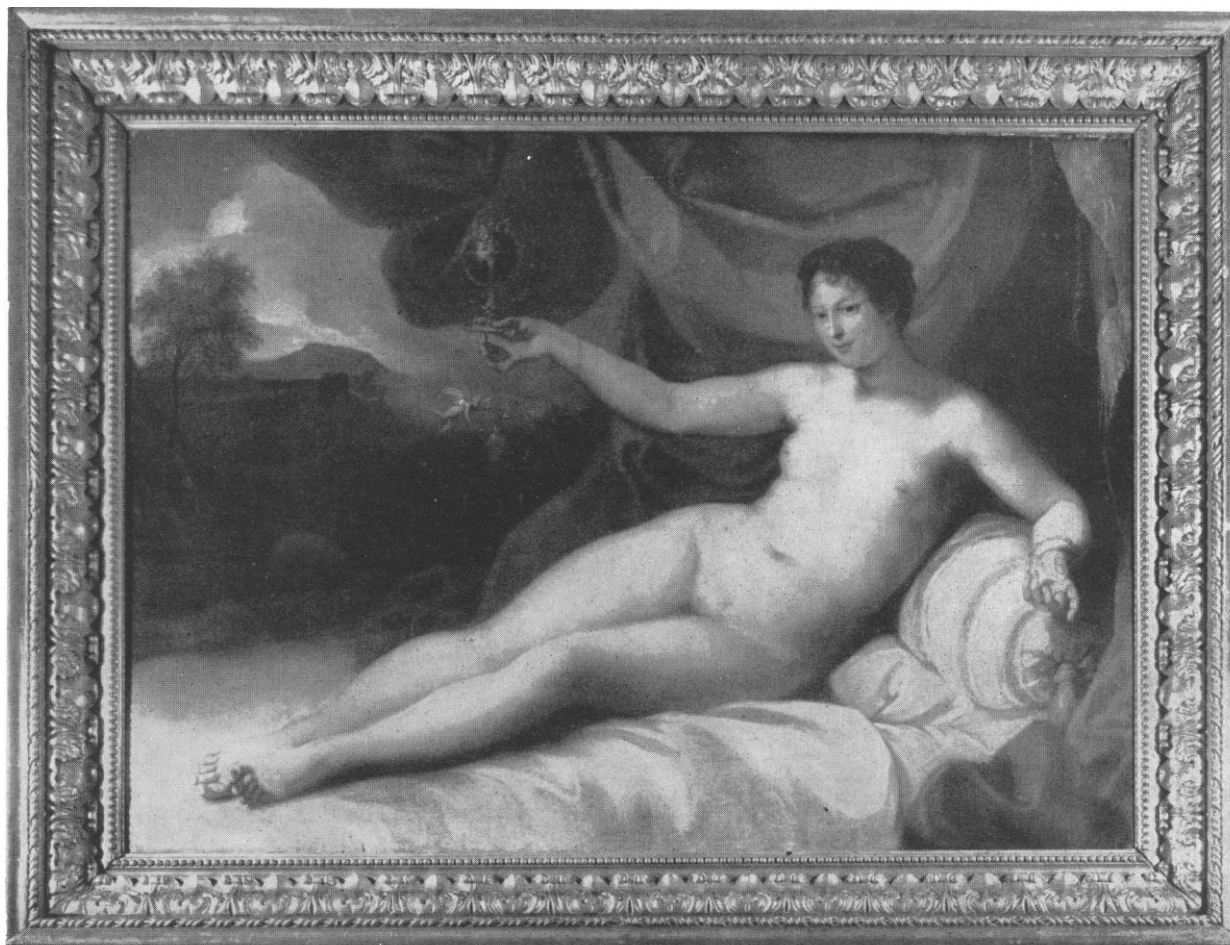
1. George Romney: Venuše, 1779, olej, plátno, 130 x 180 cm. Národní galerie v Praze.