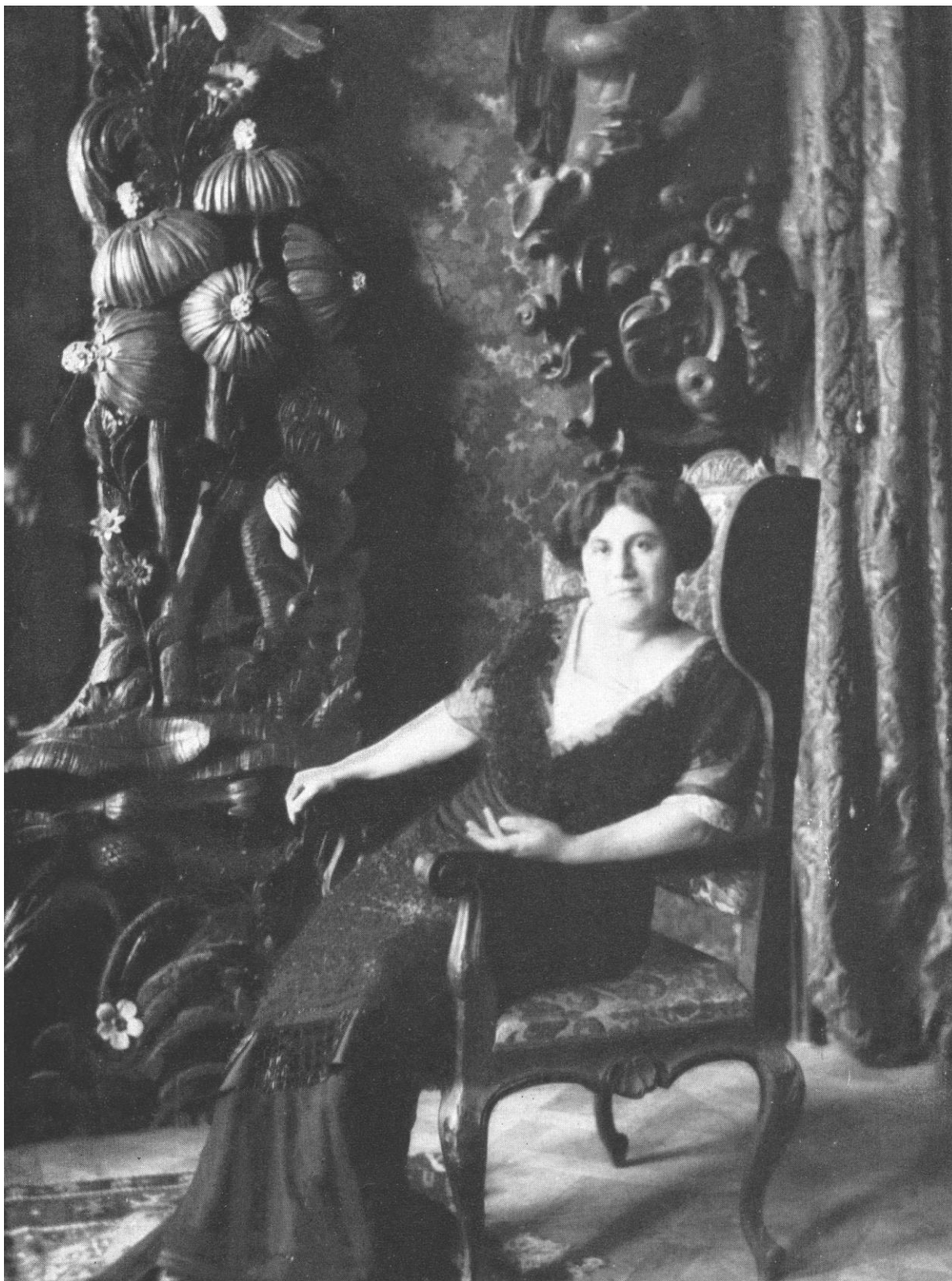
4. Portrét Emy Destinové v interiéri zámku ve Stráži nad Nežárkou, kolem roku 1920.