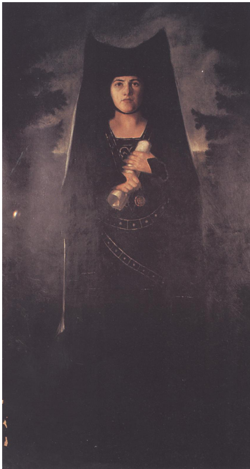
5. Alfréd Cerigioli: Strážská Černá paní, 1922, olej, plátno, 210 105 cm. Divadelní oddělení Národního muzea v Praze.