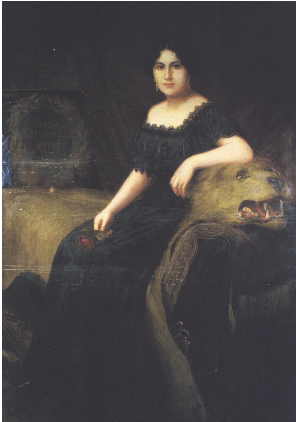
3. Adolf Hering: Portrét Emy Destinnové, 1908, olej, plátno, 115 x 160 cm. Divadelní oddělení Národního muzea v Praze.