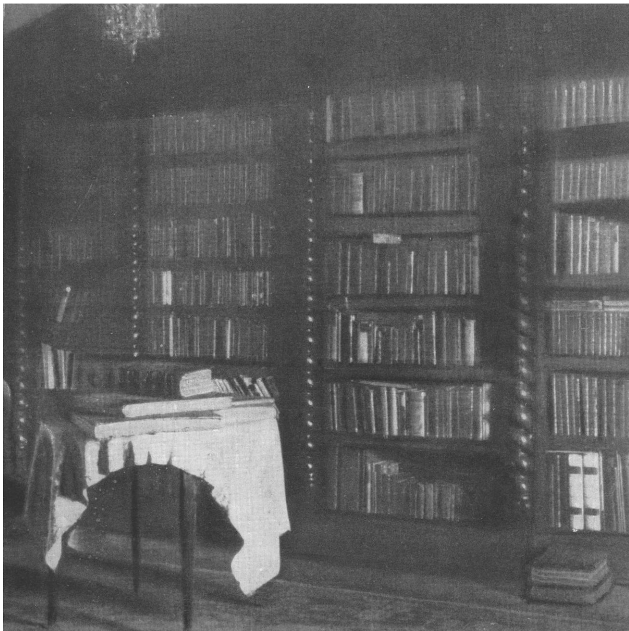
8. Stráž nad Nežárkou, zámecká knihovna, po roce 1914.