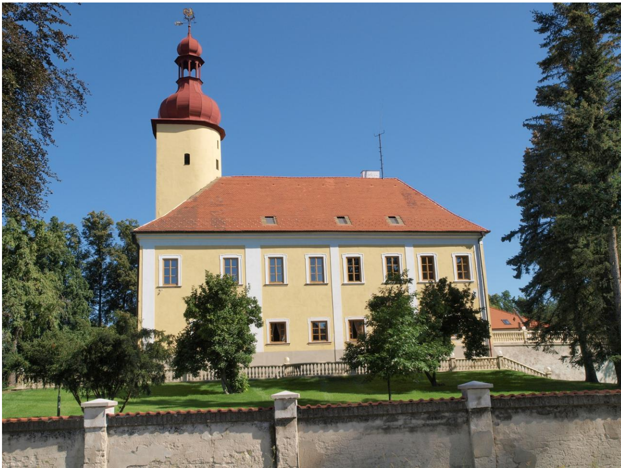
3. Stráž nad Nežárkou, zámek Stráž nad Nežárkou, současný stav, pohled z boku.