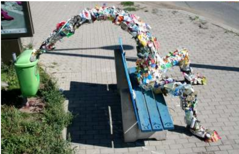
[16] Brad Downey Praha (Namesfest), 2008