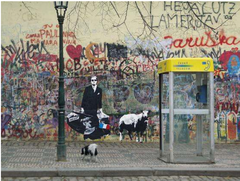
[15] Blek le Rat: The Man Who Walks through Walls Praha