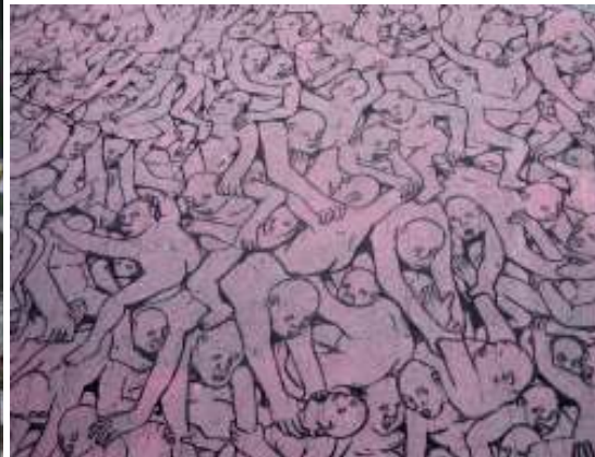
[6] Blu Berlin (vpravo detail)