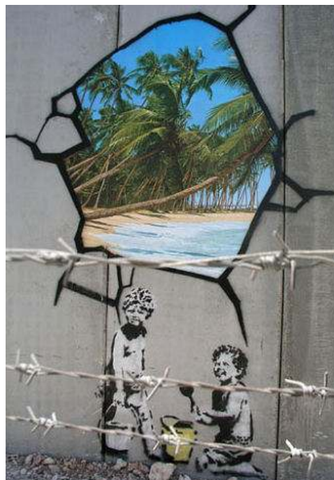
[12] Banksy Izraelská bezpečnostní bariéra