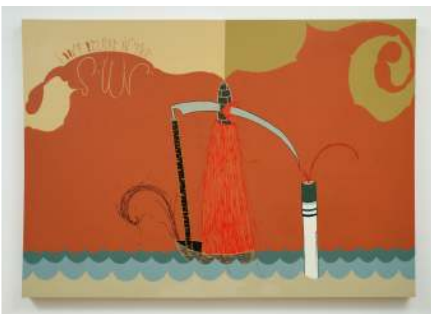
[24] Jakub Hošek: I Don't Believe in the Sun, 2005 akryl na plátně, 135 x 200 x 8 cm