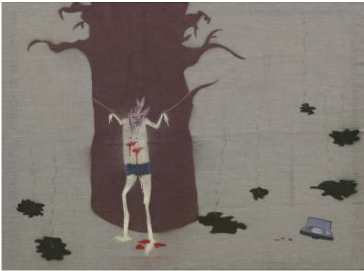
[27] Lad'a Gažiová: Bez názvu, 2005 sprej na plátně, 110 x 150 cm