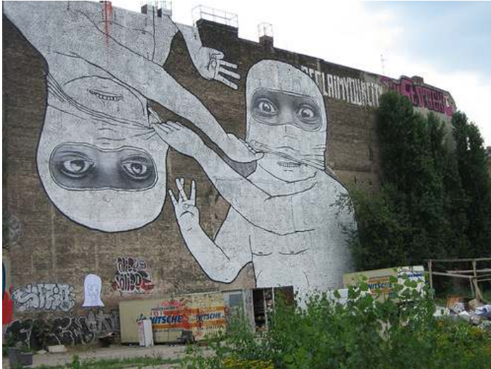
[7] Blu a JR Berlin