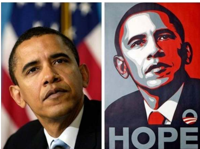
[14] vpravo – Shepard Fairey: "HOPE" poster, vlevo – : Barack Obama