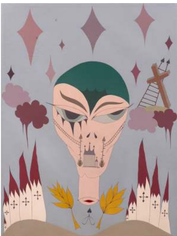
[26] Anežka Hošková: Inmortalidad, 2006 akryl na plátně, 88 x 120 cm