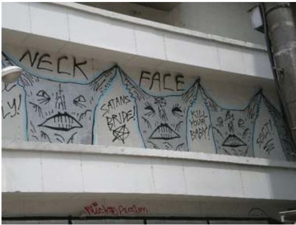
[3] Neck Face Tokyo