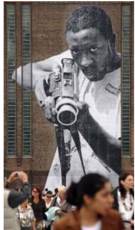
[8] JR Londýn (výstava v Tate Modern), 2008