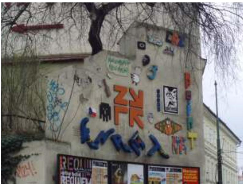
[21] Pouliční galerie street artu Praha