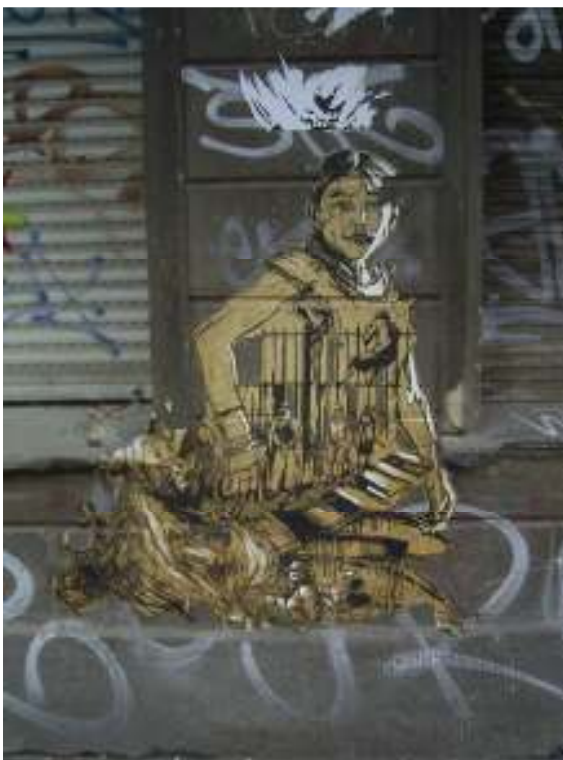
[9] Swoon Berlín