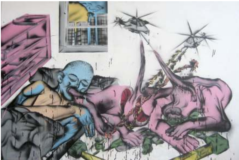
[28] Jakub Matuška (Masker): Dobré ráno v N.Y., 2008 akryl, sprej, plátno 15 x 170 cm