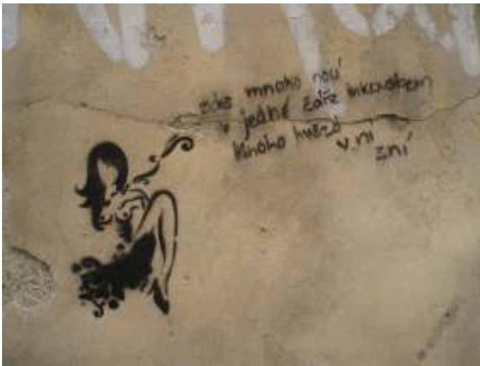
[20] Pathetists Praha