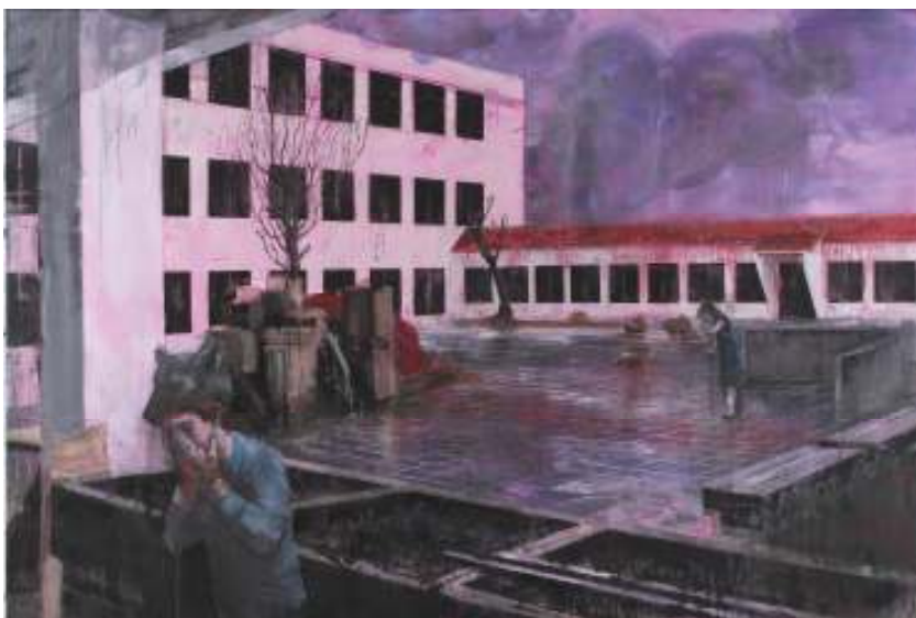
[22] Josef Bolf: Atrium II, 2009 olej, vosk a tuš na plátně, 175 x 260 cm