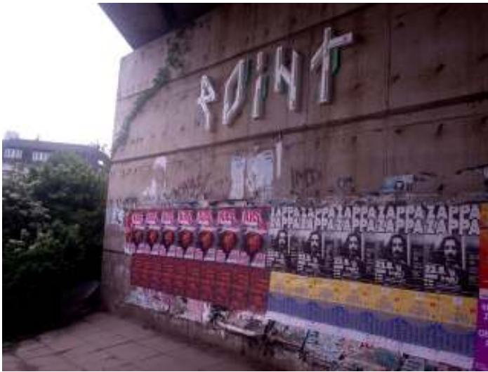
[19] Point Praha