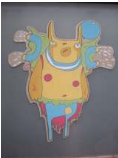
[17] Pash* Praha