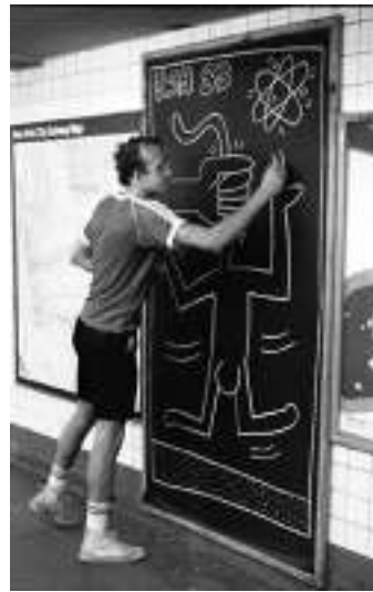
[2] Keith Haring New York City (tvorba na reklamní tabule v metru), 1983