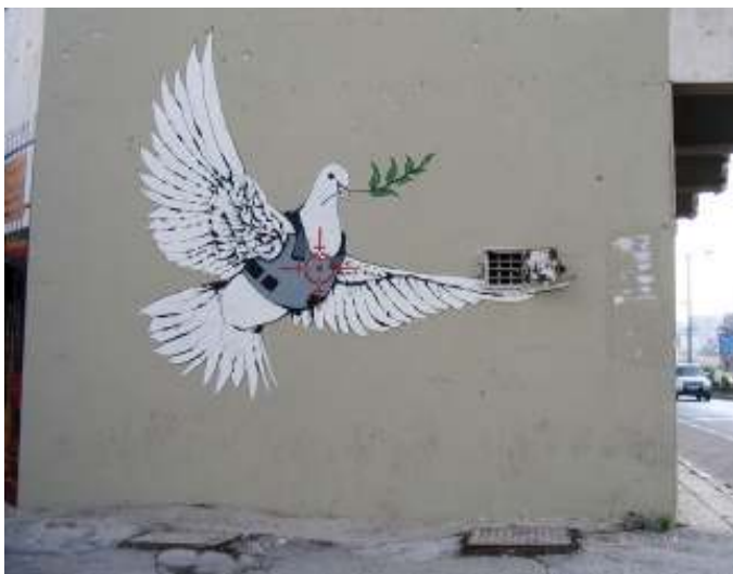
[11] Banksy Betlém