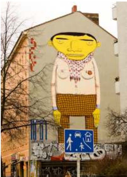
[4] Os Gêmeos Berlin