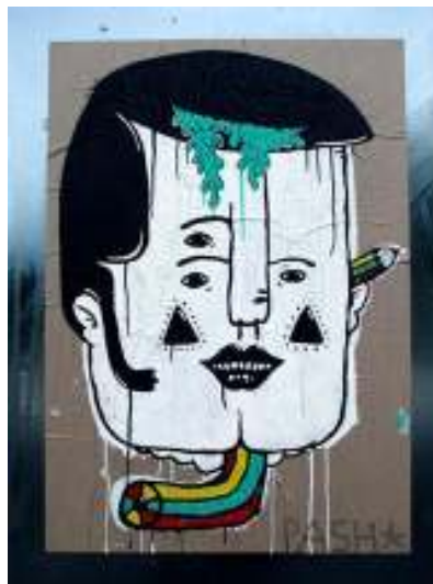
[18] Pash* Praha