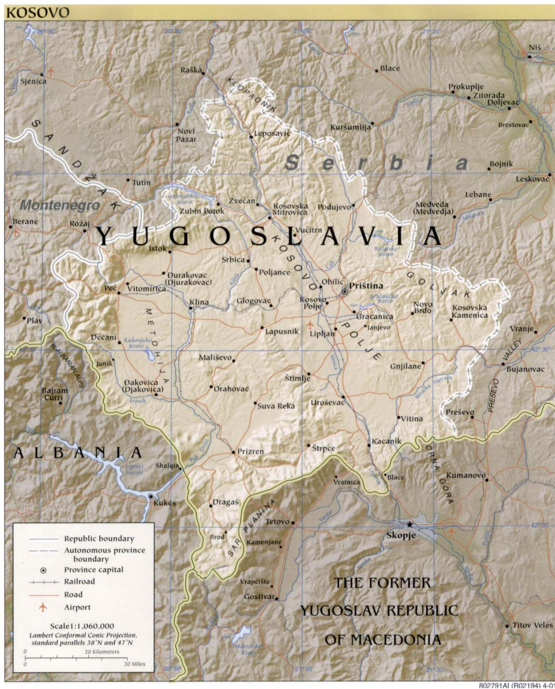
Príloha č. 5: Geografická mapa Kosova