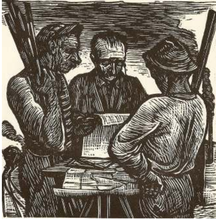
7. Ilustrace k Nerudovým Trhanům, 1943, dřevoryt, papír, 10 x 10 cm, NG