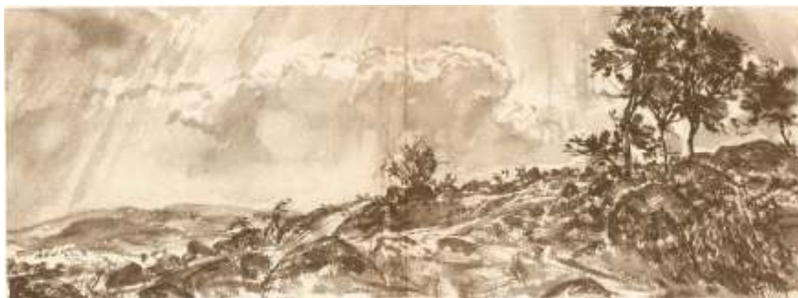
12. Krajina na Petrovicku, ilustrace k publikaci Obzory, 1957, lavírovaná tuš