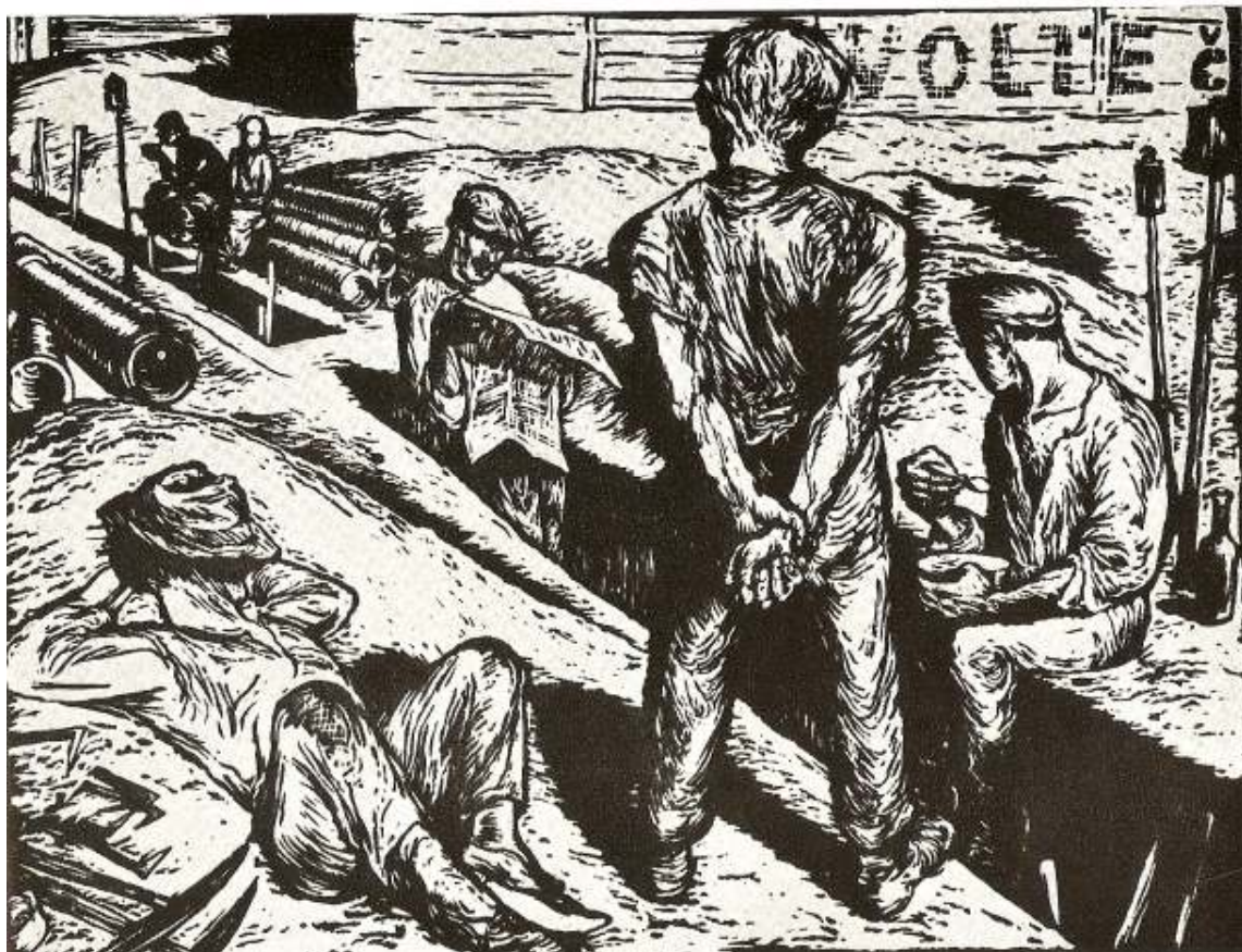
3. Stavba vodovodu, 1924, linoryt, 31 x 39,7 cm, papír, dílo nedostupné