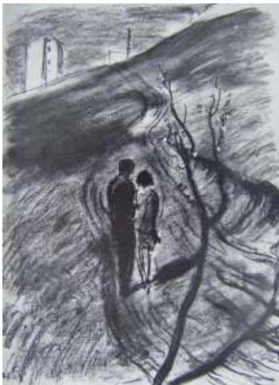
2. Milenci, 1926, uhl, papír, 31 x 22, dílo nedostupné