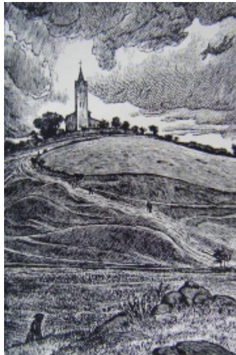
8. Frontispice k Obděnické pouti, 1952, dřevoryt