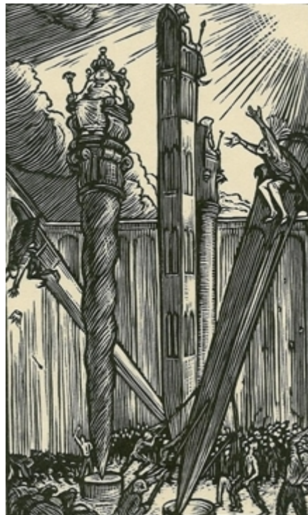
6. Ilustrace ke Komenského Labyrintu, 1940, dřevoryt