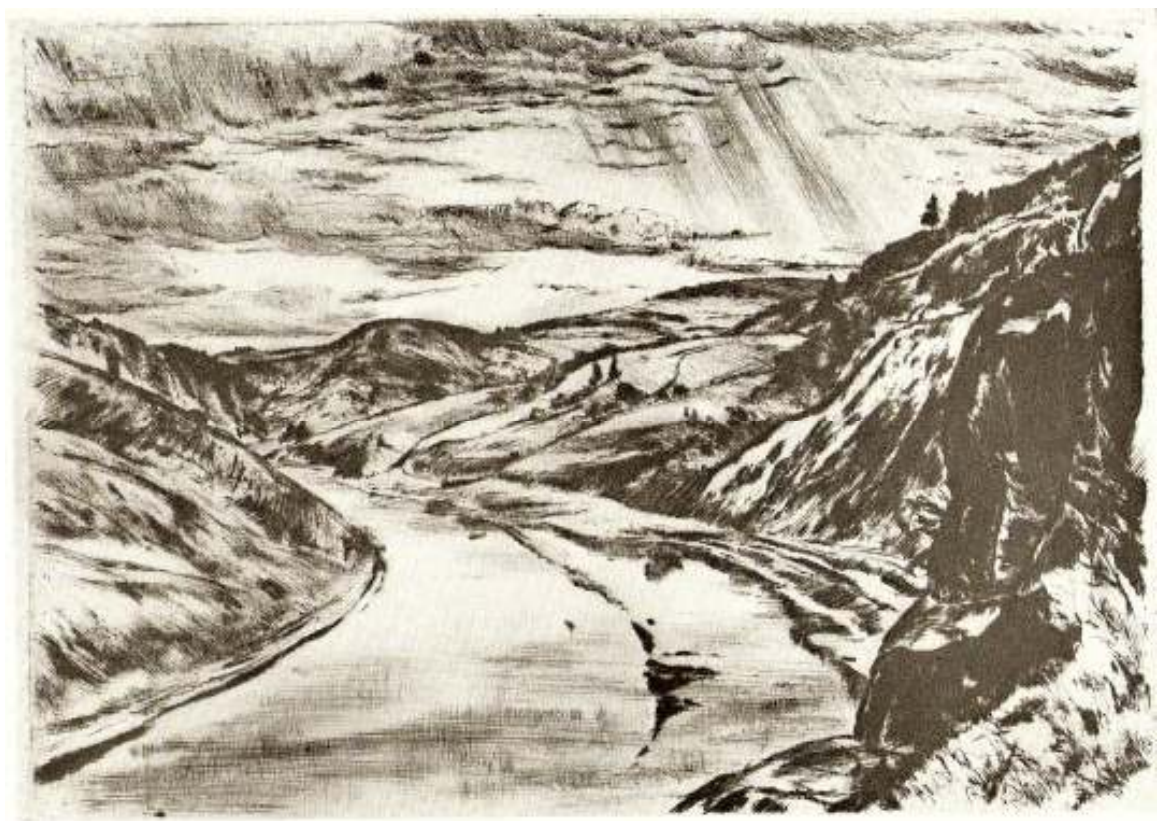
10. Vltava u Moráně, 1953, suchá jehla, papír, 23 x 31,5cm. NG