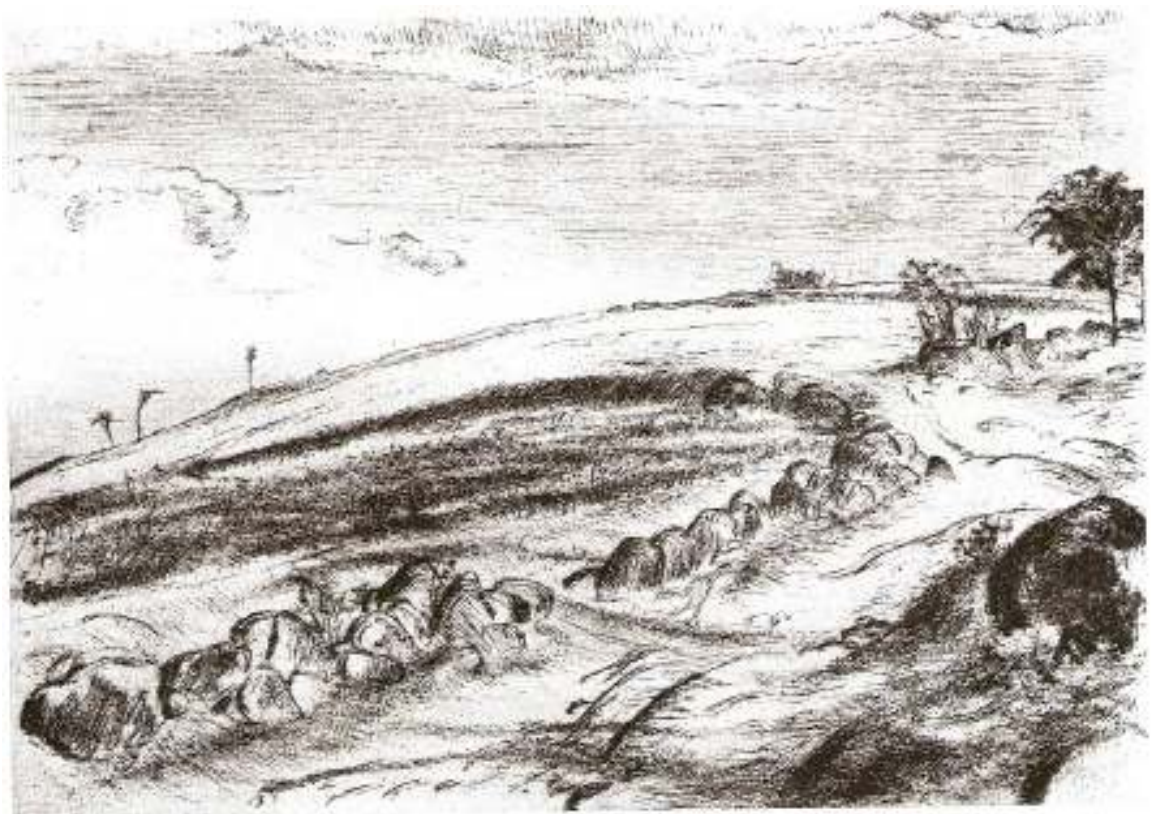
9. Cesta s tarasem, 1949, suchá jehla, papír, 15 x 22. NG