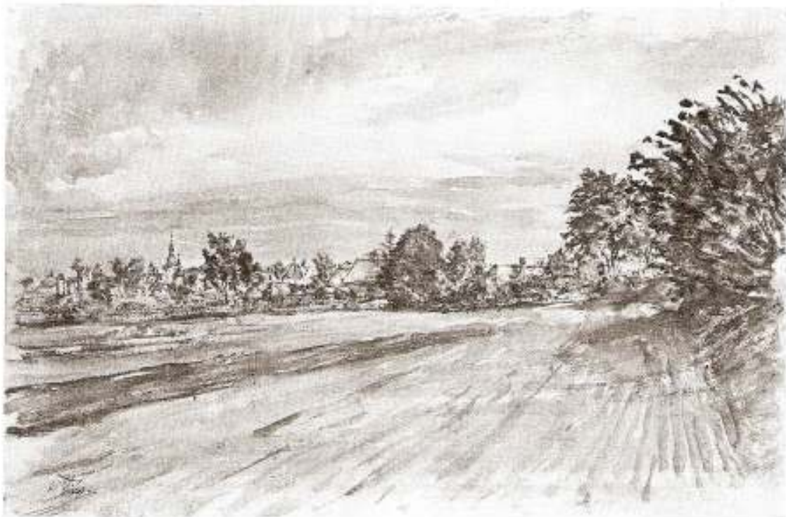
11. Petrovice u Sedlčan, 1954, lavírovaná tinta, dílo nedostupné