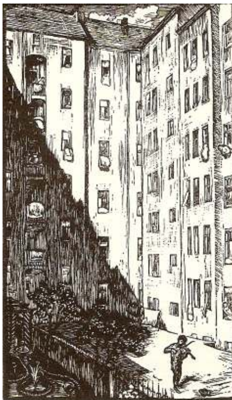
1. Na dvorečku, z cyklu Almužna, 1926, linoryt, papír, 39 x 23, NG