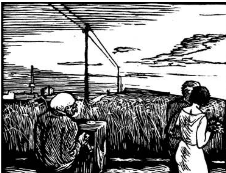
4. Cesta milenců z cyklu Cesty, 1935, linoryt, papír, 11,6 x 15,3 cm, NG