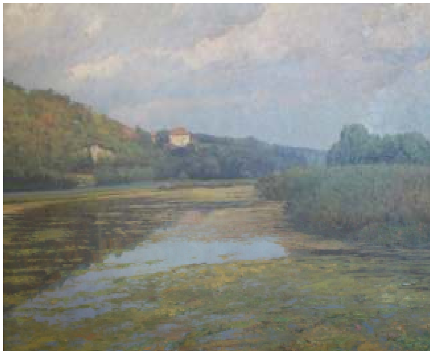
36. Vltava u Nelahozevsi, nedatováno, olej, karton, 48 x 64 cm. Inv. č. GAL 376.