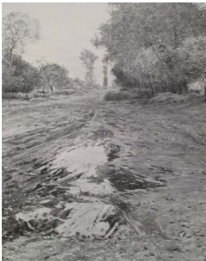
9. Josef Holub: Když listí padá, 1897