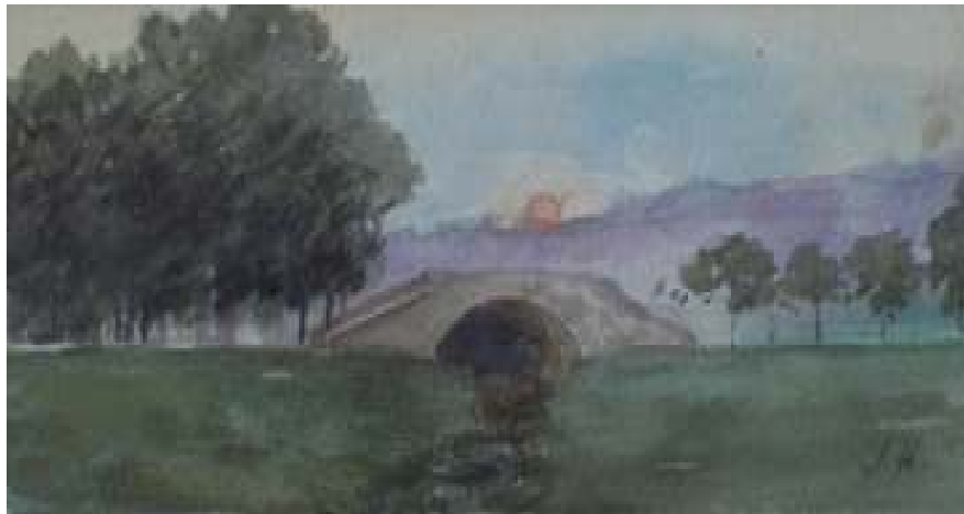
62. Na Poličsku, nedatováno, akvarel, papír, 6,3 x 14,5 cm. Inv. č. GAL 146/23.