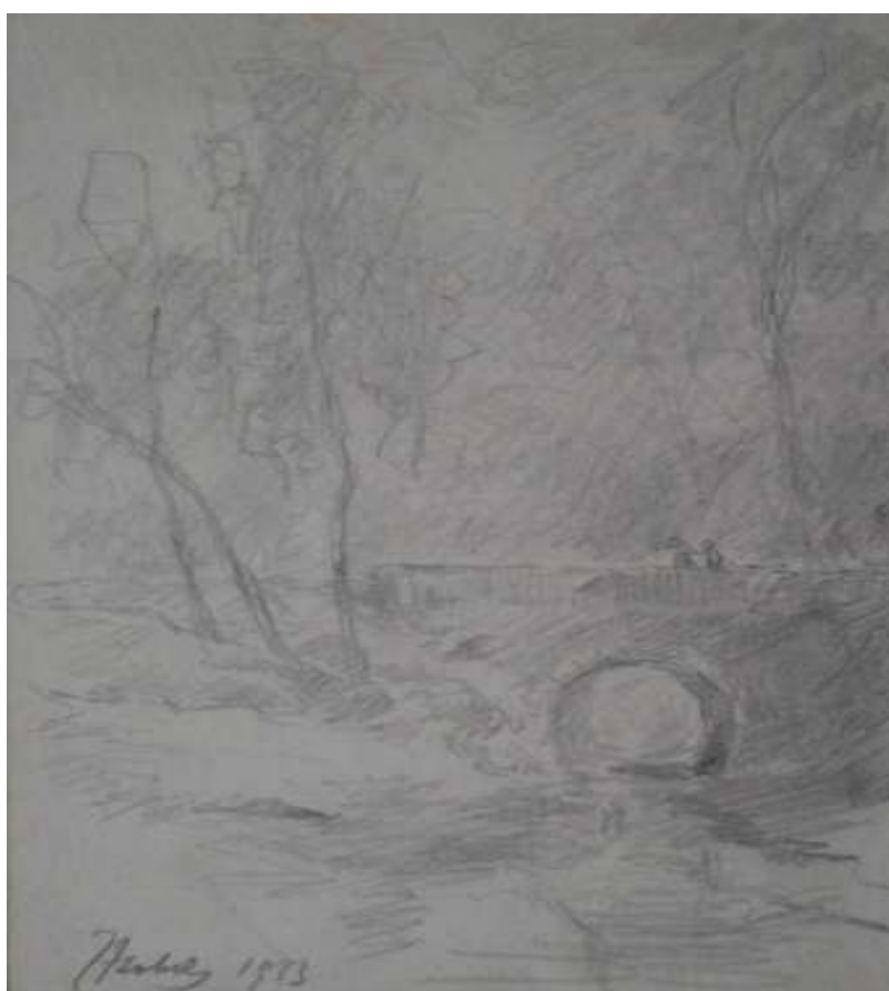
78. Studijní kresba, 1933, tužka, papír, 16,5 x 11,4 cm. Inv. č. GAL 146/62.