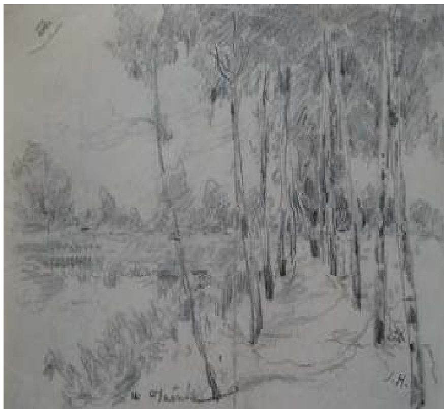
57. U Dušníků, nedatováno, tužka, papír, 10,5 x 15 cm. Inv. č. GAL 2255.