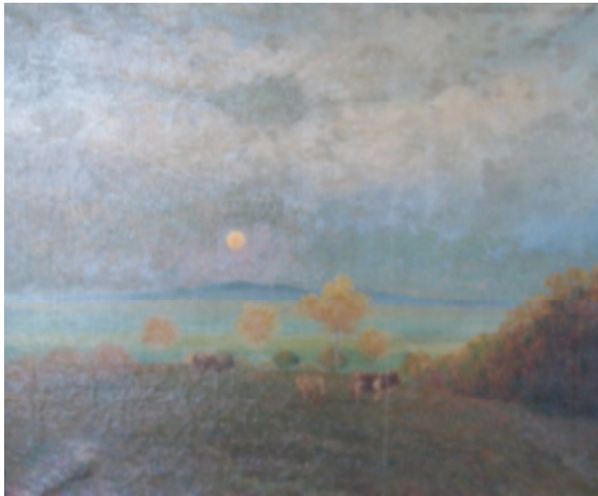
8. Podzimní nálada, 1916, olej, plátno, 97 x 75 cm. Inv. č. GAL 65.