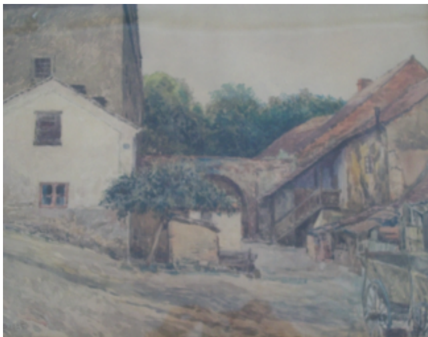
33. Dvůr mlýna v Nelahozevsi pod zámekem, 1925, olej, karton, 51 x 60 cm. Inv. č. GAL 345.