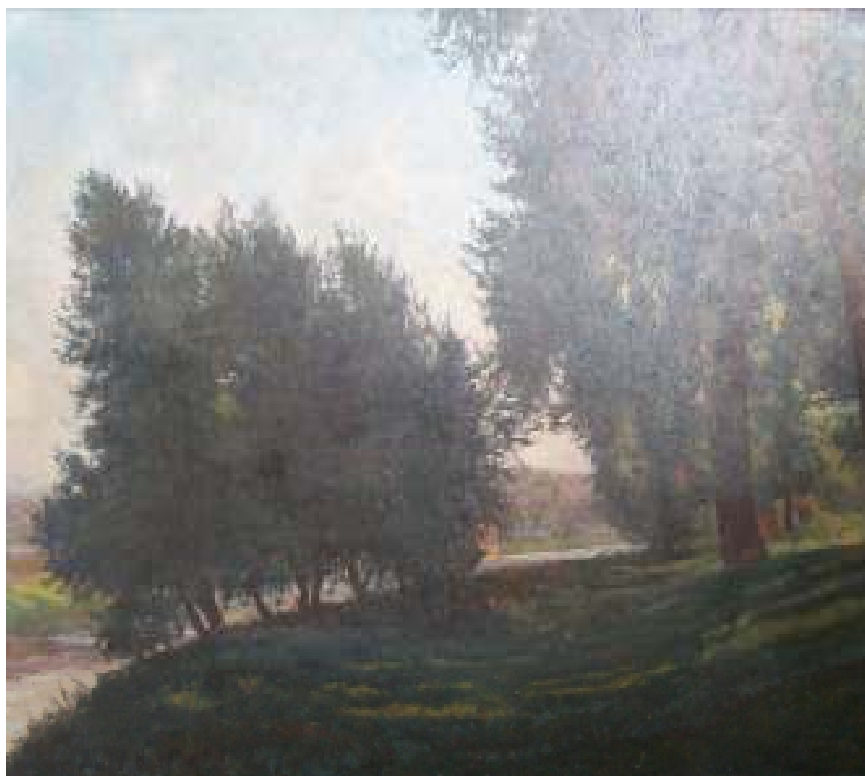
37. Břeh Vltavy u kralupského železničního mostu, nedatováno, olej, karton, 48 x 63 cm. Inv. č. GAL 377.