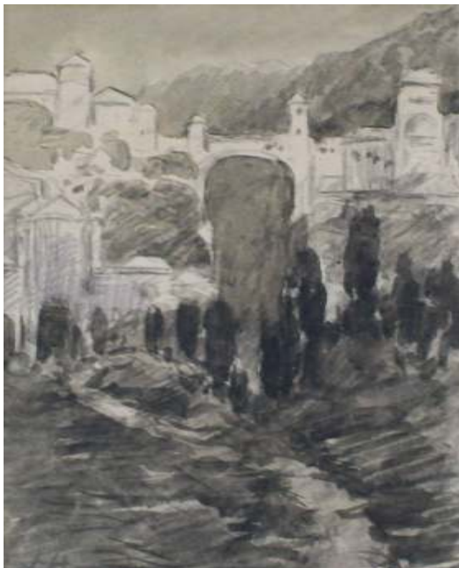
67. Studijní kresba, nedatováno, lavírovaná kresba, papír, 11,3 x 6,4 cm. Inv. č. GAL 146/12.