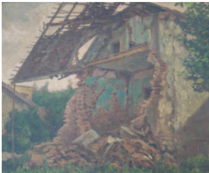
2. Po náletu (V Podhájí u Tesárků a Špičků), 1945, olej, karton, 48 x 40 cm. Inv. č. GAL 55.