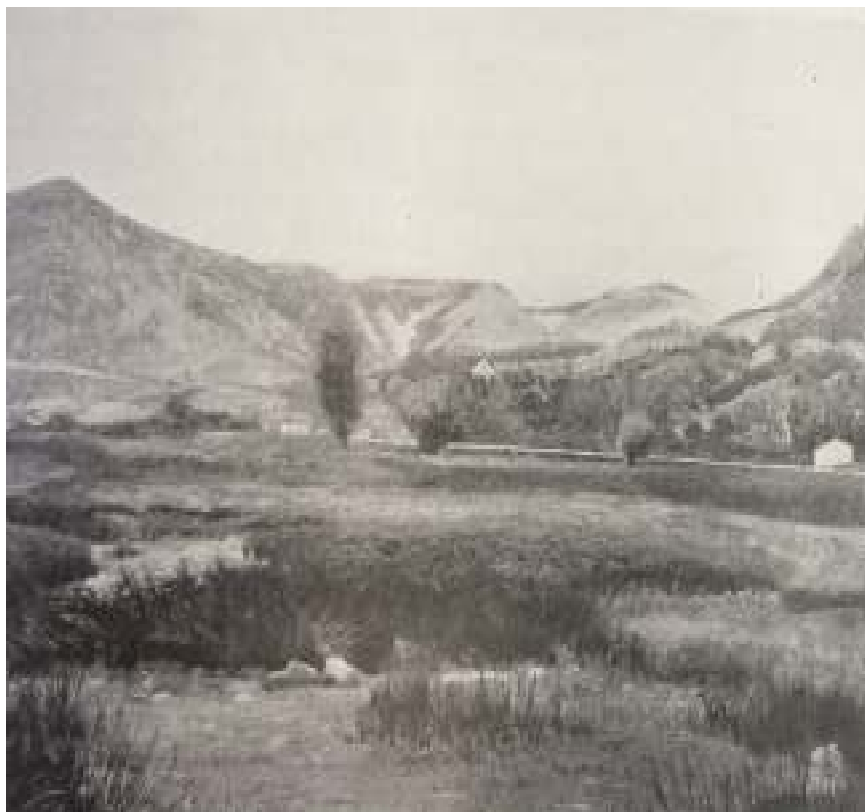
15. Josef Holub: Dřínovo brdlo v poledne, 1897, olej