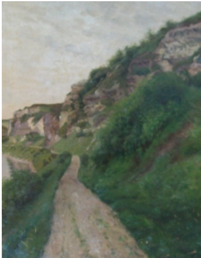
10. Cesta u tunelů, 1900, olej, plátno, 50 x 66,5 cm. Inv. č. GAL 67.