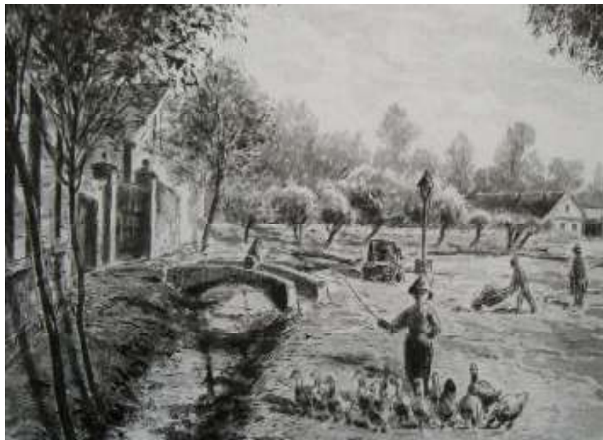
43. Náměstí v Kralupech 1868, 1935, lavírovaná kresba, papír, 35 x 26 cm. Inv. č. GAL 196.