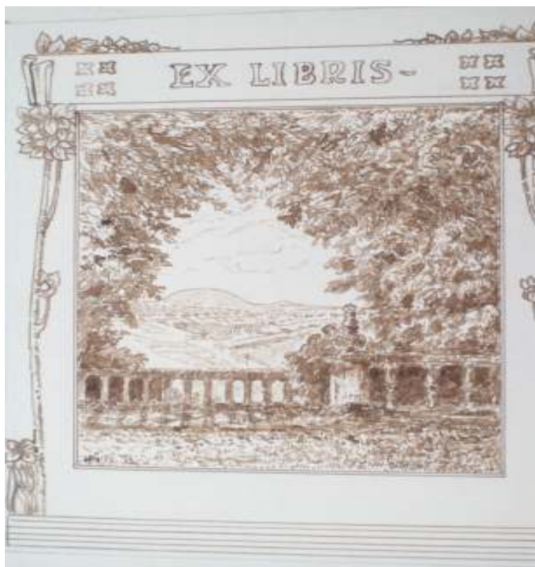
112. Ex libris, nedatováno, pero, papír, 33,5 x 23 cm. Inv. č. GAL 146/63.