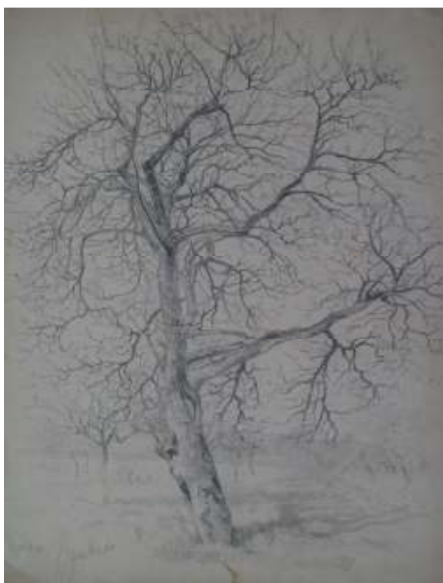
80. Studijní kresba, 1892, tužka, papír, 28 x 41,8 cm. Inv. č. GAL 146/43.