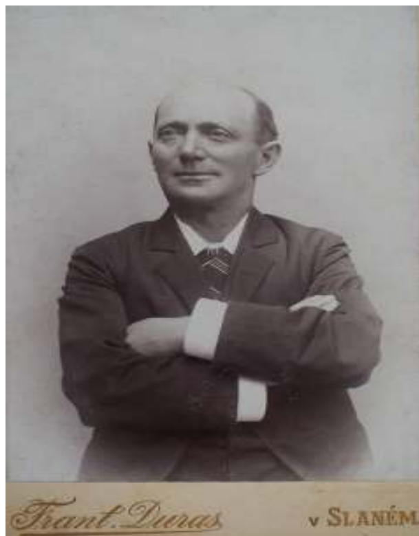
11. Fotografie Jindřicha Mošny, nedatováno.