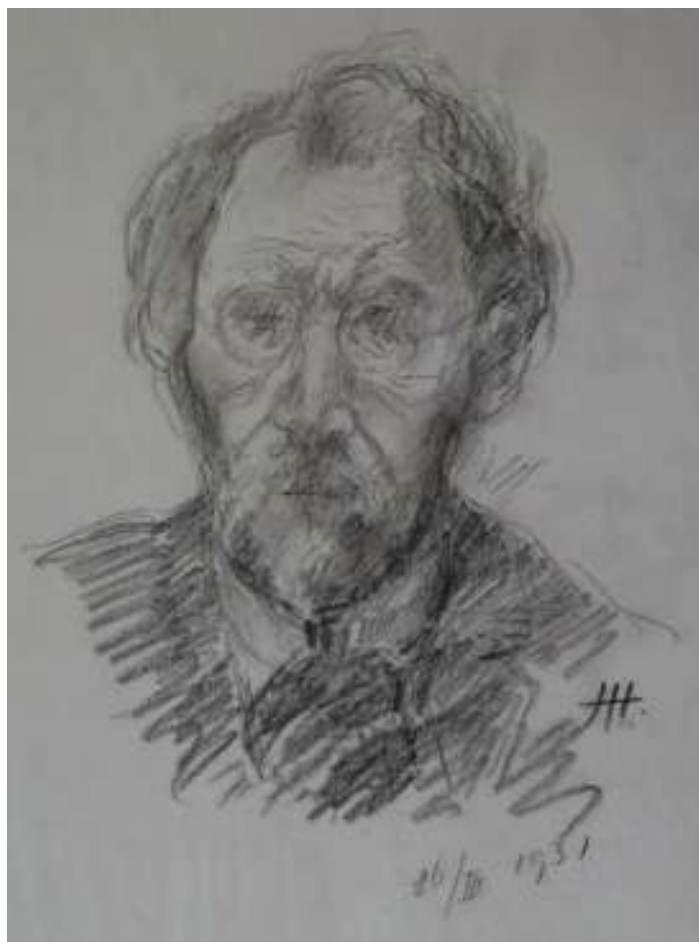
51. Autoportrét, 1931, tužka, papír, 33,5 x 25 cm. Inv. č. GAL 146/51.