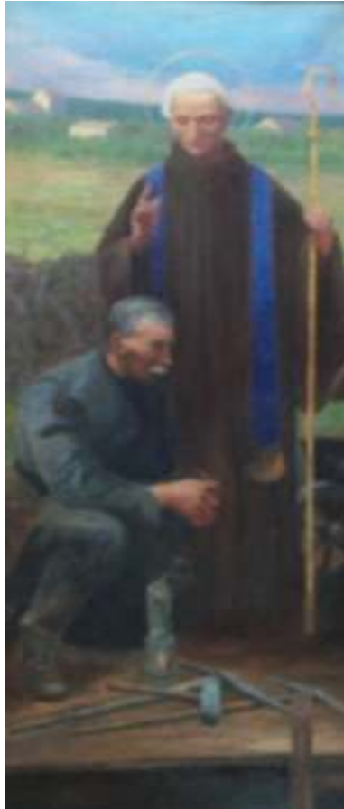
17. Svatý Prokop, 1928, olej, plátno, 100 x 40 cm. Inv. č. GAL 346.