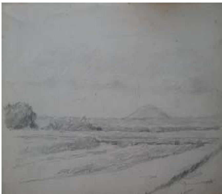
84. Studijní kresba, 1936, tužka, papír, 15,7 x 24 cm. Inv. č. GAL 146/50.