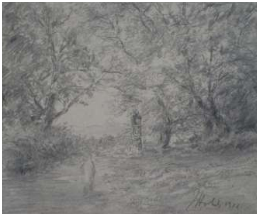
76. Studijní kresba, 1941, tužka, papír, 13 x 15,5 cm. Inv. č. GAL 146/4.