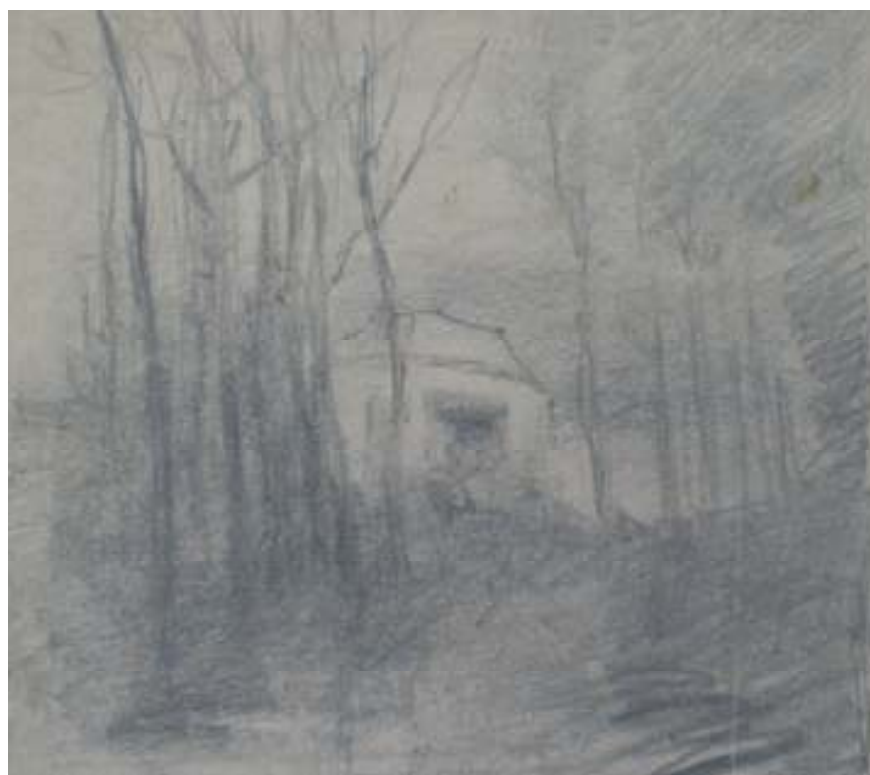
48. Z Veltruského parku, nedatováno, tužka, papír, 12 x 13 cm. Inv. č. GAL 146/30.