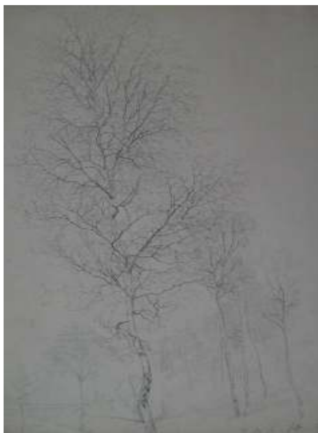
50. Bříza, 1892, tužka, papír, 36 x 26 cm. Inv. č. 146/53.