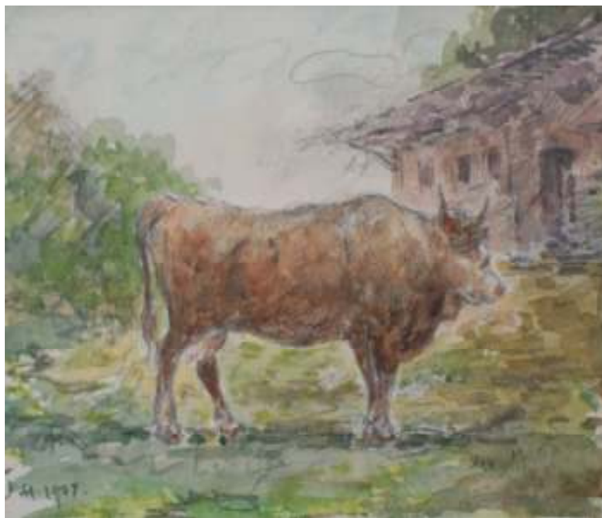
63. Studijní kresba, 1904, akvarel, tužka, papír, 11 x 15,5 cm. Inv. č. GAL 146/10.