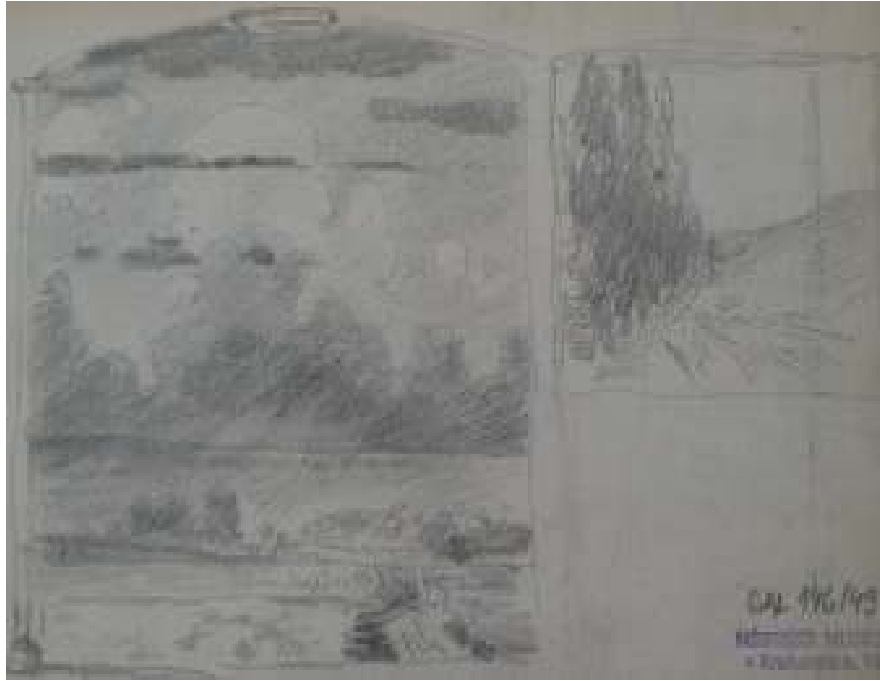
85. Studijní kresba, nedatováno, tužka, papír, 16 x 24 cm. Inv. č. GAL 146/49.