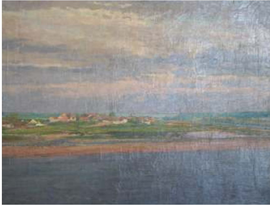
9. Vesnice nad řekou (Lobeček), 1903, olej, plátno, 96 x 79 cm. Inv. č. GAL 66.