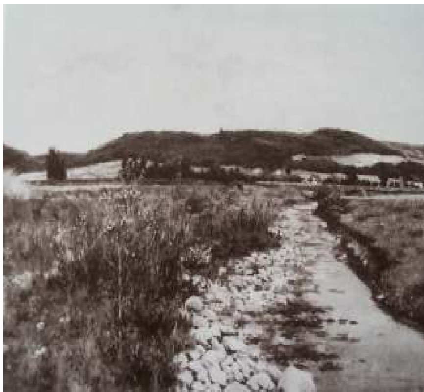
5. Bohuslav Dvořák: Železné hory, 1895, olej, papír na plátně, 52 x 66 cm, Národní galerie v Praze