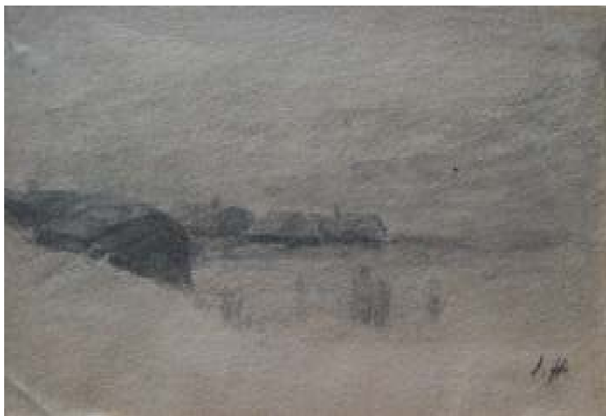
56. Zimní den u Kralup, nedatováno, tužka, papír, 4,5 x 9 cm. Inv. č. GAL 146/24.