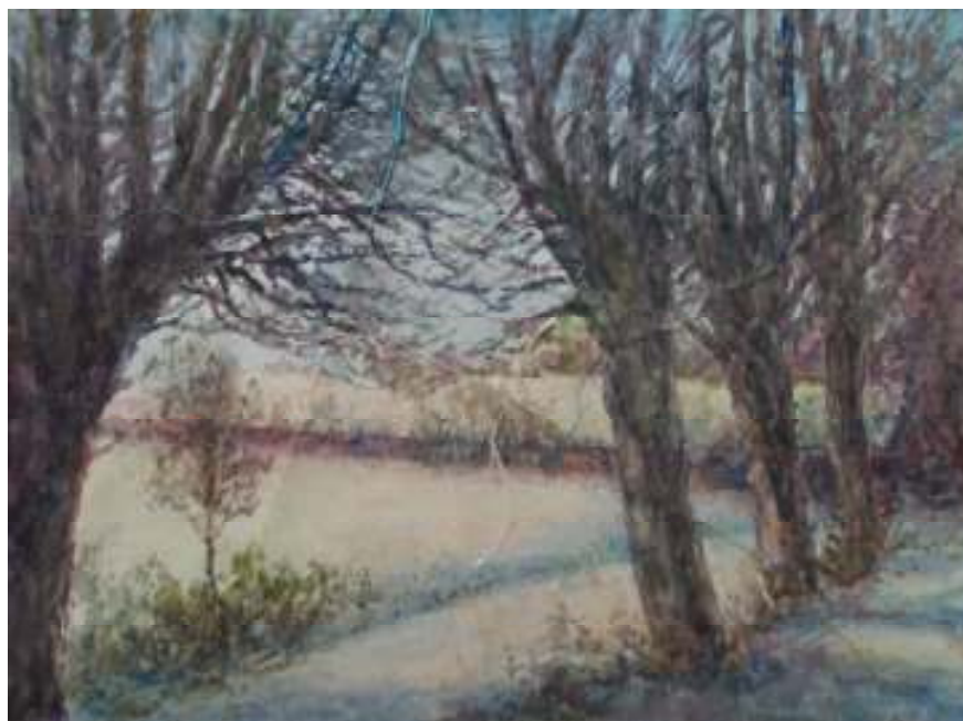
38. Časná zima, nedatováno, akvarel, papír, 15 x 22 cm. Inv. č. GAL 392.