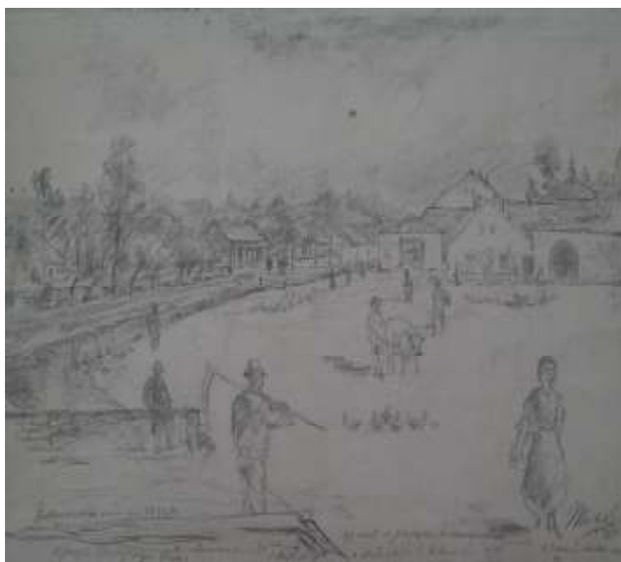
42. Kralupská náves v roce 1860, 1932, tužka, papír, 11 x 16,8 cm. Inv. č. GAL 146/54.