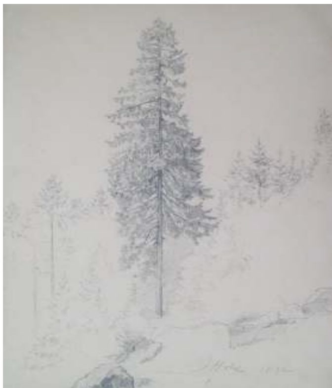
81. Studijní kresba, 1892, tužka, papír, 36 x 26 cm. Inv. č. GAL 146/56.