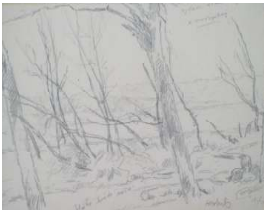
104. Studijní kresba, 1940, tužka, papír, 9,8 x 7,6 cm. Inv. č. GAL 146/55.