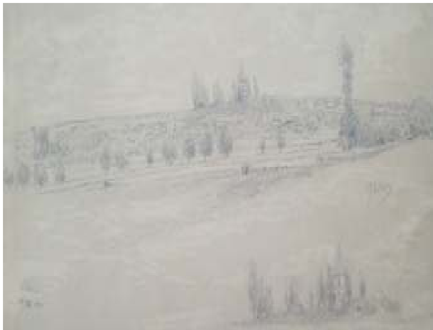
55. Chržín, 1925, tužka, papír, 25,8 x 36,8 cm. Inv. č. 146/31.