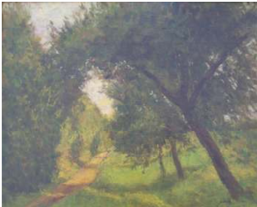
29. Z Kvasin cesta do lesa, nedatováno, olej, překližka, 27,5 x 36,5 cm. Inv. č. GAL 379.