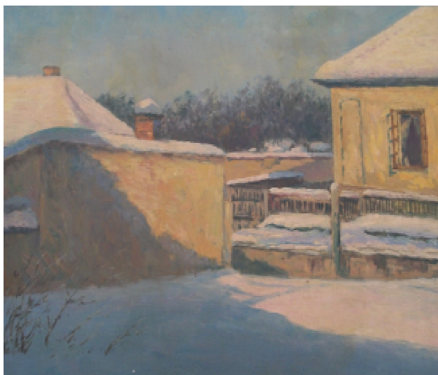
20. Zima na zahradě u Holubů, 1929, olej, karton, 50 x 34 cm. Inv. č. GAL 258.