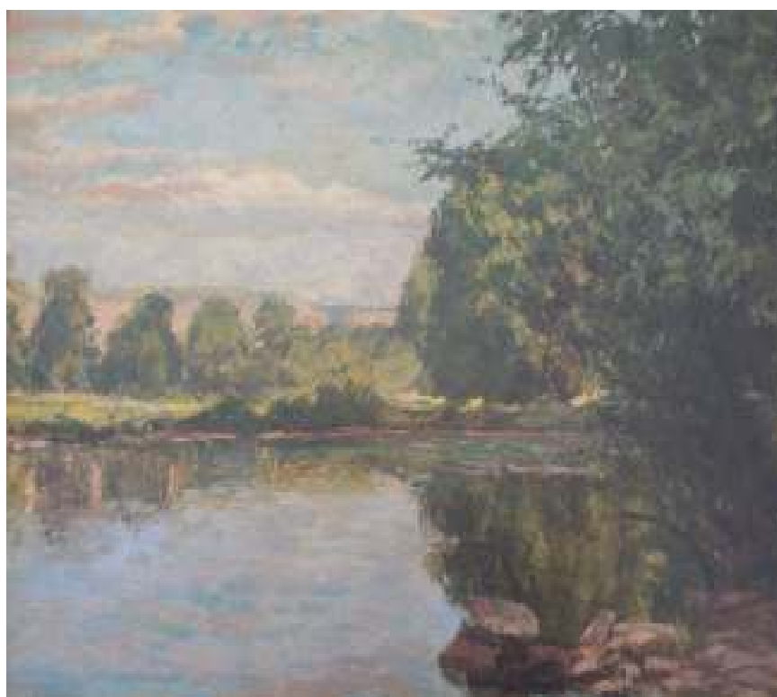
4. Tůň u Vltavy, 1933, olej, karton, 37 x 29 cm. Inv. č. GAL 57.