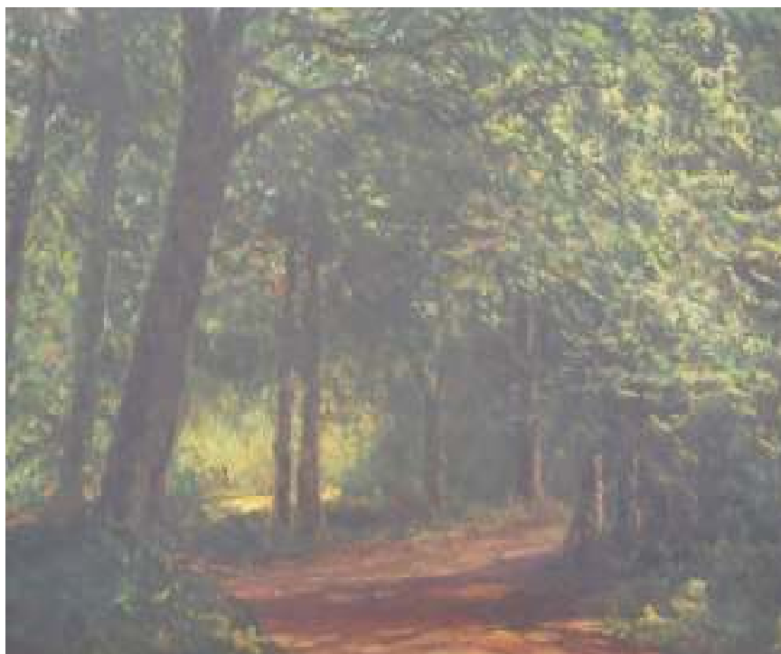
25. Křižovatka cest v parku, 1957, olej, karton, 40 x 30 cm. Inv. č. GAL 255.