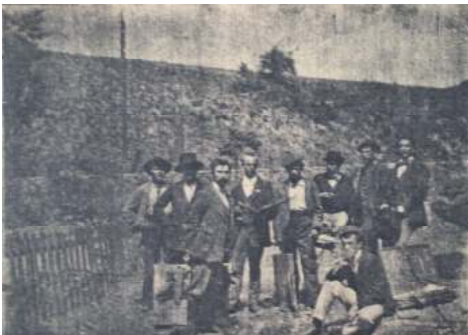
7. Fotografie Mařákových ůáků v Zákolanech.