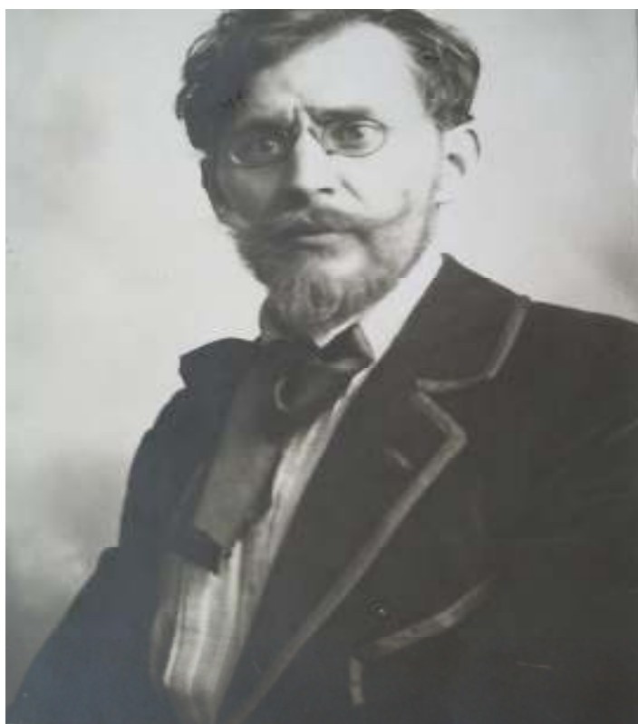
10. Fotografie Josefa Holuba, počátek 20. století. Archiv Městského muzea v Kralupech nad Vltavou