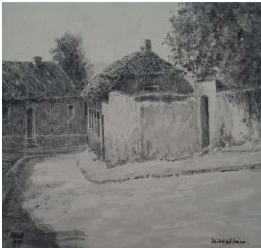
45. Ulička před bránou, 1929, lavírovaná kresba, papír, 17,4 x 20,8 cm. Inv. č. GAL 146/40.