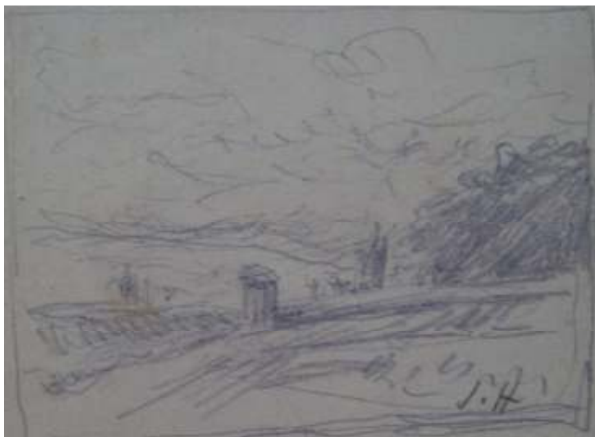
103. Studijní kresba, nedatováno, tužka, papír, 5 x 6,5 cm. Inv. č. GAL 146/25.