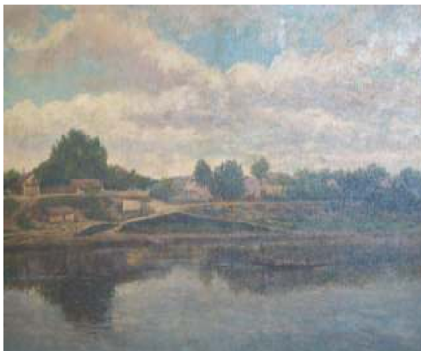
16. Lobeček od přívozu, 1927, olej, plátno, 98 x 75 cm. Inv. č. GAL 100.