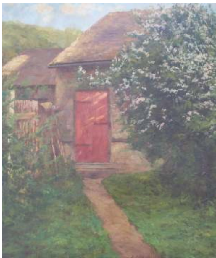
24. Prádelna u Holubů, 1938, olej, karton, 26,5 x 34,5 cm. Inv. č. GAL 372.