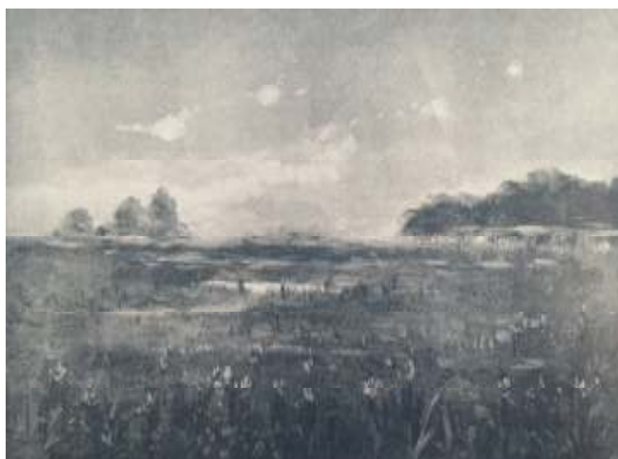
14. Josef Holub: Noční chmury, 1898, olej