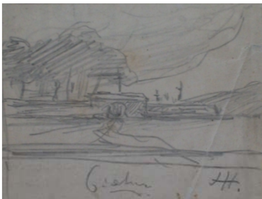
106. Studijní kresba, nedatováno, tužka, papír, 5 x 6,5 cm. Inv. č. 146/32.