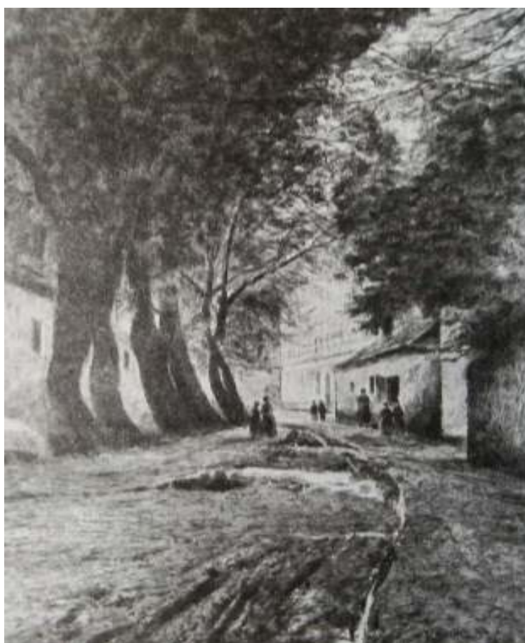
44. Komenského náměstí, 1904, lavírovaná kresba, papír, 38,5 x 29 cm. Inv. č. GAL 194.