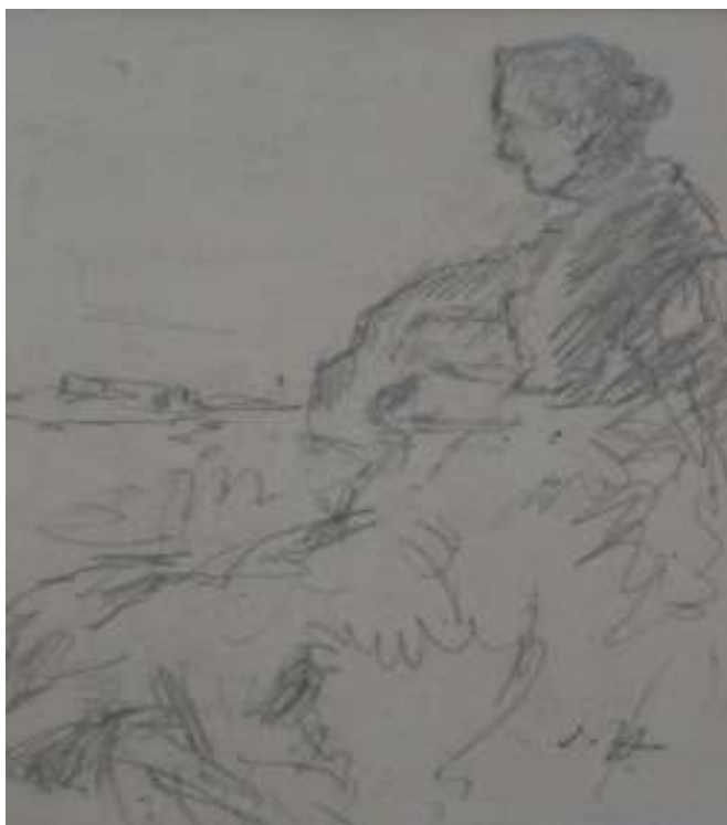
91. Studijní kresba, nedatováno, tužka, papír, 11 x 10 cm. Inv. č. GAL 146/15.