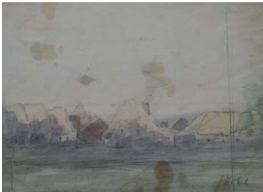
109. U Mladotic, nedatováno, tužka, akvarel, papír, 11,9 x 17,8 cm. Inv. č. GAL 146/41.