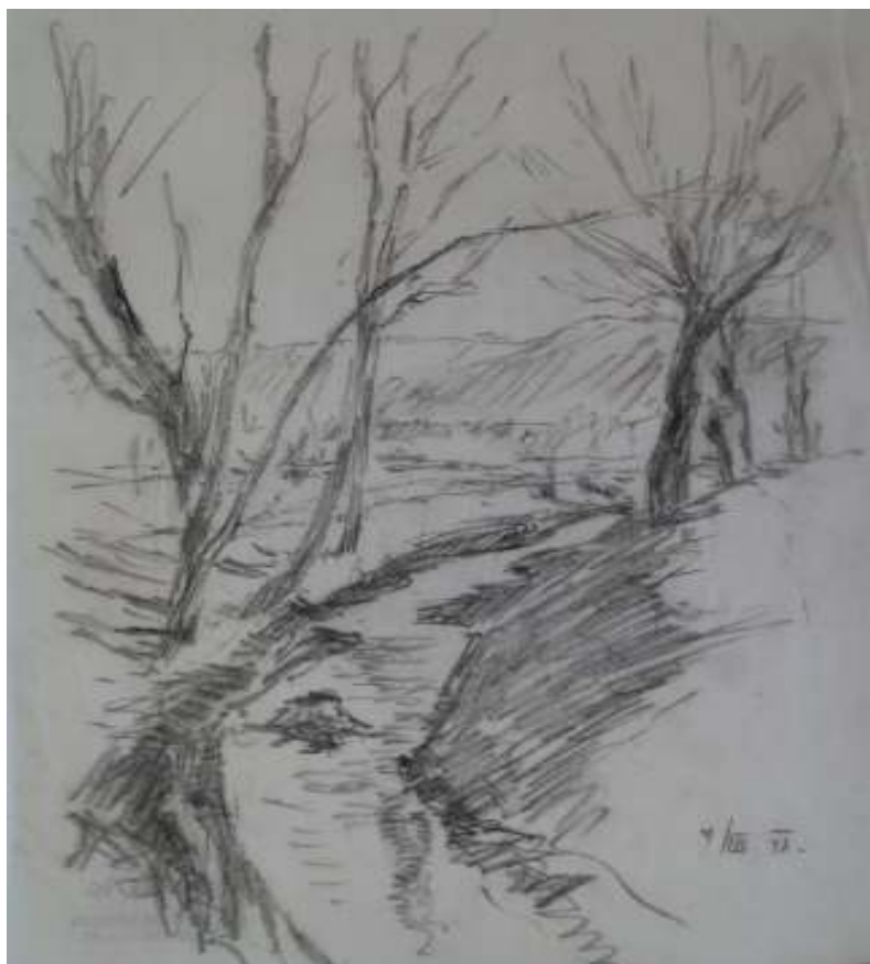
87. Studijní kresba, 1931, tužka, papír, 33,5 x 25 cm. Inv. č. GAL 146/46.