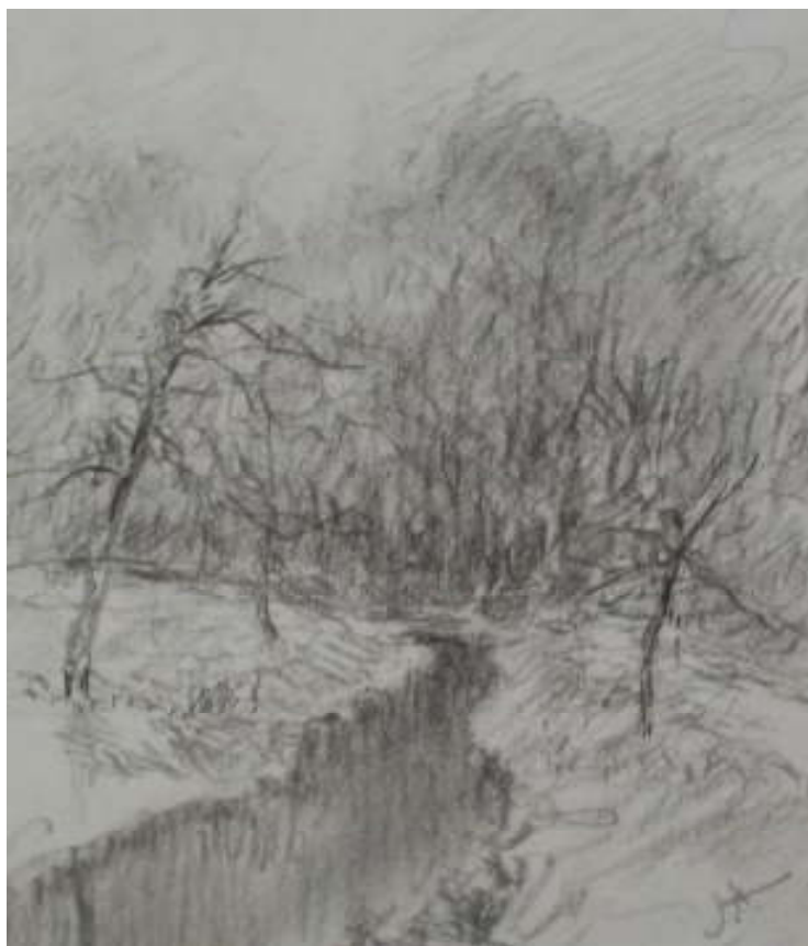
93. Studijní kresba, nedatováno, tužka, papír, 16,8 x 11,8 cm. Inv. č. GAL 146/19.