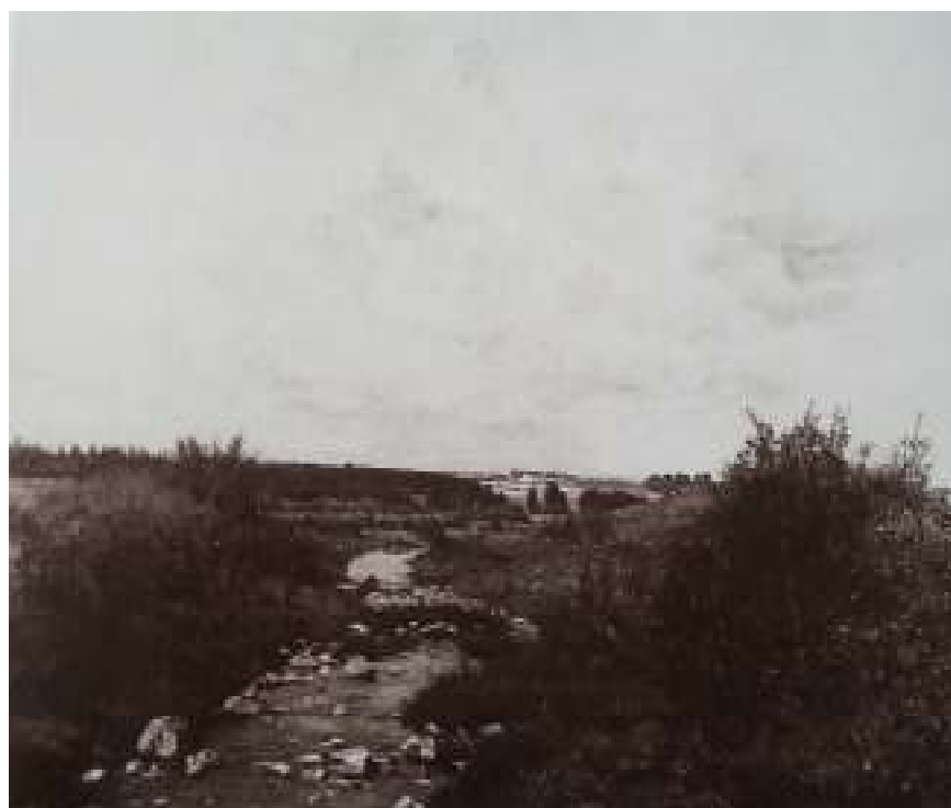
4. František Kaván: Na Zlatém potoce pod Železnými horami, 1895, olej, plátno, 102 x 132 cm, Národní galerie v Praze