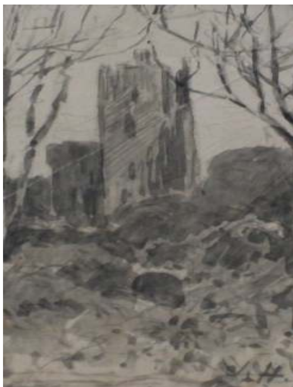
68. Studijní kresba, nedatováno, lavírovaná kresba, papír, 9 x 5 cm. Inv. č. GAL 146/18.