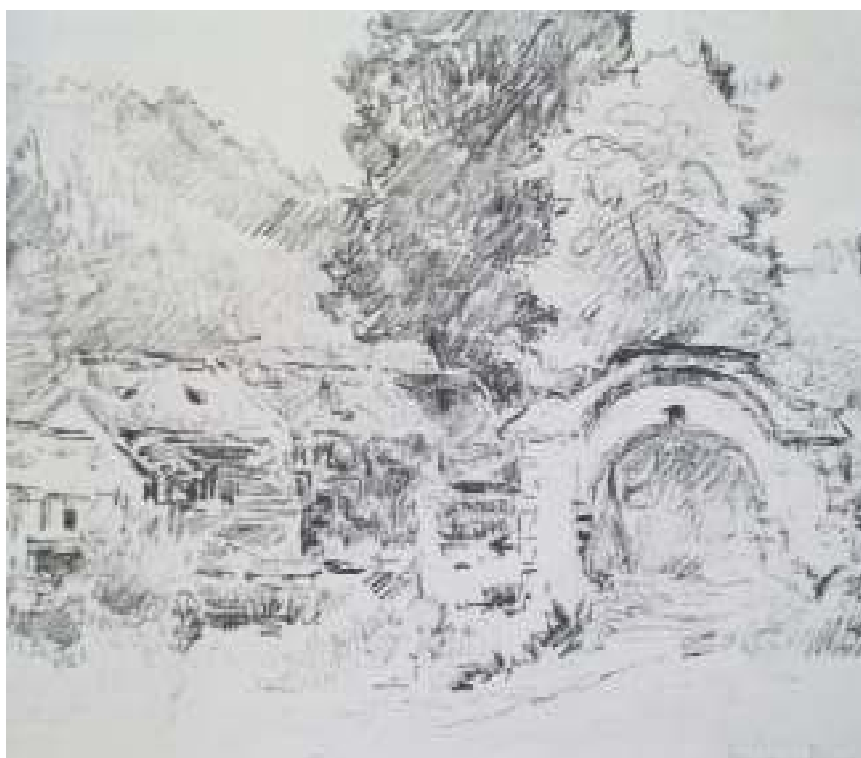
8. Josef Holub: Mlýn na Okoři