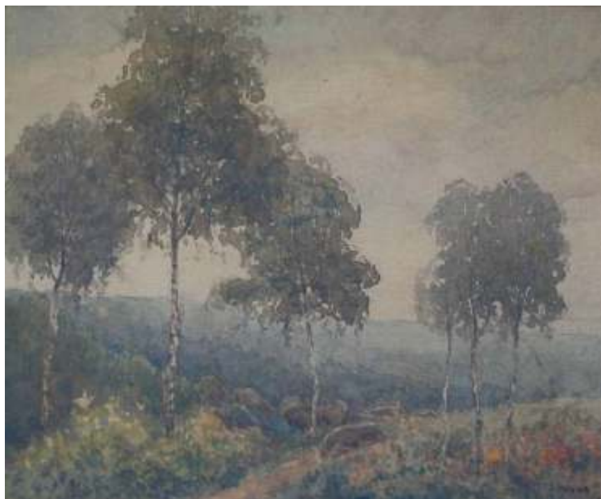
31. Břízy na stráni, nedatováno, akvarel, papír, 16 x 18,5 cm. Inv. č. GAL 381.