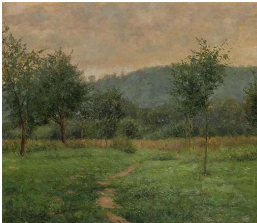
18. Josef Holub: Vlhký den, 1940, olej, karton, 28 x 35 cm. Soukromá sbírka