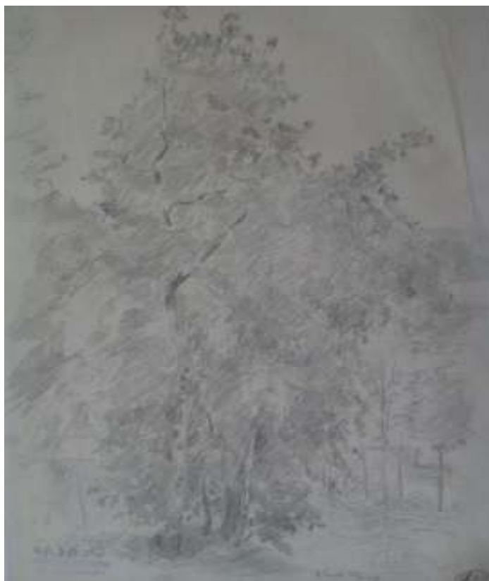
49. V Tůních, 1939, tužka, papír, 33,5 x 25 cm. Inv. č. GAL 146/47.