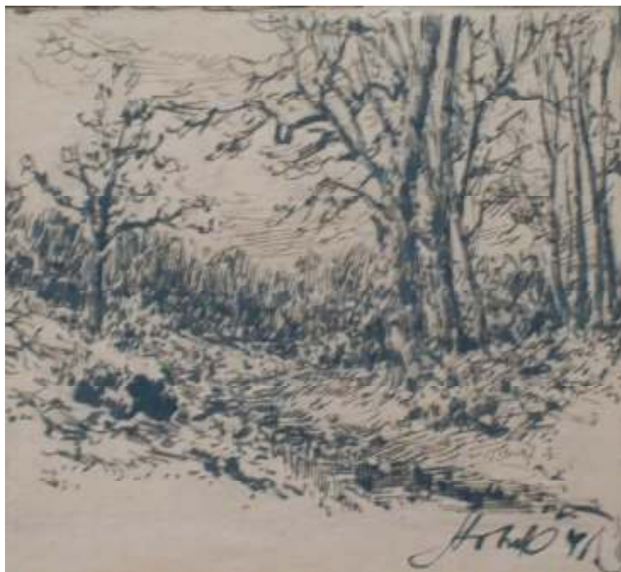
65. Studijní kresba, 1941, pero, žlutý papír, 15 x 16 cm. Inv. č. GAL 146/11.