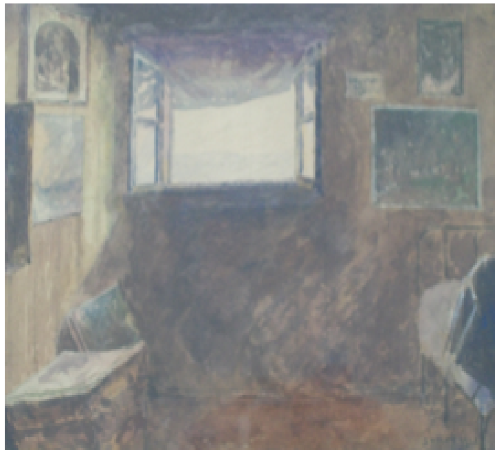
18. Ateliér, 1928, akvarel, papír, 33 x 24 cm. Inv. č. GAL 370.