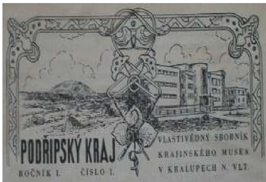
47. Obálka Vlastivědného sborníku krajinského muzea v Kralupech nad Vltavou, nedatováno, tisk, papír.