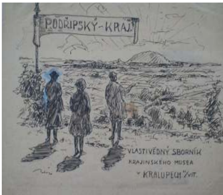
46. Studijní kresba pro Vlastivědný sborník kralupského muzea v Kralupech nad Vltavou, nedatováno, pero, papír, 11 x 27 cm. Inv. č. GAL 146/37.