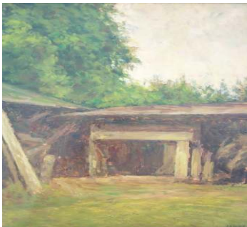
30. Kovárna v Podhájí, nedatováno, olej, karton, 33 x 29,5 cm. Inv. č. GAL 380.