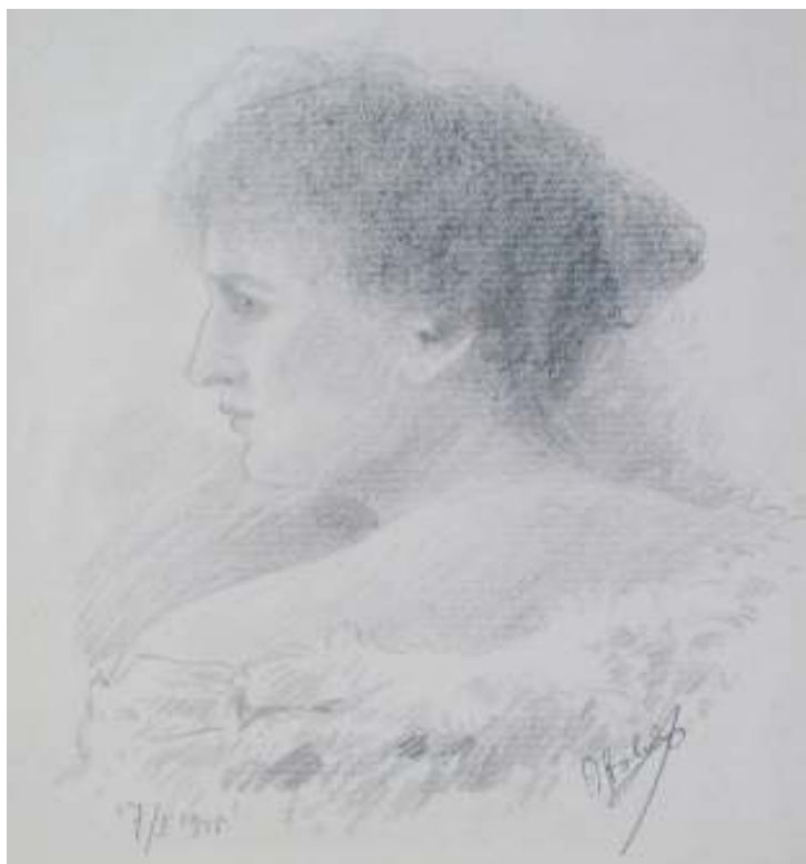
77. Studijní kresba, 1915, tužka, papír, 22,3 x 14,6 cm. Inv. č. GAL 146/58.