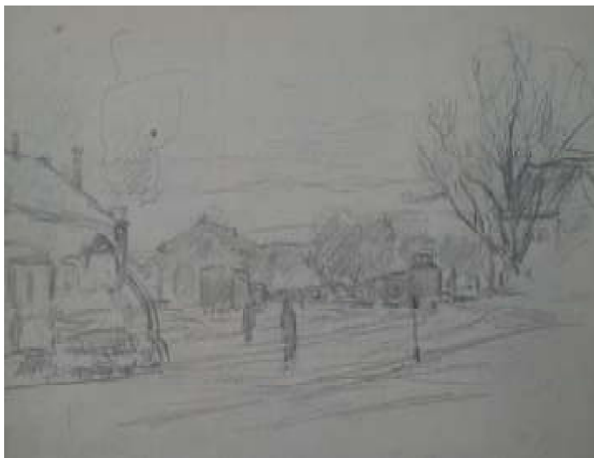
83. Studijní kresba, nedatováno, tužka, papír, 16 x 24 cm. Inv. č. GAL 21/a.