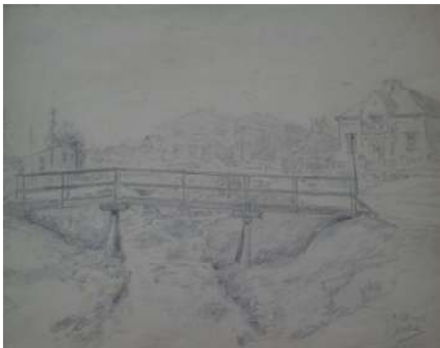
79. Studijní kresba, 1925, tužka, papír, 21 x 24,3 cm. Inv. č. GAL 146/28.