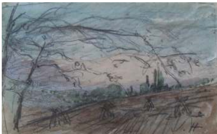
58. Studijní kresba, nedatováno, tužka, akvarel, papír, 5,5 cm x 9,2 cm. Inv. č. GAL 146/8.