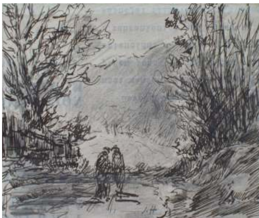
66. Studijní kresba, nedatováno, pero, papír, 12,5 x 19,4 cm. Inv. č. GAL 146/36.