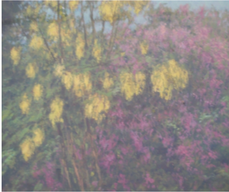
35. Jaro v naší zahrádce v Podháji, nedatováno, olej, lepenka, 28 x 36 cm. Inv. č. GAL 322.