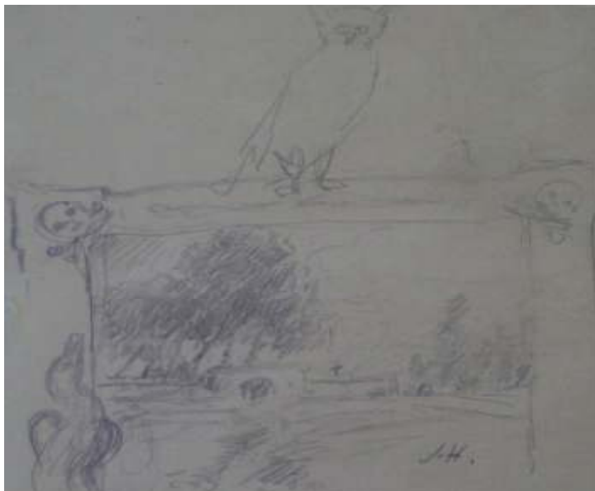
105. Studijní kresba, nedatováno, tužka, papír, 11 x 10,2 cm. Inv. č. GAL 146/32.