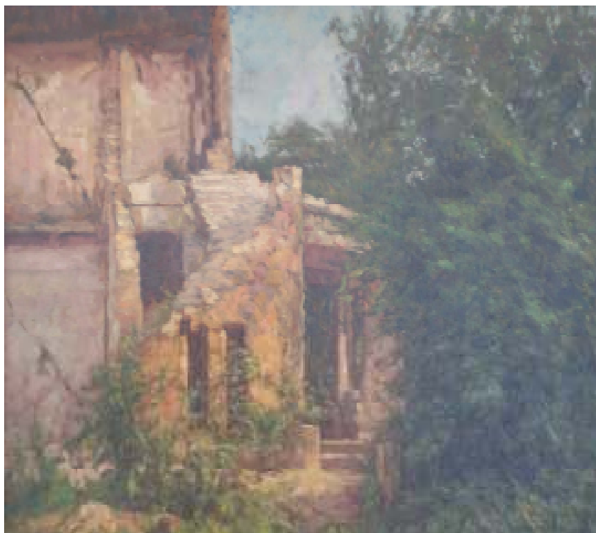
26. V Podháji po náletu, 1946, olej, překližka, 38 x 29,5 cm. Inv. č. GAL 260.