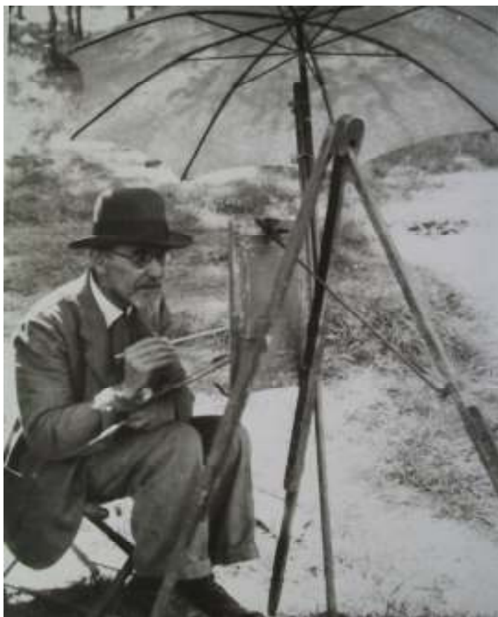
17. Fotografie Josefa Holuba, 40. léta 20. století.