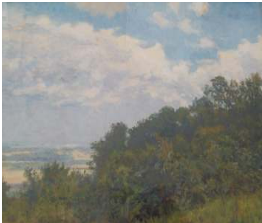
22. Podřípská krajina, 1931, akvarel, papír, 53 x 40 cm. Inv. č. GAL 254.