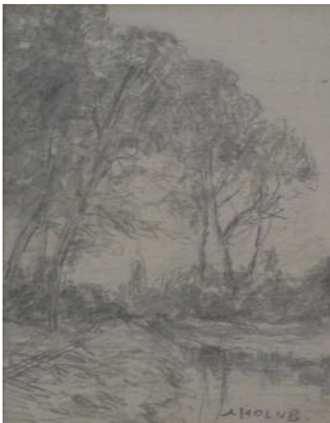
71. Studijní kresba, nedatováno, tužka, papír, 13 x 7,5 cm. Inv. č. GAL 146/3.