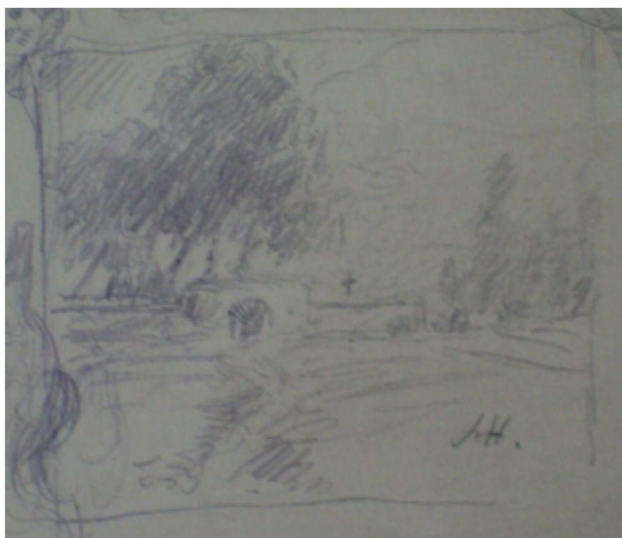
108. Studijní kresba, nedatováno, tužka, papír, 7,5 x 8,5 cm. Inv. č. 146/32.