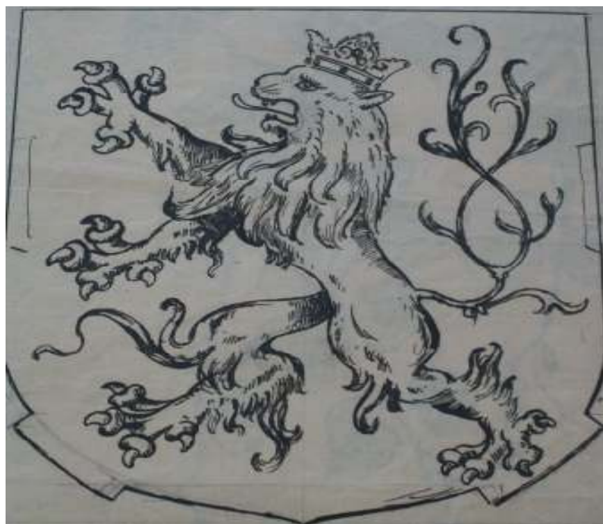
114. Studijní kresba, nedatováno, pero, papír, 22,5 x 20 cm. Inv. č. GAL 146/34.