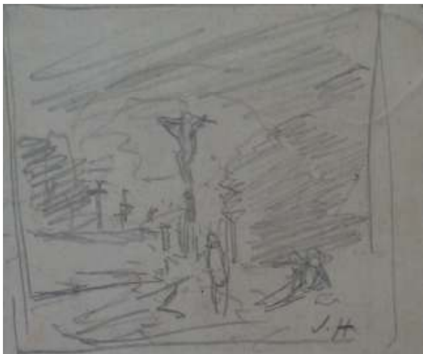
107. Studijní kresba, nedatováno, tužka, papír, 5,5 x 6,6 cm. Inv. č. GAL 146/32.