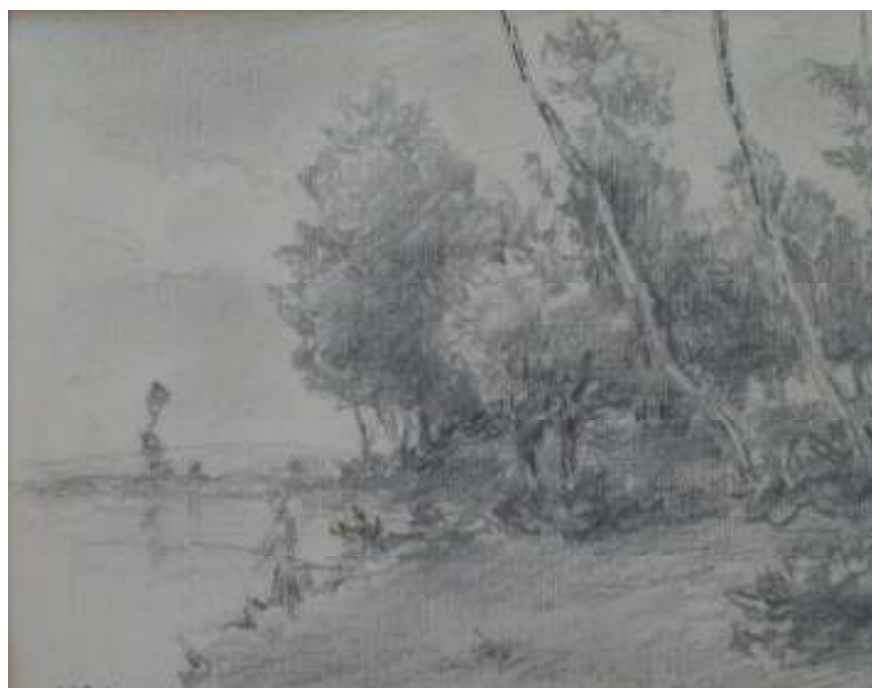
72. Vltavský motiv, nedatováno, tužka, papír, 10,5 x 14,5 cm. Inv. č. GAL 146/22.