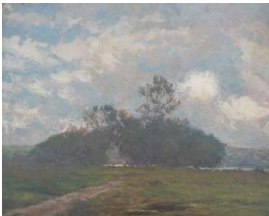
14. Starý přívóz, 1913, olej, karton, 28,5 x 26,5 cm. Inv. č. GAL 256.