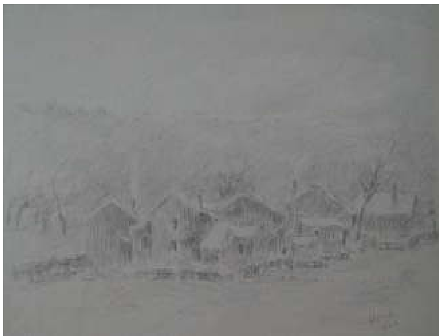
69. Studijní kresba, 1924, tužka, papír, 21 x 29 cm. Inv. č. GAL 146/44.