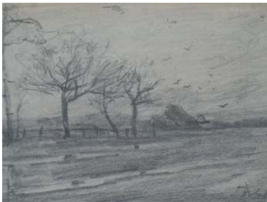
70. Studijní kresba, nedatováno, tužka, papír, 11 x 16,5 cm. Inv. č. GAL 151.