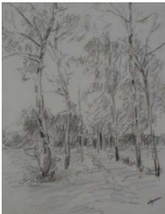
95. U Dušník, nedatováno, tužka, papír, 15 x 10,2 cm. Inv. č. GAL 146/21.