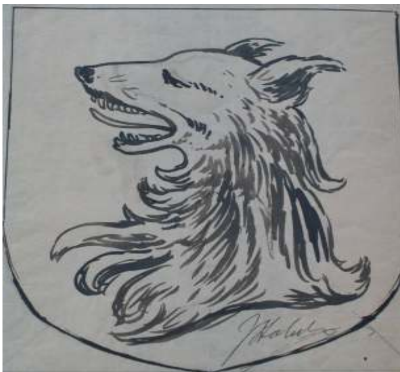
113. Studijní kresba, nedatováno, akvarel, papír, 22 x 20 cm. Inv. č. GAL 146/33.