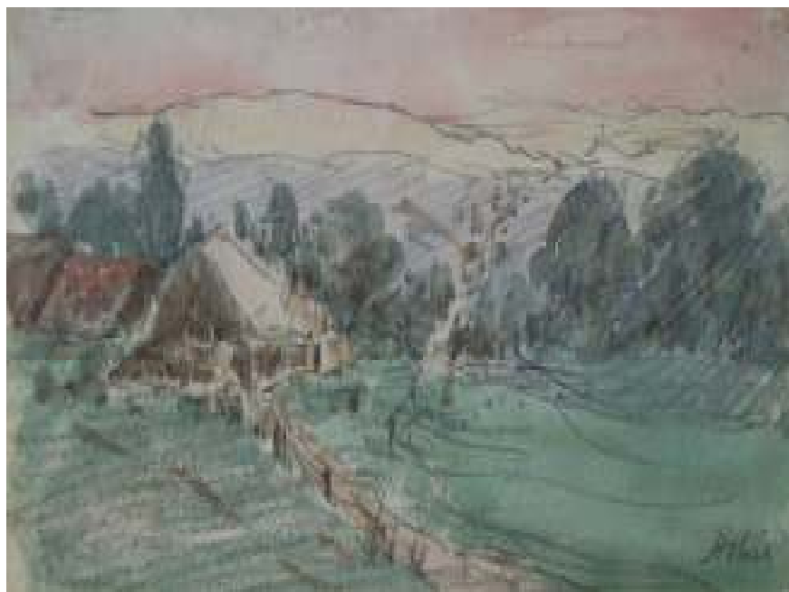
59. Na Poličsku, nedatováno, tužka, akvarel, papír, 6,4 x 11 cm. Inv. č. GAL 146/7.