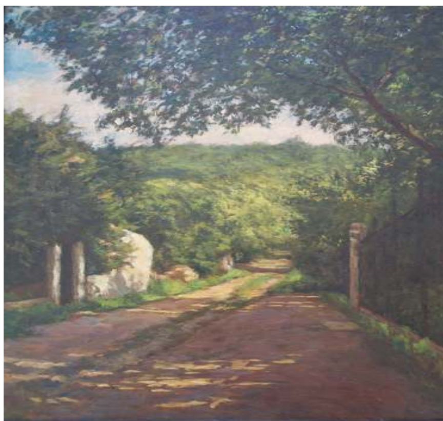
32. Ulice v Podháji, nedatováno, olej, překližka, 49 x 37 cm. Inv. č. GAL 373.