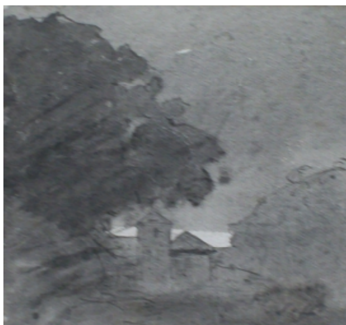
88. Studijní kresba, nedatováno, lavírovaná kresba, papír, 7,5 x 7,3 cm. Inv. č. GAL 146/20.