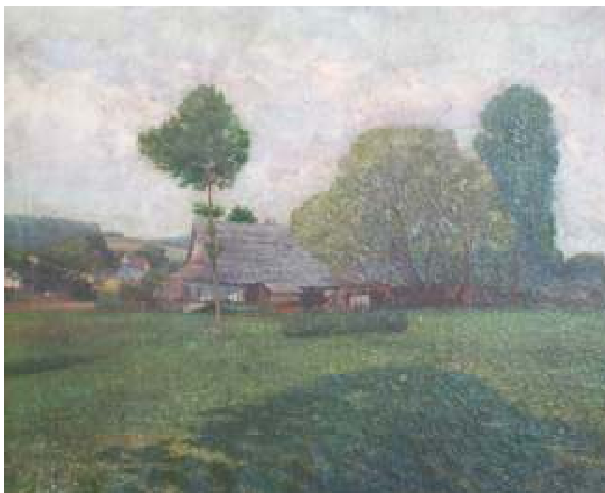
28. Chalupa v Pusté Rybné, nedatováno, olej, plátno, 96,5 x 80 cm. Inv. č. GAL 310.