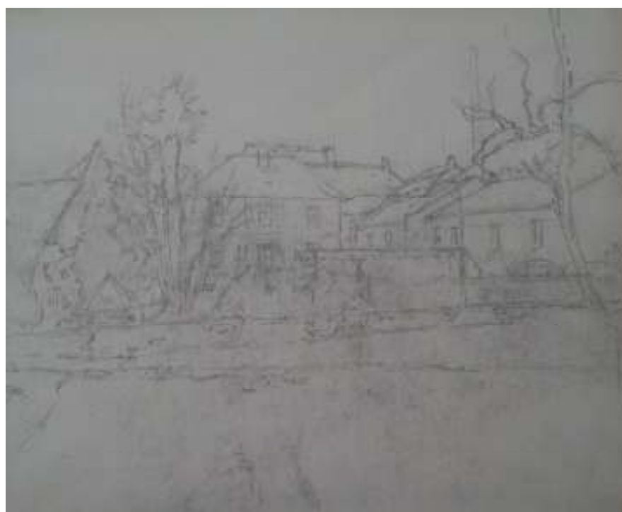
82. Studijní kresba, nedatováno, tužka, papír, 23,5 x 33,5 cm. Inv. č. GAL 146/48.