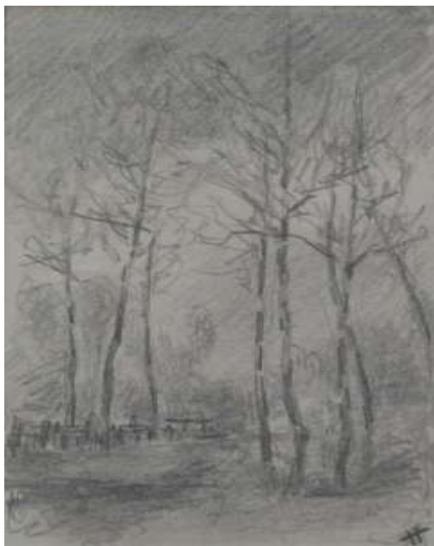
97. Studijní kresba, nedatováno, tužka, papír, 14 x 9 cm. Inv. č. GAL 146/2.