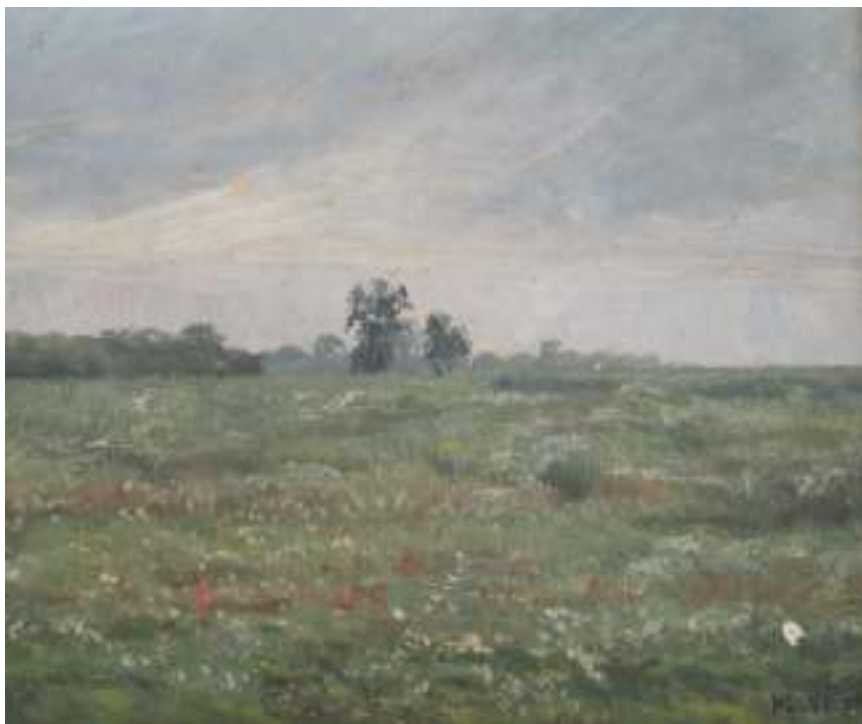
13. Kvetoucí louka, 1895, olej, překližka, 30 x 23 cm. Inv. č. GAL 257.