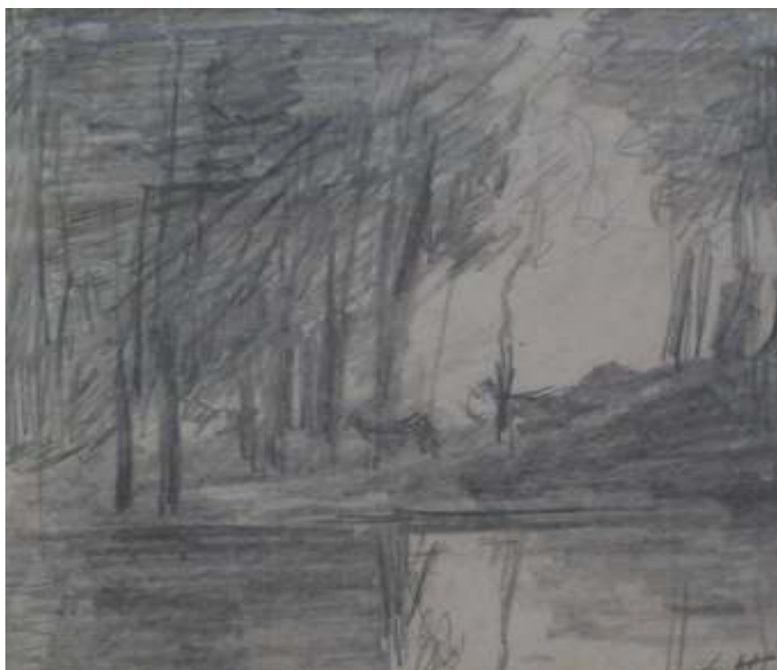
92. Studijní kresba, nedatováno, tužka, papír, 9,8 x 9,5 cm. Inv. č. GAL 146/16.