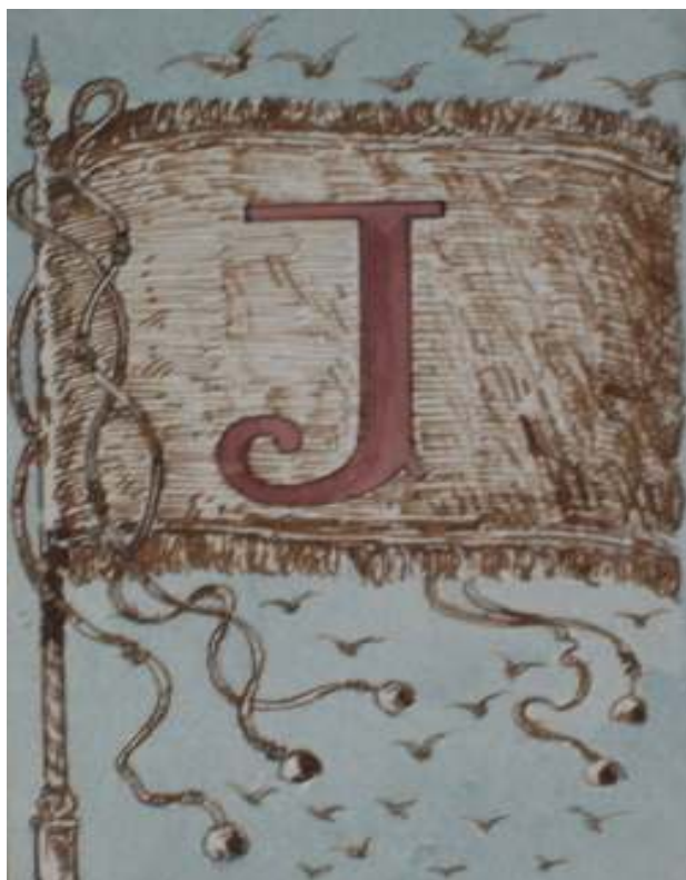
111. Studijní kresba, nedatováno, akvarel, papír, 15,2 x 10,5 cm. Inv. č. GAL 146/59.