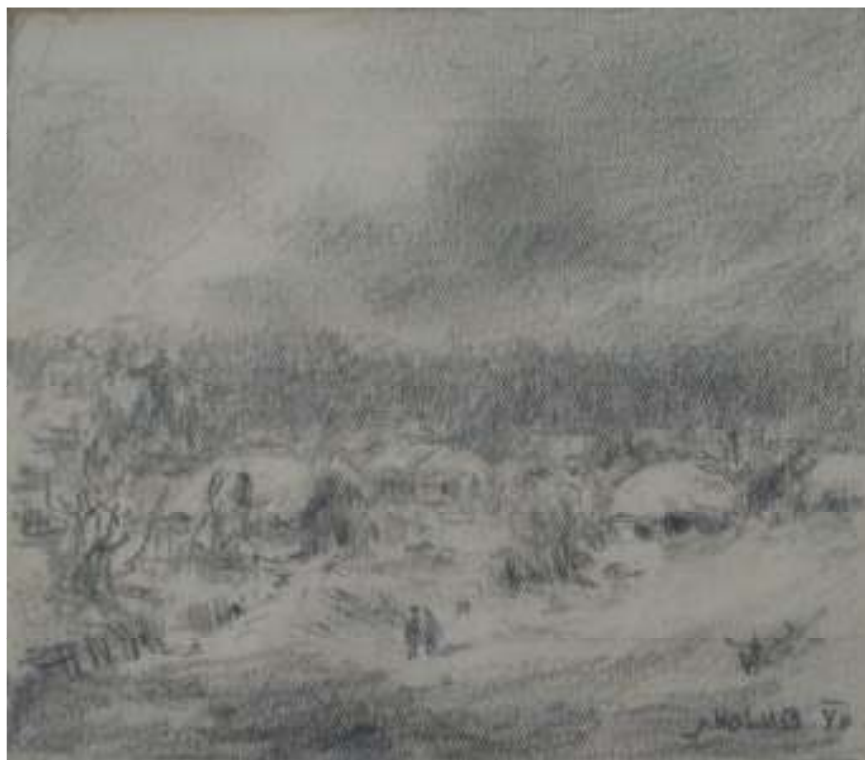
75. Studijní kresba, 1940, tužka, papír, 9,8 x 11,2 cm. Inv. č. GAL 146/17.