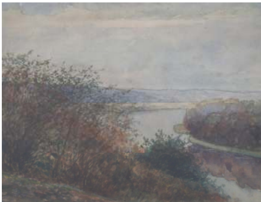
5. Pohled na Vltavu, 1929, akvarel, papír, 63 x 48 cm. Inv. č. GAL 60.