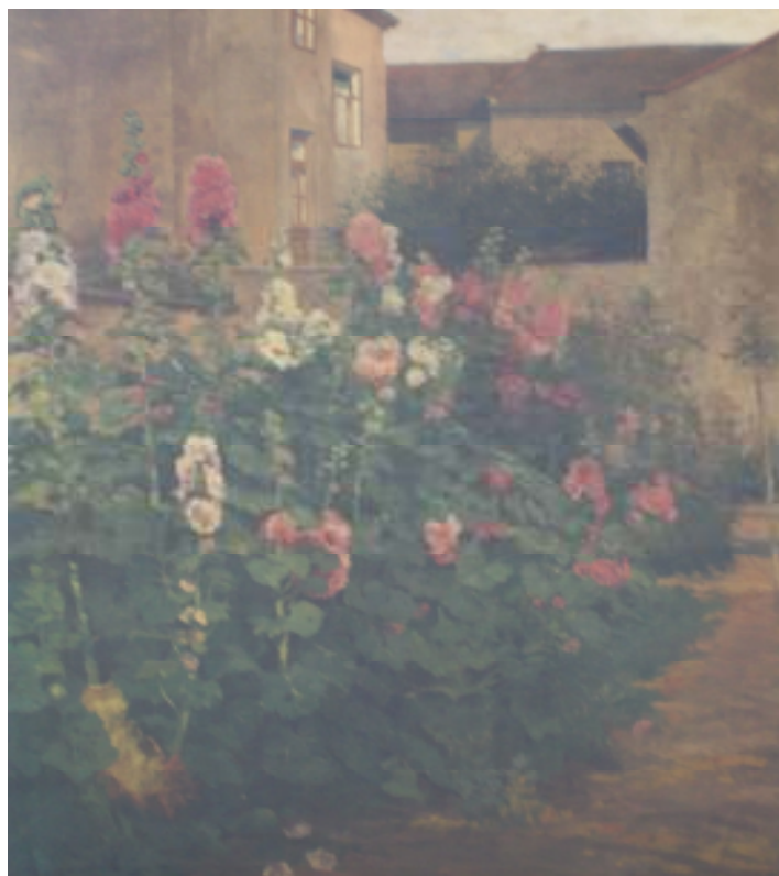
1. Slézy na Františku, nedatováno, olej, plátno, 59 x 78 cm. Inv. č. GAL 44.