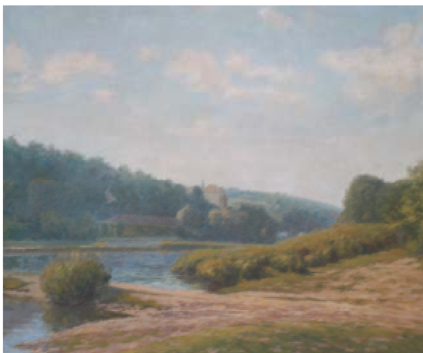
12. Pohled k Nelahozevsi, nedatováno, olej, plátno, 90 x 75 cm. Inv. č. GAL 147.