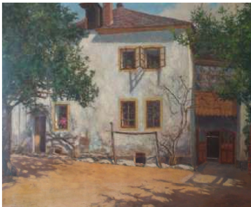
19. Dům s verandou, 1929, olej, lepenka, 49 x 64 cm. Inv. č. GAL 369.