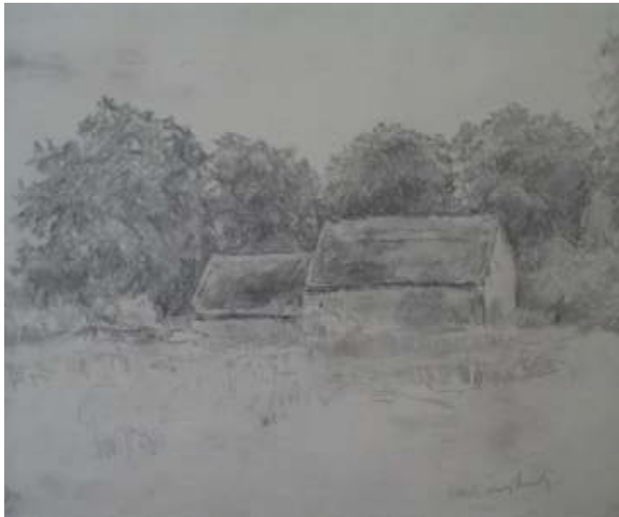
86. Studijní kresba, nedatováno, tužka, papír, 25 x 33 cm. Inv. č. GAL 146/45.