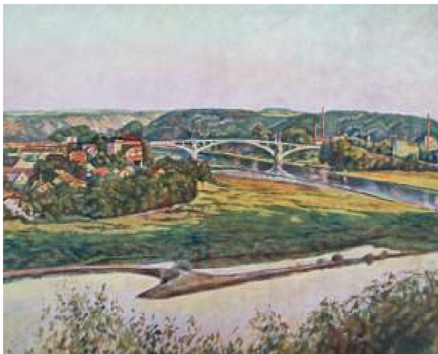
1. Josef Holub: Pohled na Masarykův most od tunelu, 1928