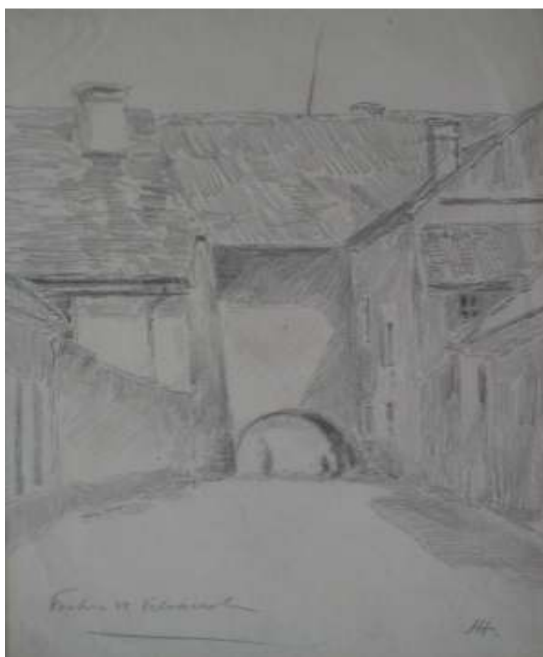
54. Fortna ve Velvarech, nedatováno, tužka, papír, 35,9 x 25,8. Inv. č. 146/52.