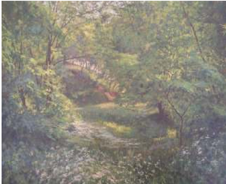
7. Křivánkova rokle (Rokle na Hrombabě), 1938, olej, lepenka, 60 x 45 cm. Inv. č. GAL