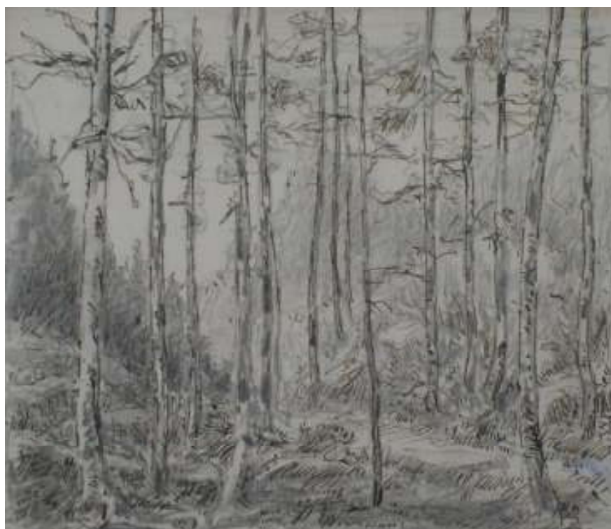
64. Lesní interiér, nedatováno, tužka, pero, papír, 11 x 14 cm. Inv. č. GAL 146/6.