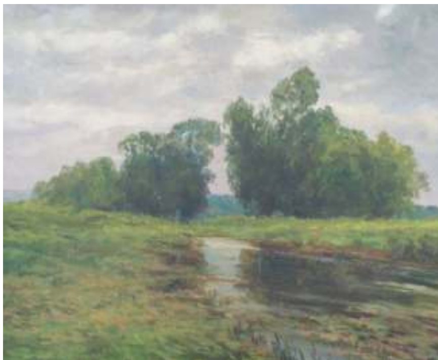
34. Stromy na břehu u železničního mostu, nedatováno, olej, lepenka, 28 x 36 cm. Inv. č. GAL 321.