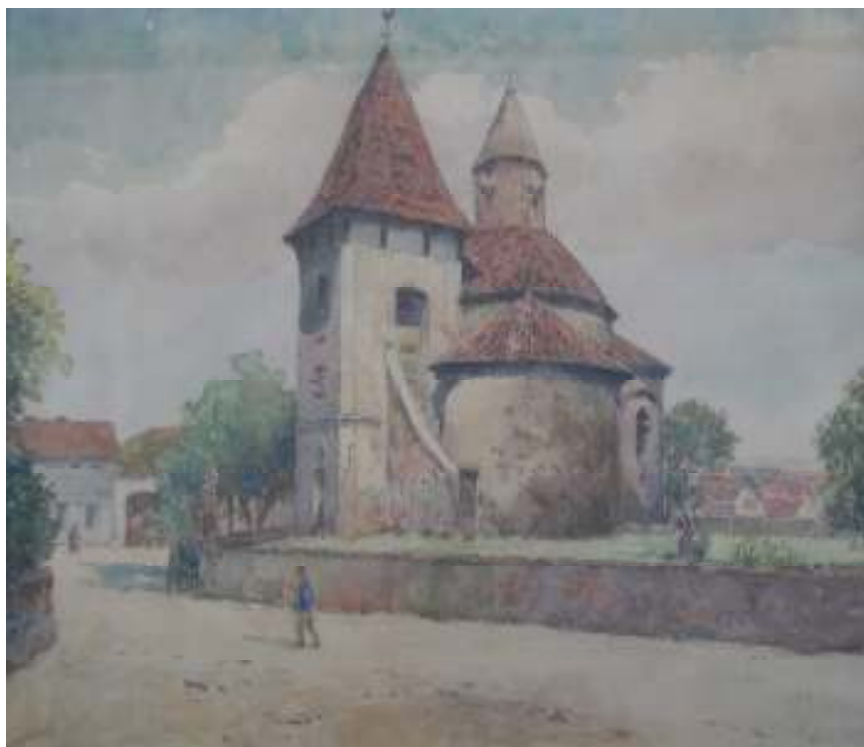
15. Kostel v Holubčích, 1905, akvarel, papír, 41 x 33 cm. Inv. č. GAL 272.