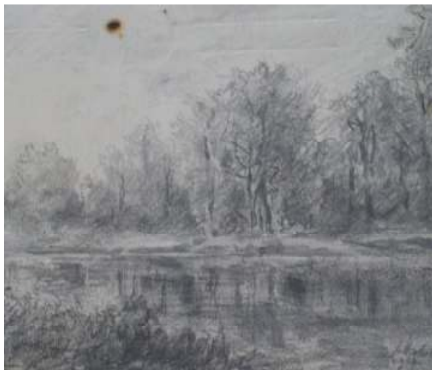
98. Studijní kresba, 1934, tužka, papír, 11,4 x 15,3 cm. Inv. č. GAL 146/29.