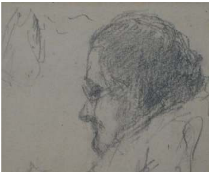
89. Studijní kresba, nedatováno, tužka, papír, 14,5 x 11,5 cm. Inv. č. GAL 146/14.