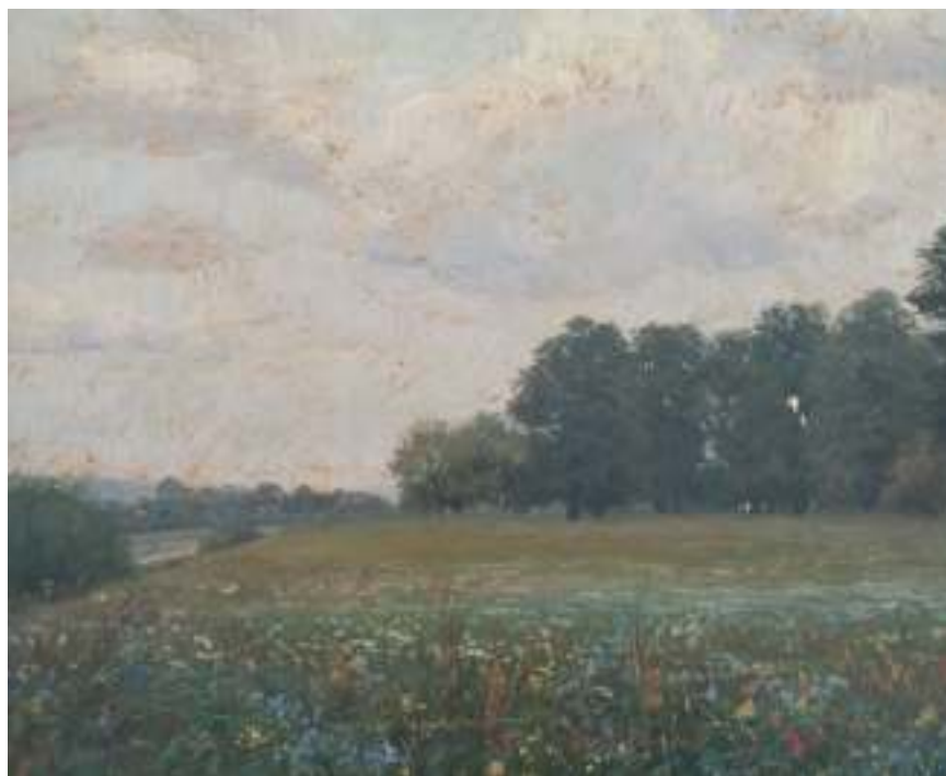
11. Louka proti Nelahozeveskému zámku, 1895, olej, karton, 50 x 32 cm. Inv. č. GAL 69.