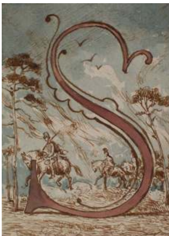
110. Studijní kresba, nedatováno, akvarel, papír, 14 x 10 cm. Inv. č. GAL 146/60.