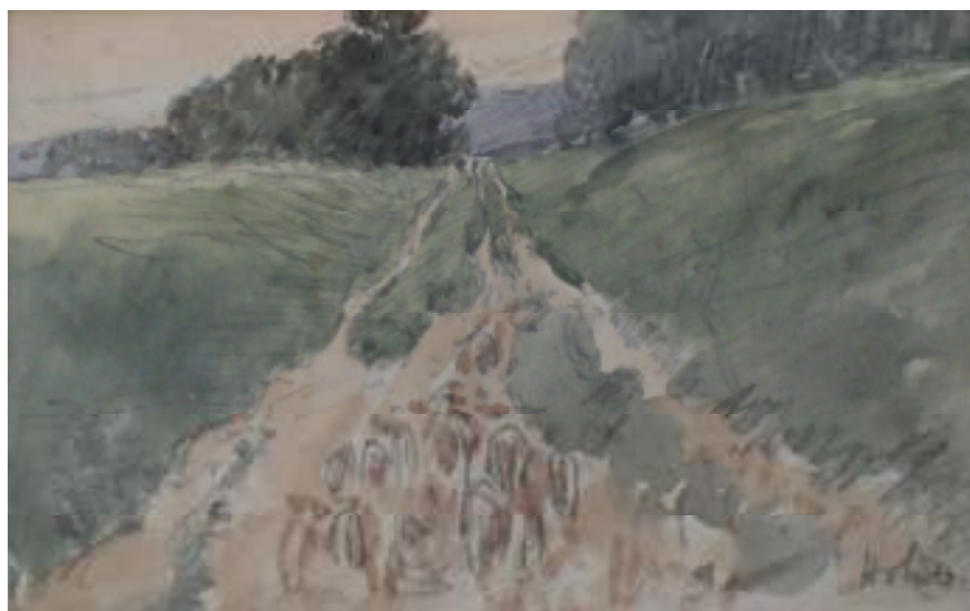
60. Na Poličsku, nedatováno, tužka, akvarel, papír, 7,4 x 13 cm. Inv. č. GAL 146/9.