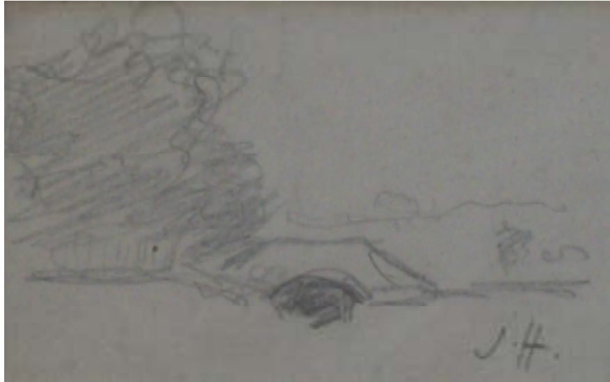
61. Studijní kresba, nedatováno, tužka, papír, 4 x 7 cm. Inv. č. GAL 146/23.