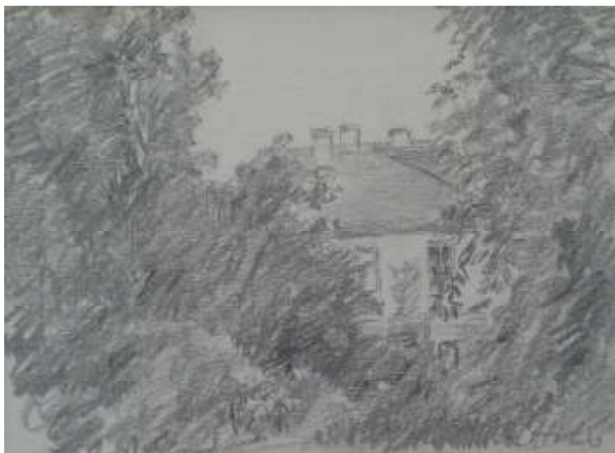
101. Studijní kresba, nedatováno, tužka, papír, 11,2 x 14,5 cm. Inv. č. GAL 146/39.