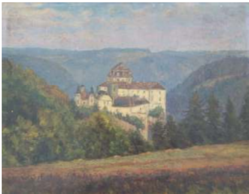
23. Zámek Vranov nad Dyjí od západní strany, 1932, olej, karton, 28,5 x 36,5 cm. Inv. č. GAL 378.