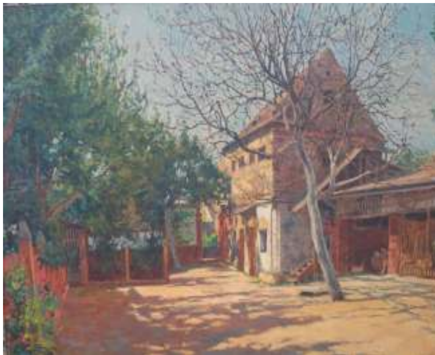
21. Hospodářský dvůr, 1929, olej, lepenka, 49 x 60 cm. Inv. č. GAL 368.