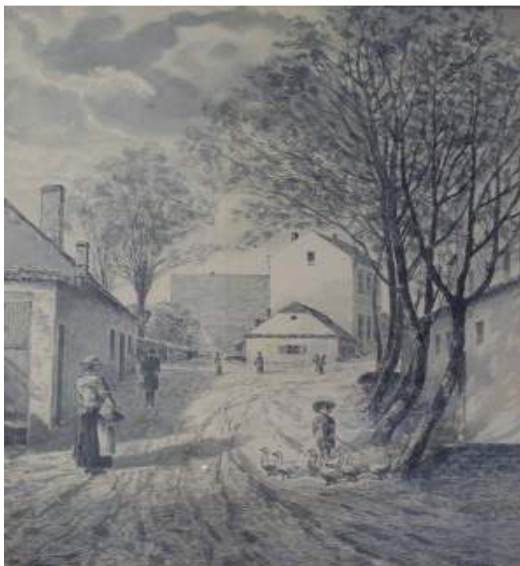
39. Jodlova ulice v roce 1885, 1935, lavírovaná kresba, 42,5 x 33,5 cm. Inv. č. GAL 195.