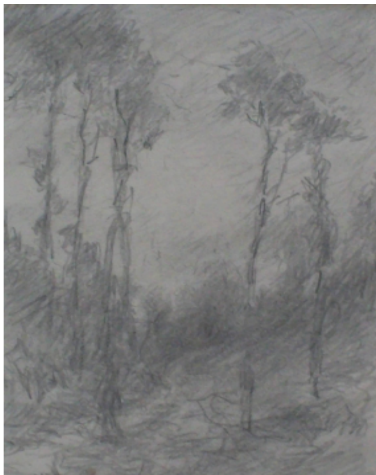
73. Snivý večer, 1940, tužka, papír, 10 x 7,3 cm. Inv. č. GAL 146/27.