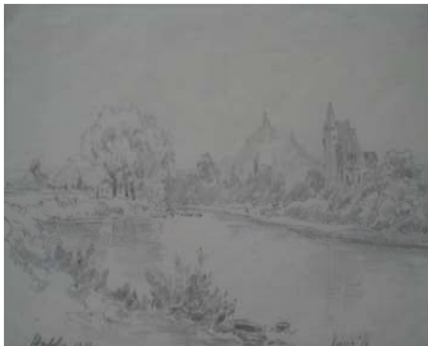
52. Křesín, 1932, tužka, papír, 13,6 x 20,3 cm. Inv. č. GAL 146/57.