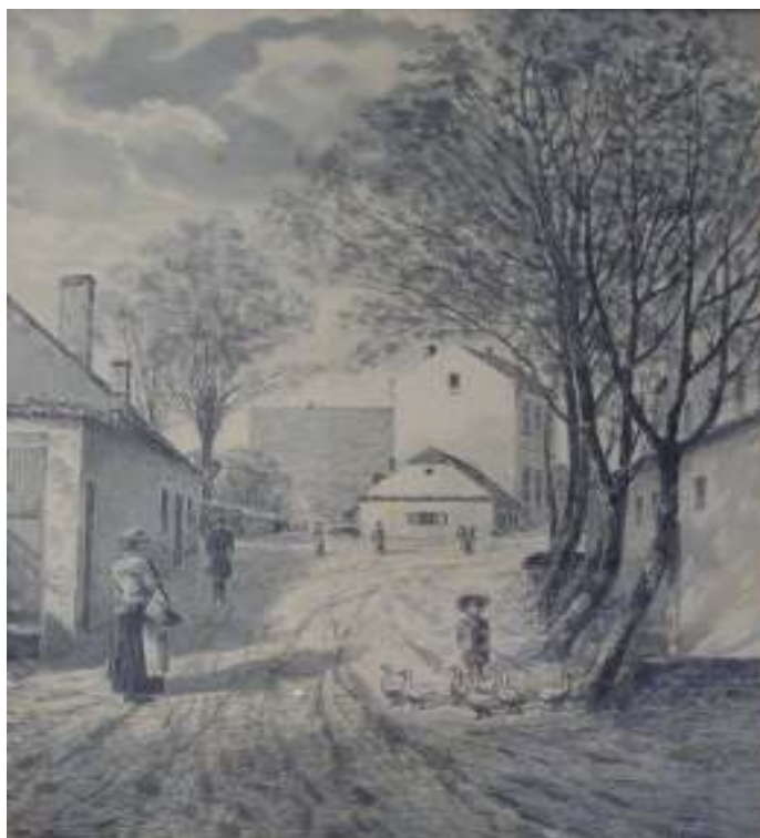
3. Josef Holub: Jodlova ulice v roce 1885, 1935, lavírovaná kresba. Městské muzeum v Kralupech nad Vltavou