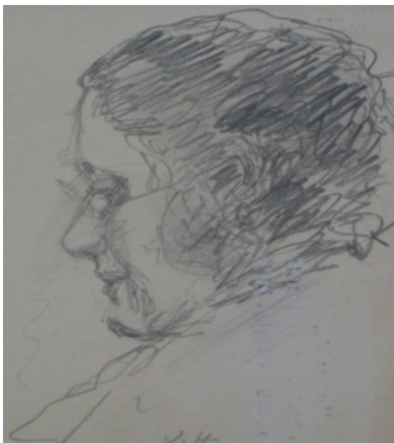
90. Studijní kresba, nedatováno, tužka, papír, 16,5 x 11,5 cm. Inv. č. GAL 146/15.