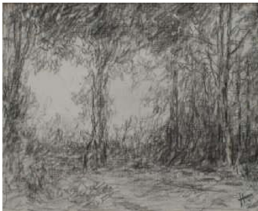
94. Na panské louce, 1945, tužka, papír, 10 x 14,6 cm. Inv. č. GAL 146/5.