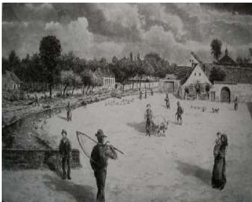
41. Kralupská náves v roce 1860, 1932, lavírovaná kresba, papír, 26 x 35 cm. Inv. č. GAL 197.