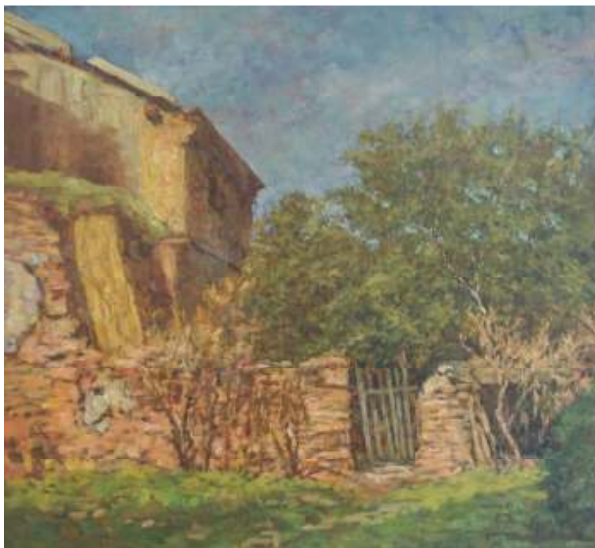
27. Podháj po náletu, 1946, olej, překližka, 40,5 x 38,5 cm. Inv. č. GAL 259.