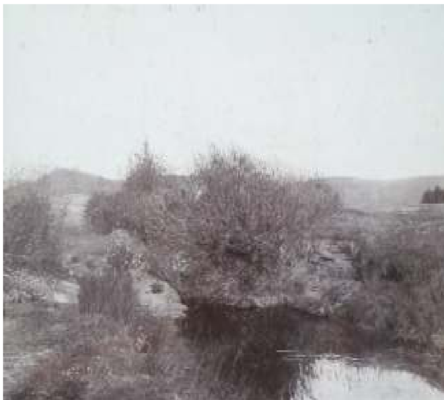
6. Josef Holub: Železné hory u Ronova, 1895