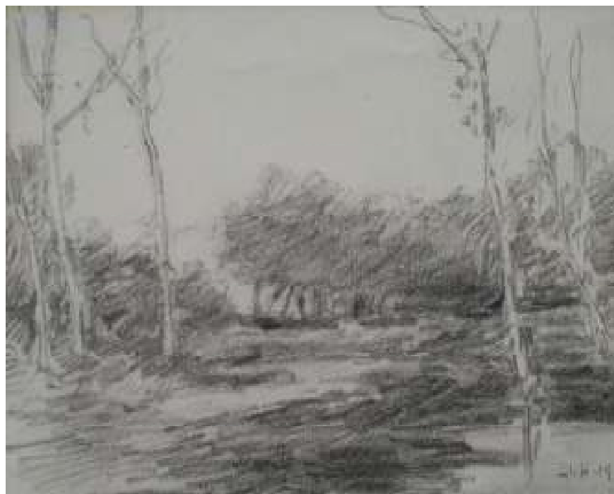
96. Studijní kresba, 1944, tužka, papír, 10,5 x 14,8 cm. Inv. č. GAL 146/1.