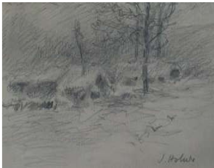
74. Studijní kresba, nedatováno, tužka, papír, 11,5 x 16,5 cm. Inv. č. GAL 146/26.