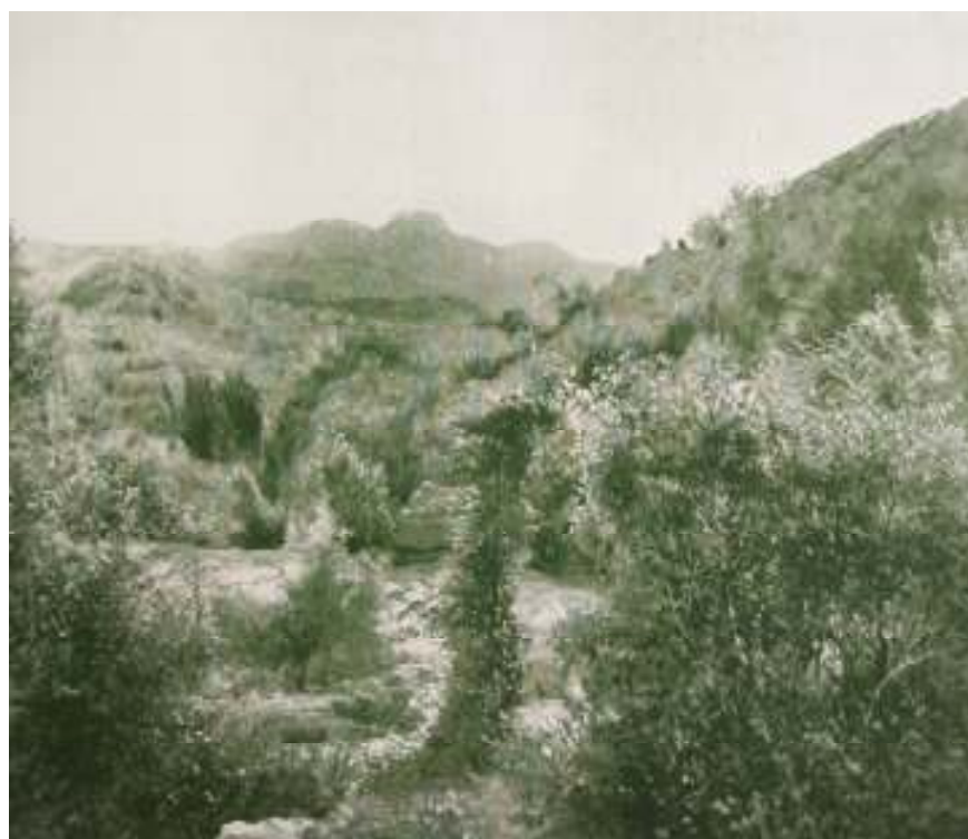
16. Josef Holub: Lovčen na Černé Hoře, 1896