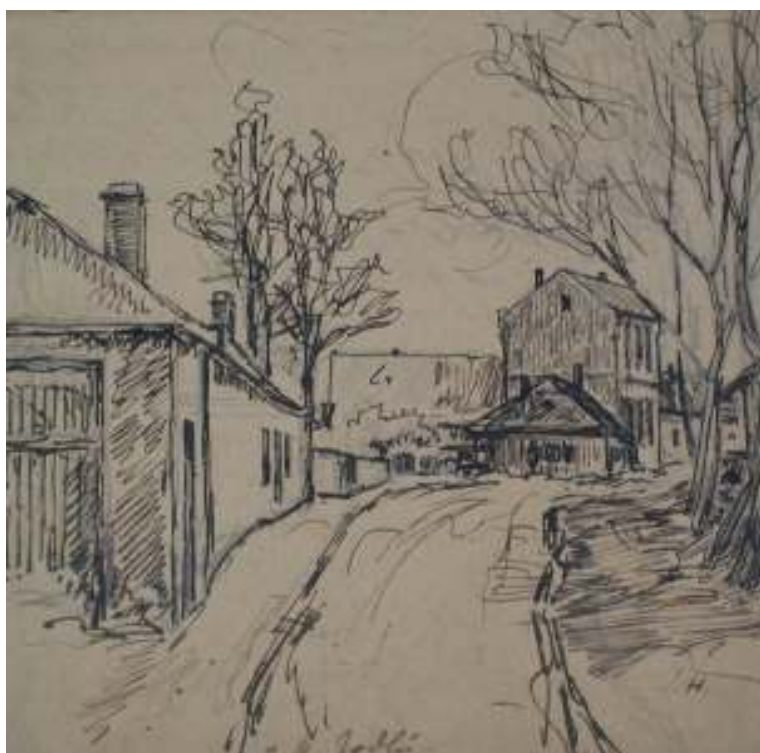
40. Studijní kresba U Jodlů v roce 1885, 1935, pero, papír, 21 x 17 cm. Inv. č. GAL 146/13.