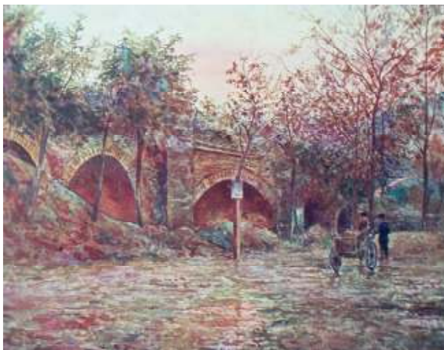
2. Josef Holub: Železniční most dráhy Pražsko-Podmokelské, 1922