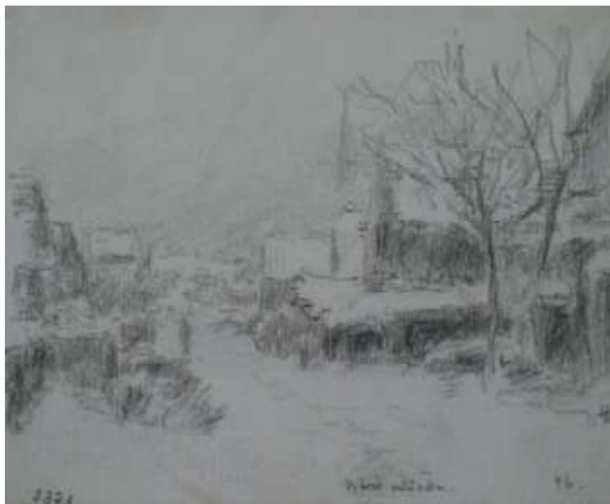
53. Naše ulička, 1946, tužka, papír, 13,6 x 25 cm. Inv. č. 146/38. Foto: autorka