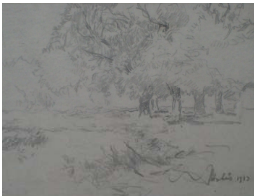
100. Studijní kresba, 1933, tužka, papír, 11,2 x 16 cm. Inv. č. GAL 146/61.