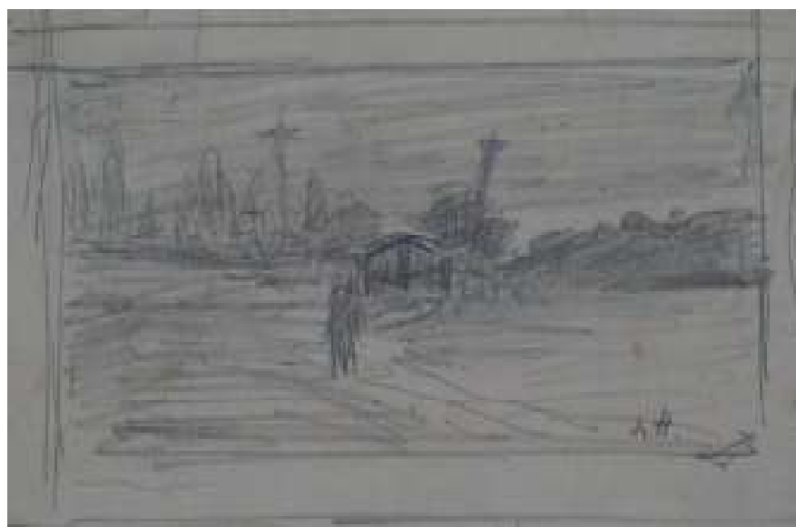
102. Studijní kresba, nedatováno, tužka, papír, 6,3 x 11,3 cm. Inv. č. 146/32.