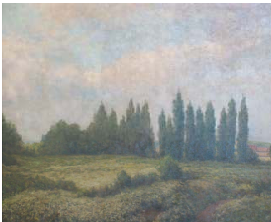
6. Pod petrolejkou, 1951, olej, plátno, 100 x 80 cm. Inv. č. GAL 62.