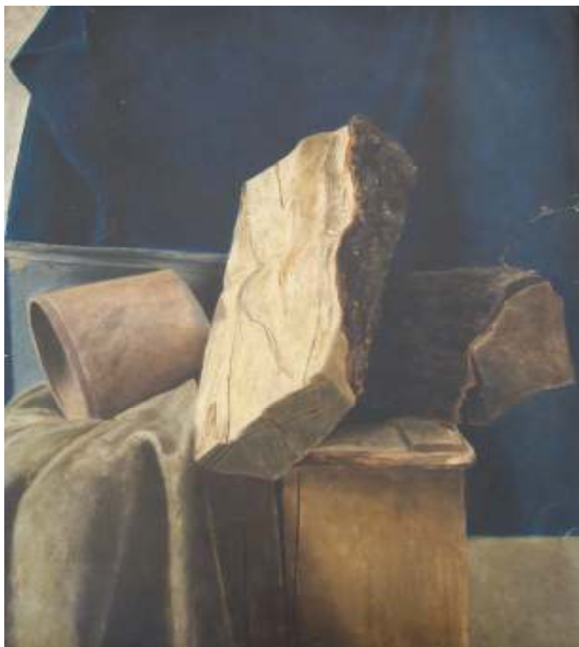
3. Zátíší, nedatováno, olej, karton, 51,5 x 42 cm. Inv. č. GAL 56.