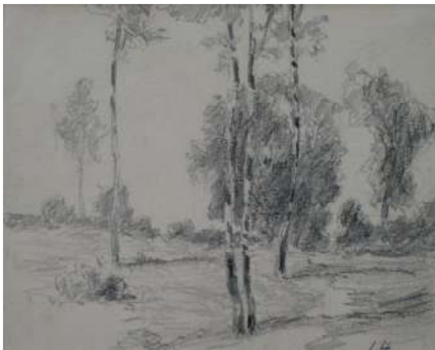
99. Studijní kresba, nedatováno, tužka, papír, 24,7 x 34 cm. Inv. č. GAL 146/42.