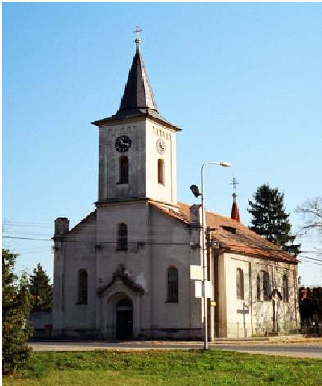
KOSTEL SVATÉHO VOJTĚCHA V PŘEROVĚ NAD LABEM.