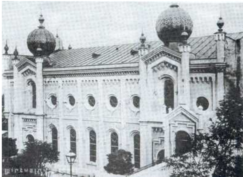
Synagoga v Cieszynie, ulice Bóźnicza č.p. 6.