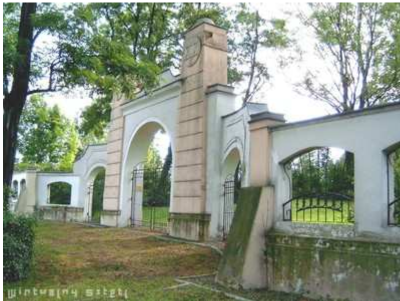
Hřbitovní brána, Nový židovský hřbitov Cieszyn, ulice Hażlaska číslo 39.