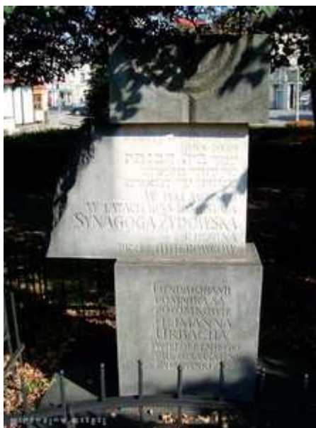
Pomník ve Skoczowě