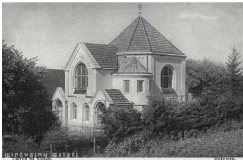
Synagoga v Ustroni