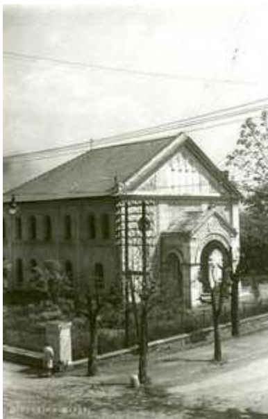
Synagoga v Skoczowě