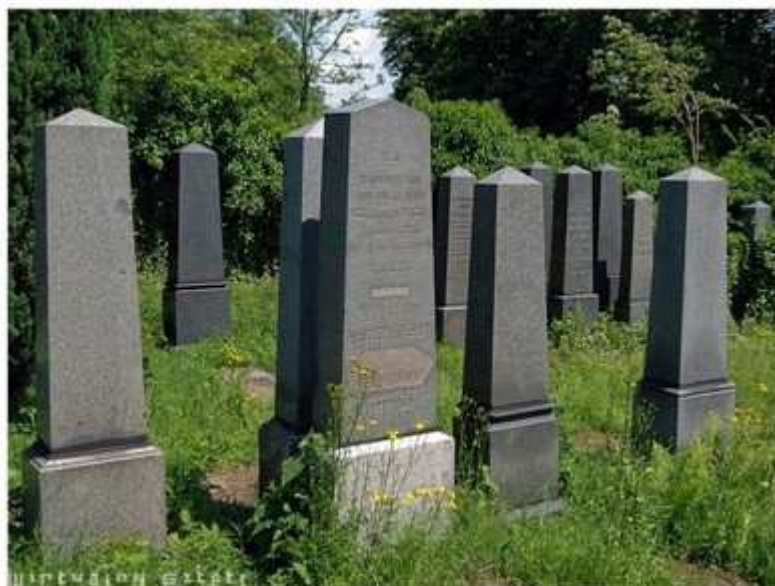
Hřbitov v Bielsko-Bialej