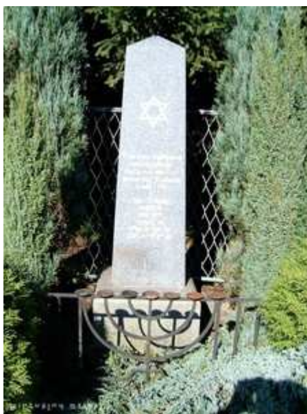
Pomník v Ustroni