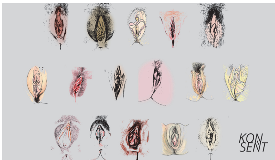
Obrázek č. 1 Vulvy

Obrázek 6: Kresby pohlavních orgánů, metodika organizace Konsent 84