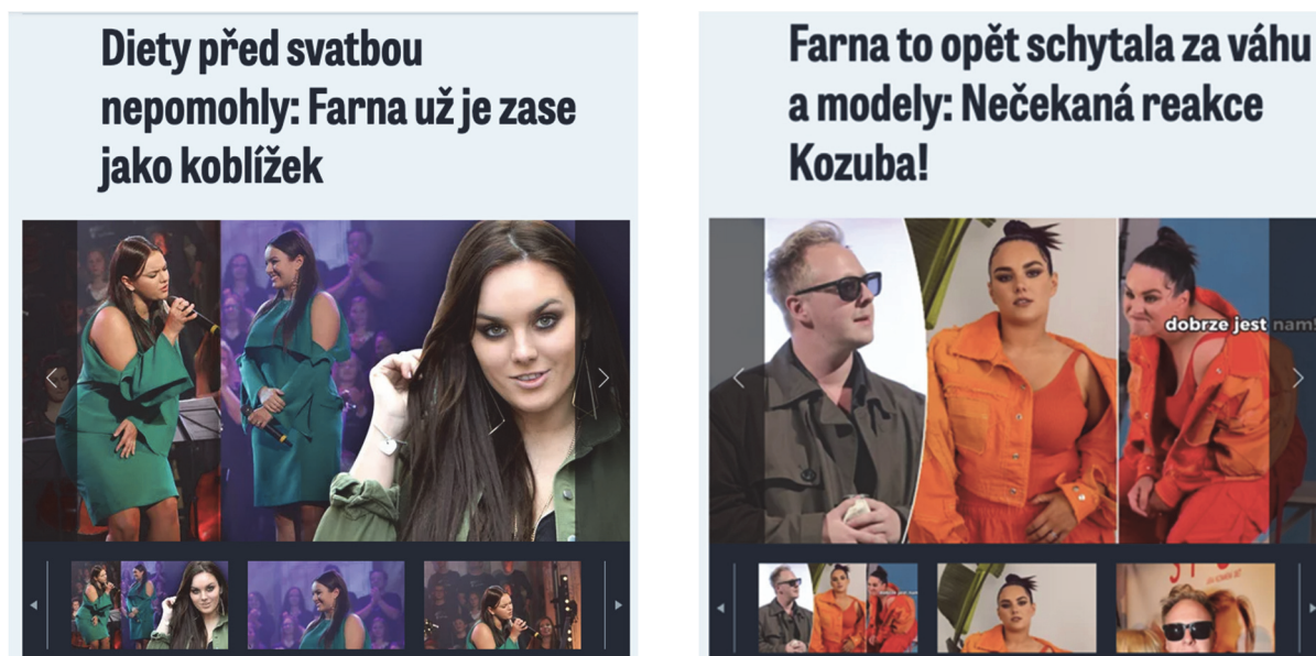
Obrázek 4: Příspěvek o Ewě Farně na stránkách Blesk.cz 80 Obrázek 5: Reakce herce Kozuba na Ewu Farnou, Blesk.cz 81

Postup: Nejdříve žákům promítáme následující ukázky z deníku Blesk: