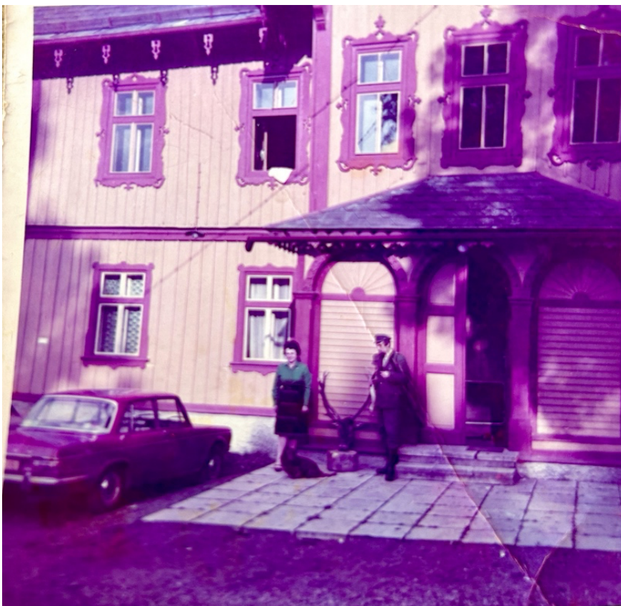
Obrázek 11: Poplatkové lovy na Zámečku (Soukromá sbírka L.P., 60. léta. 20.st.)

socialistické Československo nedostatkovou položkou, přičemž se domnívám, že podstatnou roli zde sehrál i dobový měnový kurz, díky němuž byla „západní“ měna mnohem silnější než československá koruna a cizinci si tak kupovali služby za podmínek, které by v zemích mimo „východní blok“ jen těžko získali. Pokud by se razantně zvedla cena částek za poplatkové lovy pro zahraniční lovce, je velmi pravděpodobné, že by se jejich počty velmi snížily. Formování nové sociální reality bylo také zásadně závislé na okolní přírodě s lesy s dostatkem zvěře, která lovce ze zahraničí zajímala. Všichni byli součástí jednoho žitého prostoru, jenž se vzájemnými interakcemi neustále vyvíjel.