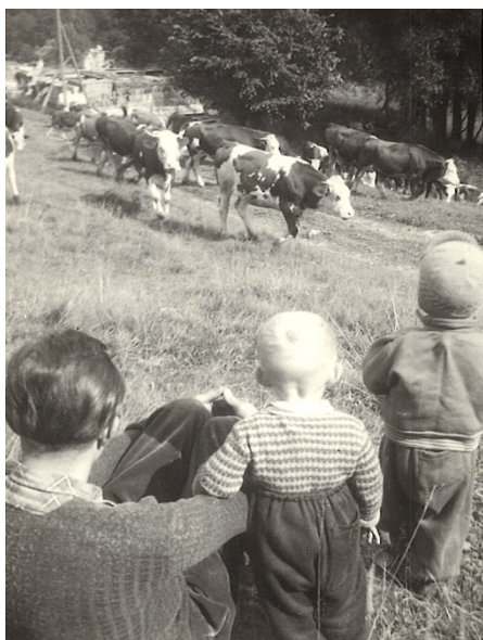
Obrázek 3: Krajina Černé Vody, 50. léta 20. st.

ukončit ničení vysídlených měst a zajistit jejich bezpečné fungování (Wiedemann 2016: 39–