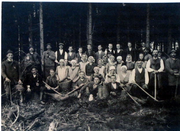
Obrázek 1: Práce v lese, Schwarzwasser/Černá Voda, 20. léta 20. st. (Archiv obce Orlické Záhoří).

okolí byli dřevaři z Tyrol, za nimiž postupně přicházely i jejich rodiny. V oblasti údajně také pobývali italští skláři, od nichž se místní učili technice tavení a broušení skla. Přímo v Černé Vodě i v dalších přilehlých obcích se nacházela řada malých tzv. lesních skláren, ale i větších