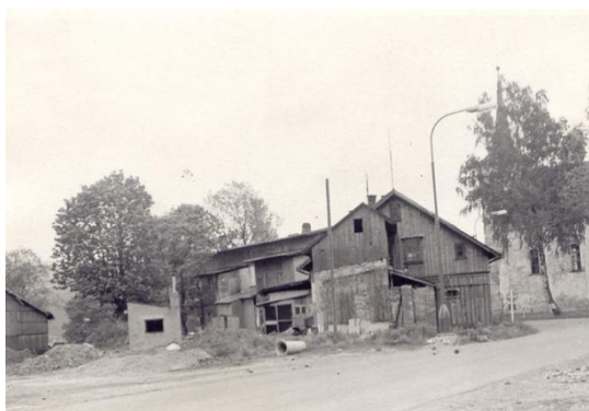
Obrázek 7: Orlické Záhoří, 50. léta 20. st.

„Komise projednala poznatky všech svých členů o nadměrném požívání alkoholu v naší obci. Bylo zjištěno, že zvláště zaměstnanci ČSSS, ale i jiní, vysedávají v pracovní době v hostinci, kde požívají nemírně alkohol. Totéž se týká i řidičů motorových vozidel. Byli také zjištěni občané, kteří soustavně holdují alkoholu, což má za následek obyčejně domácí nesrovnalosti a trpí tím většinou děti. Komise se usnesla na následujícím: a) uzavřít hostinec po dobu pracovní doby mimo poledne, večer stanovit zavírací dobu ve 22.00 hod, mimo středy a soboty, kdy se promítá film; b) zdůraznění zákazu podávání lihovin řidičům motorových vozidel, jak v hostinci, tak i v obchodech; c) potlačení prodeje laciných vín v obchodech i v hostinci, a to v ceně do 20 Kčs; d) naprostý zákaz prodeje alkoholických nápojů těmto občanům: A...Z.“ 89