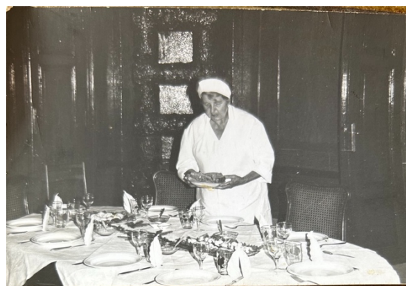
Obrázek 9: Zámeček a jeho hosté (Soukromá sbírka L.P. 60. léta 20. st.)