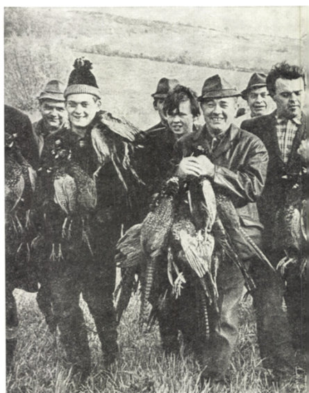
Obrázek 6: Na lovu, 60. léta 20. st. (V. Paulišta 1975:88)

Z výše uvedené citace si můžeme udělat představu o tom, jak to na lovu ve skutečnosti mohlo vypadat, neboť dobové normativy a praxe se poměrně odlišovaly. Oblečení na lov mělo nejen estetickou, ale i účelovou rovinu, např. teplé či nepromokavé doplňky. Ty se ale