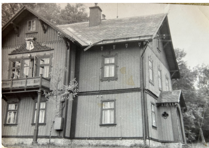
Obrázek 8: Zámeček (Soukromá sbírka L.P., 60. léta 20. st.).

„[...] dole – to bylo hrozný. V kuchyni nebyla podlaha, tam byla jenom taková ta udusaná hlína. To se všechno dělalo, no. [...] nahoře byla sedací vana, plechová, to bylo jediný, co tam zůstalo. Jinako opravdu nic... prostě, všechno se buď rozkradlo, nebo rozbilo, takže to bylo... No říkám, nahoru jsme lezli z venku po žebříku, protože to schodiště bylo celý zničený. [...] ale pak se to dalo všechno dohromady a bylo to hezký. Každýmu se to líbilo. Dokonce k nám přišli – pionýrské tábor, na prohlídku. To byla sranda tenkrát.” 100