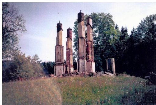
Obrázek 12: Zámeček (Archiv obce Orlické Záhoří, 70. léta 20. st.).