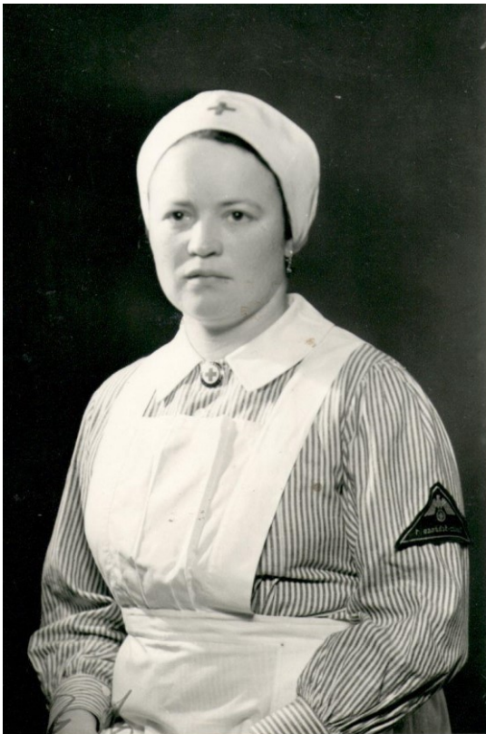
Obr. č 6: Absolventka Německé ošetřovatelské školy 205