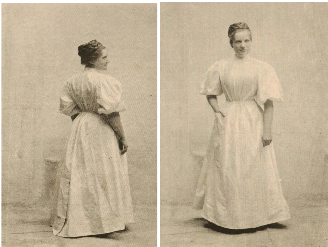
Obr. č 14: Stejnokroj ošetřovatelky z počátku 20. století určený pro operační sál, zástěra z Billrothova batistu 458

Ve vládním nařízení č. 22/1927 Sb v §14 bylo uvedeno, že ministerstvo veřejného zdravotnictví a tělesné výchovy má v plánu vydat předpisy o služebním stejnokroji ošetřovatelek a jeho užívání. Do té doby předpisy nebyly jednotné. Je možné poukázat na oběžníky ministerstva zdravotnictví ze 7. 5. 1925, č. 13229; 4.8.1925 č. 15647; 3.2.1927 č. 2873 459 , které stanovovaly nárok na služební oděv pro ošetřovatele a ošetřovatelky a tzv. definitivní zřízence. Výpomocní zřízenci, smluvní a námezdní personál na služební oděv nárok neměl. U zřízenců mužů sestával služební oblek ze sakového kabátu, vesty, kalhot a čepice a ze služebního zimníku. Ženy pak měly povinnost nosit sukni, blůzu a služební pláštěnku. Nárok na služební obuv ošetřovatelský personál neměl. Služební oděv se vydával na jeden rok a pláště na 3 roky. Zvláštní předpisy se týkaly ošetřovatelského personálu. Obecně lze říci, že mužskému ošetřovatelskému personálu byly z ústavního inventáře zapůjčeny ochranné pláště s rukávy z bílé či jiné světlé barvy. Ženám ošetřovatelkám pak ochranné pláště nebo empírové zástěry 460 s rukávy bílé barvy překrývající celou osobu. Speciální předpisy byly vydány např. pro opatrovnícký personál na psychiatrických odděleních při státní nemocnici