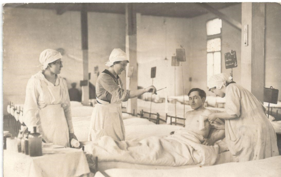
Obr. č 9: Ošetření nemocného, blíže neurčená nemocnice Brno, rok 1918 418

šátek nejednotného tvaru. (viz. obr.č. 7) Nutno říci, že ošetřovatelky se svým úborem příliš neodlišovaly od kuchařek či služebných. Z doby první světové války pocházejí též různé romanticky laděné pohlednice ošetřovatelek se symbolikou Červeného kříže (viz. obr. č. 8), které korespondují s prvotní romantickou představou dam o ošetřování raněných vojáků v počátcích války. S realitou skutečného dění tyto představy příliš společného neměly. 417