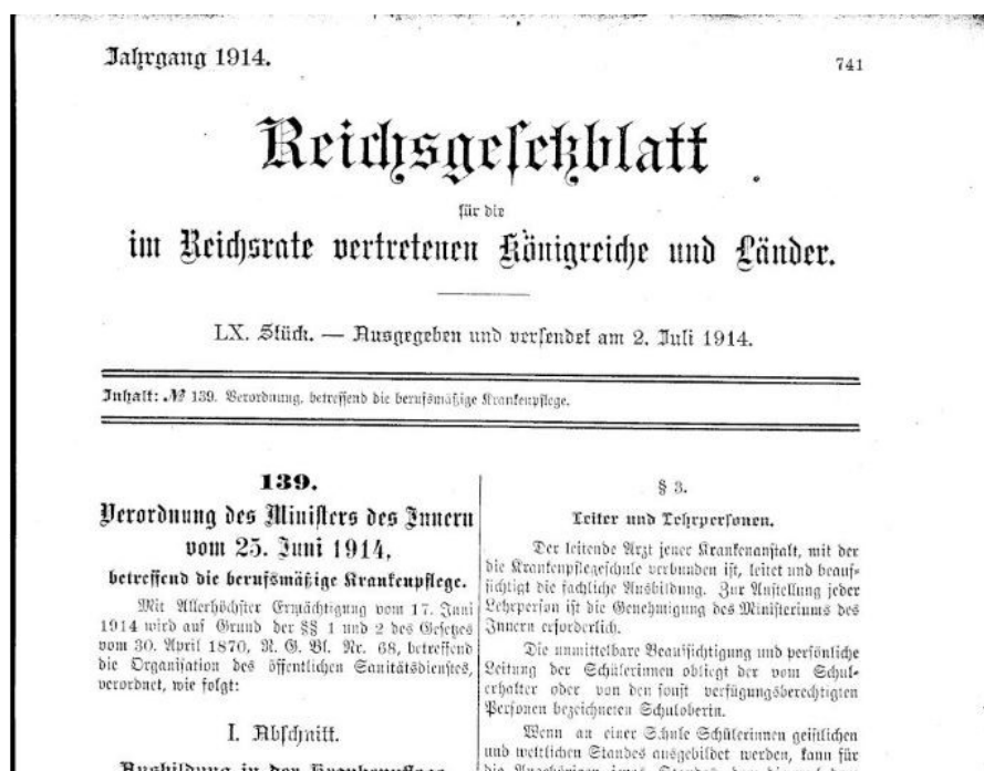
Obr. č 1: Nařízení rakouského Ministerstva vnitra č. 139 z 25. června 1914 90