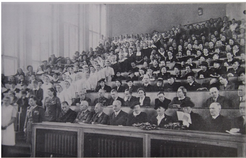
Obr. č 15: Ze zahájení Jubilejního pracovního sjezdu diplomovaných sester v ČSR, 22.11.1946. V popředí Hana Benešová a Alice Masaryková 520

Na tomto sjezdu prvně zazněla „Píseň ošetřovatelek“, kterou zazpívaly žákyně této školy. Byla to přehlídka vykonané práce diplomovaných sester za 30 let. Dobové prameny tvrdí, že sjezd měl vysokou úroveň. Byl navštíven absolventkami školy, ale byly též zastoupeny nadřízené úřady – Ministerstvo zdravotnictví, Ministerstvo školství, Ministerstvo národní obrany, Zemský národní výbor, KSČ a ostatní politické strany, ROH, přednostové a lékaři klinik, Československý červený kříž a žákyně všech pražských ošetřovatelských škol. Ze sjezdu vyšel jubilejní sborník, kde jsou otištěny všechny referáty, návrhy a diskusní příspěvky. Za třicet let absolvovalo první ošetřovatelskou školu 1176 žákyně, což je v průměru 40 ročně. Z tohoto počtu se zúčastnilo se více jak 400 sester. 521