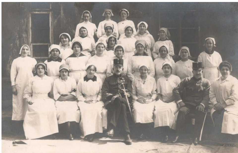
Obr. č 10: Personál nemocnice Pardubice, období 1. světové války 419