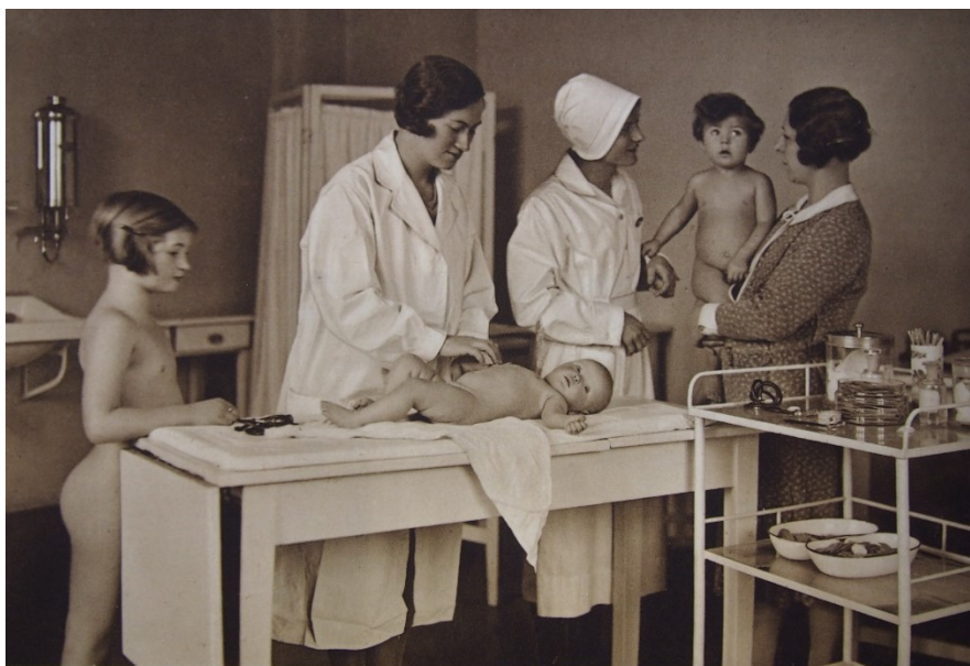
Obr. č 8: Diplomované sestry v Poradně Naším dětem v Praze na Žižkově 393