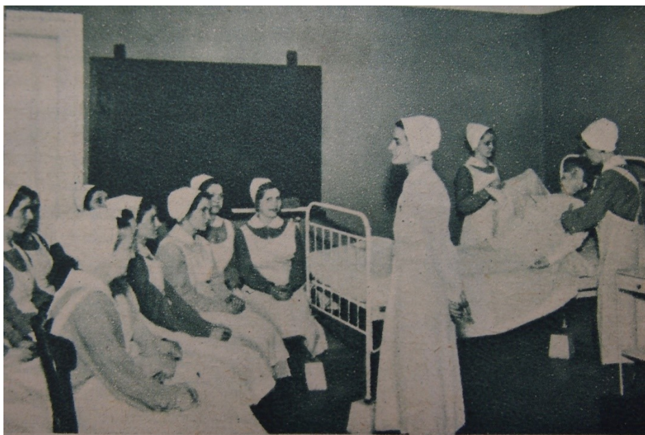
Obr. č 4: Učebna pro výuku ošetrovatelské techniky 194

Pro školu a internát byla vybrána strategicky položená budova v Ječné ulici č. 4, což bylo nedaleko Všeobecné nemocnice v Praze. Uchazečky prvního ročníku 1916 se velmi těšily na nástup do školy. Internát byl velmi pěkně zařízen. Ložnice byly po dvou lůžkách. V učebně a jídelně byl dlouhý stůl, u kterého měla každá žákyně své místo. V ložnicích nebylo povoleno přes den pobývat. 193 Internát byl zařízen a veden sestrou představenou a jejími asistentkami, tzv. školními sestrami v duchu povznesení osobnostní, společenské a morální úrovně žákyň. Součástí byla vybavená knihovna, společenská místnost s klavírem pro hudební večery.