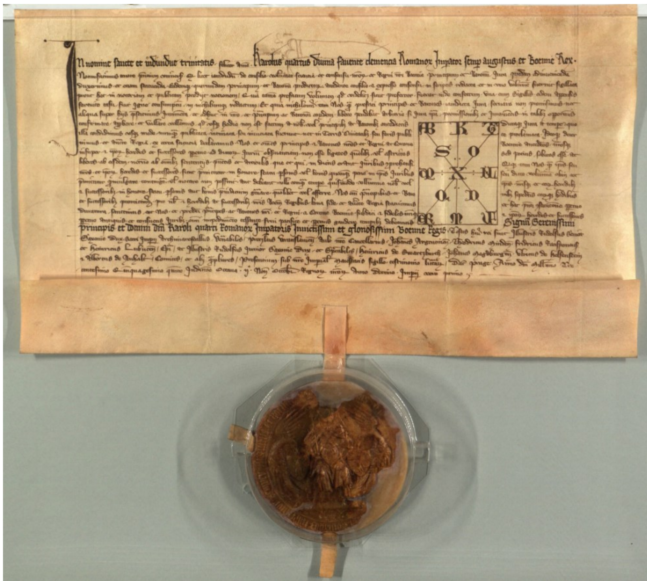
2. Revokační listina Karla IV. k Maiestas Carolina z 6. října 1355. Dostupné z: http://monasterium.net/mom/CZ-NA/ACK/505/charter [cit. 2022-06-01].