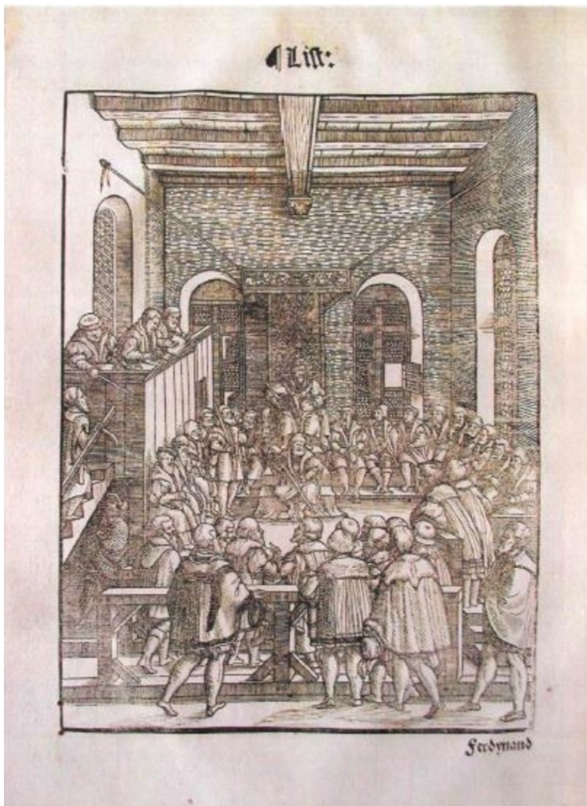
5. Zasedání zemského soudu, Zemské zřízení z roku 1549 , Strahovská knihovna, sign. CN IV 22, Folio A VIIv.