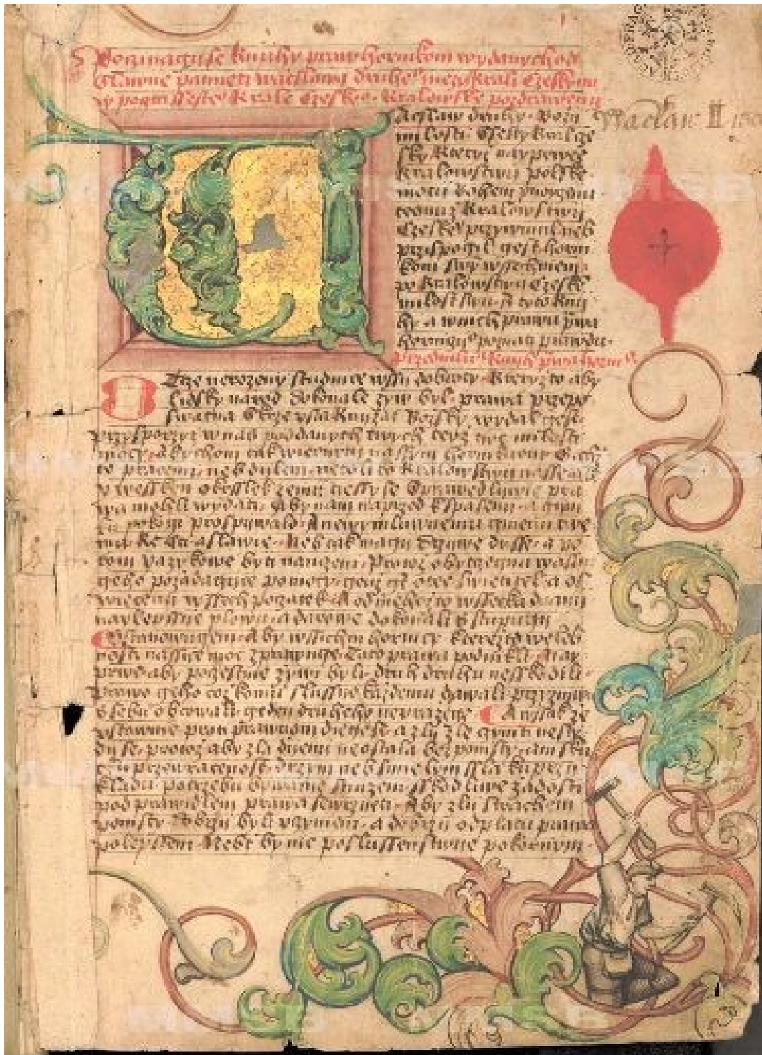
1. Titulní strana rukopisu „Ius regale montanorum aneb právo královské horníkuov“ z roku 1528, fond Národní knihovny ČR, sign. MS XVII D 43.