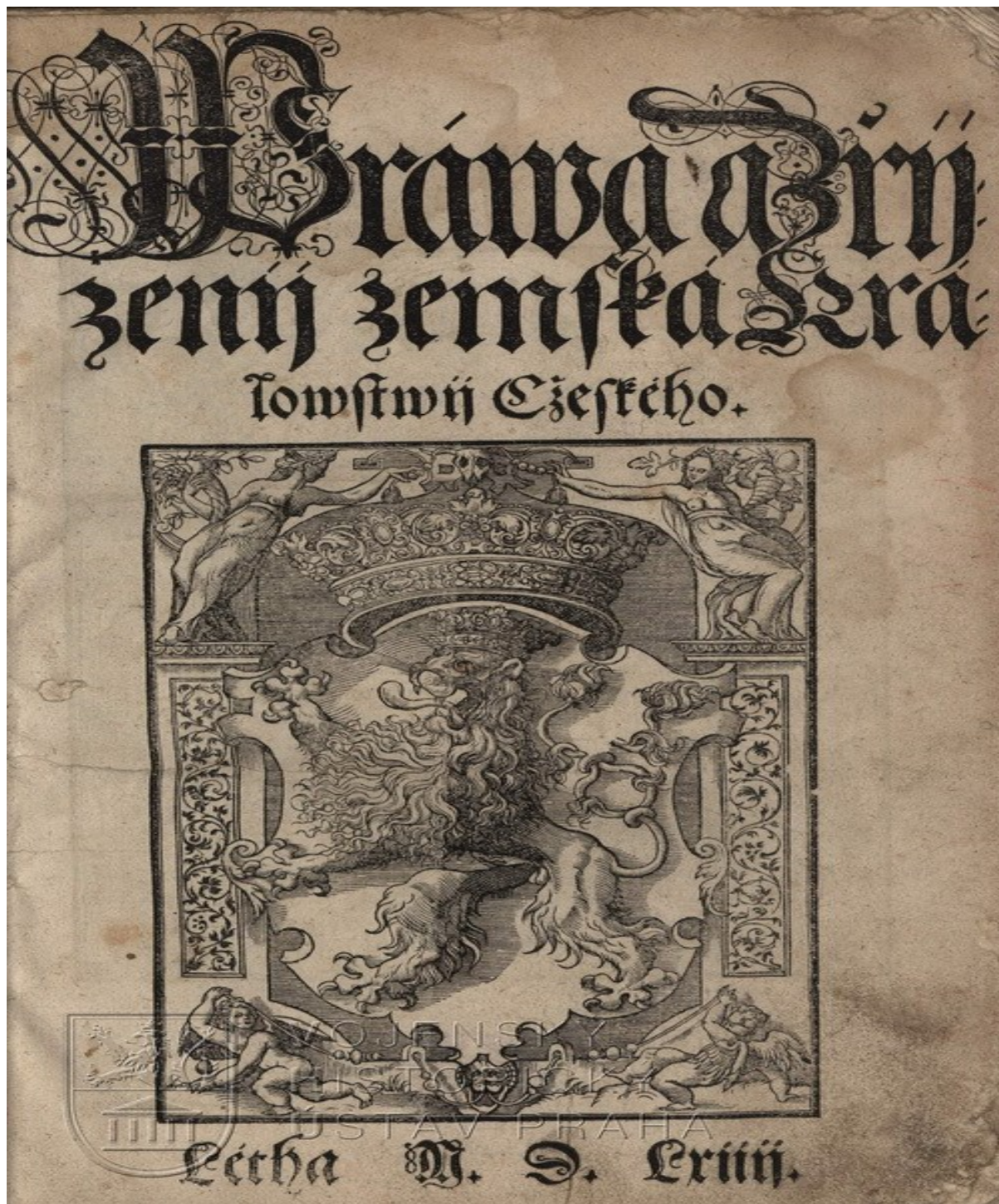
6. Zemské zřízení z roku 1564, fond Vojenského historického ústavu. Dostupné z: http://www.vhu.cz/exhibit/prawa-a-zrijzenij-zemska-kralowstwij-czeskeho/ [cit. 2022-06-01].