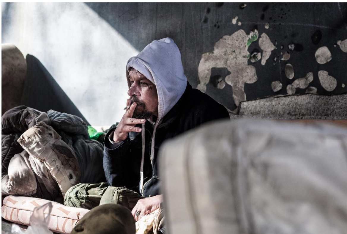
Obrázek 2. Bydlení pod mostem