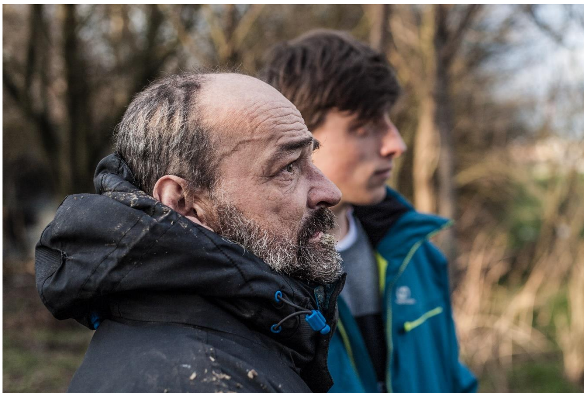
Obrázek 4. Pohled do krajiny