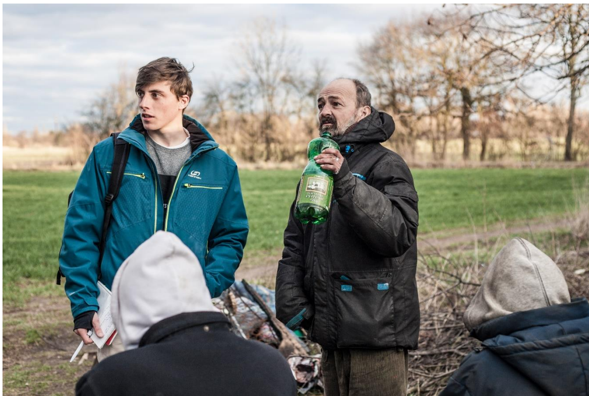
Obrázek 1. Neformální rozhovor s aktéry

pouze jeden den, což byl jeho třetí den „na ulici“. Poté jsem se s ním „na ulici“ již nesetkal a nikdo z informátorů o něm nic nevěděl. O něco později jsme se zkontaktovali přes sociální síť a já jsem se dozvěděl, že se přemístil do Prahy, kde začal bydlet a pracovat.