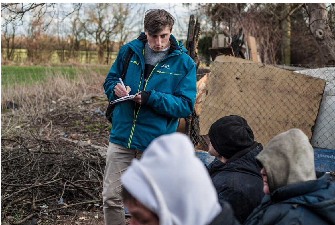
Obrázek 3. Posezení vedle plechové chatky