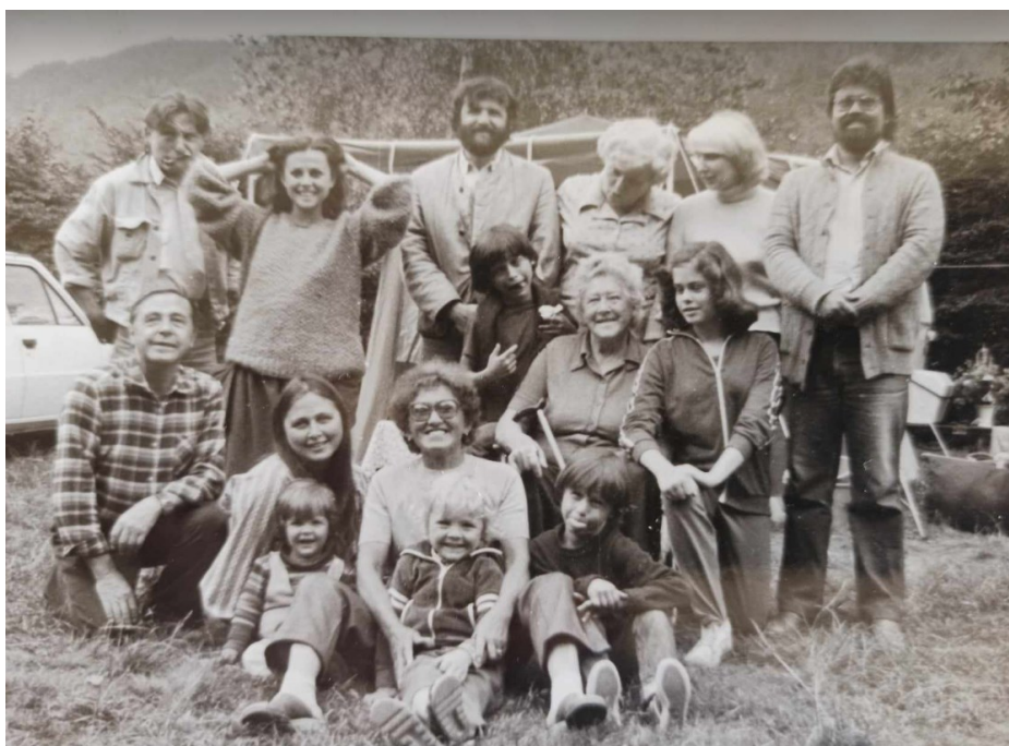
Obrázek 6: Setkání v Kostelci nad Orlicí.