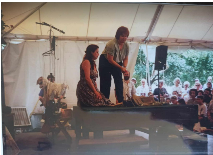
Obrázek 10: Zde vystupovala Vladimíra Kopecká s asistentkou, která pocházela z USA, ale studovala DAMU v Praze.