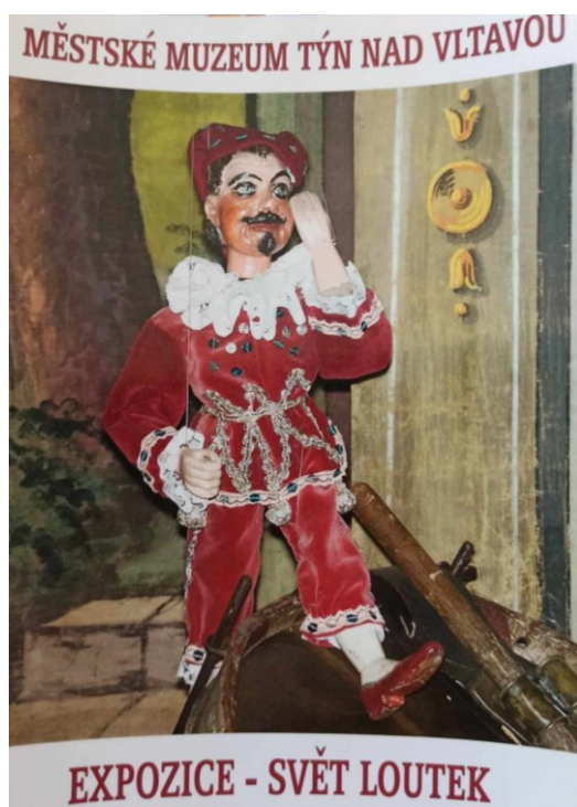
Obrázek 5: Loutka Kašpárka na pohlednici z Městského muzea Týn nad Vltavou.