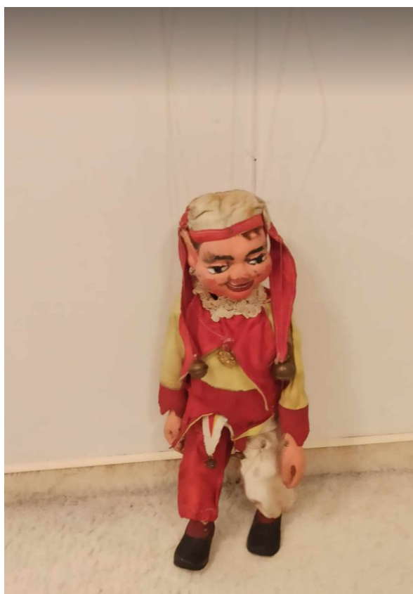
Obrázek 4: Kašpárek Kopeckých z Kojetic.