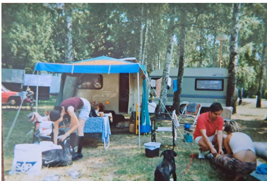
Obrázek 7: Iva a Jakub Kopečtí (vpravo) v Kostelci nad Orlicí.