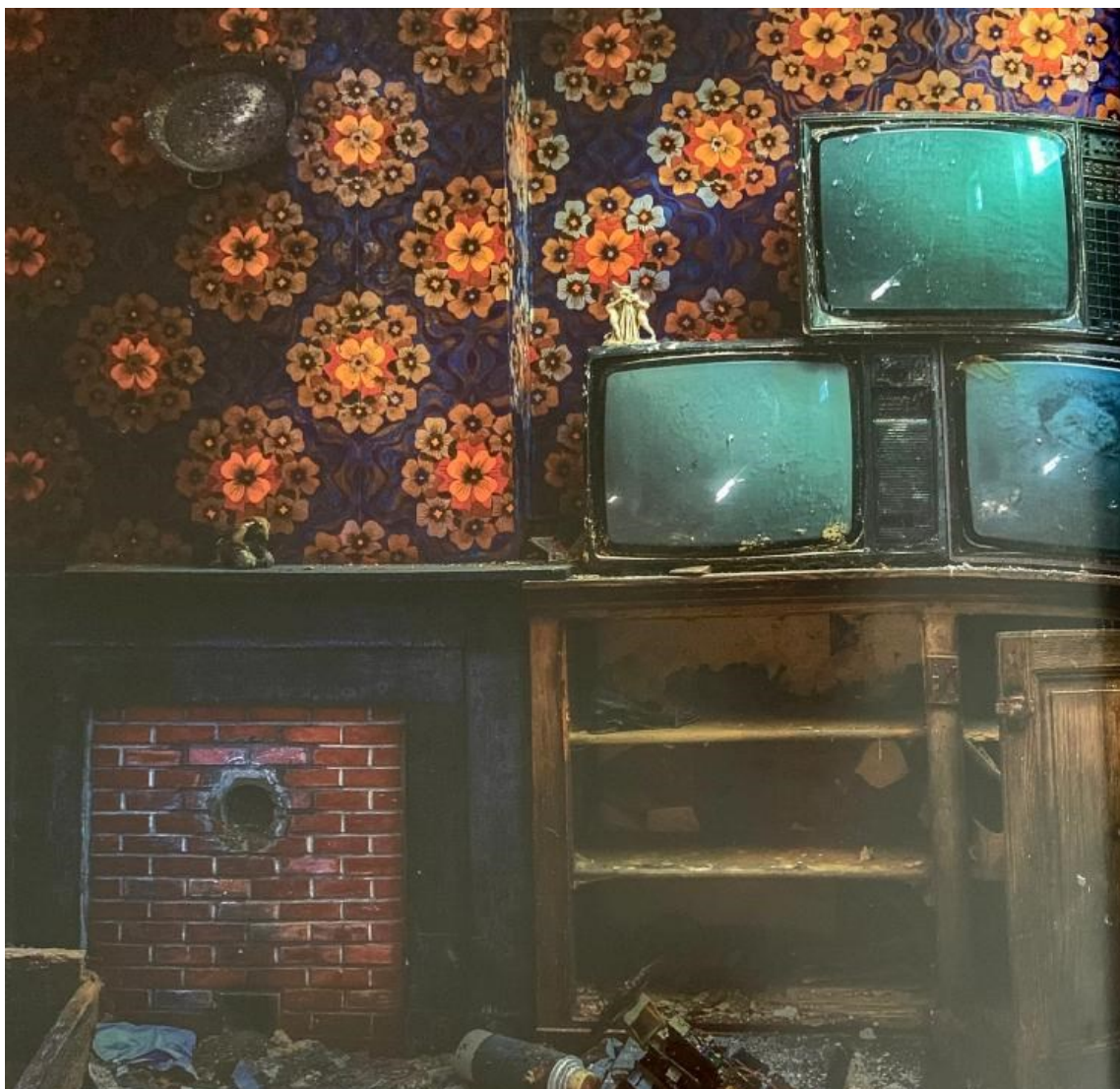
9. Michael Kerrigan, fotografie interiéru s tapetami, podle kterých se vile začalo přezdívat Château Congo, 2018.