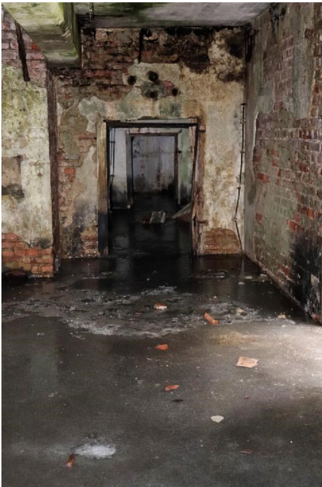
14. Aneta Vacková, podzemní části cínového dolu, jejíž zem je stále pokryta ledem i v jarních měsících, Rolava, duben 2023.