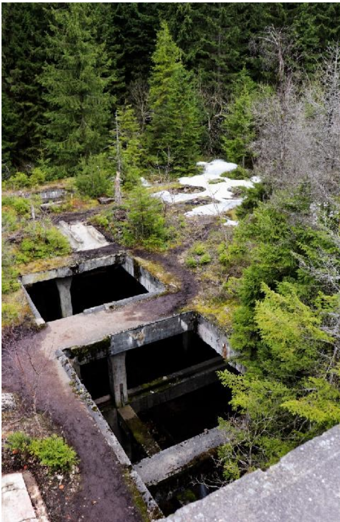
11. Aneta Vacková , skelet cínového dolu, jež pohlcuje les, fotografie z horního patra, duben 2023.