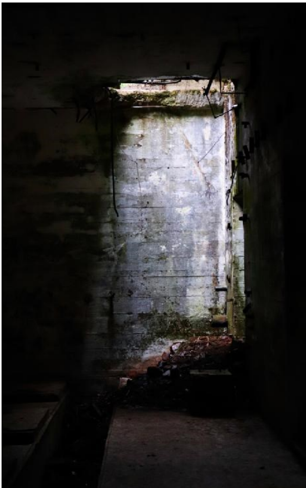
5. Aneta Vacková, osvětlená místnost v podzemí v cínovém dolu Rolava, duben 2023.