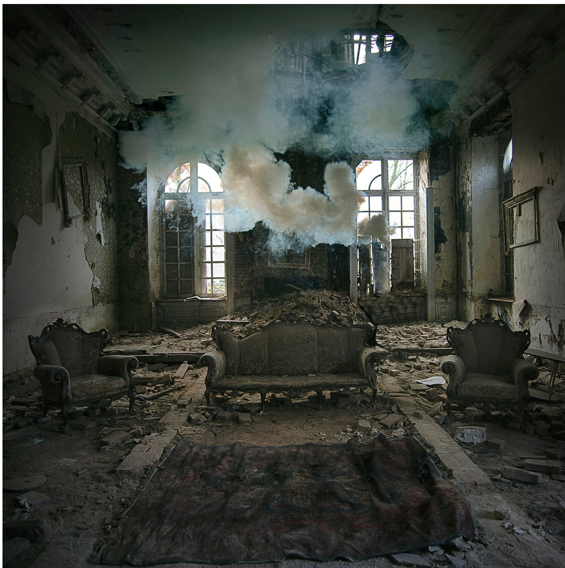
10. [Rebecca Bathory], fotografie interiéru Château Congo , s pohovkou a křesly, což lze řadit i do „židlového fenoménu“ urbexu, 2014.