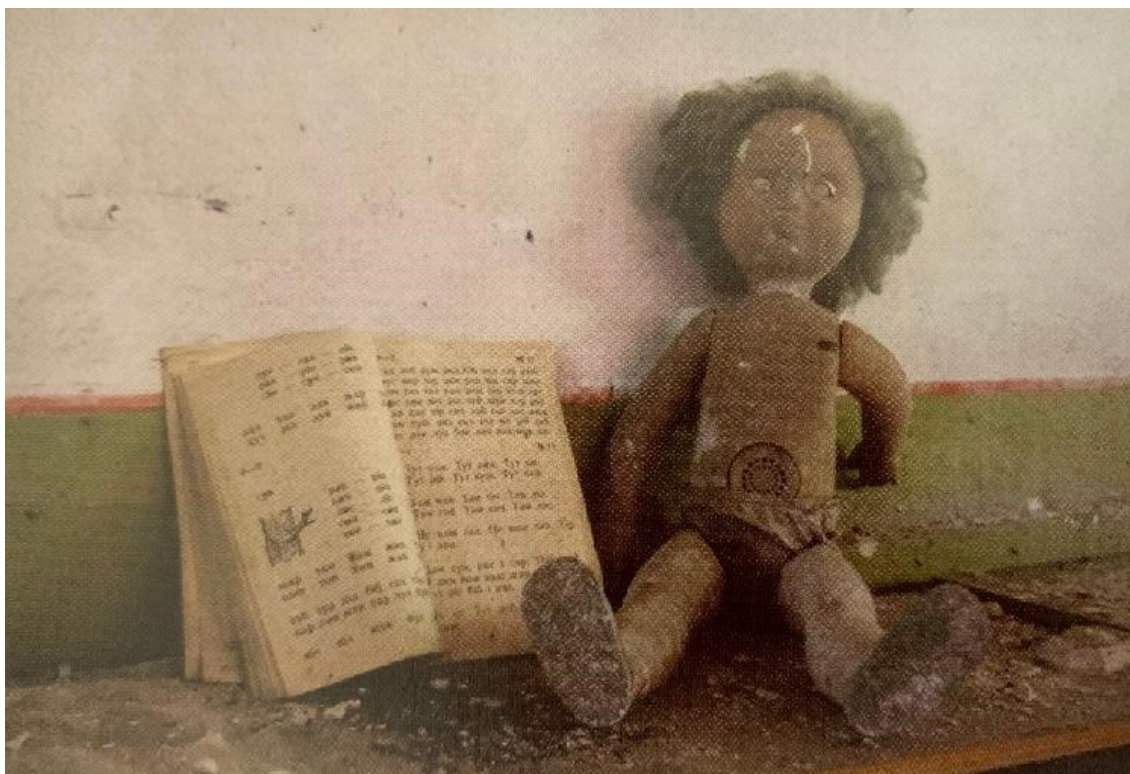
7. Darmon Richter, dětská panenka v ukrajinském městě Prypjat', 2020.