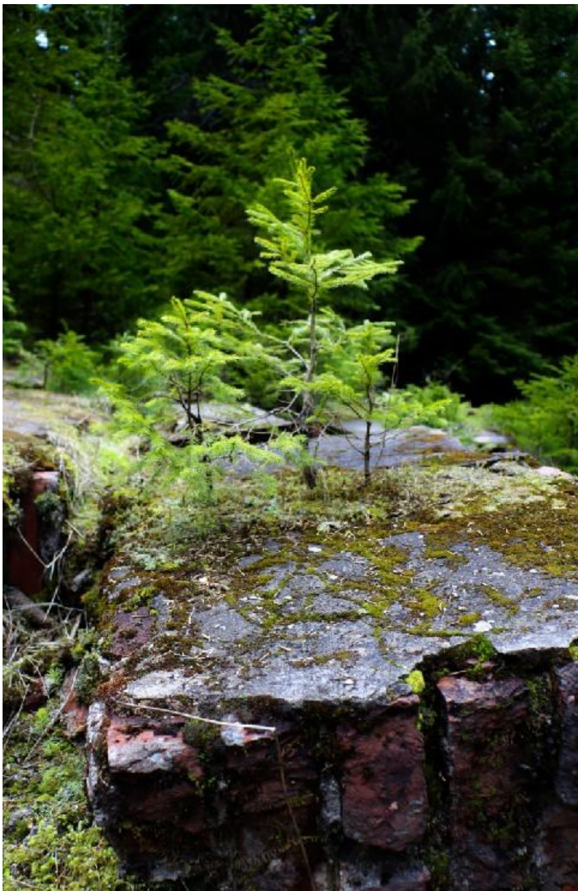
13. Aneta Vacková, malé stromky rostoucí ze zbytků betonové kontrakce v areálu cínového dolu Rolava, duben 2023.