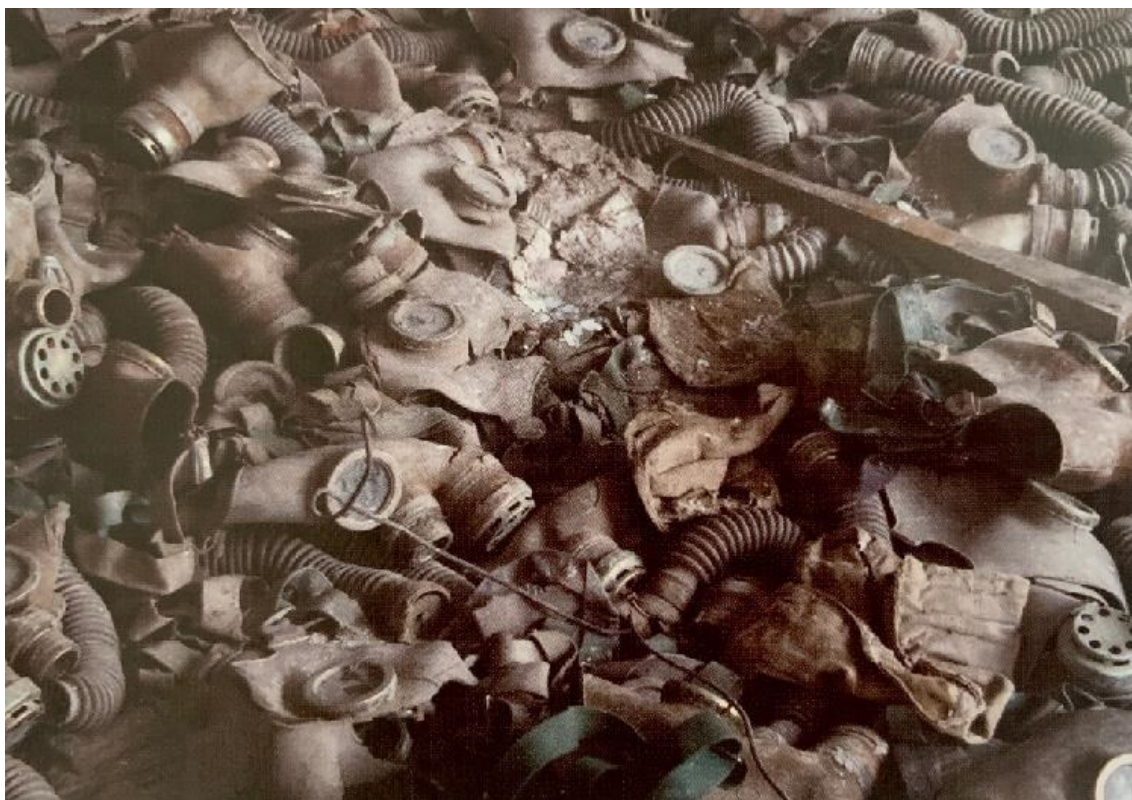
8. Darmon Richter, zbylé plynové masky v ukrajinském městě Prypjat', 2020.