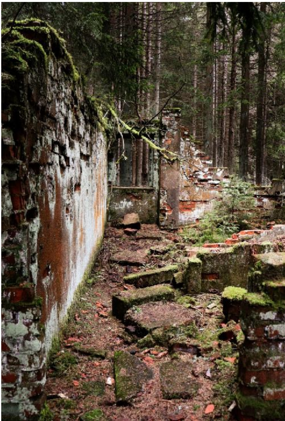
15. Aneta Vacková, zbytky po opuštěném zajateckém táboře, ležícím naproti cínového dolu na Rolavě, duben 2023.