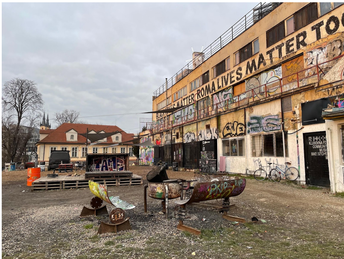
Obr. č. 16. Bike Jesus s dvorčekom.

(rozhovor s pánom Bartoňom, vedúceho VD. Štvanice dňa 10.3. 23)