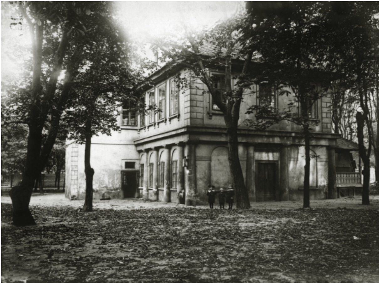
Obr. č. 8. Pohled na restauraci na Štvanici. Rok 1909.

Na ostrove sa zriadil klasicistický letohrádok s veľkou tanečnou sieňou a letné divadlo Růžodol (vid'. obr. č. 8), v dnešnej dobe známy ako Vila Štvanice, alebo budova č. 858. Je to posledná dochovaná stavba tohto typu. Tento letohrádok však neskôr ustúpil priemyselnému závodu (Svátek 1899). Po zániknutí Růžodolu v 19. storočí sa na jeho mieste postavil veľký hostinský dom. Ten mal v prvom poschodí postranný tanečný sál, ktorý bol každú nedeľu navštevovaný mládežou a konali sa v ňom plesy. Na mieste niekdajších štvaníc sa vysadili višňové stromy. Pred rokom 1848 mala budova reštauráciu s veľkou sálou na prvom poschodí. Nebola to však jediná reštaurácia. V 19. storočí sa na Štvanici nachádzali ďalšie dve reštaurácie, ktoré sa ale na rozdiel od dnešnej Vily nezachovali. Ostatné časti fungovali ako letné príbytky. Budova mala reputáciu hlučnej spoločnosti, kde v sále neutíchala hudba a tance. Budovala bola neskôr priestorom pre kadernícke a kúpeľné služby, ktoré zriad'ovalo