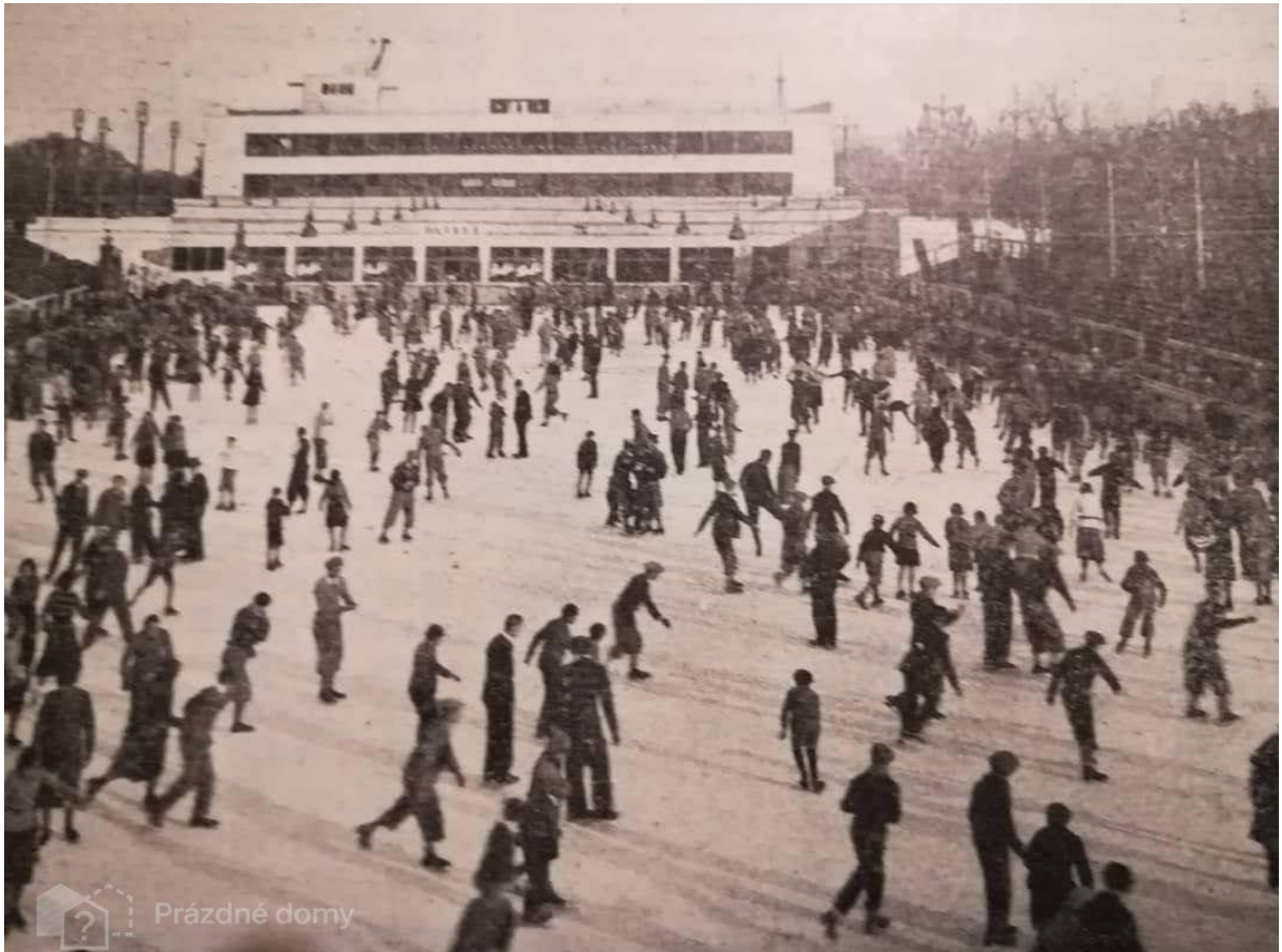
Obr. č. 10. Zimný štadión.

patria. Z týchto večierok vznikol súbor Tendiv, ktorý bol štvanickým tenisovým divadlom. V roku 1983 zahájili demoláciu starého areálu a výstavba areálu nového. Neskôr došlo k rozdeleniu majetku medzi I. ČLTK a Český tenisový zväz. Tomu patrilo Centrálny dvorec.