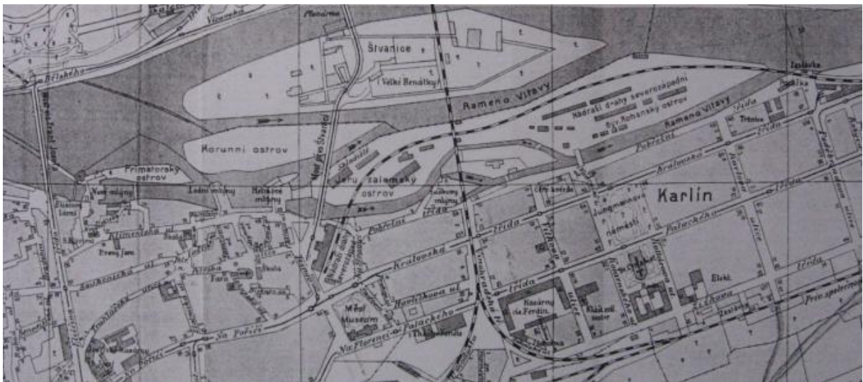
Obr. č. 4. Korunní ostrov.

Štvanice sa vyníma ako najväčší zo všetkých ostrovov zaberá pätinu kilometra štvorcového (Svátek 1899). Ostrov má 143.366 metrov štvorcových, a pre svoje nízke brehy bol niekoľkokrát zasiahnutý povodňami. Štvanice je taktiež jeden z najstarších ostrovov, ktorého zmienky vieme dohľadať do starých dôb a českých kroník (Svátek 1899). Povaha a lokalita tohto ostrova ho v histórii robila strategicky najdôležitejším a jeho držanie rozhodovalo o vydarenom či nepodarenom výsledku boja. Mimo toho bol ostrov aj priestorom pre štvanice, alebo zápasy dravých zvierat, konkrétne býkov so psami, a práve to ho robilo