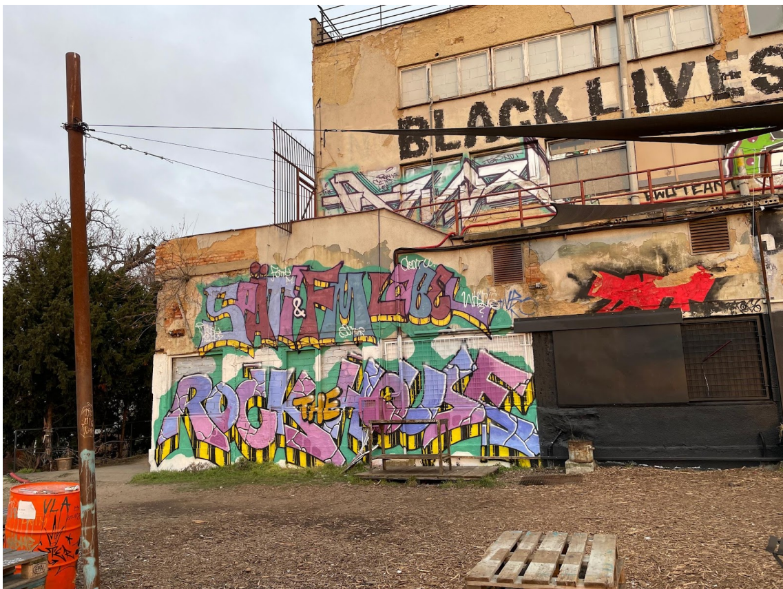
Obr. č. 18. Nové graffiti.