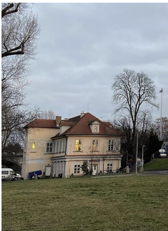
Obr. č. 20. Vila Štvanice z diaľky.

Ďalšou vynímajúcou sa budovou je Vila Štvanice (vid'. obr. č. 20). Je to stará klasicistická budova, ktorá sa nachádza na severozápade prednej časti. Budova má dve poschodia. Keď som ju prvýkrát videla, ohromila ma jej vonkajšia fasáda. Budova má krémové steny a jej strecha s detailmi je sfarbená do oranžova. Vnútro je však o to zaujímavejšie. Steny sú vystlané tehloú a evokujú pocit 19. storočia. Stavba vyzerá ako pred rekonštrukciou a nahráva jej to do charakteru. Oproti hlučnému techno klubu vedľa je budova pokojnejšia. Vo