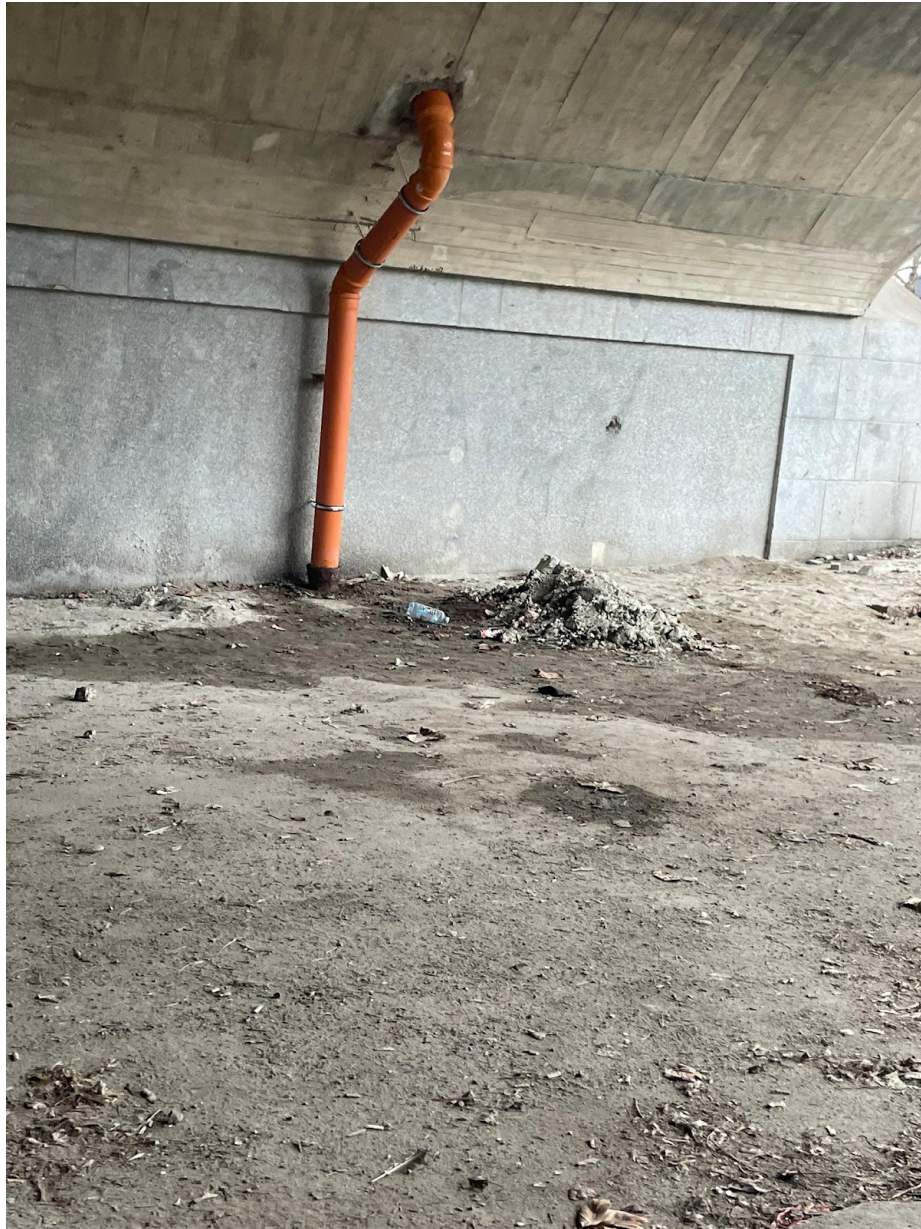
Obr. č. 15. Neporiadok pod Hlávkovým mostom.