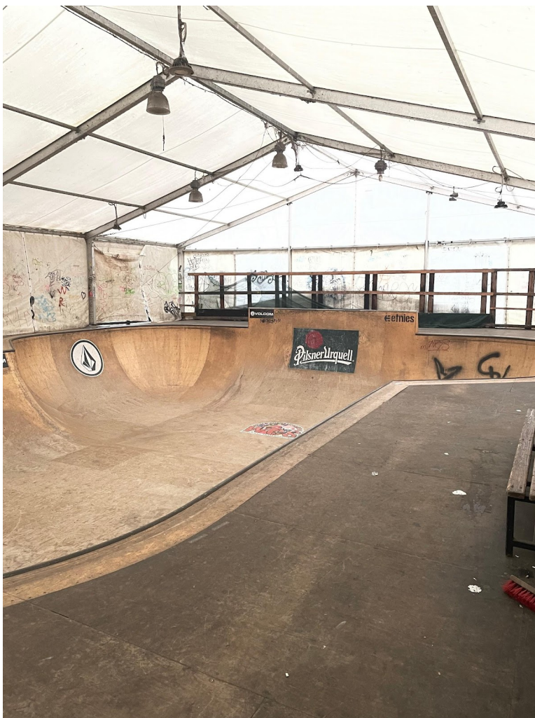
Obr. č. 27. Bazén.