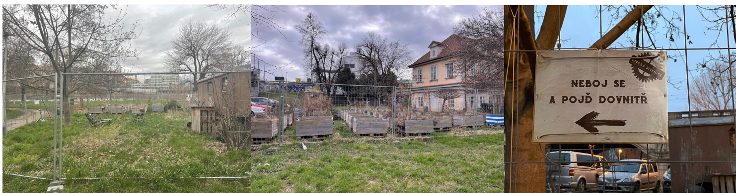
Obr. č. 22. Tygr v petrželi.

(rozhovor s Andrejom a skupinkou dňa 10.3. 2023)