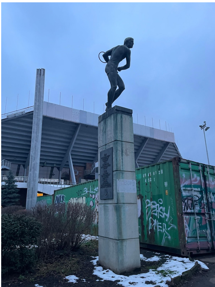
Obr. č. 24. Socha tenistu pred budovou centra.

Budova športového centra sa rovnako nedá teda minúť (viď. obr. č. 24). Systém stavby zaberá skoro celú strednú časť ostrova a siaha až za Negrelliho viadukt. Štadión je dokonca vidieť aj z diaľky. Mimo toho je ale priestor prepletený cestičkami, ktoré vedú popri plavebných komorách, k športovému centru, do prednej časti ostrova a cestičky, ktoré vedú až na koniec do zadnej časti. Okolie stredu je však mimo budovy a zelene skoro celé prázdne.