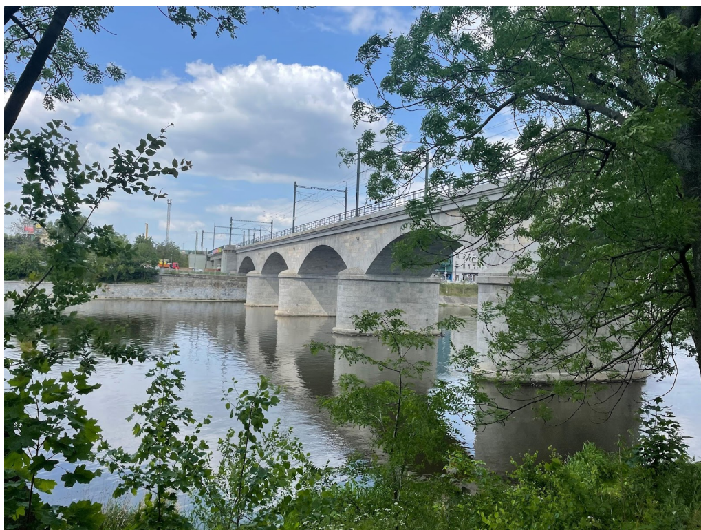
Obr. č. 13. Negrelliho viadukt zo strednej časti. Foto autorka

Okolie však netvorí iba cestičky, zeleň a budovy, ale aj dva mosty. Hlávkov most a Negrelliho viadukt (viď. obr. č. 13). Tieto dva mosty majú rozsiahlu históriu. Spomínané dve stavebné prvky nie len sprostredkujú prístup na ostrov a prechod cez neho, ale tvoria akúsi fyzickú hranicu, ktorá predeľuje priestor. Negrelliho viadukt slúžil, ako som už vyššie spomenula, na tranzit vlakov v minulosti a jeho funkcia sa ani v dnešnej dobe nezmenila. Most dodnes slúži na prepravu vlakov, a to do Kladna a smerom na Kralupy nad Vltavou 14 . K Negrelliho viaduktu sa dá dostať priamo z Hlávkoho mosta, od ktorého vedie cestička popri Správe Zdymadla priamo k nemu. Rozdeľuje teda strednú a zadnú časť ostrova. Viadukt lemuje priestor svojimi oblúkmi, ktoré sa ťahajú po šírke ostrova. Pri prechode z jednej strany ostrova na druhú sa mu nedá vyhnúť. Jeho kamenná stavba otvára pomyselnú bránu na zadnú časť ostrova. Pod mostom býval stále poriadok a viadukt som si všimla iba v momente prechádzania, alebo keď na ňom presvišťal vlak.