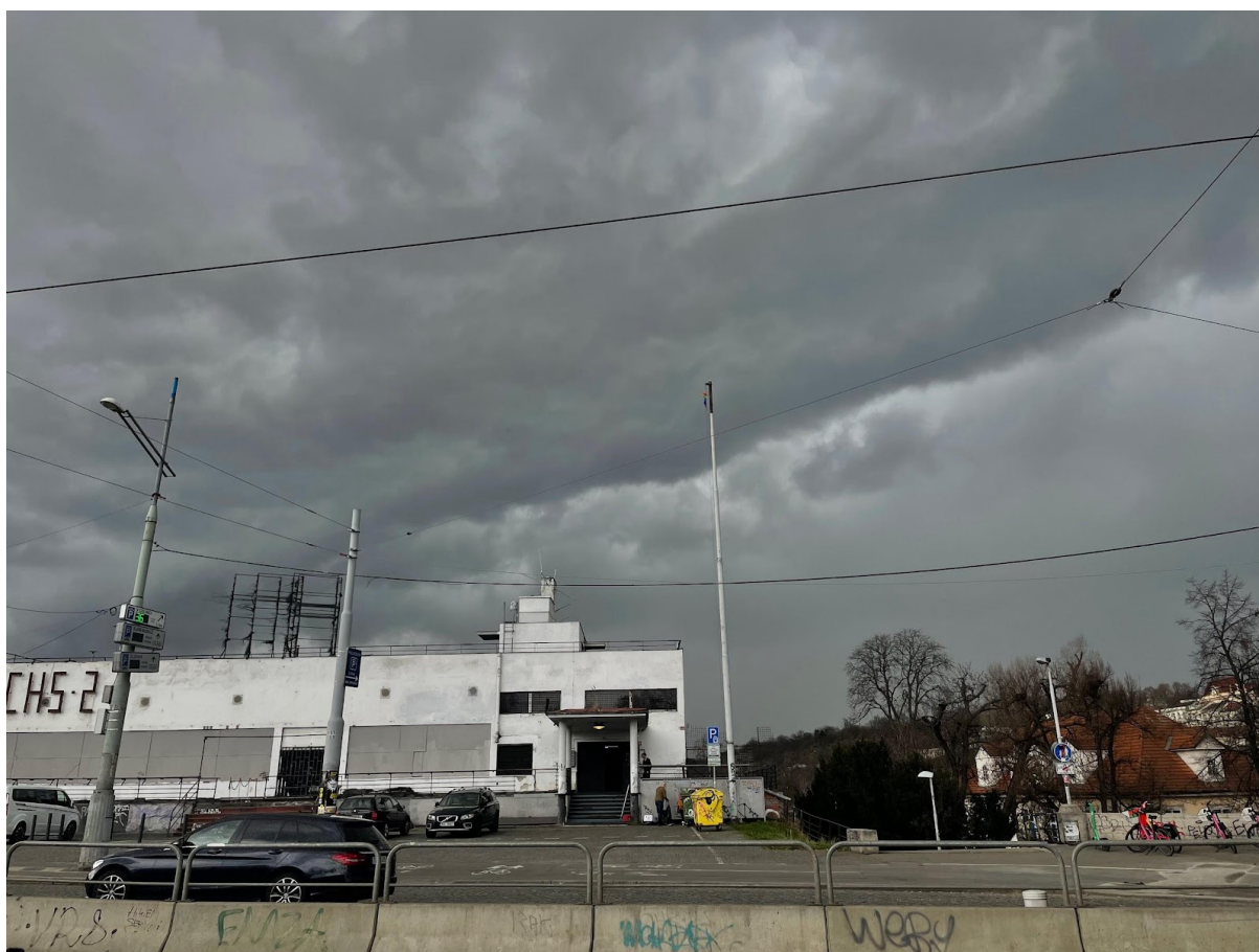
Obr. č. 17. Cesta po magistrále k Fuchs 2.

(rozhovor so zakladateľom klubu, Janom Faltysom Fuchs 2 dňa 28.2. 2023)