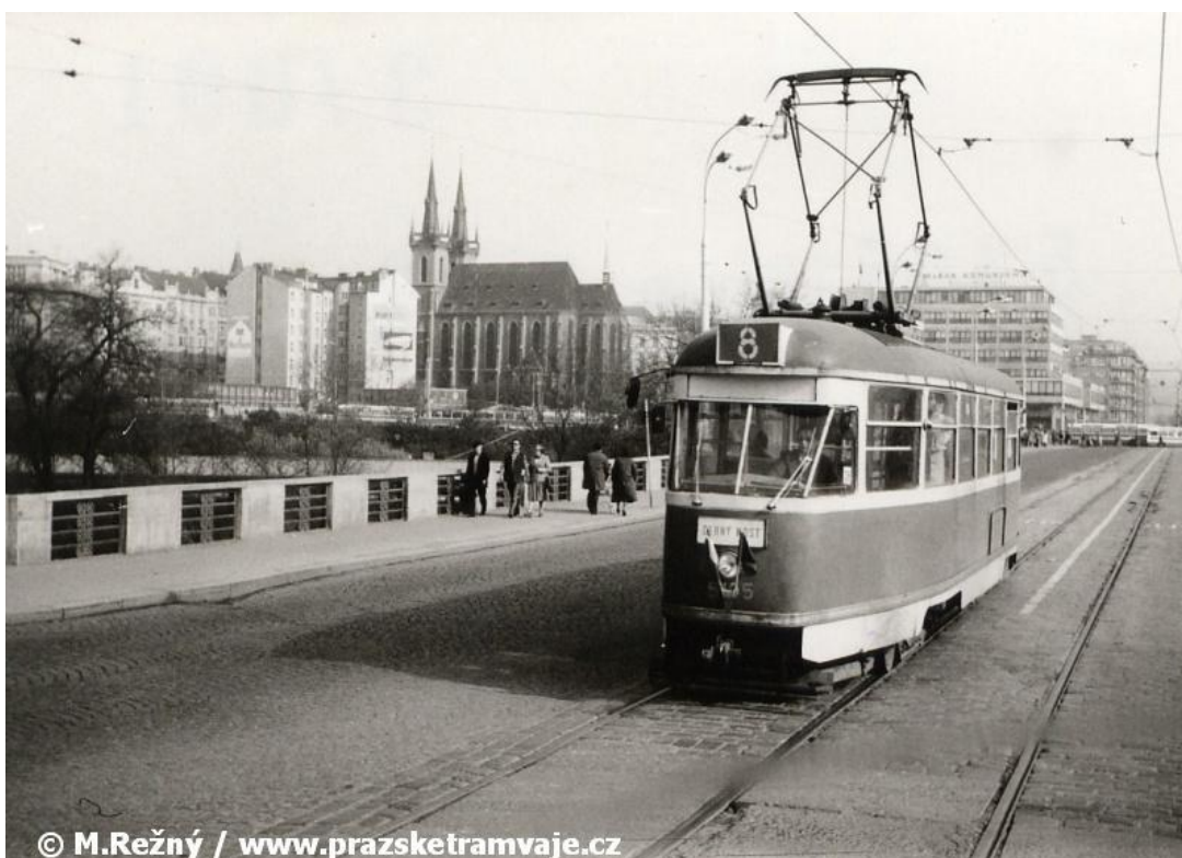
Obr. č. 7. Vůz T1 ev.č.5105 vypravený na linku 8 uhání po Hlávkově mostě na Štvanici. Zdroj: M. Režný 1.5.1980

Ďalšou 7 neodmysliteľnou časťou je trať električky (vid'. obr. č. 7), ktorá spája ostrov s mestom. Tá sa dá datovať až do roku 1875, keď súvisela s prvou konskou električkou „koňkou“. V roku 1900 sa prestavala trať pre elektrický vlak, avšak do 18. decembra po trati ešte fungovala koňka. Pre zjednodušenie prechodu do Holešovic sa vybudovali provízorne mosty, ktoré dosiahli užívania v roku 1900. Prostredný most ústil na Štvanicu a mal dĺžku 172 metrov. Tretí provízorný most viedol skrz hlavné rameno rieky zo Štvanice do Bubien a mal dĺžku 196 metrov. Výstavba definitívnych mostov začala roku 1908 a 3. februára roku 1910 bola na Hlávkův most položená električková trať. V júli 1910 sa na štvanickej preložke zriadil prejazd a 18. októbra 1910 bola električková trať preložená do konečnej polohy na nový most skrz zasypané rameno Vltavy. Historicky prechádzala trať rôznymi zmenami kvôli stavbe a prestavbe Hlávkovho mostu a do svojej definitívnej polohy sa dostala 18. septembra 1961. V novembri 1980 sa zrušil úsek medzi Negrelliho viaduktom a Hlávkovým mostom. Jeho preložka viedla popri budúcej zastávky metra Vltavská. Následne sa spustil vrchol križovatky Vltavská, ktorý viedol na Hlávkův most. Prekladanie trate bolo výsledkom budovania automobilovej magistrály.