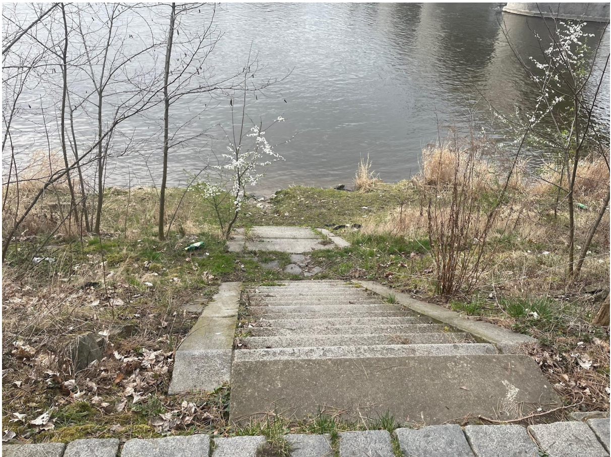
Obr. č. 25. Schody k vode.

V tejto strednej časti sa už začínajú popri cestičke ukazovať aj spomínané schody dole k vode (vid'. obr. č. 25) a pozornosť sa uberá skôr na aspekt prírody, ktorá ostrov tvorí. Pri mojom výskume som si všimla množstvo áut, ktoré na túto časť prichádzajú kvôli klubu, zväzu či