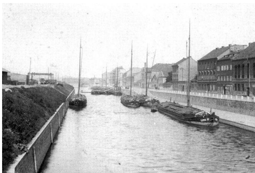
Obr. č. 2. Rohanský ostrov a Karlínský přístav.