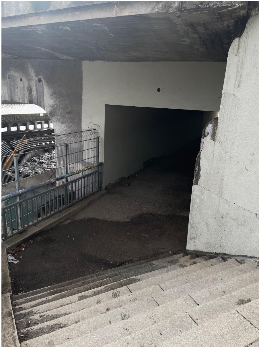
Obr. č. 11. Podchod pod mostom.

Dnes nebudem prechádzať popod Hlávkov most, ako to robievam skoro stále, ale prechádzam popod podchod popri hati, pod ktorým som už raz šla. Taký neporiadok aký tam bol predtým tam teraz už nie je. Vyjdem vonku spod podchodu a zasvieti na mňa slnko. Je naozaj príjemne.