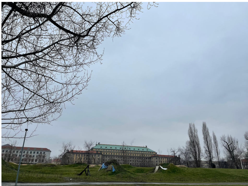
Obr. č. 19. Pohľad na bikepark.

Mimo budovy ako takej sa za jej súčasť považuje aj priestor pred Bike Jesusom a bikepark (viď. obr. č. 19), ktorý sa pred ňou rozprestiera. Je to spleť cyklistických prírodných (aj neprírodných) rámp. V čase výskumu sú tieto rampy zarastené a nevyužívané, až kým nepríde teplejšie počasie. Rampy zývali prázdnotou, a keď boli využívané, tak na nich boli hlavne deti alebo mládež, ktorá sa tam schádzala. Rampy slúžia počas akcií aj ako miesto na sedenie. Priestor je teda využívaný viac deťmi ako dospelými. Bikepark je zároveň priestorom rôznych akcií, hlavne v lete a teplom počasí.