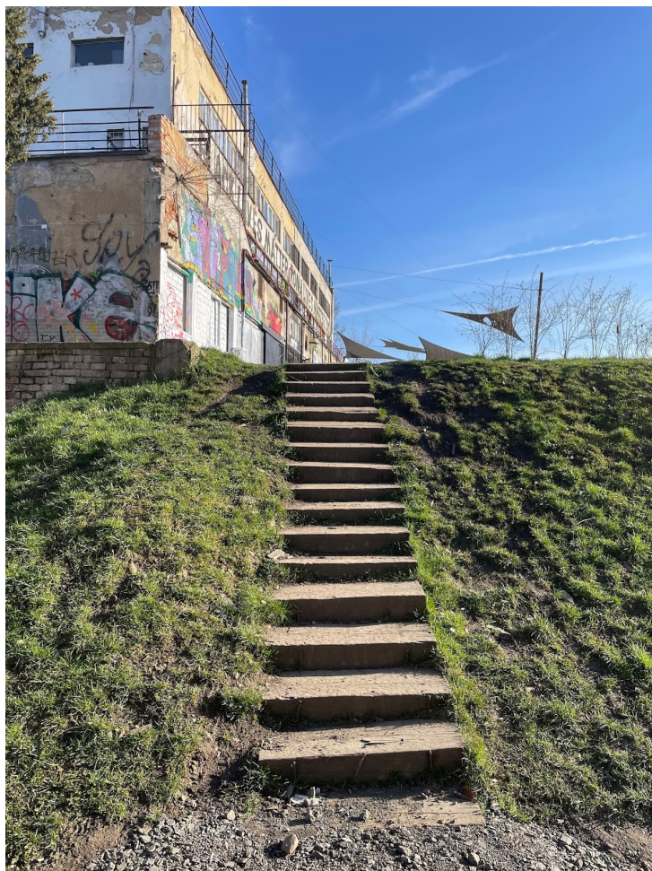
Obr. č. 21. Schody od Fuchsu 2 k Vile Štvanice.

Priestor hrá akési opozitum voči Fuchsu 2. Budovy sú rozdelené fyzicky. Fuchs 2 sa týči nad Vilou a cesta k nej vedie skrz strmé schody (viď. obr. č. 21), trávnu alebo cestičku popri Bikeparku. V poznámkach preto popisujem cestu dole k Vile a hore pri Fuchse 2.