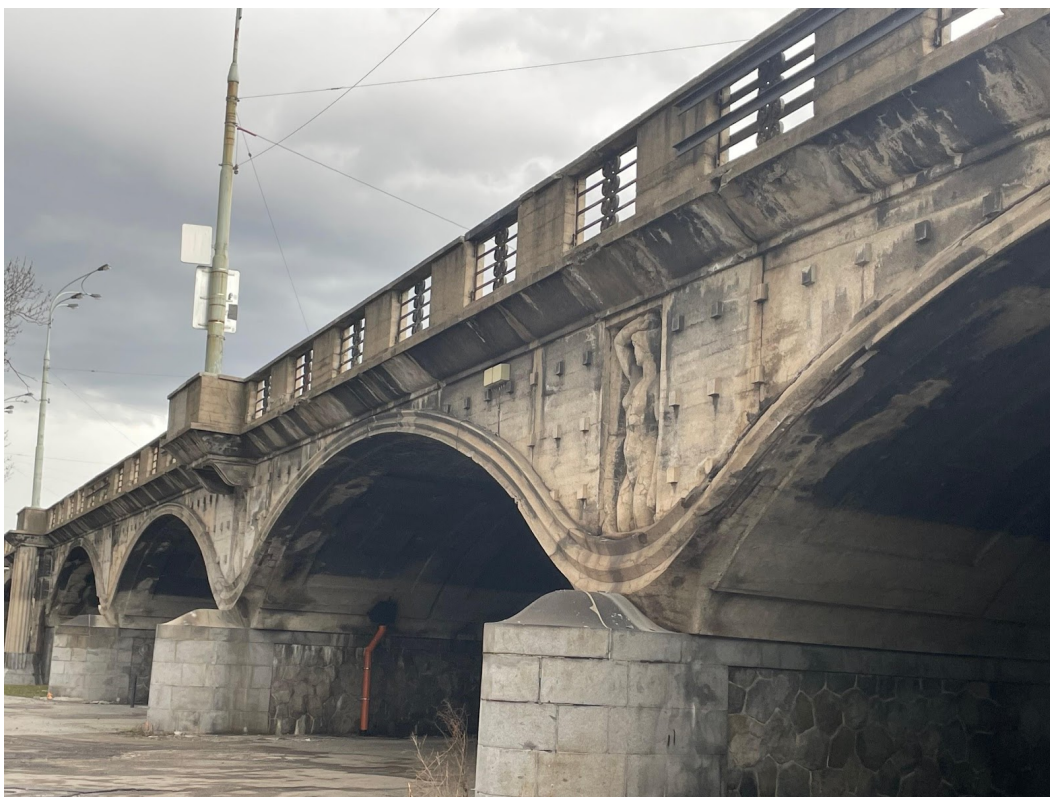
Obr. č. 14. Hlávkov most.

Ďalšia vec, ktorá mi zachytí pohľad je, že na tejto strane budovy sú 4 klenby Hlávkovho mostu, a pod druhou - od strany Vltavy - sa nachádza auto a sedí tam nejaký človek. Po menšej kontemplácii či tam ísť alebo neísť sa rozhodnem nepribližovať. Leží tam nejaký človek na zemi, nie som si istá či je to bezdomovec, alebo či ten človek iba oddychuje, každopádne sa rozhodujem ísť iným smerom.