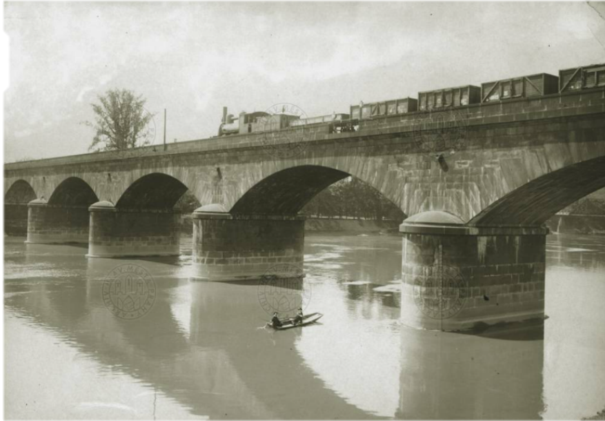
Obr. č. 5. Pohľad na časť Negrelliho viadukt medzi Holešovcami a ostrovom Štvanice.