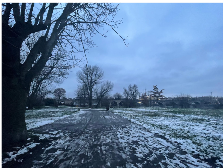
Obr. č. 12. Zadná strana.

(rozhovor s Johnom Smithom dňa 23.1. 2023)