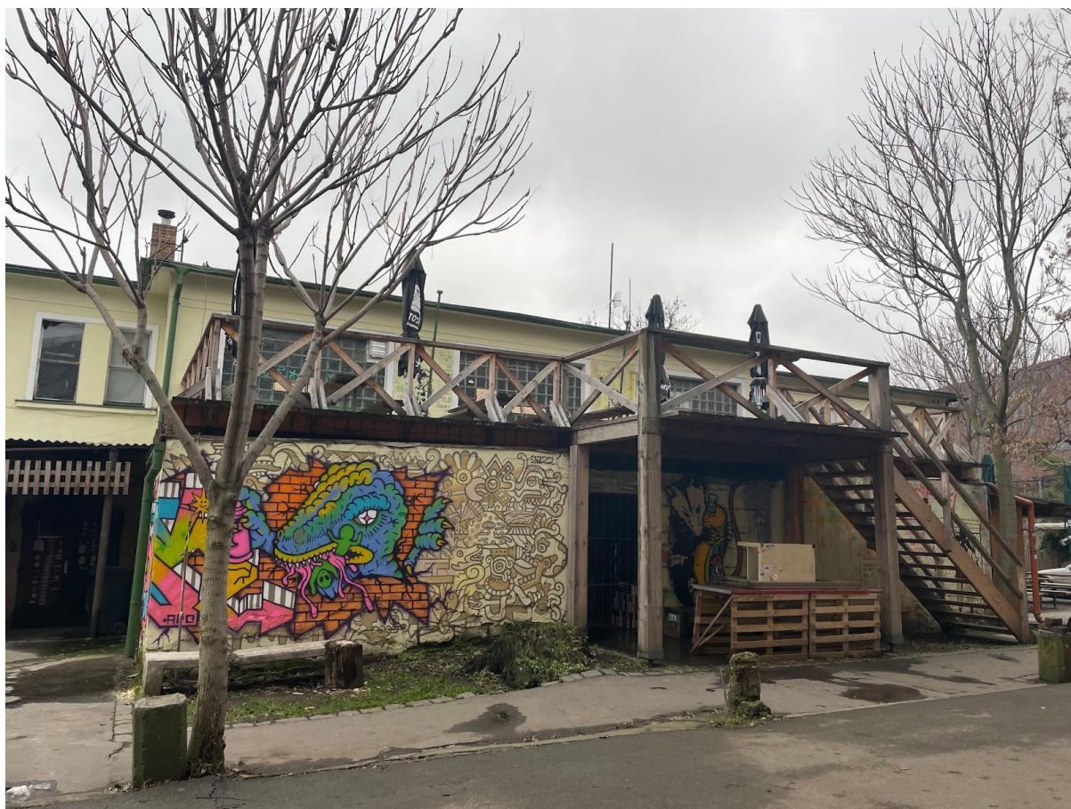
Obr. č. 26. Hospôdka za skateparkom.

Zadná, posledná časť ostrova, môže byť popísaná aj ako jeden veľký park. So strednou časťou ju rozdeľuje Negrelliho viadukt. Táto časť sa dá rozdeliť ešte pozdĺžne. Na ľavej strane dĺžky sa nachádza spomínaný parčík, v ktorom sú počas môjho výskumu dve ohniská, lavičky a stoly. Lavičky sa nachádzajú aj na cestičke, ktorá vedie medzi parčíkom a skateparkom. Skatepark je zariadenie na strane pravej. Je to súbor rámp, ktoré sa nachádzajú pod strieškou. Za rampami sa nachádza menšia budova, ktorá patrí magistrátu mesta, ale nachádza sa v nej hospôdka (viď. obr. č. 26). Budova je takisto popísaná graffiti. Je síce menšia, ale má terasu. Po rozhovore s jedným skateboardistom som zistila, že súčasťou skateparku je aj bazén (viď. obr. č. 27), ktorý sa nachádza v drevenej stavbe hneď vedľa neho.