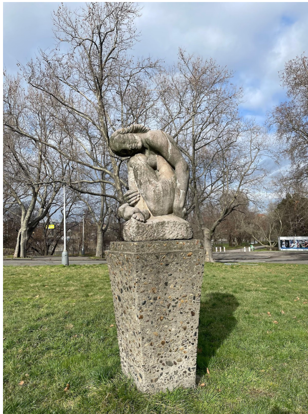
Obr. č. 23. Socha plačúceho dievčaťa.