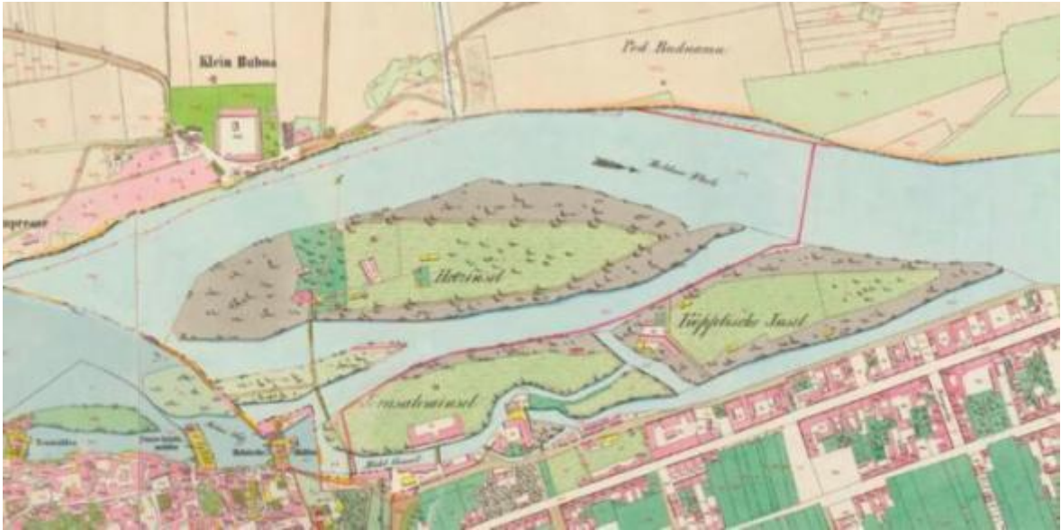
Obr. č. 3. Jeruzalemský ostrov.