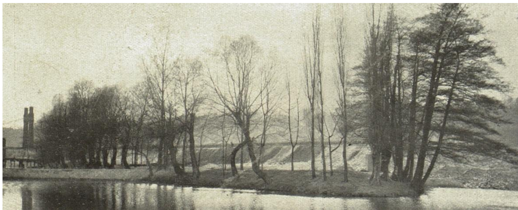
Obr. č. 1. Primátorský ostrov.